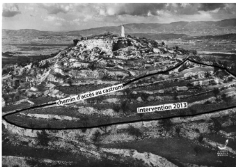
Fig. 117 – LE-PUY-SAINTE-RÉPARADE, la Quille. Carte postale de « La Pie service aérien », vers 1965, avec indication du contour de la parcelle 772 du cadastre napoléonien et situation de l'intervention 2013.

En contrebas de l'oppidum/castrum, sur le versant méridional, l'effondrement de 70 m linéaires de murs de soutènement contemporains et le projet de reconstruction qui en a découlé ont été l'opportunité d'une approche archéologique, inédite sur le site.