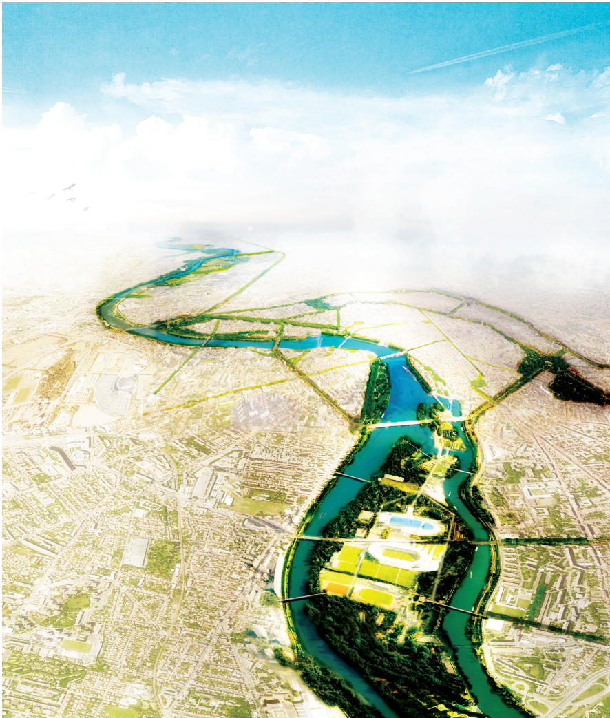
FIGURE 5 – Le Grand Parc Garonne et son marketing : un espace de nature et de liens au sein de la ville