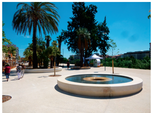
FIGURE 2 – La rive gauche réaménagée : un espace public requalifié via l'aménagement paysager

En rive gauche de la Têt, les berges hautes viennent d'être réaménagées (inauguration à l'été 2018) afin de créer un espace public agréable à fréquenter et ouvert sur le fleuve et son paysage, le passaig .