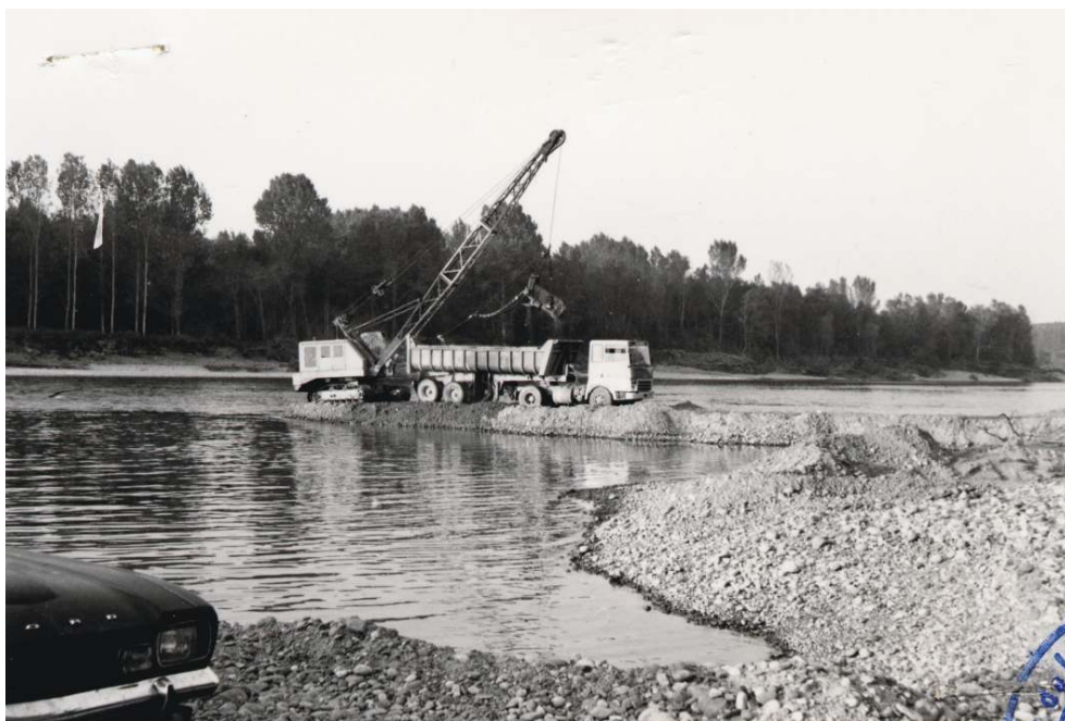
Figure 7. L'extraction de granulats en lit mineur

grandement dès la fin du XIX ème siècle. Après la Seconde Guerre mondiale, les besoins grandissants en matériaux voient de nombreuses exploitations s'implanter directement dans le lit du fleuve (Steiger et al. , 2000). Les sites d'extraction étaient localisés sur les berges de la Garonne de façon plus ou moins continue entre Toulouse et la confluence du Tarn (figure 7). On retrouve encore aujourd'hui les traces de cette activité (lieux de stockage, gravières réhabilitées, fosses d'extraction, trous d'eau, ...) parfois non loin ou au cœur même des dispositifs de préservation de la faune et de la flore. Depuis l'interdiction de prélever des granulats en lit mineur, dans les années 1990, cette activité s'est déplacée vers le lit majeur. Cependant, l'activité extractive n'est pas l'unique responsable de cette incision de la Garonne. Après la Seconde Guerre mondiale, la construction de barrages hydroélectriques sur la Garonne en amont de Toulouse a considérablement réduit l'alimentation du fleuve en matériaux mobilisables (galets) issus de la montagne, s'ajoutant aux travaux de reboisement du service de Restauration des Terrains en Montagne visant à fixer les sols. De la même manière, la stabilisation des berges, à l'origine de la réduction de la largeur de la bande active est également à l'origine de la réduction des apports latéraux dus aux divagations de la Garonne. Dès lors, privé de ses apports en matériaux, le fleuve creuse son lit et s'incise profondément.