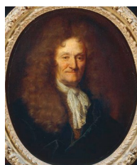
Nicolas de Largillière, Portrait de La Fontaine , 1690

Il gravit progressivement les échelons de la hiérarchie de l'Académie, dont il devint le directeur à l'âge de 80 ans.