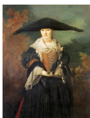
Nicolas de Largillière, La Belle Strasbourgeoise , 1703