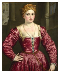
Paris Bordone, Portrait de femme , date ?

Ou encore, à propos du portrait d'une Femme par Paris Bordone (Planche 96C) : « Le choix de la robe de velours aux plis nombreux permet au peintre de les suivre grâce à une lumière changeante. » ( Ibidem )