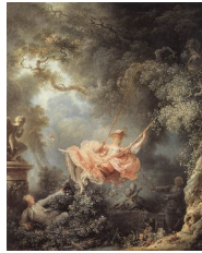
Fragonard, L'escarpolette , 1767

Mais il délaissa de plus en plus les commandes officielles et déçut les habitués du Salon. De fait, il renonça à sa carrière académique au profit d'une carrière de peintre léger et mondain, bien introduit auprès d'une clientèle surtout bourgeoise.