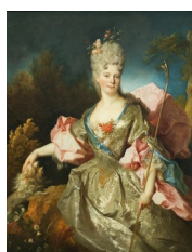
Nicolas de Largillière, Portrait de femme (identité ?), date ?

Une fois investi de cette reconnaissance institutionnelle, il alterna les commandes officielles d' ex-voto ou de tableaux allégoriques, avec de très nombreux portraits de la noblesse et surtout de la haute-bourgeoisie.