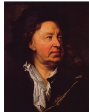
Hyacinthe Rigaud, Portrait d'Everhard Jabach (banquier, célèbre collectionneur d'art), 1688