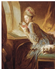
Fragonard, La lettre d'amour , 1770

Il ne dédaignait pas de peindre pour ses clients des dessus de porte, des dessus ou des devants de cheminées. Il vivait grassement de ses commandes et se complaisait « à cette existence quelque peu marginale de peintre libre ». A sa manière, il préfigura le peintre non académique du XIX e siècle. D'ailleurs, il prit une part active à la réforme du système des arts qu'introduisit la Révolution française, même s'il finit en disgrâce.