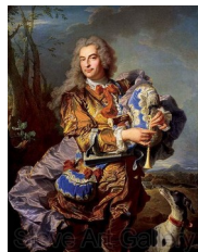
Hyacinthe Rigaud, Portrait de Gaspard de Gueidan en joueur de musette, 1738

Fragonard (1732-1806) : une carrière libre hors de l'Académie (d'après Cabanes, 1987)