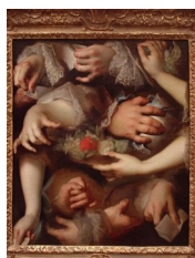
Nicolas de Largillière, Étude de mains , vers 1714

Peintre très réputé à son époque, sa mémoire fut occultée par celle de Hyacinthe Rigaud qui, lui, accéda à la représentation des plus hautes personnalités de la noblesse. Largillière fut le protecteur du jeune Chardin.