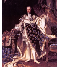
Hyacinthe Rigaud, Portrait de Louis XV en costume de couronnement , 1730

peintre du roi. Non seulement il peignit la plupart des hauts dignitaires de la cour, mais surtout il fit réaliser par son atelier quantité de copies de ces portraits, augmentant ainsi considérablement ses bénéfices, ainsi que les prix qu'il pratiquait. Grâce à ses livres de comptes, on connaît avec précision l'activité de son atelier. Mais nous en reparlerons une prochaine fois.