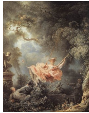
Fragonard, L'escarpolette , 1767

Mais il délaissa de plus en plus les commandes officielles et déçut les habitués du Salon. De fait, il renonça à sa carrière académique au profit d'une carrière de peintre léger et mondain, bien introduit auprès d'une clientèle surtout bourgeoise.