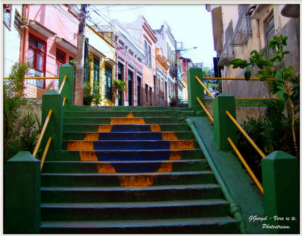
Figure 3 : Escalier d'accès au Morro da Conceição 15