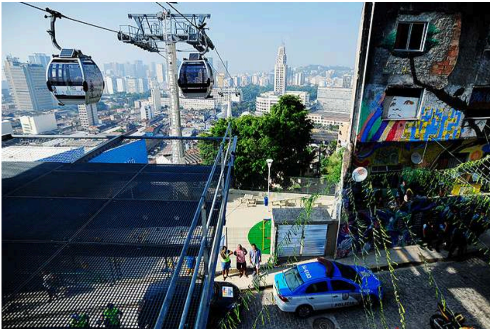
Figure 4 : Construction du téléphérique au sommet de la favela de Providencia à la place d'habitations 18

renvoie à une sorte d'esthétisation de la misère (Jeudy, 2003). Situation qui sera accentuée avec la mise en fonctionnement en 2014 d'un téléphérique (cf. figure 4) la reliant à la gare Estação Central do Brasil. La construction de ce téléphérique sera l'occasion de nombreux débats et critiques quant aux conséquences de la touristification des favelas pour les habitants des favelas. Les favelas de Chapéu Mangueira et Babilonia situées aux limites de la zone principale de « Rio Patrimoine Mondial de l'Humanité » ont subi des travaux d'envergure visant à restructurer les espaces publics dans le cadre du programme « Morar carioca verde » 17 et à accueillir une offre d'hébergements touristiques et entraînant le déplacement de plusieurs familles.