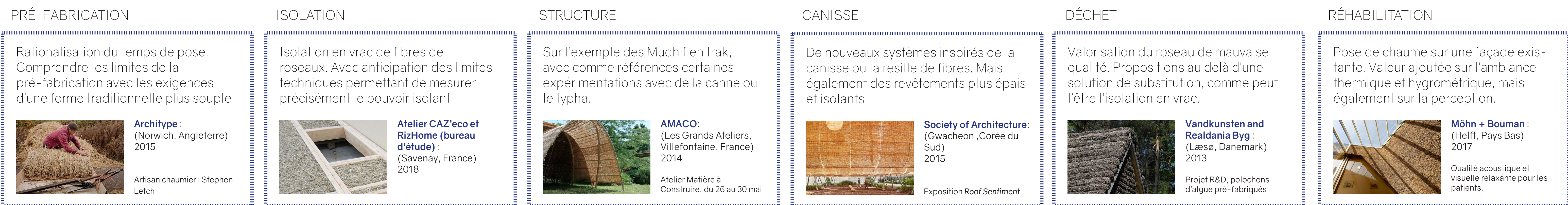
Pistes d'expérimentations avec les étudiants