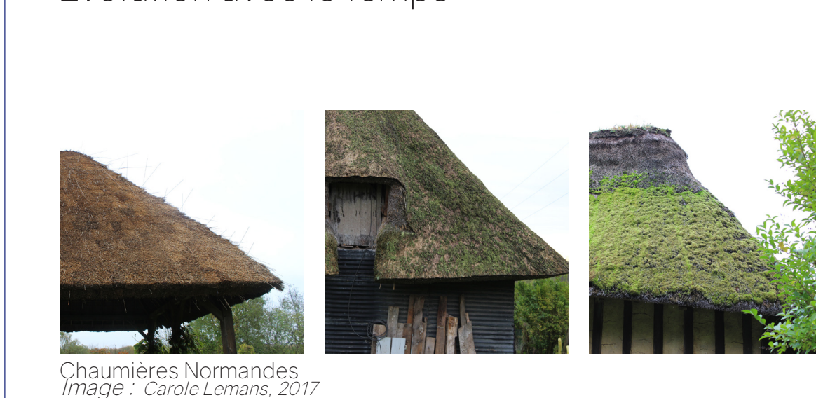
Évolution avec le temps