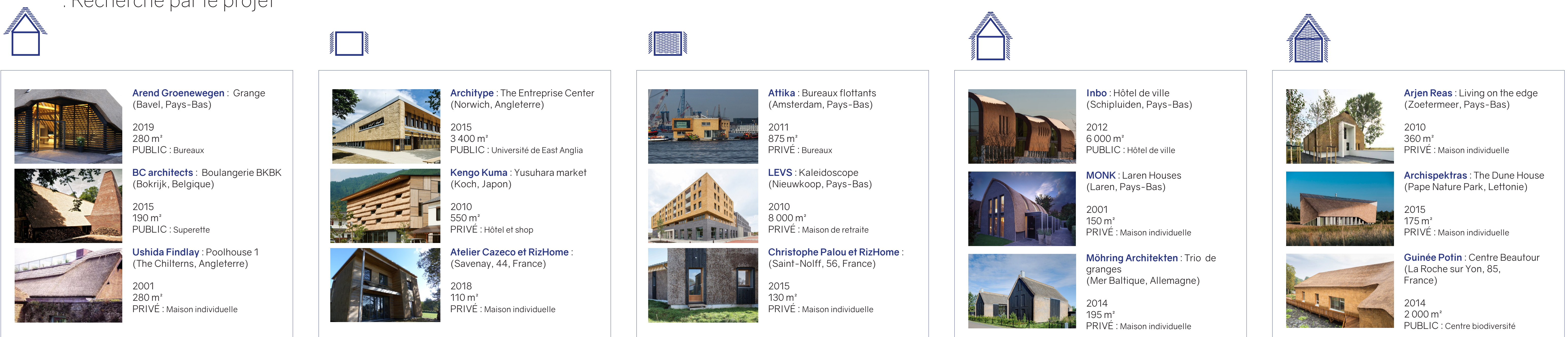
Extrait du corpus de réalisations