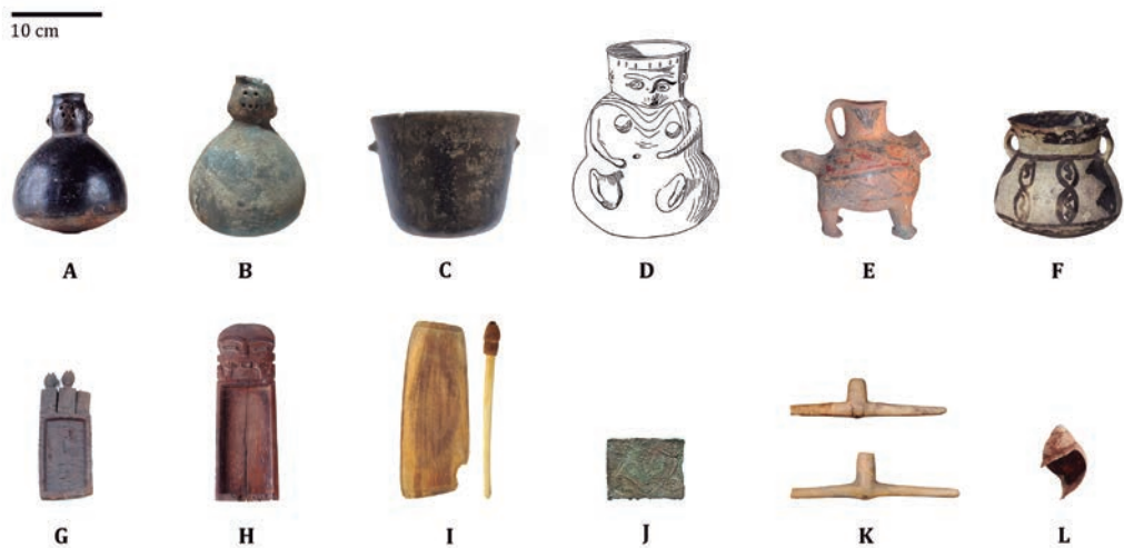
Figura 3: Algunos ejemplos de piezas arqueológicas ofrendadas en contextos funerarios costeros que tienen un origen foráneo. Destacan vasijas cerámicas modeladas como las de los cementerios formativos de El Vertedero Municipal de Antofagasta (A-B) (Carrasco et al. 2015) y de El Vaso Figurado de la Puntilla Sur de Taltal (D) (Mostny 1964), así como algunas de época posterior como Caleta Huelén 12 en la desembocadura del río Loa (E) (Núñez 1987). Otras vasijas cerámicas son también foráneas al litoral, como la pieza ofrendada al cementerio formativo de Las Loberas 01 de Mejillones (C) (Ballester y Clarot 2014) o aquella decorada tipo Taltape del cementerio PIT de Caleta Huelén 12 (F) (Núñez 1987). En ciertos períodos de la secuencia costera se vuelven más comunes tabletas de madera para inhalar sustancias, como aquella decorada con tres personajes antropomorfos del cementerio formativo de El Vertedero Municipal de Antofagasta (G) (Carrasco et al. 2015), una con un modelado facial provenientes de uno de los cementerios formativos de Punta Blanca en Tocopilla (H) (Ballester y Clarot 2014) y una tableta plana sin decorado recuperada por Jean Christian Spahni del cementerio formativo de Caleta Huelén 20 (I) (Cabello 2007). Placa metálica decorada (J) presentada en Salazar y colaboradores (2010: Fig. 3) que parece ser la misma que fotografía Augusto Capdeville (s/f:L44) proveniente el cementerio PIT de Caleta Bandurrias. Finalmente dos de las pipas de piedra tipo T invertida (K) y una valva de Strophocheilus sp. (L) utilizado como contenedor de pigmento rojo recuperadas del cementerio formativo de El Vertedero Municipal de Antofagasta (Carrasco et al. 2015).

El valor de estos objetos cambiados es relacional. No es inherente a su materia, composición y forma, tampoco a su función original o la cantidad de trabajo invertido en su manufactura. En cuanto objeto cambiado éste deviene signo, y su corporalidad se convierte en significativa para referirse a ese otro, a su origen exótico y a la existencia de un vínculo entablado en el pasado que se perpetúa gracias a la permanencia del objeto. Si sus muertos al fallecer y ser enterrados no dejan de ser miembros activos del colectivo, estos objetos al ser ofrendados en el ámbito funerario eternizan además su permanencia en el grupo, y con esto perpetúan su singular valor. Entendido así, el valor de estos objetos radica en su relación y posición frente a una estructura mayor junto a quienes lo sueñan, producen, utilizan, circulan, donan, mueven, piensan y consumen.