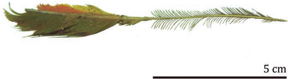
Figura 2: Pluma de colores verde, rojo y amarillo que se encontraba dentro de un envoltorio textil ofrendado a la tumba colonial de Juan López.

de Taltal (Mostny 1964). Durante el período Formativo, entre los 2500 y 1200 Cal AP, el volumen de bienes foráneos es notoriamente mayor, y junto al kit de contenedores cerámicos característicos del período, destacan también cestos de fibras vegetales, tejidos, gorros, turbantes, pipas, tabletas, valvas de moluscos dulceacuícolas ( Strophocheilus sp. ), adornos de oro y cobre, artefactos manufacturados sobre animales exógenos y vegetales cultivados (Figura 3) (Ballester y Clarot 2014; Capdeville 1928; Carrasco et al. 2015, 2017; Gallardo et al. 2017a, 2017b; Labarca et al. 2015; Mostny 1964; Núñez, L. 1974, 1984; Spahni 1967). Posterior al 1000 Cal AP y hasta la época de con-