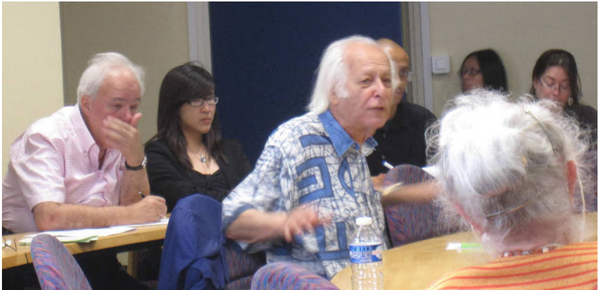
Au centre : Samir Amin. On y voit Boutros Labaki derrière Samir Amin.