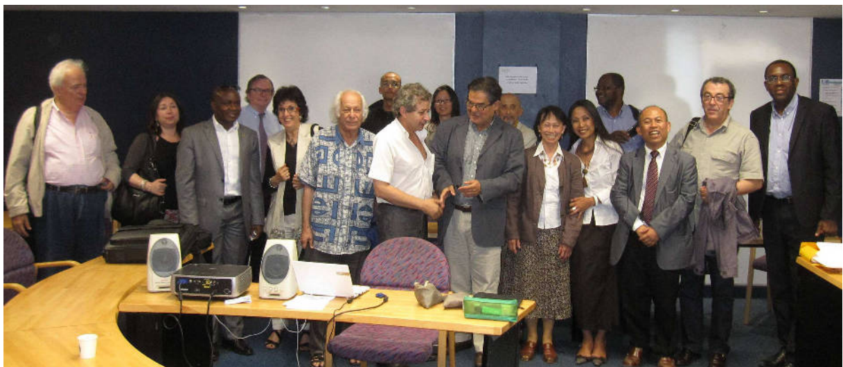
Photo de famille. On y voit aussi des participants non intervenants.