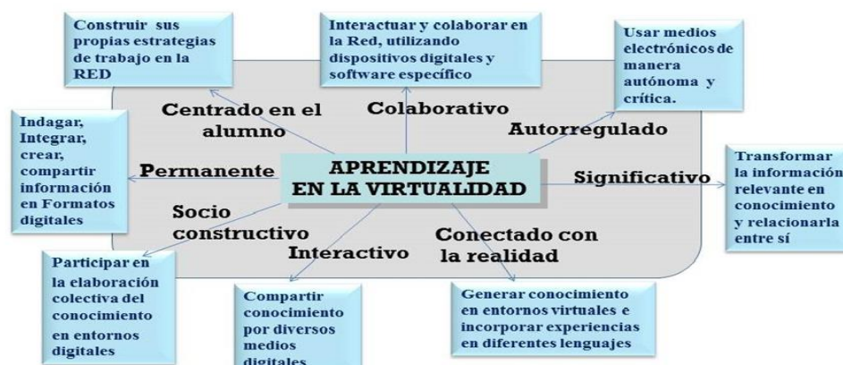
Figura 2. El aprendizaje en la virtualidad y las competencias mediales