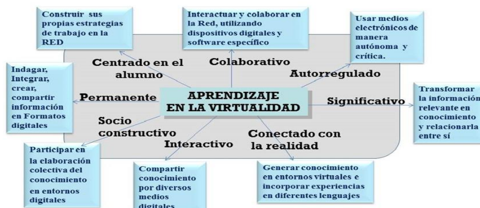
Figura 2. El aprendizaje en la virtualidad y las competencias mediales