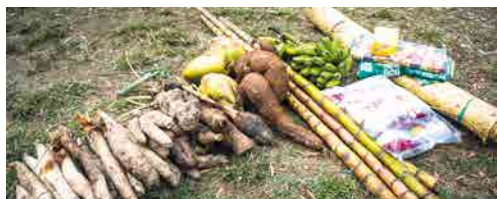
Présents offerts pour un geste coutumier traditionnel, tribu de Gohapin, Nouvelle-Calédonie – © IAC/N. Petit.

En Océanie, le principal mode de gestion partagé qui est efficient s'appuie non pas sur un principe de compromis mais de consensus. Le temps des négociations est parfois long, mais il est nécessaire pour parvenir à des décisions et des choix suffisamment durables et compris par tous. Dans ce cadre, des méthodes participatives adaptées au contexte océanien permettent de tendre vers une acceptabilité et une intégration optimale des acteurs concernés.