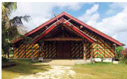
Le nakamal du Malvatumauri, Conseil national des chefs à Port Vila, Vanuatu – © J.-M. Fotsing / UNIC.

Les autorités coutumières sont fréquemment au cœur des politiques de gestion, en particulier pour les aires protégées terrestres côtières, implantées sur des espaces fonciers coutumiers. Selon les cas et les capacités locales, qu'ils soient inspirés des modes de gestion traditionnels ou non, les systèmes de gestion restent