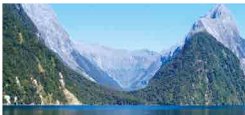
Le parc national du Fiordland, sur l'île du Sud, est le plus grand des 14 parcs nationaux de Nouvelle-Zélande, avec une superficie de 12 500 km 2 – © Lincks/E. Bonnet-Vidal.

empiriques et plus ou moins fondés sur des bases scientifiques. Ces systèmes ne répondent pas toujours aux menaces grandissantes et leur efficacité dépend fortement des organisations sociales et coutumières en rapport avec eux et des pressions démographiques.