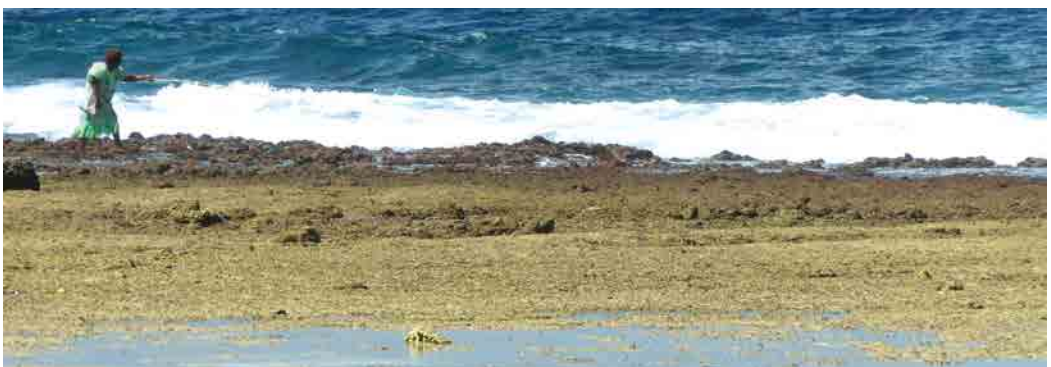
Femme pêchant à la ligne depuis le rivage, côte est de l'île d'Efate, Vanuatu – © IRD/C. Sabinot.

Lorsqu'il s'agit de planifier des aires protégées sur des zones de biodiversité utiles à la pharmacopée traditionnelle ou sur des zones de pêches côtières, les femmes forment souvent des groupes clés prêts à partager leurs savoirs. Leur pratique au quotidien des territoires de pêche ou de cueillette, leurs connaissances naturalistes et leurs savoir-faire doivent contribuer aux modes de gestion collective des milieux.