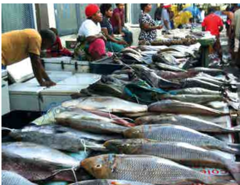
Marché aux poissons, Suva, Fidji – © IRD/H. Jourdan.