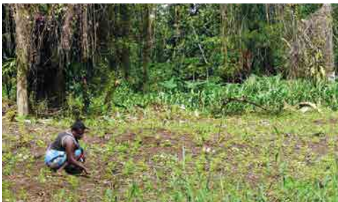
Champs de culture traditionnels, île Espiritu Santo, Vanuatu – © IRD/H. Jourdan.

D'un point de vue sanitaire, préserver la biodiversité c'est également permettre la pérennité d'une alimentation saine très affectée par l'introduction massive de produits alimentaires manufacturés gras et sucrés entraînant une explosion de maladies non transmissibles, comme en témoignent les taux d'obésité et de diabète extrêmement préoccupants en Océanie. En outre, la persistance des médecines traditionnelles, en grande partie fondées sur les pharmacopées mobilisées au quotidien, est indissociable de la préservation de la biodiversité et des savoirs qui s'y rattachent.