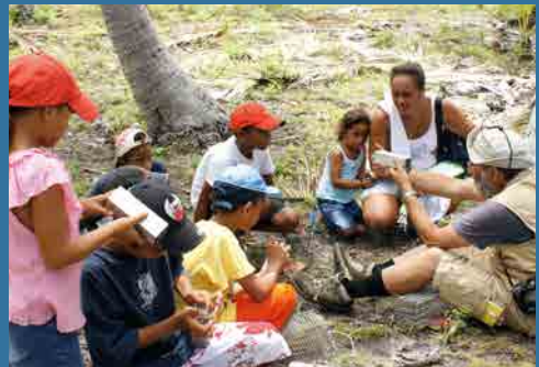
L'atoll de Niau fait partie de la biosphère de Fakarava, Tuamotu, Polynésie française. Les écoliers apprennent à poser des pièges pour attraper les rongeurs introduits – © IRD/E. Vidal.

démonstration scientifique et de gestion des espaces naturels concernés étaient mobilisables. Ainsi, la grande barrière de corail australienne, Papahānaumokuākea à Hawaii (États-Unis) et les récifs coralliens et écosystèmes associés en Nouvelle-Calédonie (France) sont inscrits sur la liste du Patrimoine mondial principalement pour leurs critères naturels. Pour autant, dans la mise en œuvre de leur gestion, une place de plus en plus grande est accordée aux dimensions culturelles des peuples autochtones concernés. D'autres sites marins patrimonialisés sous un label de l'Unesco ont d'ailleurs intégré en priorité les dimensions culturelles : la réserve de biosphère de Fakarava en Polynésie française, la portion marine du Domaine du chef Roi Mata à Vanuatu et, plus récemment, la portion marine et la passe sacrée du paysage culturel de Taputapuātea en Polynésie française.