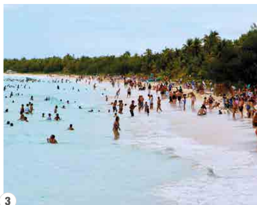
1. Paquebot géant, quai d'Uturoa sur l'île de Ra'iatea, Polynésie française – 2 et 3. Des milliers de touristes sur l'île d'Ouvéa en 2007, avant l'interdiction de ce type de croisière dans cette île de Nouvelle-Calédonie – © GIE Oceanide/J.-B. Herrenschildt.