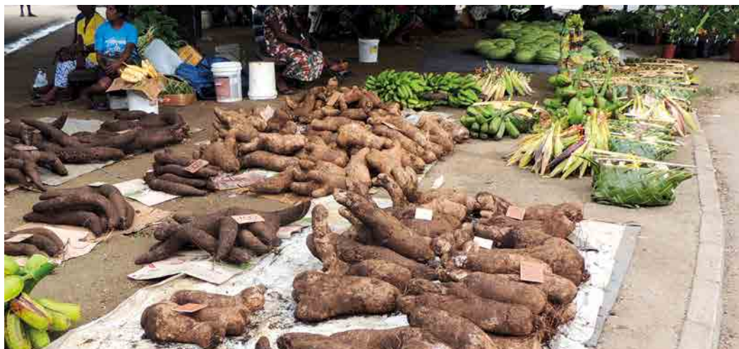
Marché, Efate, Vanuatu