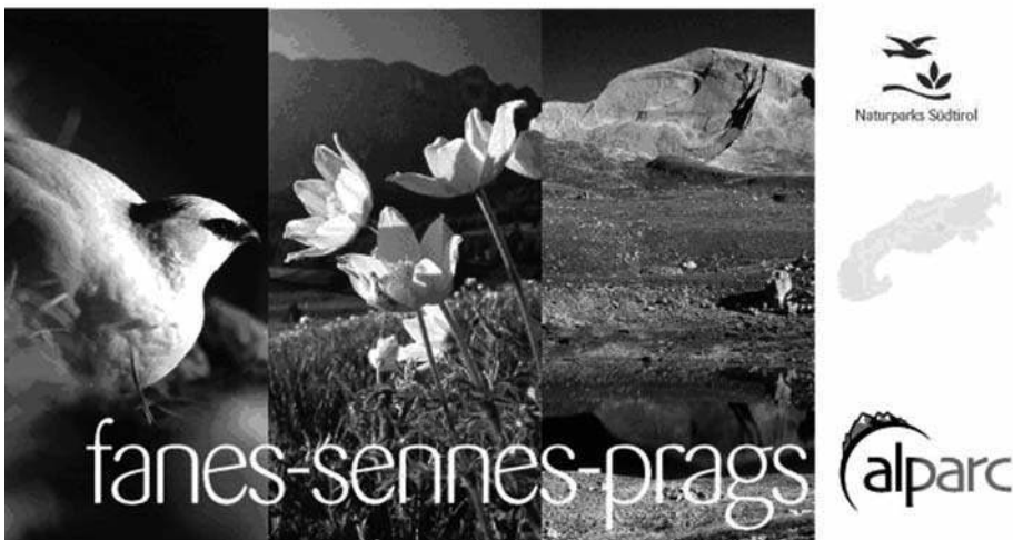
Figure 1 : Carte postale produite par Alparc, © Alparc 2008 Postcard produced by Alparc, © Alparc 2008

Remerciements : Je tiens à remercier Petra Arnuš pour sa collaboration dans l'enquête sur Alparc. Un remerciement va également à celles et ceux qui ont rempli les questionnaires et qui m'ont accordé du temps pour les entretiens. Merci aussi aux responsables d'Alliance dans les Alpes et Alparc pour avoir accepté ma présence dans leurs réunions, assemblées et manifestations et pour leurs précieuses informations. Merci in fine au Fonds national suisse de la recherche scientifique et à la Fondation Boninchi pour avoir financé ce projet.