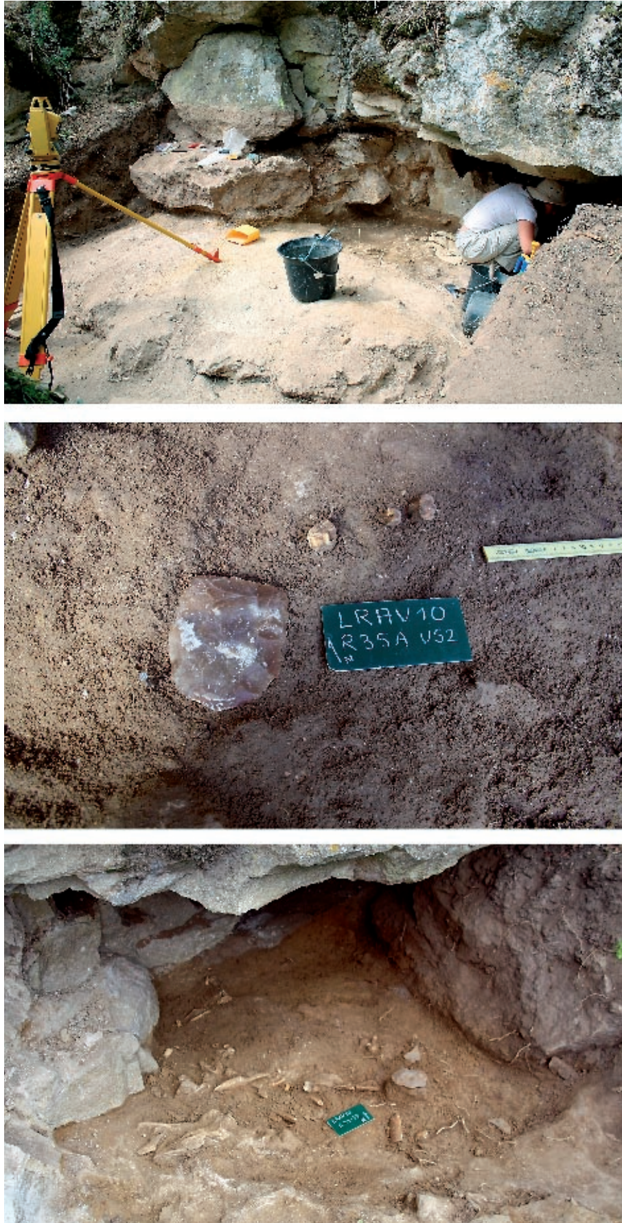
Figure 3 : les Roches d'Abilly Virage, éclat levallois en place et restes de faune conservés sous le toit effondré d'un abri rocheux dans le secteur est du site.