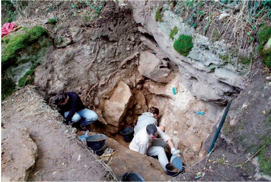
Figure 4 : les Roches d'Abilly Virage, sondage dans le remplissage d'un abri qui obstruait le départ d'une cavité.

osseux conservés dans deux niveaux de karstification de la falaise. Un des sondages effectués en 2010 a mis au jour le remplissage le plus épais actuellement connu sur le site. Il suggère l'existence d'un réseau karstique comprenant des cavités plus vastes que celles du niveau d'abri du sommet de la falaise comme l'abri Bordes-Fitte. Ces nouveaux indices laissent espérer la conservation de séquences très importantes et au sein desquelles les différentes phases d'occupation seraient plus clairement distinctes. La