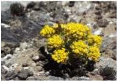
Photo 2 : Végétation du páramos alti andino , Pico Bolivar, 2007, Mérida, Venezuela