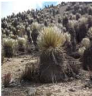
Auteur : Alexandra Angélaume-Descamps Alexandra Angélaume-Descamps