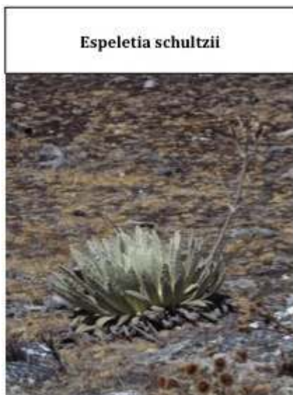
Photo 4 : 7 espèces de fralejons endémiques et de nombreuses autres espèces emblématiques