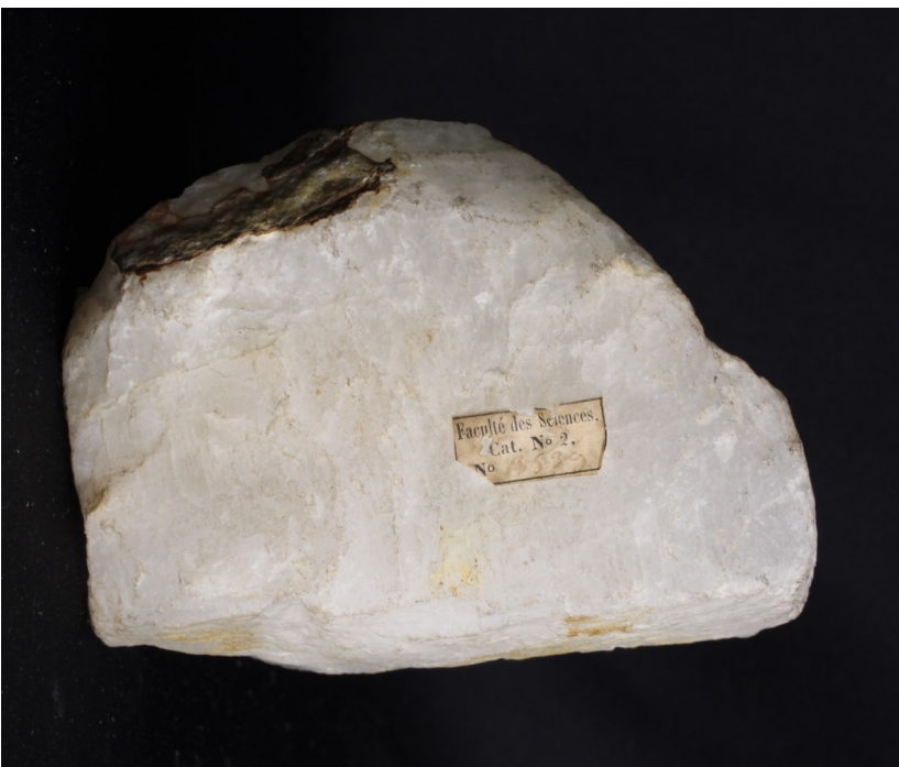
Fig. 9 : Cryolite, Ivigtut, Groenland. Dimensions : 13*8 cm. Noter le numéro du catalogue ancien de la Faculté des Sciences. Échantillon échangé en 1862. Collection Université de Montpellier.

de ce minerai ? Pour cela, il faut d'abord isoler son oxyde, l'alumine, de formule Al_2O_3 . La bauxite finement broyée est attaquée par une solution de soude. L'élément aluminium passe en solution sous forme d'ion complexe tandis que les hydroxydes de fer ne sont pas attaqués. Les deux solutions peuvent ainsi être séparées par filtration. Ensuite, la solution contenant les ions complexes est légèrement acidifiée : l'hydroxyde d'aluminium précipite. Il ne reste plus qu'à la filtrer puis à la calciner pour obtenir l'alumine en poudre. Or, ce dernier élément est un solide réfractaire qui fond à plus de 2000^{\circ}C . Il