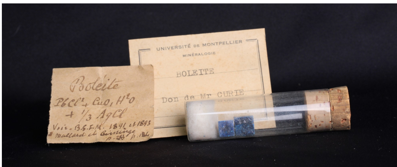
Fig. 1: Boleite, Boleo, Basse Californie, Mexique. Dimensions : 5 et 7 mm. Don Jacques Curie. Noter l'étiquette manuscrite faisant référence à la publication de la description. Collection Université de Montpellier

Commençons alors ! Cet échantillon était là, posé sur la table, un beau cristal bleu dans son tube de verre (Fig. 1). Il a, avec son ancienne étiquette, excité ma curiosité. S'en est suivi un patient travail de recherche dans mes archives... Puis est arrivé l'illumination. C'était bien un très bon échantillon de Boléo, avec une histoire particulièrement riche. La voici : elle commence au XIX e siècle lorsque des paysans récoltent, près du port de Santa Rosalia (Basse Californie, Mexique), des nodules bleus appelés « boleos » (« boules » en espagnol). Sans s'en douter, ils mettent la main sur un gisement de cuivre bien particulier. À la suite d'un contexte politique favorable à la fondation d'une entreprise française