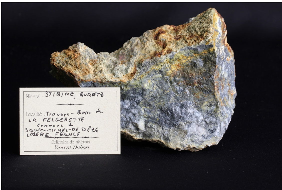
Fig. 5 : Stibine, Travers-banc de la Felgerette, Le Collet de Dèze, France. Dimensions : 10*8 cm. Échantillon récolté par Vincent Dubost en aout 2017. Don Vincent Dubost. Collection Université de Montpellier