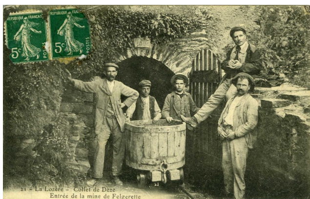
Fig. 6 : Travers-banc de la Felgerette, Le Collet de Dèze, Lozère, France. Carte postale ancienne. Circa 1900.