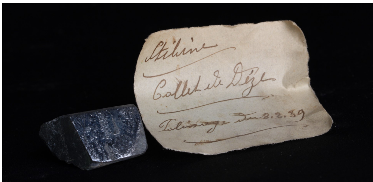
Fig. 4 : Stibine, section ploie, Le Collet de Dèze, France. Dimensions : 4*3 cm. Noter l'étiquette manuscrite indiquant la date de polissage. Collection Université de Montpellier

qui sont de précieux renseignements du point de vue de la géologie iii .