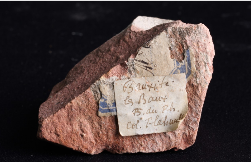
Fig. 8 : Bauxite, Les Baux de Provence, Bouches-du-Rhône, France. Dimensions : 4 * 3 cm. Collection Charles Flahault. Collection Université de Montpellier.

de ce minerai ? Pour cela, il faut d'abord isoler son oxyde, l'alumine, de formule Al_2O_3 . La bauxite finement broyée est attaquée par une solution de soude. L'élément aluminium passe en solution sous forme d'ion complexe tandis que les hydroxydes de fer ne sont pas attaqués. Les deux solutions peuvent ainsi être séparées par filtration. Ensuite, la solution contenant les ions complexes est légèrement acidifiée : l'hydroxyde d'aluminium précipite. Il ne reste plus qu'à la filtrer puis à la calciner pour obtenir l'alumine en poudre. Or, ce dernier élément est un solide réfractaire qui fond à plus de 2000^{\circ}C . Il