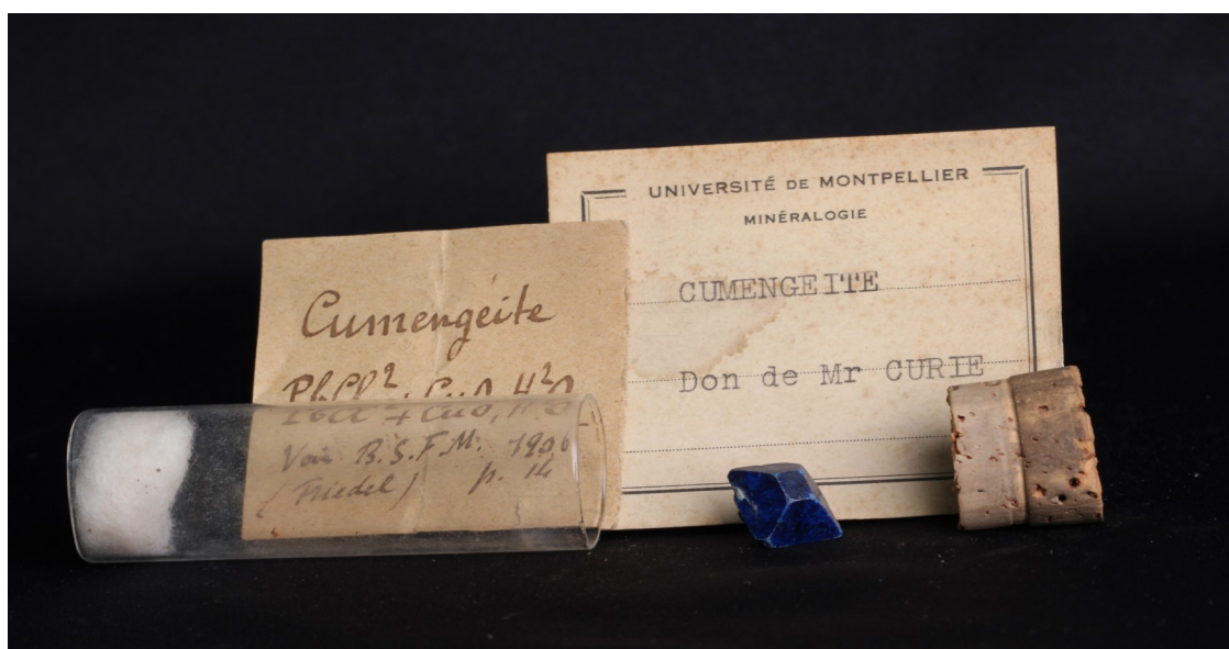
Fig. 2 : Cumengeite, Boleo, Basse Californie, Mexique. Dimension : 8 mm. Don Jacques Curie. Noter l'étiquette manuscrite faisant référence à la publication de la description. Collection Université de Montpellier

Cumenge décrit dans une autre note « une nouvelle espèce minérale cristallisée, comprenant [...] le cuivre, le plomb et le chlore comme éléments principaux, mais différente de la boléite sous le rapport de la composition chimique et de la forme cristalline, vient d'être découverte par moi dans la région exploitée par le puits qui porte mon nom dans la vallée de le Soledad. Cette espèce minérale se présente sous la forme de petits cristaux bleus parfaitement définis, disséminés dans une gangue d'argile blanche éruptive appelée jaboncillo dans le pays. [...]. Ces cristaux se distinguent nettement, par leur forme et leur couleur, [...] dans la masse de jaboncillo. Leur couleur bleue est plus violacée que celle de la boléite, leur translucidité est plus grande et leur éclat plus vif [...] La forme cristalline du nouveau minéral appartient, selon toute vraisemblance, au système orthorhombique tandis que la boléite appartient au système cubique » (Cumenge E., 1893)