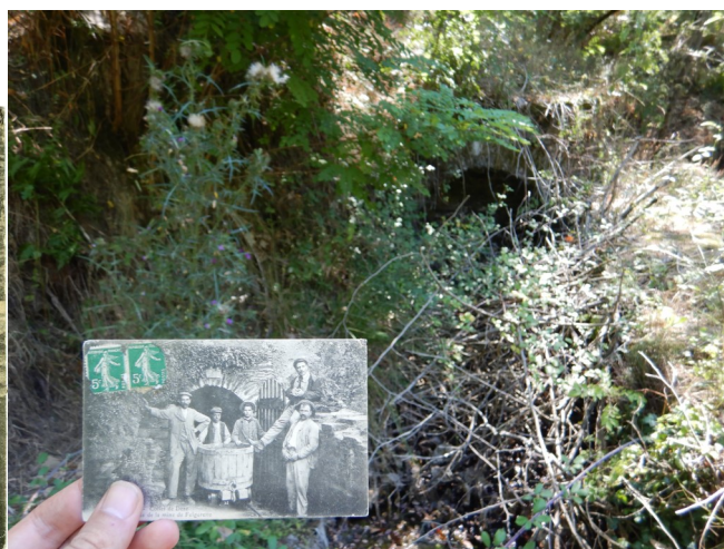
Fig. 7: Travers-banc de la Felgerette, Le Collet de Dèze, Lozère, France. Photographie en aout 2017 et carte postale ancienne circa 1900.