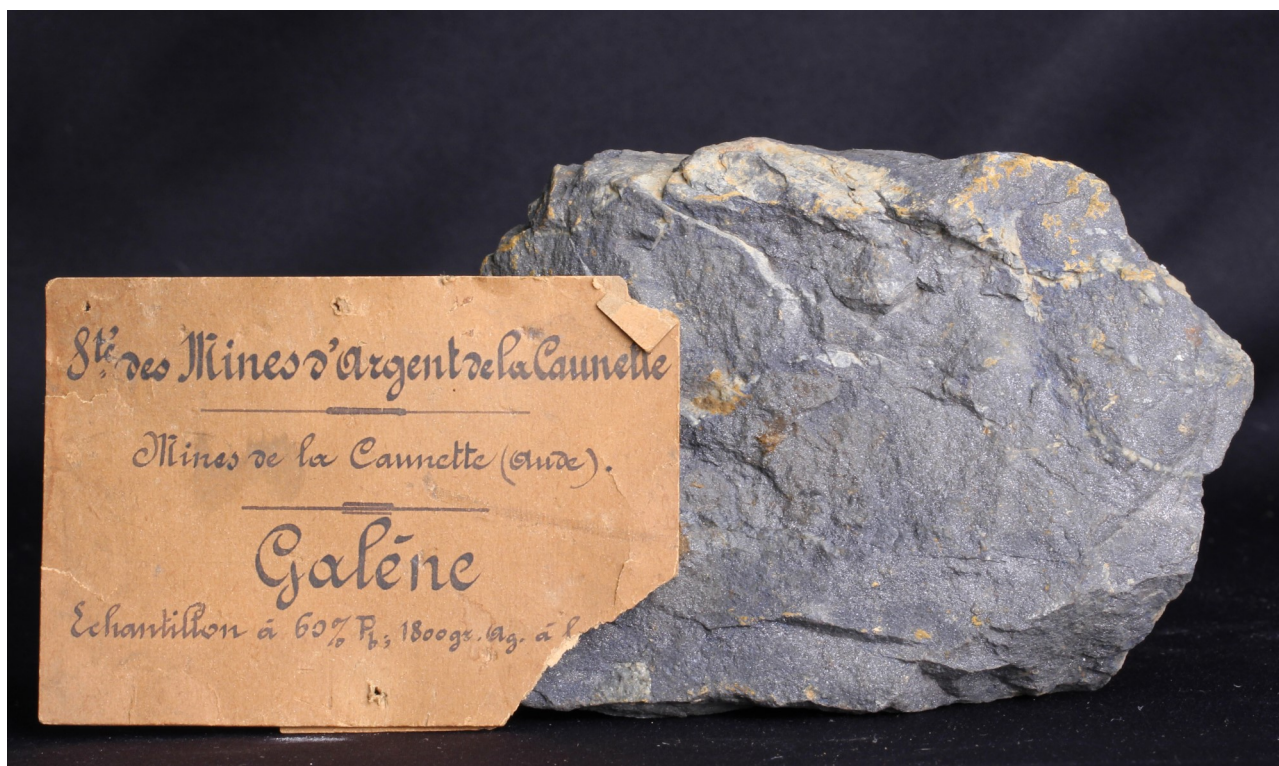
Fig. 3 : Galène, La Caunette, Aude, France. Dimensions : 13*8 cm. Noter l'étiquette indiquant « Société des mines de la Caunette » et la teneur en argent. Collection Université de Montpellier

Cette première rencontre avec un échantillon ayant une histoire aussi riche allait être un élément déclenchant. Combien d'autres échantillons historiques attendaient alors dans l'obscurité que l'on mette leur histoire en lumière. J'ai commencé à collectionner les minéraux à l'âge de six ans. Les lectures qui ont alors déterminé mes goûts de collectionneur ont été les Bibliothèques de Travail de Celestin Freinet, les encyclopédies de minéralogie de l'Europe de l'Est et les publications du Bureau de Recherches Géologiques et Minières (BRGM). J'en ai gardé une attirance particulièrement forte pour les minéraux métalliques, les minerais et les sulfures. J'allais donc ouvrir les armoires des sulfures pour y trouver ces minerais. Pourtant, ils ne brillent pas par leur esthétique. Mais dans ma prospection, j'allais mettre au jour plusieurs pépites de minéralogie régionale. A commencer par un échantillon de galène (Fig. 3), le sulfure de plomb de formule PbS, contenant souvent de l'argent, provenant de la mine de la Caunette (Aude), dans la commune de Lastours, dans le Minervois. L'ancienne étiquette, non datée indique