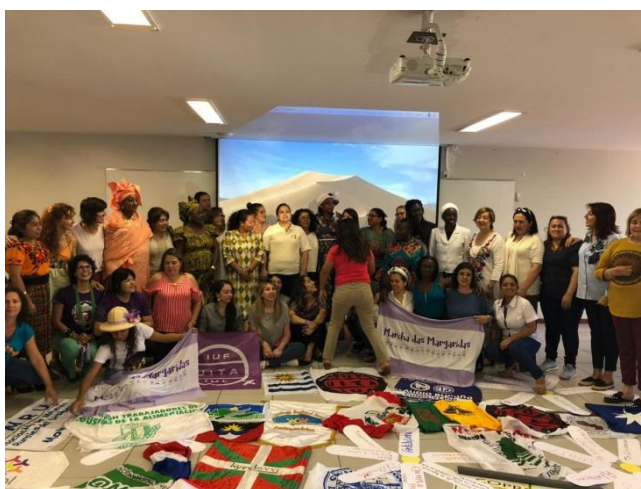
Rencontre mondiale des femmes paysannes au Brésil en 2019 en vue d'adopter une stratégie commune pour la réalisation de l'ODD n° 5

« Adopter des politiques bien conçues et des dispositions législatives applicables en faveur de la promotion de l'égalité des sexes et de l'autonomisation de toutes les femmes et de toutes les filles à tous les niveaux et renforcer celles qui existent ».