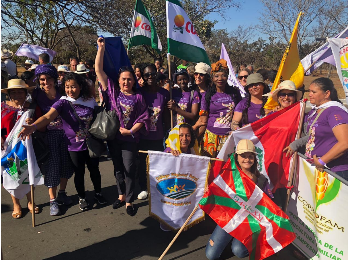
Marche des femmes à Brasilia le 14 août 2019