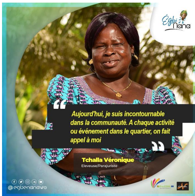
Photo : au Togo, campagne sur les réseaux sociaux pour changer le regard de la société sur la femme © DR

Dans les contextes Sud, les efforts en faveur des filles (meilleure scolarisation, hausse de l'âge du mariage, etc.) et des femmes (alphabétisation, formation en « leadership », etc.) peuvent s'accompagner d'une valorisation de l'image des professionnelles : cheffes d'exploitation agricole, entrepreneures en transformation alimentaire, femmes agronomes actives dans le conseil agricole, etc.