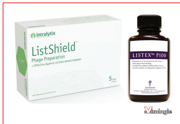
Figure 4. Exemples de deux produits commerciaux pour des applications agroalimentaires ciblant Listeria monocytogenes .

du sol, des plantes et des eaux pour pallier ce manque de connaissances et mieux évaluer les risques des diverses phagothérapies envisagées.