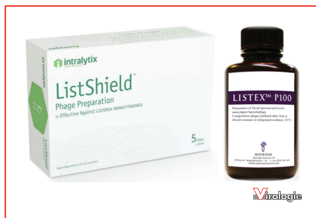
Figure 4. Exemples de deux produits commerciaux pour des applications agroalimentaires ciblant Listeria monocytogenes .

du sol, des plantes et des eaux pour pallier ce manque de connaissances et mieux évaluer les risques des diverses phagothérapies envisagées.