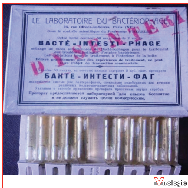
Figure 1. Photographie d'une boîte d'ampoules contenant une solution de bactériophages produite en France par un laboratoire dirigé par F. d'Hérelle. On notera l'inscription qui stipule « Délivré gratuitement pour des expériences de traitement, ne peut faire l'objet de transaction commerciale » laissant supposer que ces ampoules n'étaient pas commercialisées.

l'agent pathogène en fait des alliés particulièrement intéressants dans les infections où les antibiotiques diffusent mal : infections osseuses ou articulaires, matériel prothétique, infections de type abcès, empyèmes, etc. [19-21].