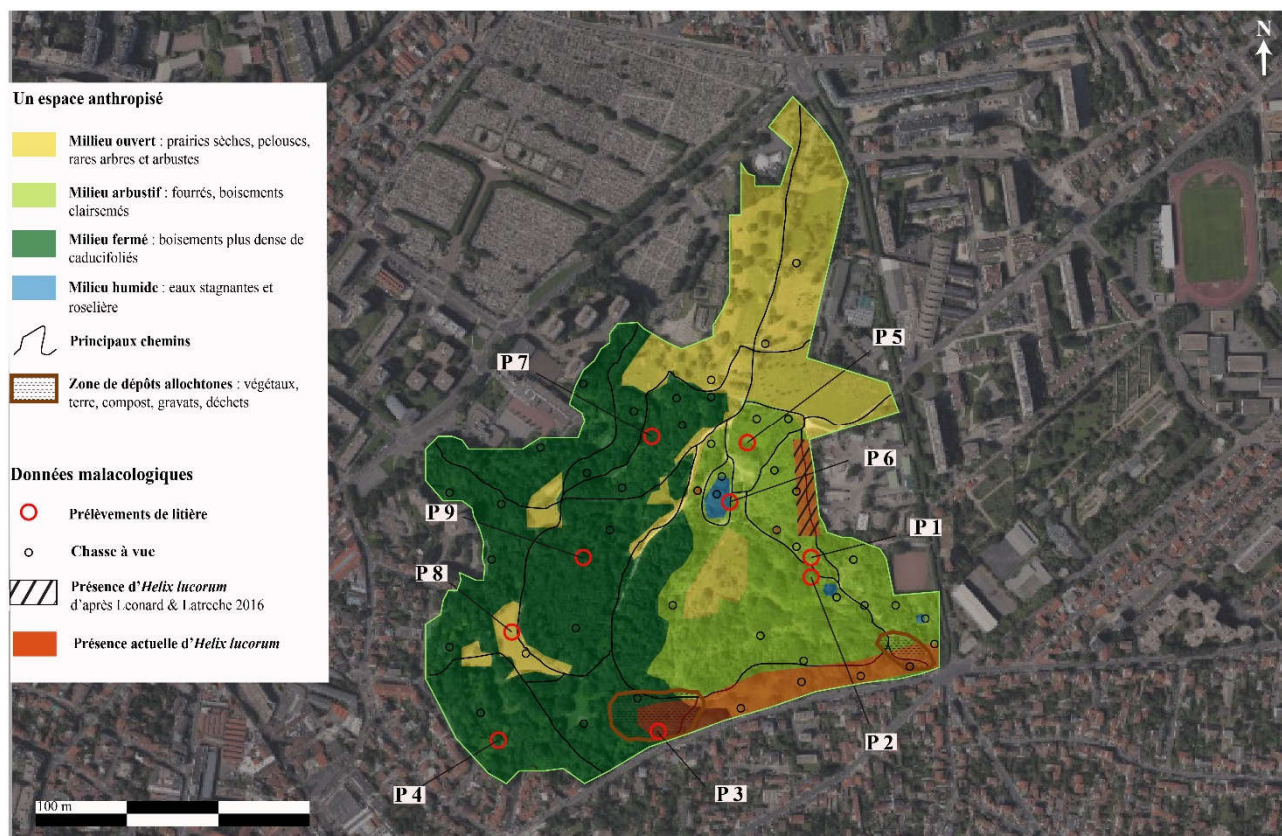
Figure 2 : Carte de synthèse présentant les types de milieux du parc, la localisation des prélèvements, chasse à vue et zone de présence d' H. lucorum.