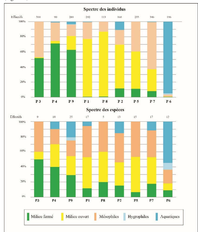
Figure 3 : Diagramme malacologique d'après la méthode mise en œuvre et Puisségur (1976) et ses groupes écologiques simplifiés par Granai (2014).

présents entre 20 et 40 % en termes d'espèces dans tous les prélèvements. Avec plus de 50% d'individus représentant les espèces à affinités forestières, P3, P4 et P9 sont des assemblages malacologiques dominés par des taxons forestiers. Les milieux arbustifs et de pelouses, échantillonnés par les prélèvements P1, P2, P5 et P8, possèdent entre 30 et 85 % taxons de milieux ouverts en termes d'individus. Les espèces de milieux forestiers y sont aussi présentes, mais en faible quantité. Les cinq groupes écologiques sont présents dans chacun des prélèvements mais dans des proportions différentes (Figure 3).