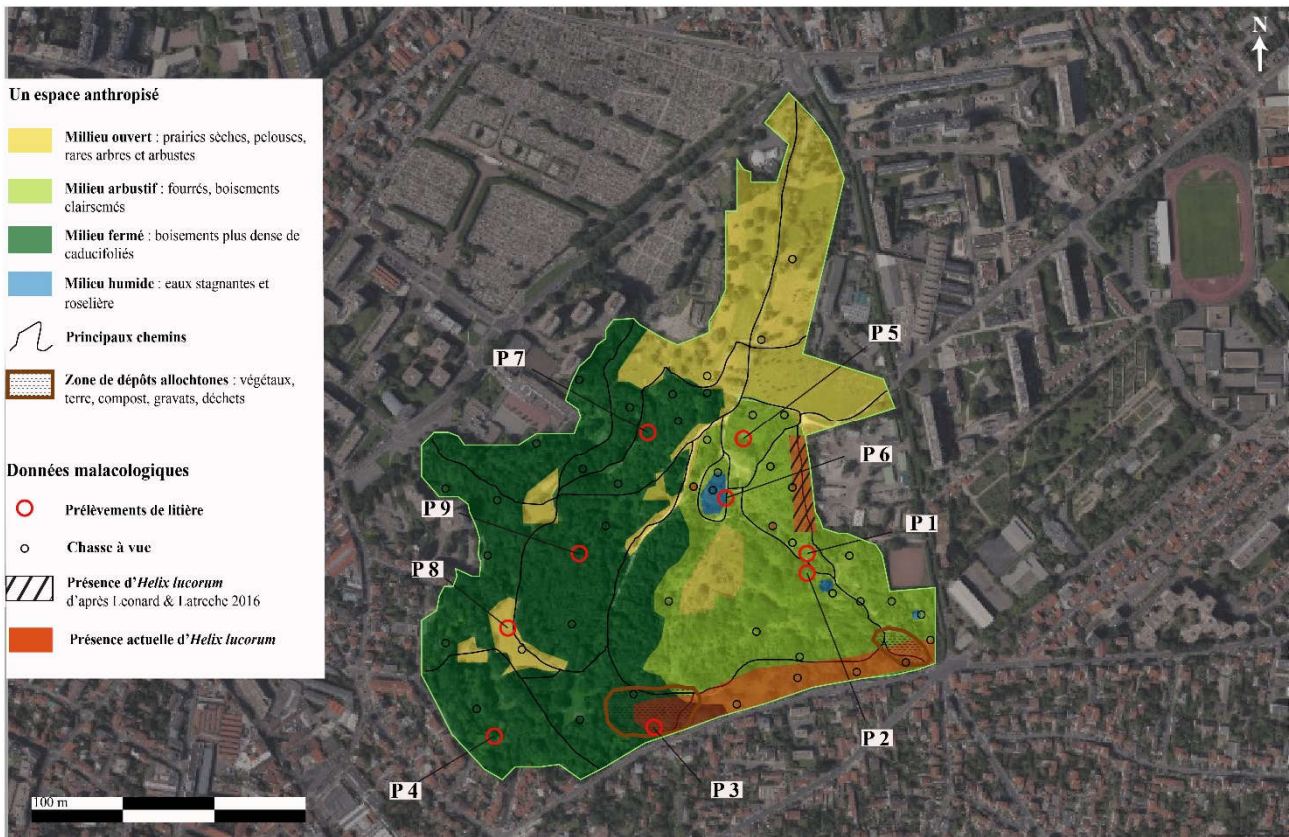
Figure 2 : Carte de synthèse présentant les types de milieux du parc, la localisation des prélèvements, chasse à vue et zone de présence d' H. lucorum.