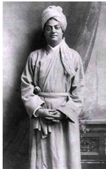
Figures 3 et 4. Margaret Noble, devenue Nivedita, 1906 (à gauche) ; Vivekananda, vers 1900 (à droite).

Ainsi, dès son arrivée, elle insiste et réussit à s'installer chez la femme du maître spirituel de Vivekananda, Sarada Devi. Elle y mène une vie très simple et pauvre, suivant les pratiques spirituelles des femmes bengalis hindoues, veuves ou engagées dans une voie spirituelle, aux marges de la société. Quand elle s'installe dans un quartier pauvre de Calcutta, elle a quitté ses robes victoriennes pour une robe simple à la mode de son maître spirituel. Elle n'explique pas ce choix qui semble répondre au contexte matériel modeste des quartiers hindous et à ses propres affinités qu'elle exprime dans ses écrits. Il est certain qu'il correspond à son engagement vis-à-vis des traditions philosophiques et religieuses hindoues et de leurs symboles. Elle évoquera ailleurs l'ancienneté et la perfection du sari :