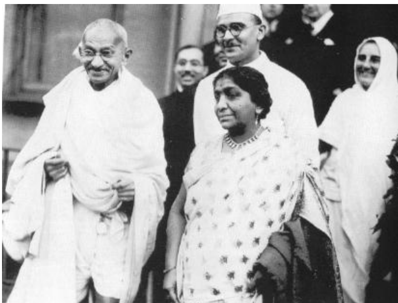
Figure 7. Gandhi, Sarojini Naidu et Mirabehn à Londres en 1931.

Gandhi a-t-il senti que cette transformation n'était pas convaincante pour les Indiens ? Connaissant la tendance de ses compatriotes à prendre de haut toute imitation ou, au mieux, à la tolérer avec condescendance, il a dû juger ce geste trop provocateur pour les conventions sociales, problématique aussi bien pour les Indiens que pour les étrangers. En tout cas, il insiste pour qu'elle ne s'habille qu'en saris de khadi blanc pur sans bordure. Elle se confond ainsi avec d'autres groupes d'Indiennes qui affichent par là leurs sentiments patriotiques et leur engagement politique.