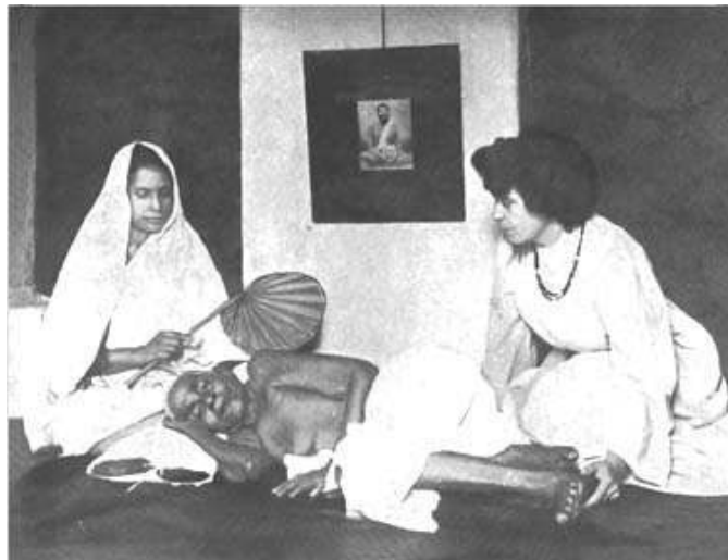
Figure 5. Margaret Noble (Nivedita) aux côtés de Gopala-Ma, disciple de Ramakrishna (1906).

pas trop serré, et au temps de loisir il donne aux pieds toute la liberté de la jupe. Et sa couleur !... Je languissais pour des saris sans bordures. Mais j'ai appris à l'apprécier. Cette petite ligne, qui semblait une interruption inutile dans une composition, me semble aujourd'hui comme le coup de pinceau d'un grand maître, définissant et mettant le tout en valeur 20 .