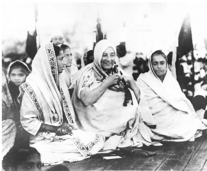
Figure 6. Mirabehn à Karachi (1931).