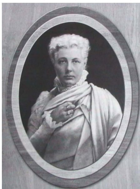
Figure 1. Annie Besant dans les années 1890.

Cependant, quelques photographies révèlent une transformation de son mode vestimentaire au fil du séjour indien. Les premières photos à son arrivée en Inde en 1893 la montrent en chemisier de dentelle, avec un col montant, recouvert d'un long tissu drapé très serré autour du corps (figure 1). Ses cheveux courts et son élégance vestimentaire lui donnent dans ce portait l'apparence d'une Anglaise issue de milieux aisés. Deux ans plus tard, le changement est frappant. Elle porte le même style de chemisier mais avec un large châle dont une partie tombe derrière son épaule gauche et l'autre est suspendue devant, selon le style adopté par certains hommes indiens de l'époque. Cette tenue correspond aux exigences de l'épouse traditionnelle de la classe moyenne de garder couverte la totalité du corps et de ne pas porter de vêtements trop voyants.