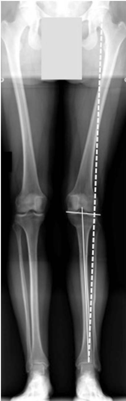
Abb. 1 ▲ Postoperative Ganzbeinaufnahme einer 48-jährigen Patientin nach proximaler tibialer Osteotomie (PTO) links mit Überkorrektur, bei der die Mickulicz-Linie weit lateral durch das laterale Gelenkkompartiment führt ( gestrichelte Linie ). Es kam ausserdem zu einer nach lateral abfallenden Gelenklinie, welche die allgemein akzeptierten 5° überstieg ( durchgehende Linien )

werden nicht berücksichtigt, genauso wie komplexe Achskorrekturen mit Fixateur, externe Techniken bzw. große extraartikuläre Korrekturen. Komplikationen, die auf einer fehlerhaften Planung beruhen, werden ebenfalls nicht in dieser Arbeit detailliert beschrieben. Für Informatio-