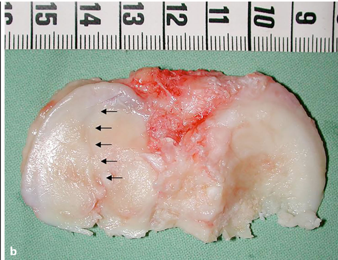
Abb. 3 ◀ a Postoperatives Röntgenbild einer nach proximal in den lateralen Gelenkspalt aufsteigende Typ-III-Fraktur nach Takeuchi (Pfeil) nach medial öffnender proximaler Tibiaosteotomie (PTO) bei einer 44-jährigen Patientin. b Reseziertes Tibiaplateau bei Konversion zur Knie totalendoprothese 5 Jahre nach der PTO. Die Pfeile stellen die noch gut sichtbare Frakturlinie durch das laterale Tibiaplateau dar