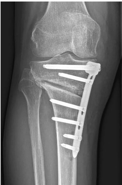
Abb. 4 ▲ Eine nach lateral verlaufende Erweiterung des Osteotomiespalts beim 6-Wochen-Follow-up sollte Anlass zu einer CT-Kontrolle sein, um z. B. eine instabile Fraktur vom Grad II nach Takeuchi auszuschließen