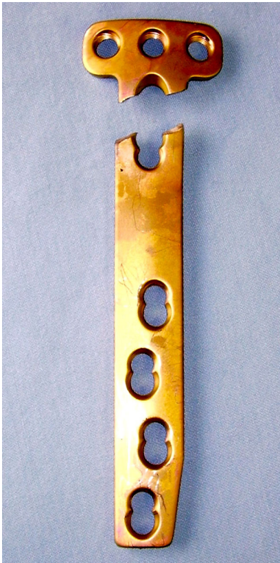
Abb. 6 ▲ Bruch eines Plattenfixateurs (Tomo-Fix, Depuy-Synthes) durch fehlendes Besetzen des „D-Lochs“. Dies hat zu einer zu hohen Belastungskonzentration der Platte in diesem Bereich geführt und ultimativ den Plattenbruch erzeugt