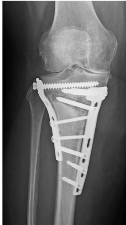
Abb. 7 ▲ Doppelosteosynthese und autologe Knochenspanplastik bei Patientin mit Plattenbruch

Bei proximaler Tibiaosteotomie kann ein iatrogenes Streckdefizit dann entstehen, wenn der Winkel zwischen der horizontalen und der aufsteigenden Osteotomie bei biplanarer Osteotomie zu flach gewählt oder intraoperativ im Moment der Osteosynthese nicht auf das Erreichen der vollen Streckstellung geachtet wird. Gleiches kann bei distaler Femurosteotomie entstehen. Auch sollte bei der medial öffnenden proximalen Tibiaosteotomie mittels biplanarer Technik darauf geachtet werden, die Dorsalneigung des Tibiaplateaus („tibial slope“) neutral zu halten. Hierbei sollte der Osteotomie-spreizer im Moment der Aufklappung der Osteotomie an der dorsomedialen Tibiakante angebracht werden. Eine ventrale Platzierung des Spreizers führt zu einer Erhöhung der Neigung des Tibiaplateaus.