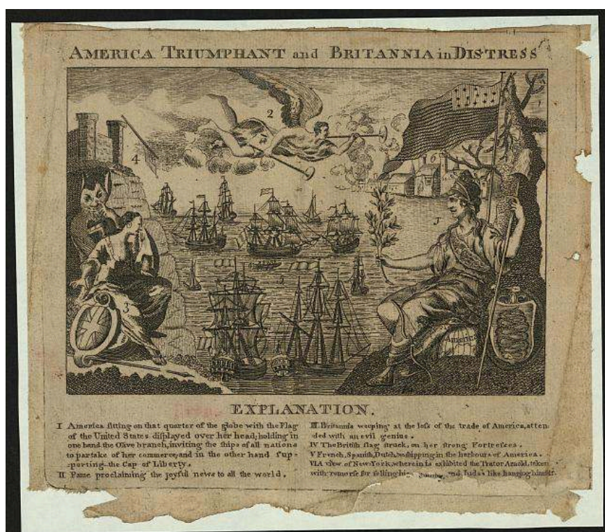
Fig. 11 America Triumphant and Britannia in Distress ( Weatherwise's Town and Country Almanack )