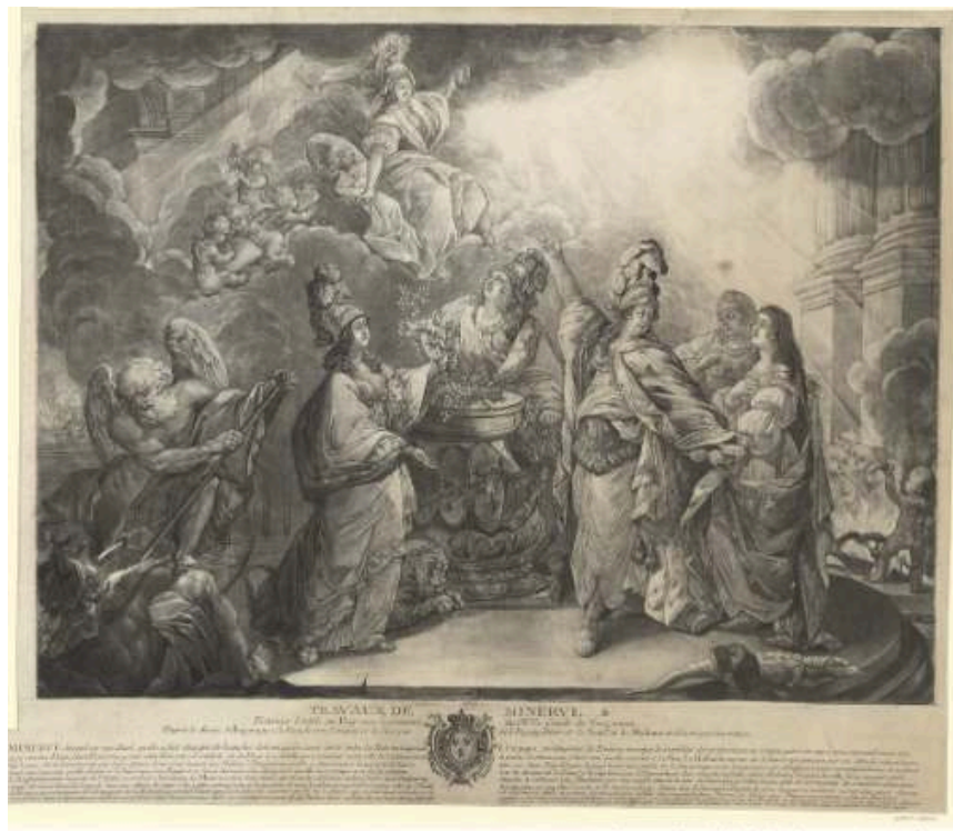
Fig. 5 Louis-Charles Dagoty, Les Travaux de Minerve , 1784