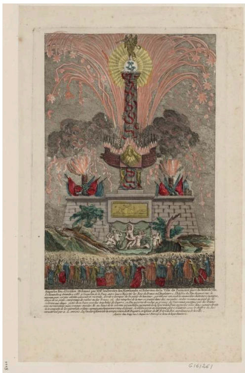
Fig. 1 Superbe feu d'artifice ordonné par MM.rs les prévôts des marchands et échevins de la ville de Paris tiré place de l'hotel de ville le dimanche 14 décembre 1783