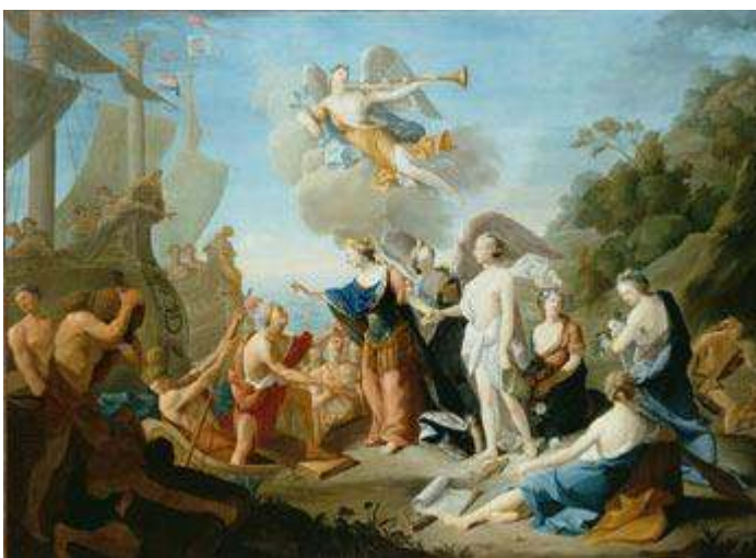
Fig. 4 Jean Suau. La France offrant la liberté à l'Amérique , 1784