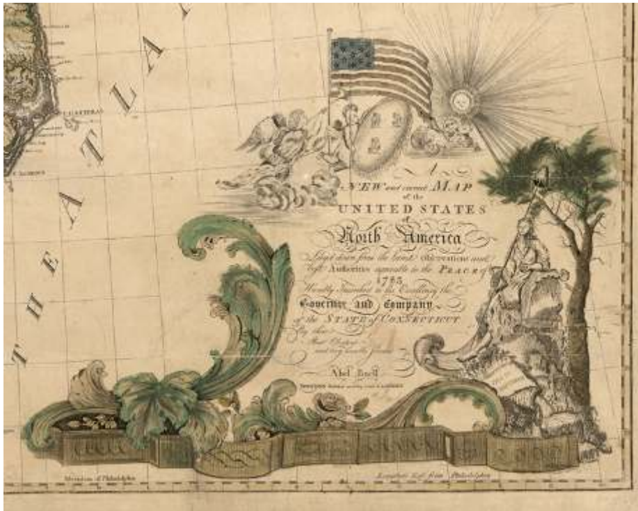
Fig. 10 A New and Correct Map of the United States of North America: Layd down from the Latest Observations and Best Authorities Agreeable to the Peace of 1783: Humbly Inscribed to his Excellency the Governor and Company of the State of Connecticut by their most Obedient and very Humble Servant Abel Buell.