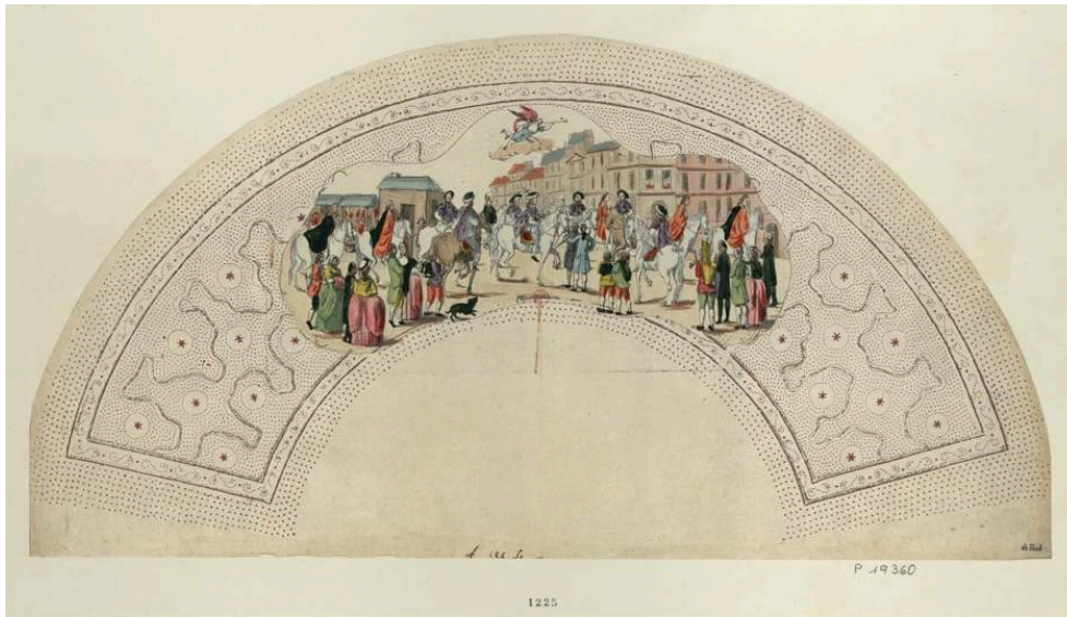
Fig. 2 Feuille d'éventail représentant la proclamation de la Paix signée à Versailles, faite à son de trompe sur la Place Maubert, 1783