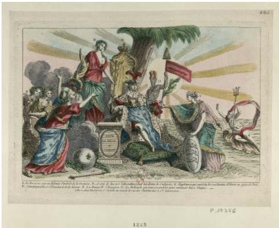
Fig. 3 Vive la Paix à jamais . Estampe allégorique en l'honneur du traité de Versailles, 1783