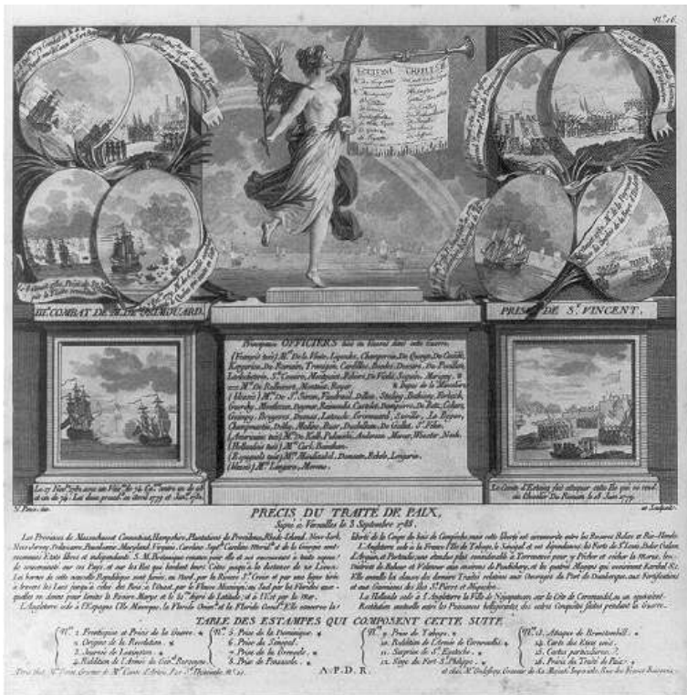
Fig. 7 Précis du traité de paix, signé à Versailles le 3 Septembre 1783

Domingue le 18 octobre 1782 (fig. 7). Dans ce contexte, l’allégorie de la Renommée met à l’honneur les officiers français tombés pendant le conflit.