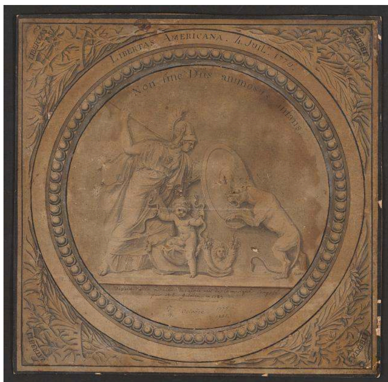
Fig. 8 Libertas Americana. 4 Julii. 1776 Non sine Diis animosus infans . Dessin de la médaille des États-Unis d'Amérique composé en 1783