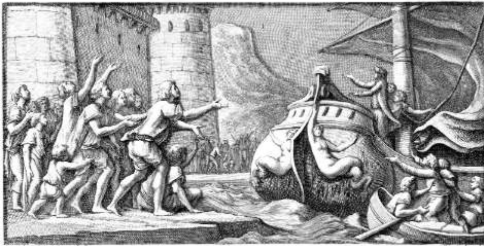
Fig. 6 Charles Monnet, L'Indépendance de l'Amérique . Dessin du Bas-relief de l'obélisque de Port-Vendres