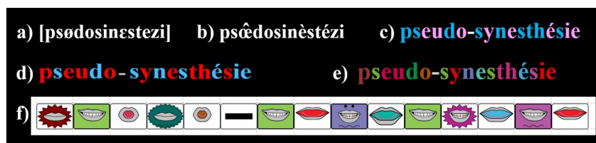
Figure 4 : Différentes approches pour représenter la prononciation (ici du mot "pseudo-synesthésie") : a) en alphabet phonétique international, b) en Alfonic, c) selon Borel Maisonny, d) selon l'approche ÉcriLu (colorisation générée avec Wikicolor http://wikicolor.alem-app.fr/ ), e) en Silent Way (colorisation également générée avec Wikicolor) et f) avec les bouches utilisées par Do (représentation générée avec PhonoDrop http://phonodrop.alem-app.fr/ )

Sans être aussi sophistiqués, il convient de signaler d'autres usages de la couleur appliquée aux graphèmes. Ainsi, l'approche multimodale de Borel-Maisonny prévoit, en plus de la représentation de chacun des phonèmes par un geste univoque, d'entrer dans l'écrit en discriminant au moyen d'une couleur distincte les graphèmes vocaliques des graphèmes consonantiques (Borel-Maisonny, 1973, p. 22). Enfin, Delacour revisite l'utilisation de la couleur dans son dispositif ÉcriLu : il n'y a plus, comme chez Gattegno un code unique phonème-couleur, mais simplement une alternance de deux couleurs pour signaler à l'apprenant la frontière entre deux graphèmes (cf. Fig 4 ci-dessous).