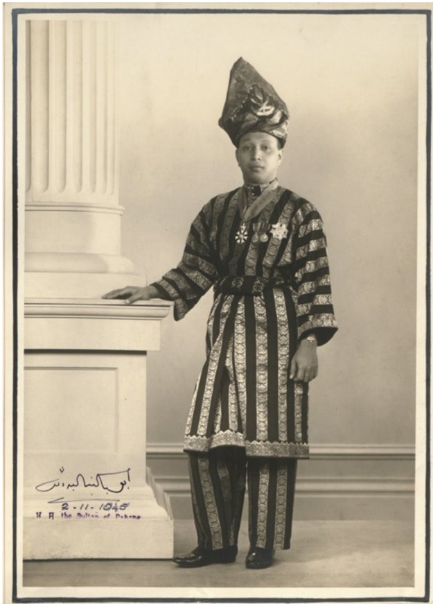
Ill. n° 2. Sultan Abu Bakar de Pahang, en 1945

sujets, et d'administrateurs britanniques jette la lumière sur les conflits entre l'administration et les Che Wong de Krau et les Malais d'Ulu Tembeling dans les années 1930, et la manière dont les différentes parties les ont abordés. Le sultan Abu Bakar Ri'ayatuddin al-Mu'adzam Shah ibni Al-Marhum Sultan Abdullah al-Mutasim Billah Shah né en 1904 monte sur le trône à la mort de son père en 1932. Ancien élève du Malay College de Kuala Kangsar au Perak, où sont envoyés les enfants des grandes familles malaises qui collaborent avec les Britanniques, il a reçu une éducation à l'anglaise et est l'un de ces souverains de protectorat qui font le lien entre deux mondes.