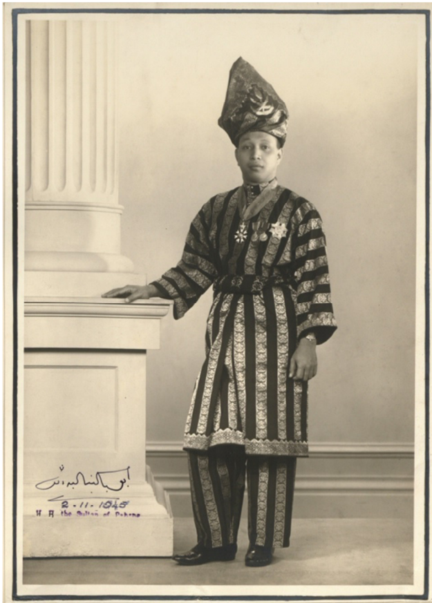
Ill. n° 2. Sultan Abu Bakar de Pahang, en 1945

sujets, et d'administrateurs britanniques jette la lumière sur les conflits entre l'administration et les Che Wong de Krau et les Malais d'Ulu Tembeling dans les années 1930, et la manière dont les différentes parties les ont abordés. Le sultan Abu Bakar Ri'ayatuddin al-Mu'adzam Shah ibni Al-Marhum Sultan Abdullah al-Mutasim Billah Shah né en 1904 monte sur le trône à la mort de son père en 1932. Ancien élève du Malay College de Kuala Kangsar au Perak, où sont envoyés les enfants des grandes familles malaises qui collaborent avec les Britanniques, il a reçu une éducation à l'anglaise et est l'un de ces souverains de protectorat qui font le lien entre deux mondes.