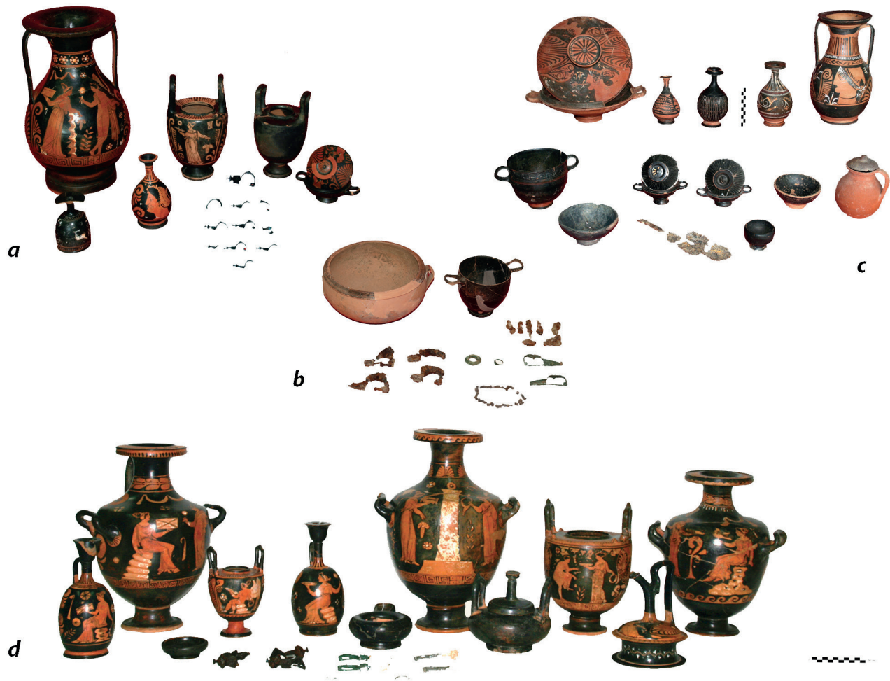
Fig. 3 - San Brancato di Sant'Arcangelo. Propriété Cicchelli, mobiliers de la T. 35, deuxième moitié du IV e siècle av. J.-C. (a). Propriété Leone, mobiliers de la T. 8, deuxième quart du IV e siècle av. J.-C. (b). Mastrosimone, mobiliers de la T. 73, première moitié du III e siècle av. J.-C. (c). Propriété Leone, mobiliers de la T. 7, troisième quart du IV e siècle av. J.-C. (d).

les formes céramiques et de restituer une typologie pour identifier des changements et des évolutions dans les formes, en tenant compte évidemment des données céramographiques (fig. 5) 16 . Les vases de grande et de petite tailles (surtout des formes produites en série à partir du troisième quart du IV e siècle av. J.-C.) présentent des iconographies plutôt fréquentes, sérielles et ont parfois des motifs