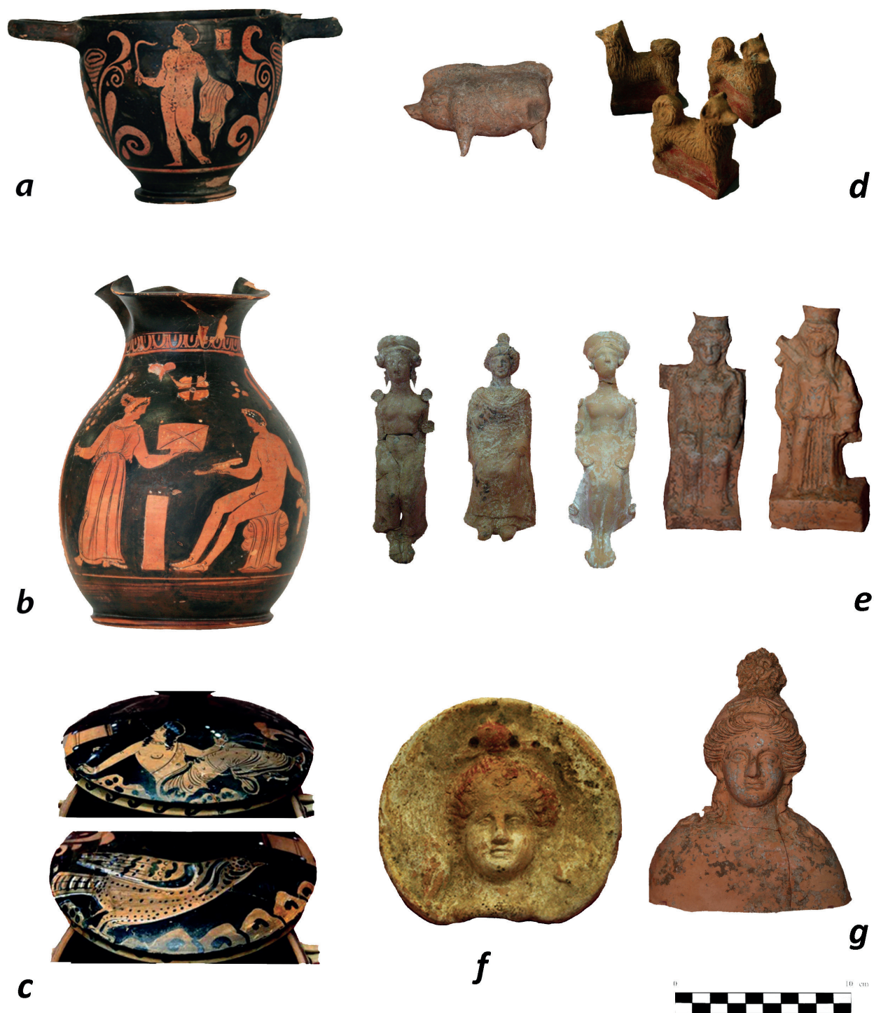
Fig. 4 - San Brancato di Sant'Arcangelo. Propriété Leone, T. 4: skyphos à f.r. du Peintre de Roccanova (a). Propriété Leone, T. 5: chous à f.r. du groupe du Peintre de Darius et des Enfers (b). Propriété Leone, T. 17: lekanis à f.r. de l'atelier d'Assteas (c). Coroplastie dans les sépultures d'enfants: Propriété Mastrosimone T. 57 (d). Propriété Cicchelli T. 33 (e). Propriété Cudemo T. 190 (f). Propriété Mastrosimone T. 63 (g).