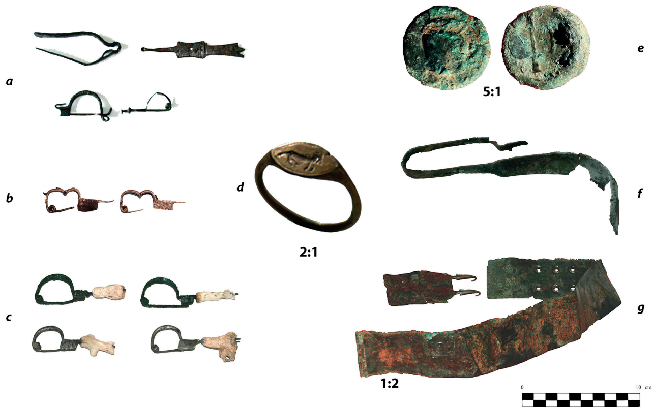
Fig. 2 - San Brancato di Sant'Arcangelo. Propriété Cicchelli, T. 28 : pincette et fibules en bronze ; petite cuillère en argent (a). Propriété Leone, T. 18 : fibules à arc double en argent (b). Propriété Leone, T. 7 : fibules en argent et en bronze aux apophyses recouvertes de corail (c). Propriété Leone, T. 15 : anneau en or avec animal gravé (loup ?) (d) ; Propriété Cicchelli, T. 61 : monnaie en bronze d'Herakleia (e). Propriété Leone, T. 11 : strigile en bronze (f). Propriété Cicchelli, T. 24 : ceinturon en bronze avec plaque décorative (g) (© J. Mandić et C. Vita).

des inhumés, indifféremment à droite ou à gauche, et parfois aux pieds ou à la tête ; en revanche, dans les tombes d'enfants, les dépôts sont faits autour du squelette ou sur lui. Les fibules ont été retrouvées au niveau des épaules ou de la poitrine et les anneaux sont toujours à la main. S'il n'y a qu'un seul ceinturon, celui-ci est porté par le défunt (fig. 2g) tandis que s'il y en a deux, le second est déposé le long de la hanche du squelette. Enfin, le strigile est positionné au niveau de la main ou de l'humérus ; dans un seul cas il a été trouvé au niveau de la tête (fig. 2f).