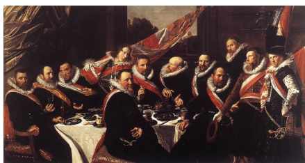
Frans Hals, Banquet des officiers de Saint Georges de Haarlem , 1627

Par comparaison, voici une scène de genre sur le même thème de la bonne table :