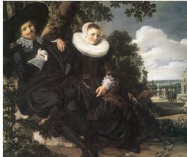
Frans Hals, Portrait d'Isaac Massa et de Beatrix van der Laen , vers 1622