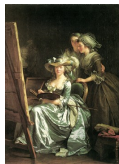
Adélaïde Labille-Guiard, Autoportrait avec deux élèves (Marie-Gabrielle Capet et Carreaux de Rosemond), 1785

Il s'agit de la dernière compagne du peintre (Hendrickje Stoffels), qui se serait prêtée à un esquisse destinée peut-être à la réalisation d'un autre tableau à venir ; elle prêta ses traits à de nombreux personnages dans les peintures, notamment religieuses, de Rembrandt. Ici, nous ne sommes pas dans le cadre d'un contrat commercial entre un peintre et son commanditaire ; et de surcroît, le personnage représenté n'a rien d'historique.