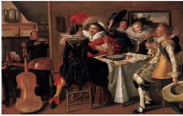
Dirck Hals, Agréable compagnie à table , 1627-29

Le plus célèbre de ces portraits de groupe est La compagnie de Frans Banning Cocq , dite « La Ronde de nuit », de Rembrandt, 1642 :