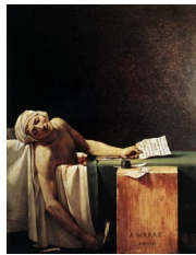
David, La mort de Marat , 1793

Le point-limite de cette assimilation entre un portrait et la peinture d'histoire est le portrait héroïque d'un personnage représenté dans son drame ou toute sa gloire historique :