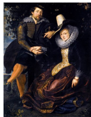
Rubens, Autoportrait avec sa première épouse , Isabelle Brandt , 1609-10