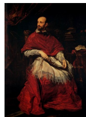
Van Dyck, Portrait du cardinal Bentivoglio , vers 1625 : il venait d'être nommé cardinal et était promis à la papauté

Van Dyck, par exemple, donnait à ses portraits une dimension « histoire », même minimale :