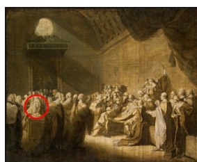
John Singleton Copley, La mort du comte de Chatham , 1779 : le premier ministre de l'époque s'effondre en pleine séance de la Chambre des Lords

Certains portraits de personnages célèbres ont pu être peints après la réalisation d'un tableau délibérément historique dans lequel ils figuraient déjà :