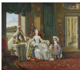
Johann Zoffany, La Reine Charlotte [alors reine d'Angleterre] avec ses deux fils aînés, 1764-65

dans une conversation libre entre eux. Il s'agit d'un compromis entre une mise en forme qui s'apparentait à la scène de genre (scènes de la vie domestique) et l'impératif du portrait qui imposait au peintre de restituer la ressemblance de chacun des membres de la famille. Il fallait donc réussir à combiner unité d'action, intégration du groupe dans l'espace et portraits individuels (Trope-Podell, 1995).