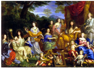
Jean Nocret, Louis XIV et la famille royale travestis en divinités de l'Olympe , 1670

temps. L'idée était également de faire ressortir les qualités du modèle en l'assimilant à tel ou tel modèle de vertu.