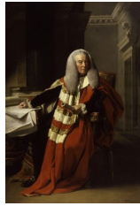
Portrait de William Murray, Premier comte de Mansfield, 1783

Copley avait réalisé des esquisses de portraits de plusieurs Lords, dont William Murray, en vue de la composition de son grand tableau de 1779 – lequel lui avait valu une certaine gloire et des commandes de portraits, qu'il put honorer sans avoir besoin de faire poser de nouveau les commanditaires. Autre bénéficiaire : ce portrait faisait référence à l'événement historique auquel avait participé William Murray ( Portraits publics, portraits privés , 2007 : 101).