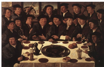
Cornelis Anthonisz, Banquet de la guilde des arquebusiers d'Amsterdam , 1533

Pour d'autres groupes, notamment les milices, leur activité offrait de plus amples possibilités de mise en scène. Certaines formules iconographiques s'imposèrent rapidement, comme par exemple montrer les archers rassemblés autour d'un banquet :