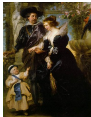
Rubens, Autoportrait avec sa seconde femme , Helena Fourment , et leur fils Pierre-Paul , vers 1639

Un portrait de famille n'est pas réductible à une scène de genre puisque, si l'on y trouve plusieurs personnes représentées, elles le sont toutes à leur demande pour valoriser leur nom, leur filiation, leur descendance. Il s'agit d'une forme de portrait collectif.