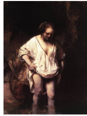
Rembrandt, Hendrickje se baignant dans une rivière , 1654

Il s'agit de la dernière compagne du peintre (Hendrickje Stoffels), qui se serait prêtée à un esquisse destinée peut-être à la réalisation d'un autre tableau à venir ; elle prêta ses traits à de nombreux personnages dans les peintures, notamment religieuses, de Rembrandt. Ici, nous ne sommes pas dans le cadre d'un contrat commercial entre un peintre et son commanditaire ; et de surcroît, le personnage représenté n'a rien d'historique.