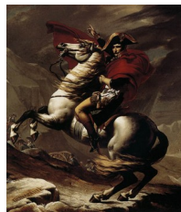
David, Bonaparte traversant les Alpes , 1801

Ou l'histoire réduite à un seul personnage d'exception.