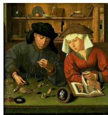
Quentin Metsys, Le Peseur d'or et sa femme , 1514 Autre titre : Le prêteur et sa femme

En revanche, si l'individu peint par l'artiste n'est pas représenté pour lui-même, mais pour incarner un type ( Le Paysan , La Bergère... ), ou pour donner corps à une expression, une physionomie, une silhouette extraordinaires, hors du commun, alors nous ne sommes plus en présence d'un portrait. Le tableau n'a pas été peint à la demande du modèle ; c'est plutôt l'individu repéré, voire payé par le peintre, qui lui a servi de modèle. De tels modèles sont forcément anonymes puisqu'ils se contentent de prêter leurs traits au peintre. Ils n'existent pas pour eux-mêmes. Il peut s'agir de simples quidams croqués sur le vif, dont les traits ont été repris dans un tableau ; ou de figurants rémunérés pour prendre la pose. On les retrouve ensuite soit dans comme figures principales d'une œuvre picturale, soit impliqués parmi d'autres dans une scène composée par l'artiste – composition qui relève alors de la « scène de genre ».