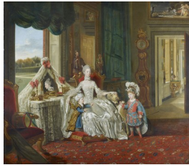
Johann Zoffany, La Reine Charlotte [alors reine d'Angleterre] avec ses deux fils aînés, 1764-65

dans une conversation libre entre eux. Il s'agit d'un compromis entre une mise en forme qui s'apparentait à la scène de genre (scènes de la vie domestique) et l'impératif du portrait qui imposait au peintre de restituer la ressemblance de chacun des membres de la famille. Il fallait donc réussir à combiner unité d'action, intégration du groupe dans l'espace et portraits individuels (Trope-Podell, 1995).