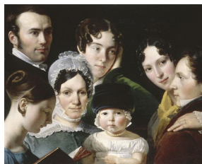
Claude-Marie Dubufe, La famille de l'artiste , 1820 :

A mi-chemin entre la sphère publique et la sphère privée, le portrait de famille revêtait une grande importance dans les familles nobles et bourgeoises pour affirmer l'affiliation dynastique et la continuité des générations. Mais c'était un genre plutôt figé, comme la plupart des portraits de groupe – collection de physionomies plutôt que scène collective.