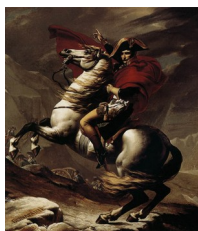
David, Bonaparte traversant les Alpes , 1801

Ou l'histoire réduite à un seul personnage d'exception.