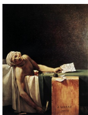
David, La mort de Marat , 1793

Le point-limite de cette assimilation entre un portrait et la peinture d'histoire est le portrait héroïque d'un personnage représenté dans son drame ou toute sa gloire historique :