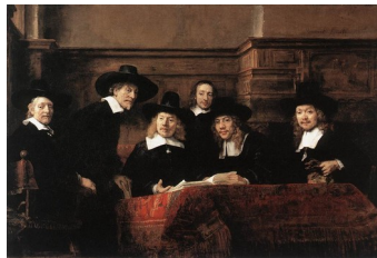
Rembrandt, Le syndic des drapiers , 1662 : même formule

Pour d'autres groupes, notamment les milices, leur activité offrait de plus amples possibilités de mise en scène. Certaines formules iconographiques s'imposèrent rapidement, comme par exemple montrer les archers rassemblés autour d'un banquet :