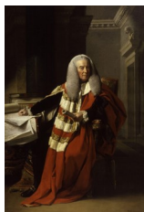
Portrait de William Murray, Premier comte de Mansfield, 1783

Copley avait réalisé des esquisses de portraits de plusieurs Lords, dont William Murray, en vue de la composition de son grand tableau de 1779 – lequel lui avait valu une certaine gloire et des commandes de portraits, qu'il put honorer sans avoir besoin de faire poser de nouveau les commanditaires. Autre bénéficiaire : ce portrait faisait référence à l'événement historique auquel avait participé William Murray ( Portraits publics, portraits privés , 2007 : 101).