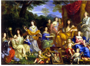
Jean Nocret, Louis XIV et la famille royale travestis en divinités de l'Olympe , 1670

temps. L'idée était également de faire ressortir les qualités du modèle en l'assimilant à tel ou tel modèle de vertu.