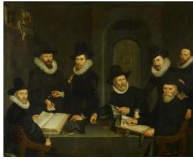
Cornelis van der Voort, Les régents de l'hospice de Binnengasthuis , 1617-18 : ils sont engagés dans une certaine activité, comme s'ils étudiaient le dossier d'un solliciteur dont le spectateur du tableau épouse le point de vue