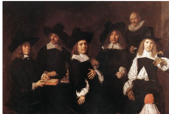
Frans Hals, Les régents de l'hospice de Haarlem , 1664 : plus aucune action, simplement des poses juxtaposées