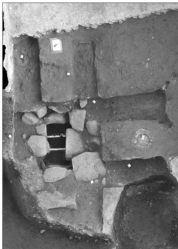
Fig. 3 : Photogrammétrie de la structure interprétée comme tronc monétaire (M. Glauz)

Cette structure de quelques mètres carrés recouvrait les vestiges de deux bâtiments successifs, A et B, en architecture de terre et bois, détruits par incendie. Quoique les limites de ces deux constructions, dont les plans ne se superposent pas exactement, n'aient pu être reconnues en totalité, leurs caractères principaux peuvent être décrits. Le plan du bâtiment A, le plus récent, peut être restitué avec une plus grande précision que celui du bâtiment B, beaucoup plus lacunaire. Il présente des parois en torchis sur clayonnage avec enduits peints (d'après l'observation des fragments les mieux conservés présents dans les niveaux de destruction), lesquelles sont montées sur des poutres sablières basses ancrées dans des tranchées de fondation d'une trentaine de centimètres de large et d'une dizaine de centimètres de profondeur. Les traces de deux poteaux porteurs sont conservées le long de la paroi est du bâtiment et presque au contact de celle-ci. Dans l'état, l'espace délimité par les parois nord et est correspond à un sol en terre battue, conservé sur une bande de 7,20 m de long, dans le sens nord-sud, et 2,60 m de