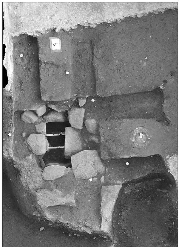
Fig. 3 : Photogrammétrie de la structure interprétée comme coffre à monnaies

Cette structure de quelques mètres carrés recouvrait les vestiges de deux bâtiments successifs, A et B, en architecture de terre et bois, détruits par incendie. Quoique les limites de ces deux constructions, dont les plans ne se superposent pas exactement, n'aient pu être reconnues en totalité, leurs caractères principaux peuvent être décrits. Le plan du bâtiment A, le plus récent, peut être restitué avec une plus grande précision que celui du bâtiment B, beaucoup plus lacunaire. Il présente des parois en torchis sur clayonnage avec enduits peints (d'après l'observation des fragments les mieux conservés présents dans les niveaux de destruction), lesquelles sont montées sur des poutres sablières basses ancrées dans des tranchées de fondation d'une trentaine de centimètres de large et d'une dizaine de centimètres de profondeur. Les traces de deux poteaux porteurs sont conservées le long de la paroi est du bâtiment et presque au contact de celle-ci. Dans l'état, l'espace délimité par les parois nord et est correspond à un sol en terre battue, conservé sur une bande de 7,20 m de long, dans le sens nord-sud, et 2,60 m de