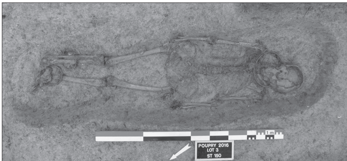
Fig. 2 : Poupry (28), « les Hernies » : sépulture avec effets de contrainte et parure complète en alliage cuivreux

puisqu'elles s'inscrivent en large partie dans le « plateau hallstattien ».