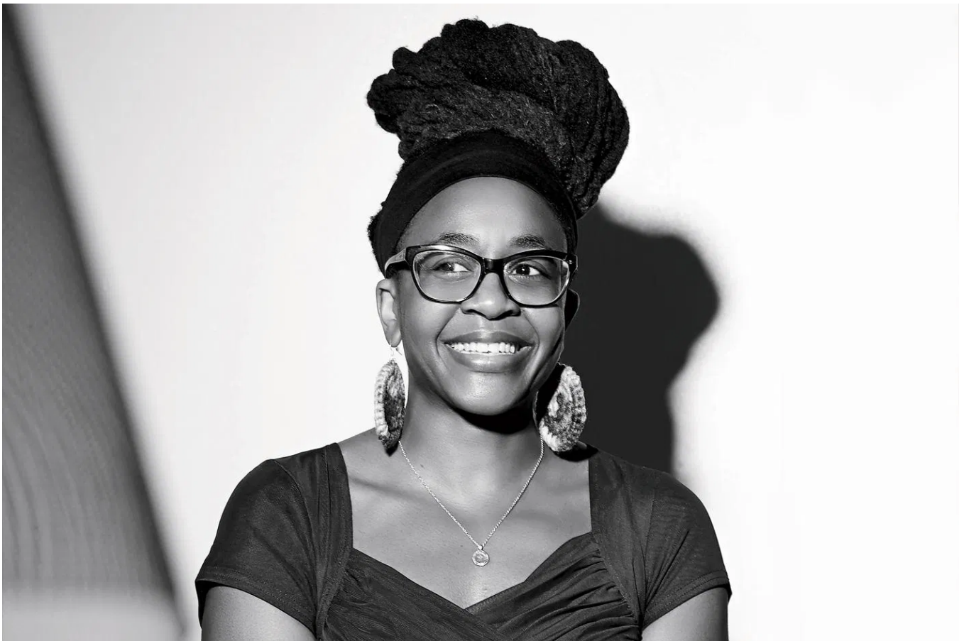
Nnedi Okorafor

En ouverture, un court plaidoyer en forme de pied de nez à Hollywood : un blond et viril héros dénommé Lance le Brave acculé par des ombres noires au bord d'une falaise attend l'intercession d'un étrange personnage à haut-de-forme qui l'aiderait à sortir de ce mauvais pas. Mais