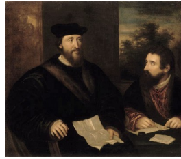
Titien, Portrait de Georges d'Armagnac, évêque de Rodez, avec Guillaume Philandrier, 1535-40

Merle Du Bourg ajoute qu'il juge essentielle la distinction :