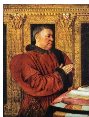
Jean Fouquet, Portrait du chancelier Guillaume Jouvenel des Ursins , vers 1460

A quoi reconnaît-on un portrait ?, se demandait Diderot. Voici la réponse qu'il donne lui-même en 1770 dans Les Deux amis de Bourbonne :