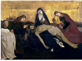
Enguerrand Quarton, Pietà de Villeneuve-lès-Avignon , vers 1455-70

Le même jeu sur le regard se retrouve dans le Portrait d'Étienne Chevalier , introduit par son saint patron, peint par Jean Fouquet vers 1450 (déjà vu dans le chapitre 3 du Portrait depuis la chute de l'Empire romain ).