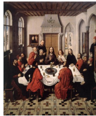
Dirck Bouts, La Cène , 1464-67