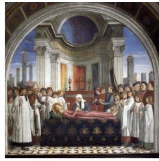
Ghirlandaio, Funérailles de Santa Fina , 1473-75

Le regard rétrospectif que nous portons sur les tableaux peints depuis la Renaissance, dans lesquels apparaissent tant de visages humains, alimente cette question, d’autant plus que les sources documentaires se révèlent souvent insuffisantes sur les conditions de réalisation de ces œuvres. Un regard dirigé vers le spectateur par un personnage peint avec précision révèle-t-il un portrait, c’est-à-dire l’effigie d’une personne singulière – même si cette dernière nous est inconnue – ou bien produit-il un artefact de présence qui rend le tableau plus vivant ? S’agit-il de la restitution d’une réalité individuelle ou d’une prouesse illusionniste de la peinture ? d’un emprunt anecdotique ou d’un effet esthétique ?