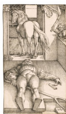
Hans Baldung Grien, Palefrenier ensorcelé , vers 1544