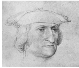
Jean Clouet, Portrait d'un homme inconnu, date ?