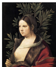
Giorgione, Portrait de jeune femme (Laura), 1506

Voici quelques exemples d'ambiguïtés difficiles à trancher :