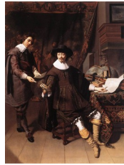
Thomas de Keyser, Portrait de Constantijn Huygens , 1627