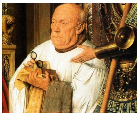
Van Eyck, détail de La Vierge au chanoine Van der Paele , 1434-1436 : le prélat était atteint d'une anomalie vasculaire à la tempe qui lui fit perdre ses cheveux à cet endroit

Commentaire appliqué en particulier aux tableaux de Van Eyck, dont L'homme au turban rouge (déjà vu) et :