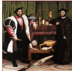
Hans Holbein le jeune, Les ambassadeurs, 1533