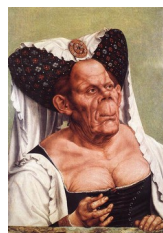
Quentin Massys, Vieille femme ( La reine de Tunis ), vers 1513 - motif que l'on trouvait déjà dans les dessins de Léonard de Vinci :

Parfois, faute d'une documentation suffisante, on peut prendre aujourd'hui pour un portrait réaliste ce qui était en réalité à l'époque une étude de physiognomie, mue par un goût certain pour les figures difformes ou monstrueuses (cf. dans Schneider (1994 : 72-75) :