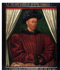
Jean Fouquet, Portrait de Charles VII , vers 1450

le tire vers la caricature : les peintres ne se contentent plus de ne pas idéaliser les personnages ; ils exagèrent leurs défauts physiques. » ( Ibidem : 150)