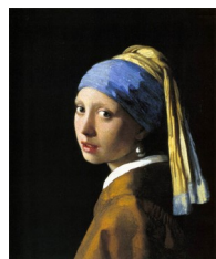
Vermeer, La Jeune fille à la perle, vers 1665 : considérée comme une tronie en 1696