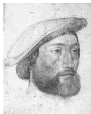
Jean Clouet, Jean de Dinteville seigneur de Polisy, vers 1530

La contemplation des tableaux peints depuis la Renaissance et la lecture des analyses que nous en proposent les historiens d'art nous font donc osciller en permanence entre l'évidence (ou l'illusion) de certains visages peints avec un tel air de réalisme qu'ils nous paraissent forcément avoir été « empruntés » à une personne réelle, dont nous ne savons pourtant rien, et la certitude nominative de certaines effigies dont le maniérisme, le travestissement ou le schématisme nous interdisent cependant d'y chercher la vérité des traits de leur modèle. Entre caractérisation et identité, le portrait reste souvent voué à l'incertitude.