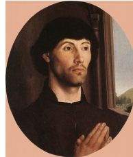
Hugo van der Goes, Portrait d'homme , 1475

Des « livres de modèles » circulaient entre les peintres, dans lesquels chacun pouvait puiser des figures pour enrichir ses propres tableaux.