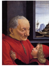
Ghirlandaio, Vieil homme et son petit-fils , vers 1490

Le même type d'assimilation entre réalisme pictural et portrait se retrouve dans les commentaires consacrés au célèbre Christ mort de Hans Holbein (1522) :