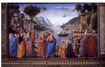
Ghirlandaio, La vocazione de Pierre et André , 1481-1482