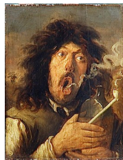
Joos van Craesbeeck, Le Fumeur, XVII e siècle