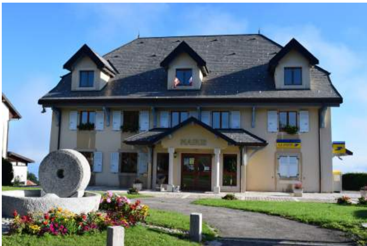
Fig. 8 - La mairie de Saint-Paul-en-Chablais.