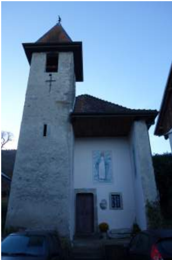
Fig. 9- Chapelle de Véron.