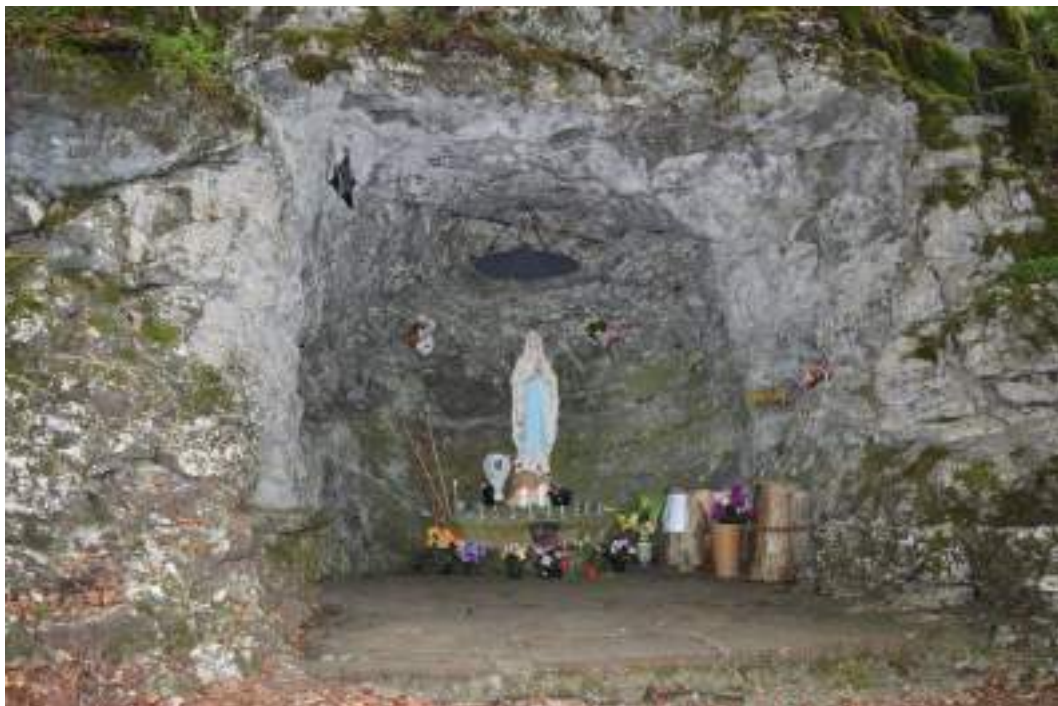
Fig. 25- Grotte Notre-Dame-de-Lourdes à Malpasset.