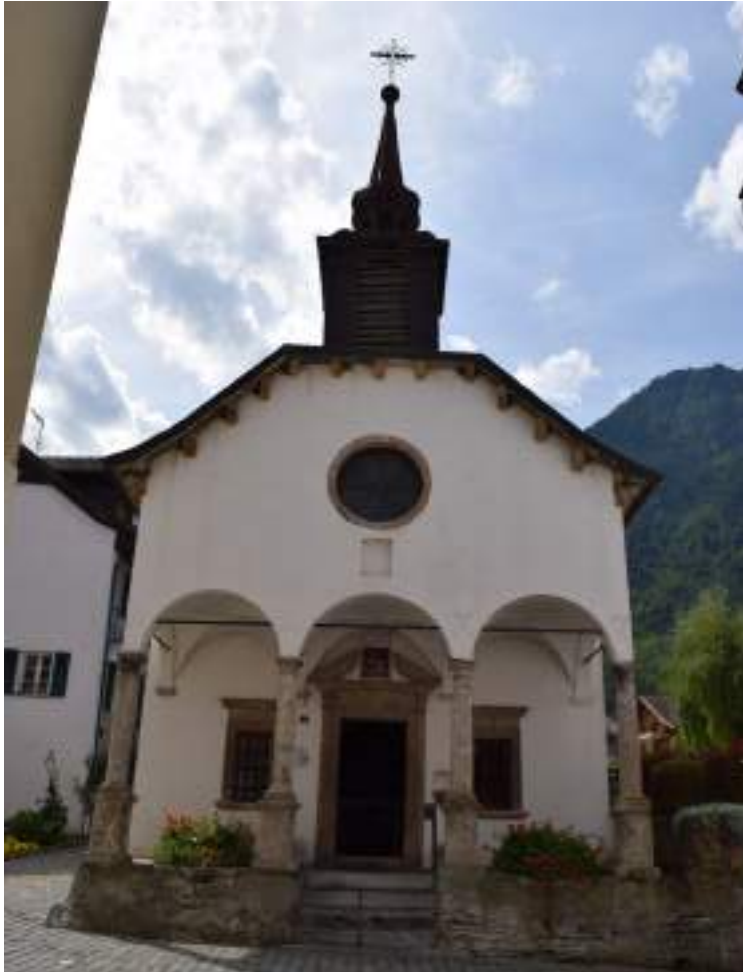
Fig. 11 - La chapelle de Riedmatten.