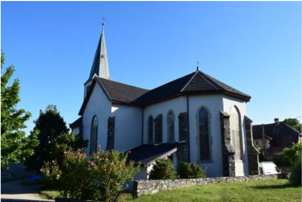
Fig. 14- Chef-lieu. Église paroissiale.