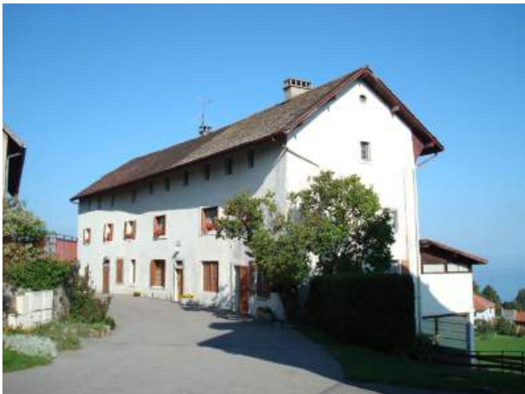
Fig. 7 - La maison des soeurs, vestige de l'ancien prieuré bénédictin.