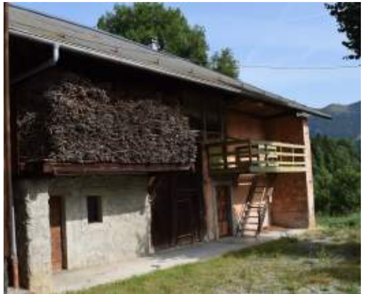
Fig. 3- Maison à Creusaz.