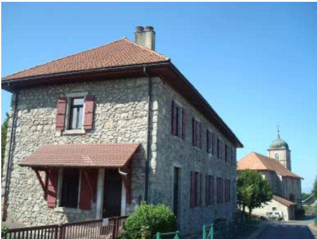
Fig. 5 - École.