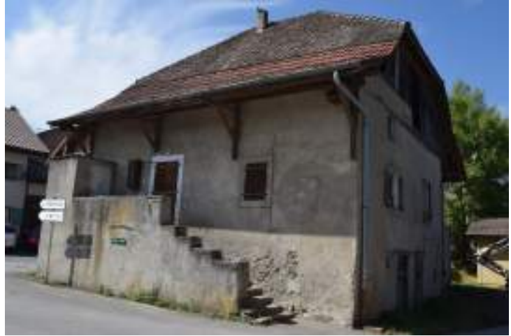
Fig. 12- Saint-Thomas. Maison au linteau de 1775.