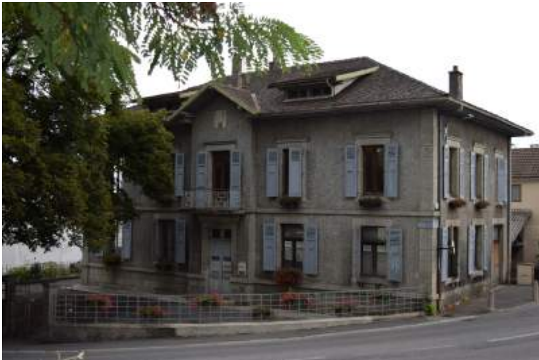
Fig. 4 - L'ancienne école du Chef-lieu.