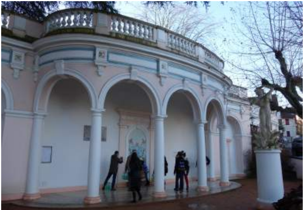
Fig. 17 - La buvette extérieure