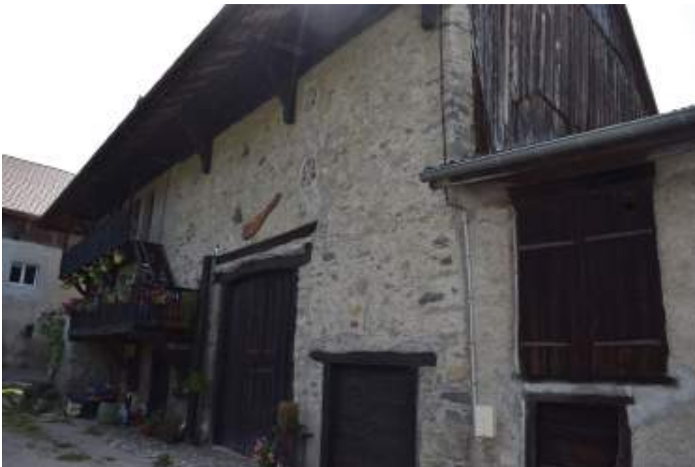
Fig. 8- Maison à Montigny

Initialement village de pêcheurs, Petite-Rive conserve encore quelques maisons anciennes dont l'une possède une très belle porte de molasse au linteau décoré d'une accolade (fig. 11), des granges, des bassins (dont l'un est partiellement détruit) et des maisons mitoyennes construites au bord de la rive du lac. Dès l'époque moderne, Petite-Rive devient un site de plaisance grâce aux fêtes organisées par les Blonay au Bois du bal. Puis, à l'époque contemporaine, une halte ferroviaire est construite en contrehaut du village, l'hôtel Lumina s'installe sur le Léman et des villas individuelles sont bâties. Le parc de Petite-Rive et de Grande-Rive (Neuvecelle) a été inauguré en 2014.