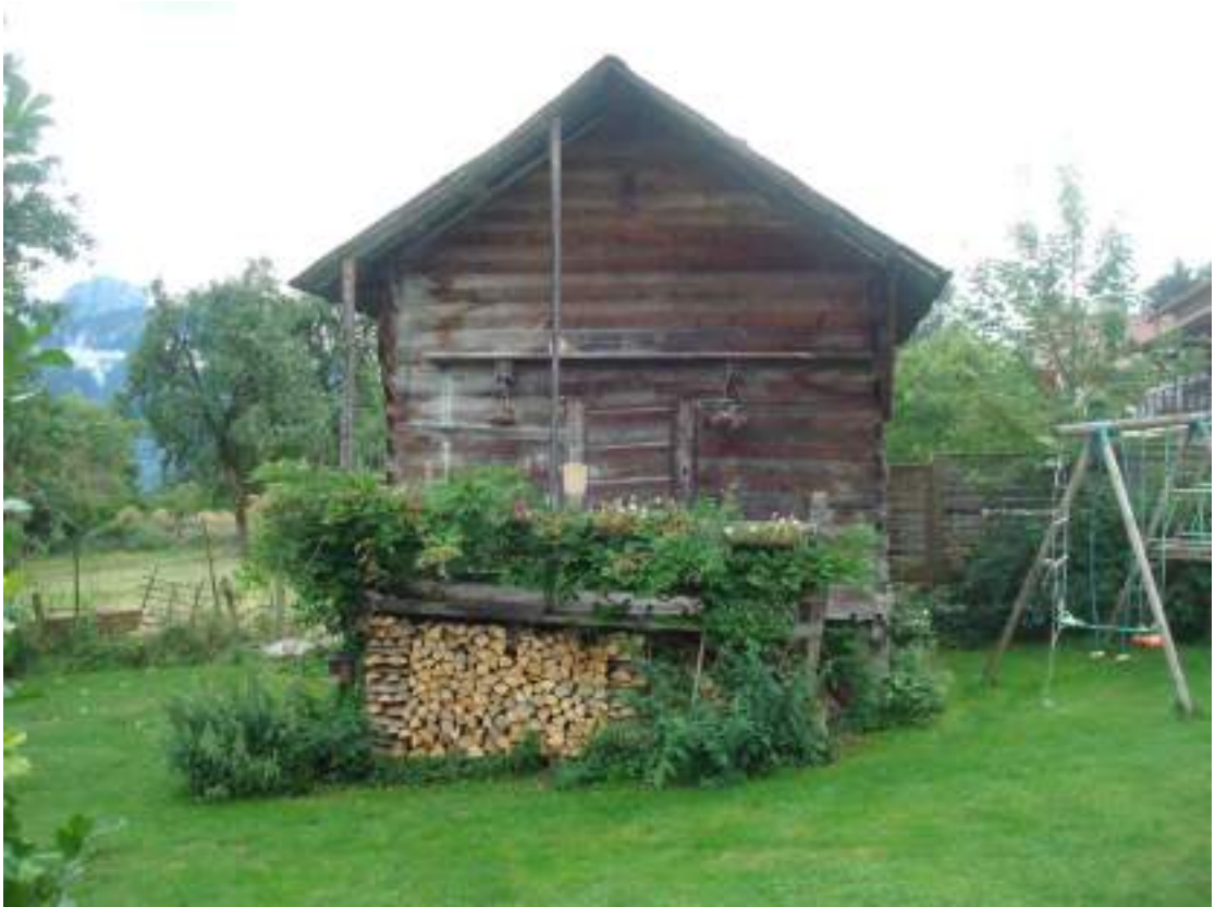
Fig. 8 - Grenier traditionnel au Chef-lieu.