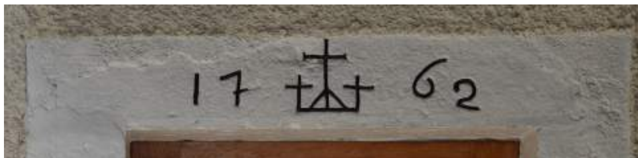
Fig. 12- Chef-lieu. Linteau gravé.