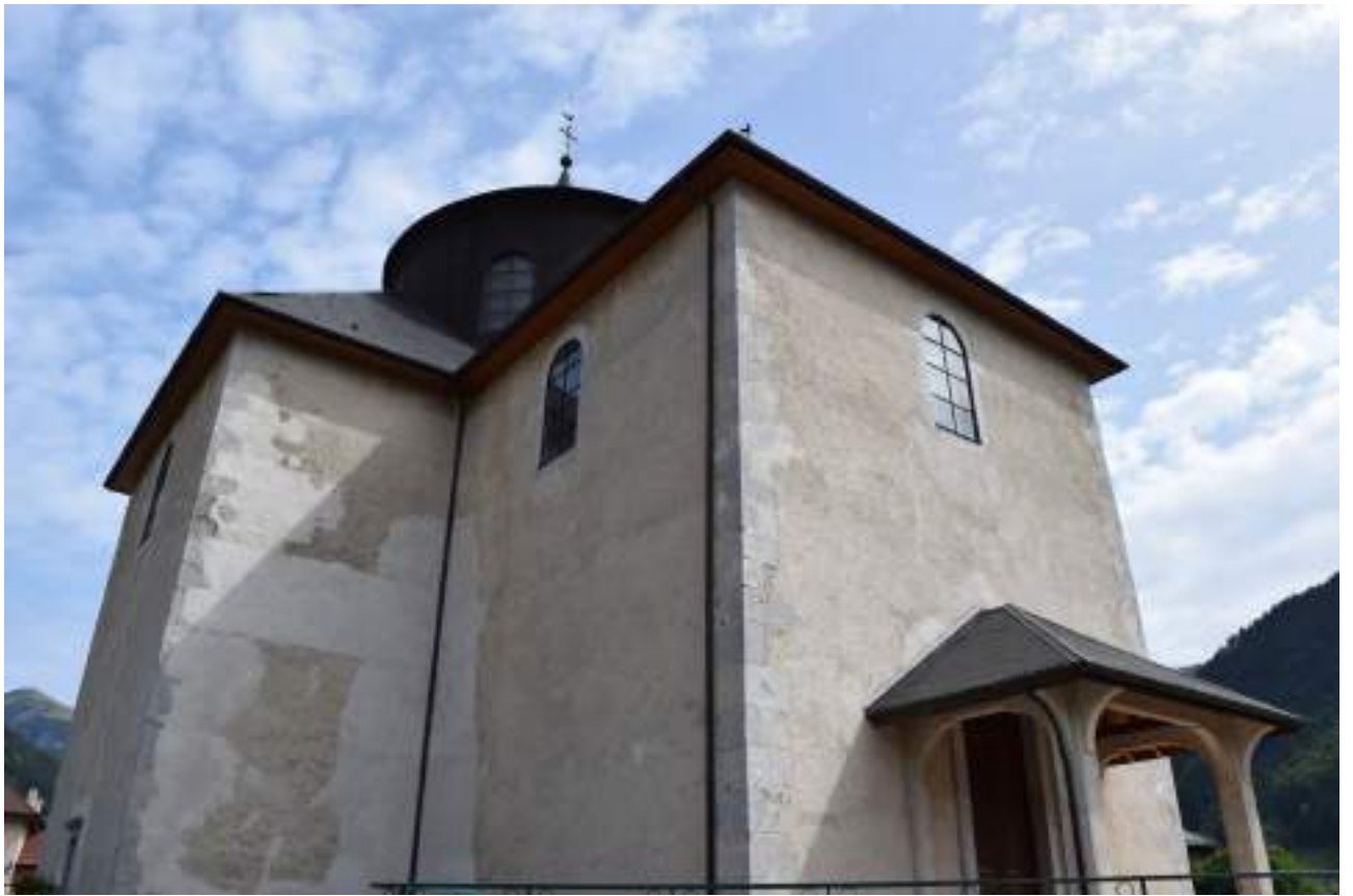
Fig. 26- L'église paroissiale Saint-Ours.