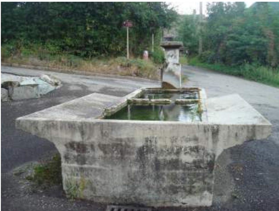
Fig. 13 - Mérou, bassin-lavoir.

Chez les Girard existent encore l'ancienne école des traverses (fig. 14) et quelques habitations anciennes. À Chaux, dernier village avant La Plantaz, une maison (fig. 15) et un grenier recouvert de tavillons (fig. 16) ont conservé leur cachet ancien.