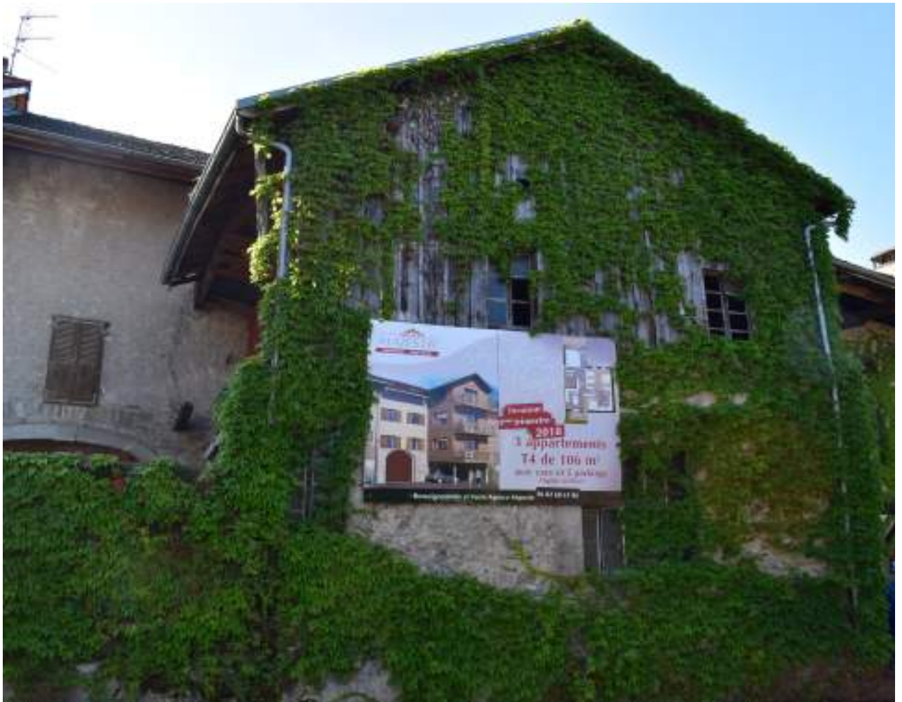
Fig. 10- Programme immobilier à la place d'une maison ancienne.