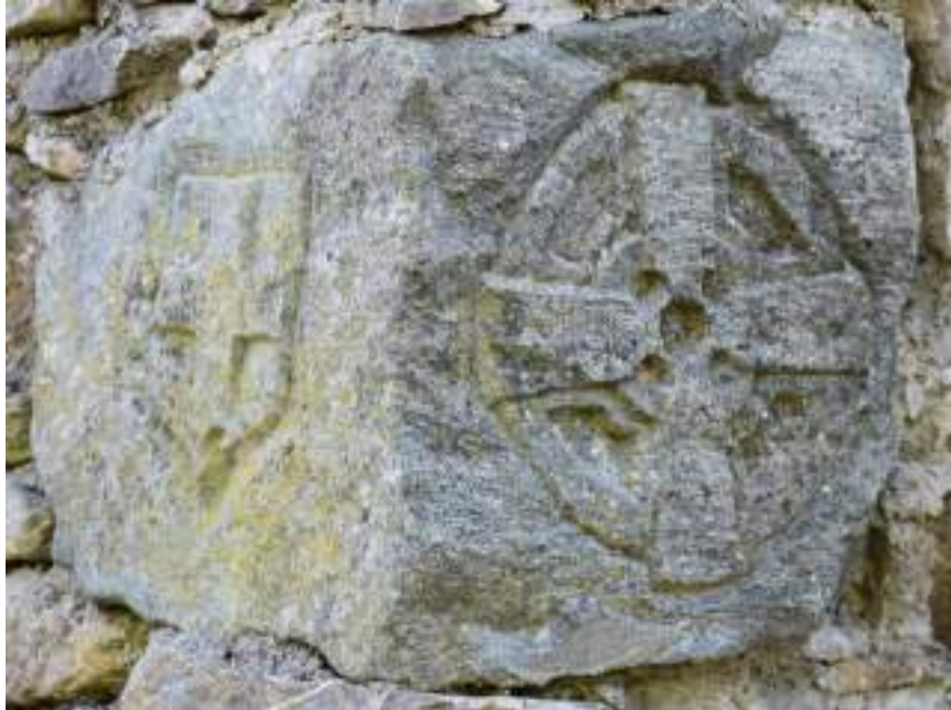
Fig. 7- Rouchaux. Pierre sculptée dont la provenance est incertaine et qui pourrait dater de l'époque contemporaine.