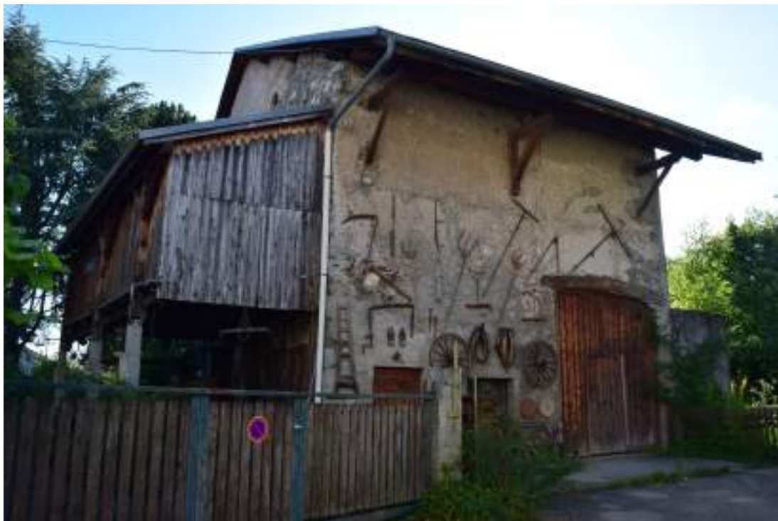
Fig. 16- Chef-lieu. Grange dont la porte date de 1831.