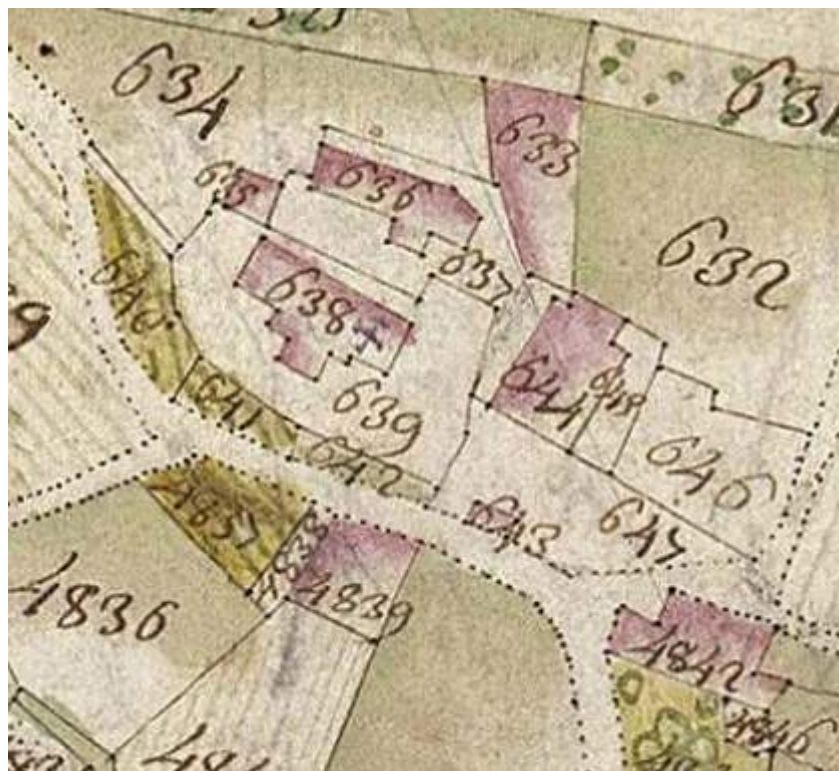
Fig. 13 - Le site prieural de Saint-Paul d'après le cadastre sarde: