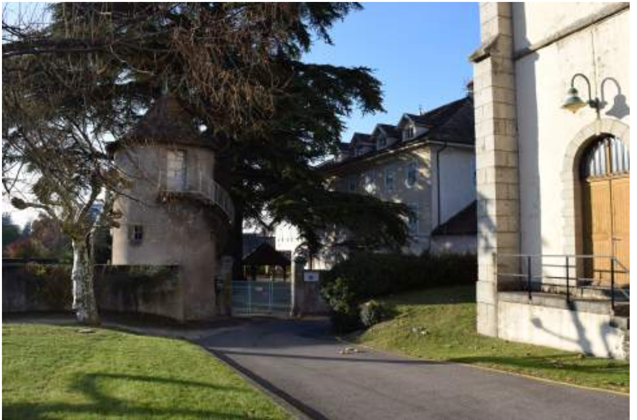
Fig. 4 - Neuvecelle, site du château et vestige de tour.