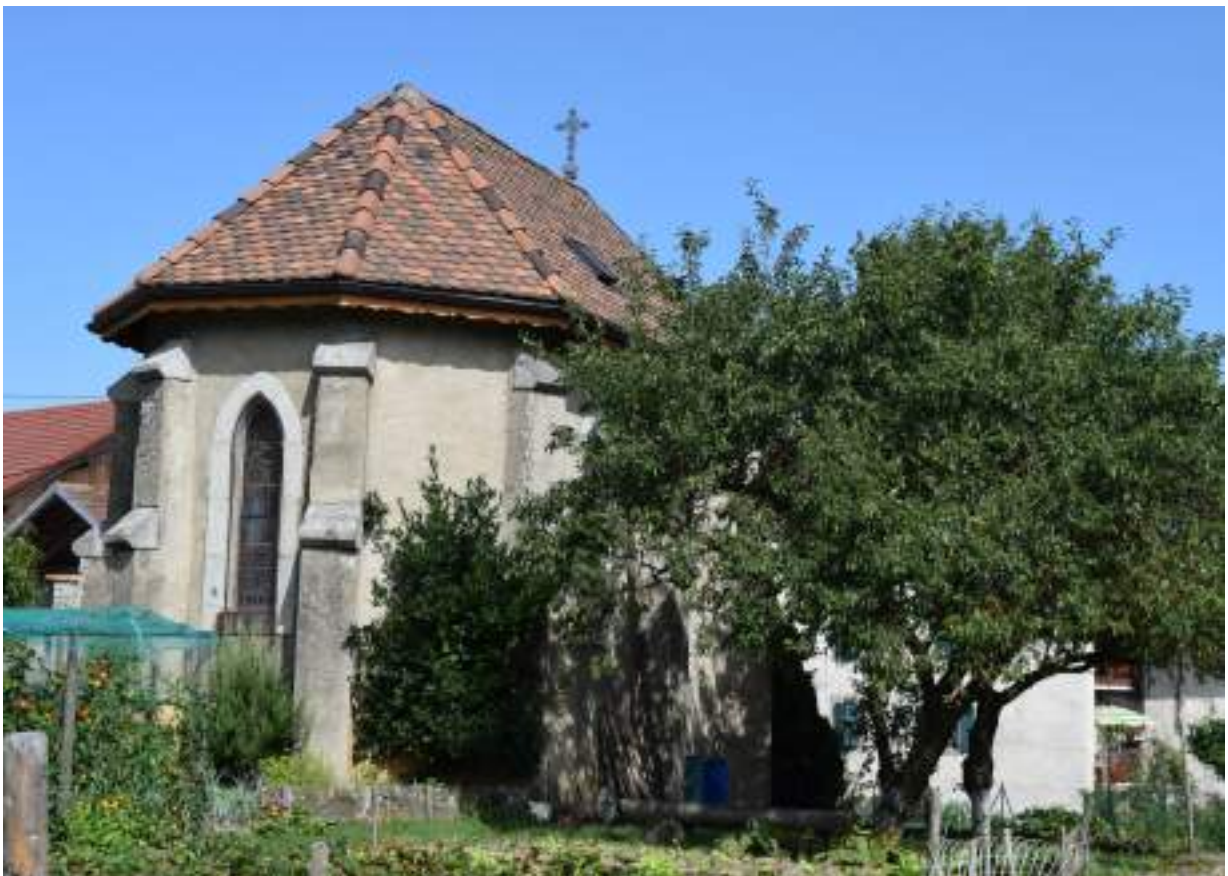
Fig. 7- Chapelle de Chez Crosson.

1630 qui rappelle la présence d'un cimetière de pestiférés installé dans le champ à côté. Un oratoire a été construit le long de la route de la Grange au Loup en 1890. Il est dédié à saint Joseph et à l'Enfant Jésus. Un autre oratoire dédié à la Paix a été construit lors de la Première Guerre mondiale face au cimetière.