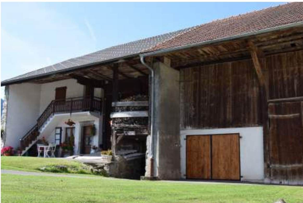
Fig. 18 - Habitat traditionnel à La Beunaz.