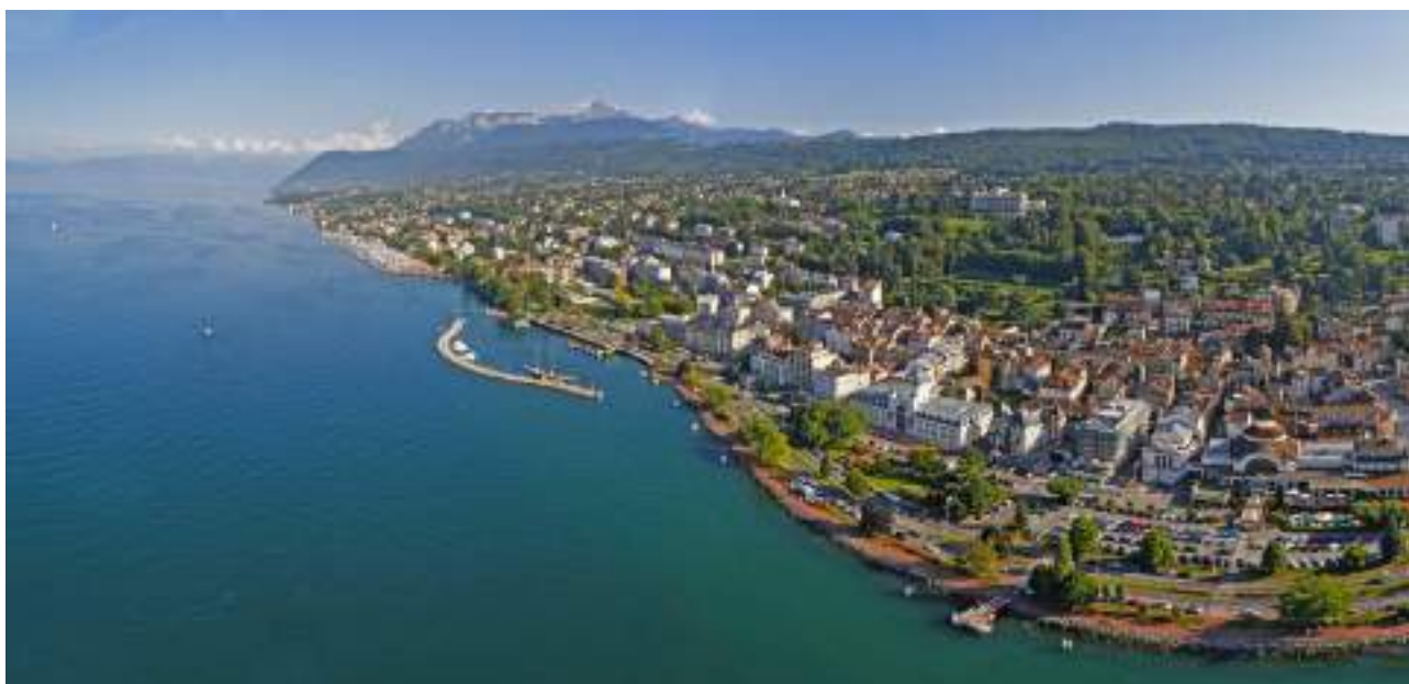
Fig. 1 - Vue panoramique d'Évian-les-Bains.

Le paysage de la ville d'Évian-les-Bains ne s'apprécie véritablement que depuis le Léman (fig. 1). Sur les eaux ou depuis les airs, c'est d'abord le lac, bordant la ville sur son extrémité nord, qui attire le regard. Le quai Baron de Blonay, édifié dans la seconde moitié du XIX e siècle, permet au badaud d'admirer certains des plus beaux bâtiments de l'époque du thermalisme, tels les anciens thermes, le théâtre municipal, le casino, la villa Lumière (actuel hôtel de ville), etc. Légèrement en contrehaut se trouve ce qui reste de la vieille ville d'Évian, édifiée à partir du XII e siècle. Si le bâti ancien est faiblement représenté, la rue nationale, les rues descendant au lac et le dédale de passages et de gaffes, sont basés sur l'urbanisme médiéval (fig. 2). Au niveau supérieur se trouve le domaine des parcs et des hôtels : parc de l'ancien hôtel Splendide, parc et hôtel du Royal. Non loin, le clocher de Neuvecelle dépasse des bois et permet de localiser le site de son ancien château fort qui dominait la ville avant sa destruction. Les environs d'Évian-les-Bains sont principalement composés des bois du talus du plateau de Gavot, tandis qu'à l'ouest se dressent les massifs préalpins des Mémises et de la Dent d'Oche.