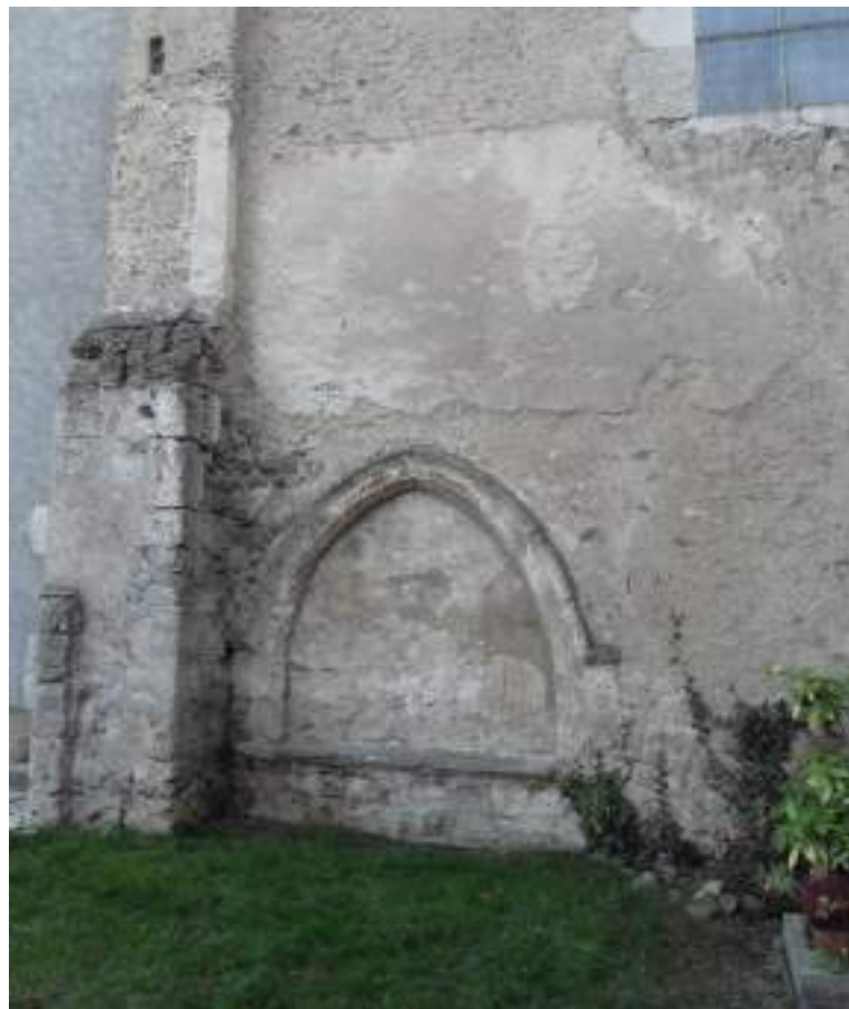
Fig. 3 - L'ancienne chapelle qui ornait le tombeau des Blonay au prieuré Saint-Paul.