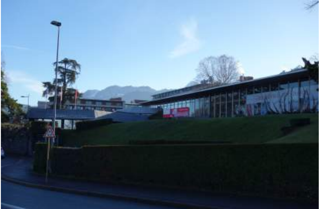
Fig. 25 - Buvette Novarina-Prouvé.