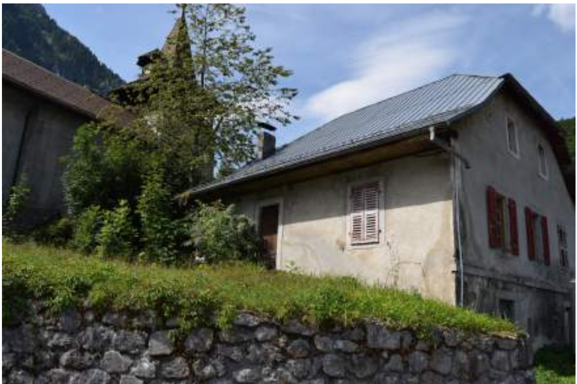
Fig. 7 - Ancien presbytère.