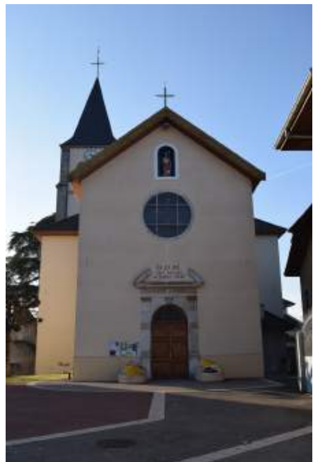
Fig. 6 - Nouvelle église paroissiale.