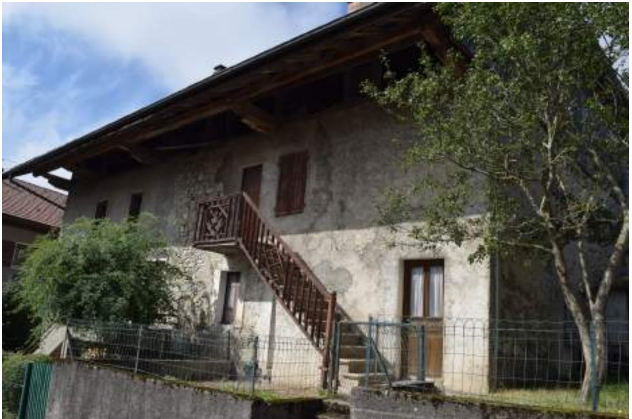
Fig. 10- Maison au Chef-lieu, rue de la forge.