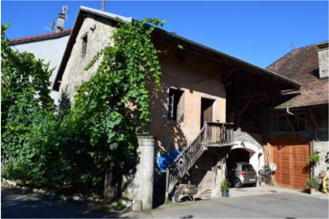
Fig. 6- Rouchaux. Vigne sur crosses et maisons anciennes.