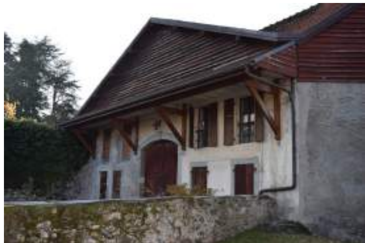
Fig. 8 - Maraîche. La maison abbatiale.