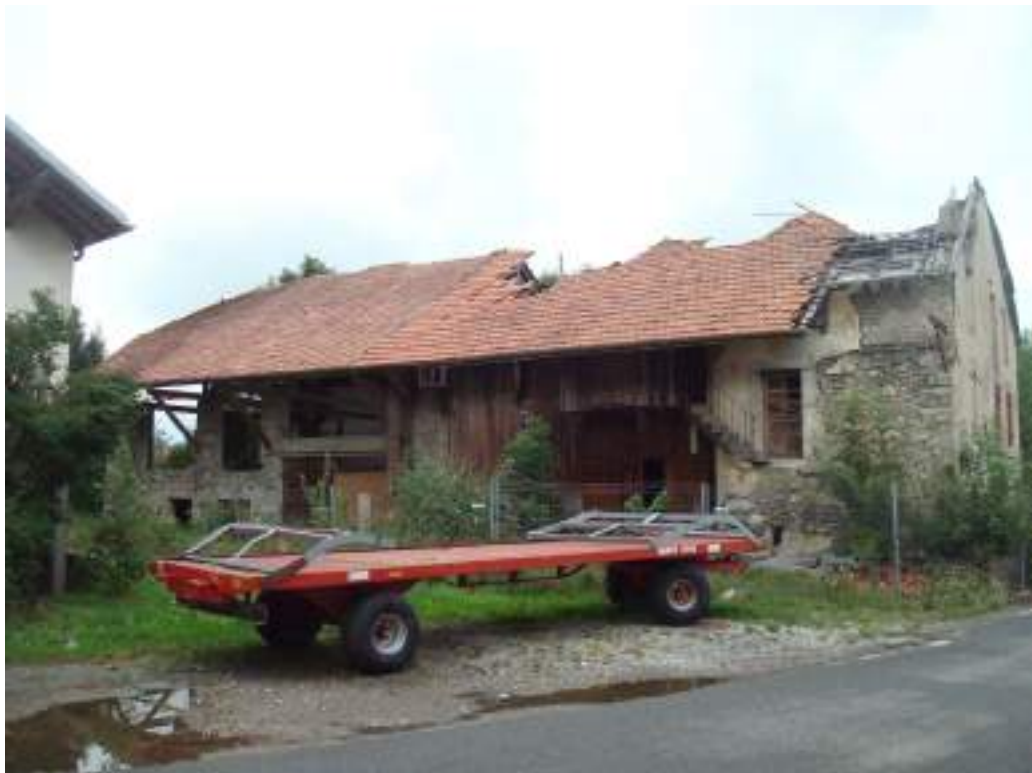
Fig. 11 - Maison traditionnelle abandonnée.