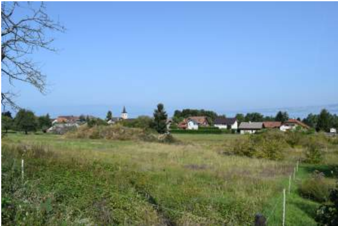
Fig. 3- Village de Maxilly.