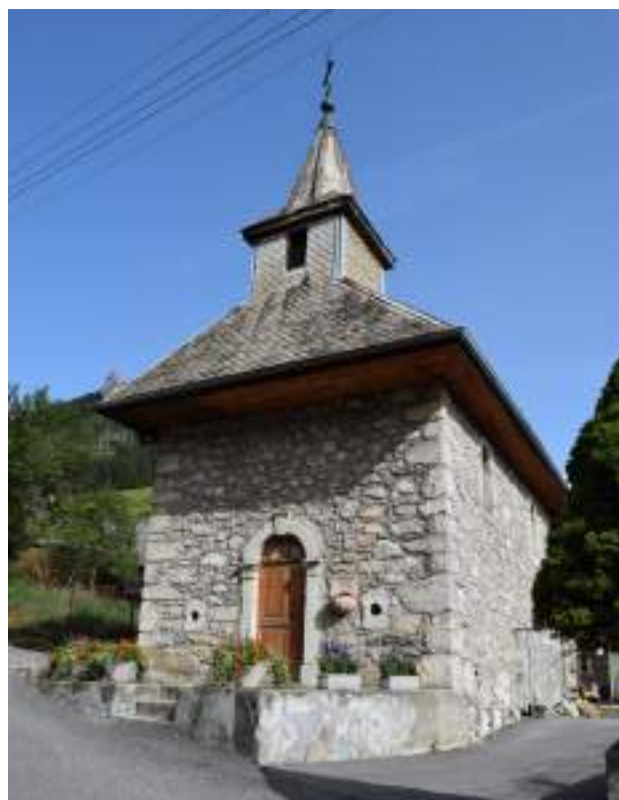
Fig. 21- Chapelle de Creusaz.