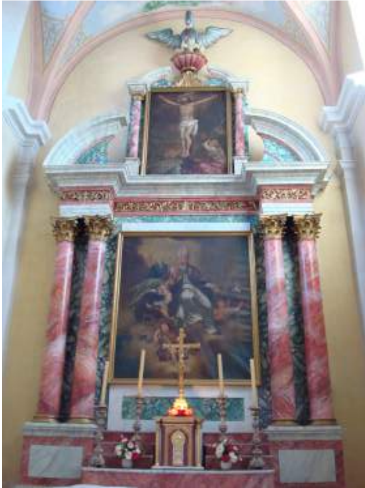
Fig. 2 - Retable de l'église.