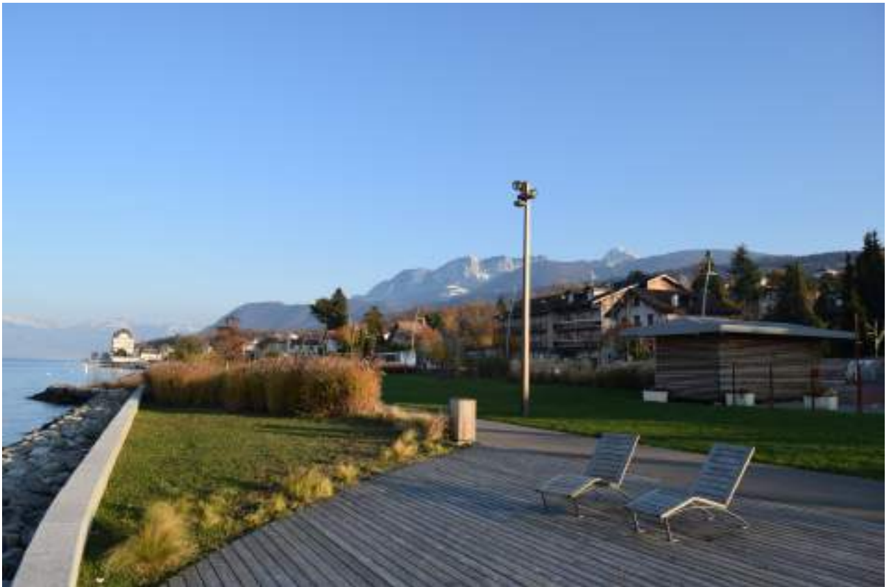
Fig. 1 - Neuvecelle, parc de Grande-Rive.