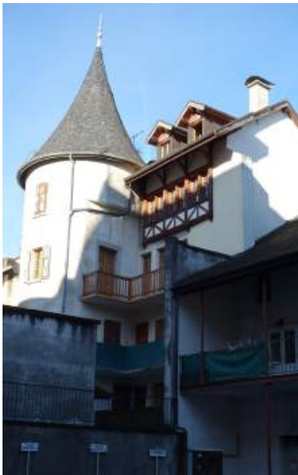
Fig. 11 - Tour de l'ancien rempart.