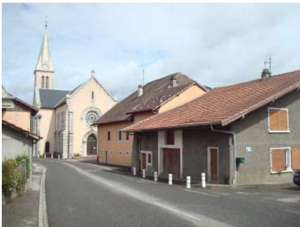
Fig. 4 - Le Chef-lieu de Vinzier.