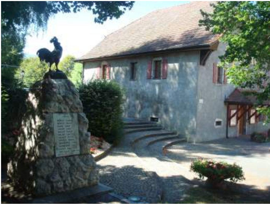
Fig. 4 - Monument aux morts et mairie.