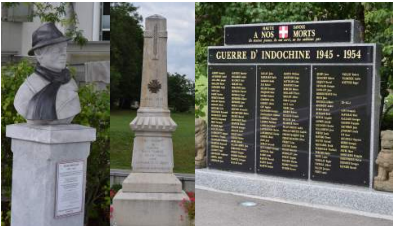
Fig. 2 - Esplanade Jean Moulin et monuments commémoratifs.