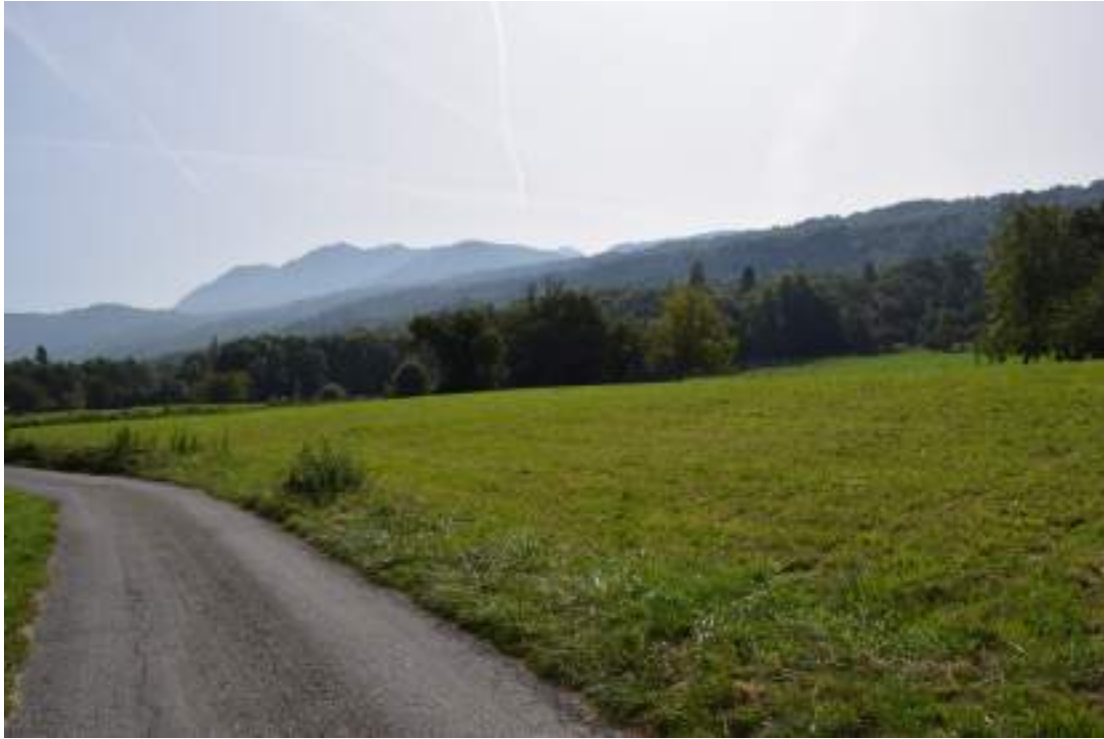
Fig. 2- Vue sur le massif des Mémises depuis l'arboretum.