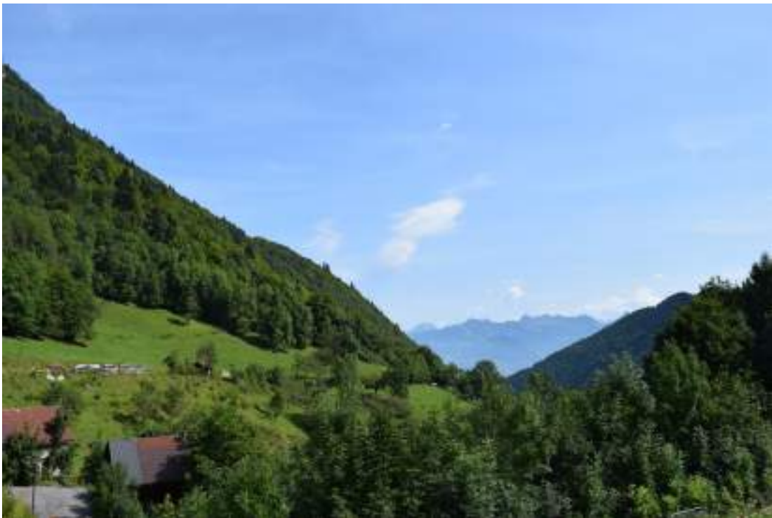
Fig. 1 - Vue sur les Préalpes suisses depuis le village de Novel.

- « Le clos des fourches » : ancien lieu d'exécution entre Saint-Gingolph et Novel.