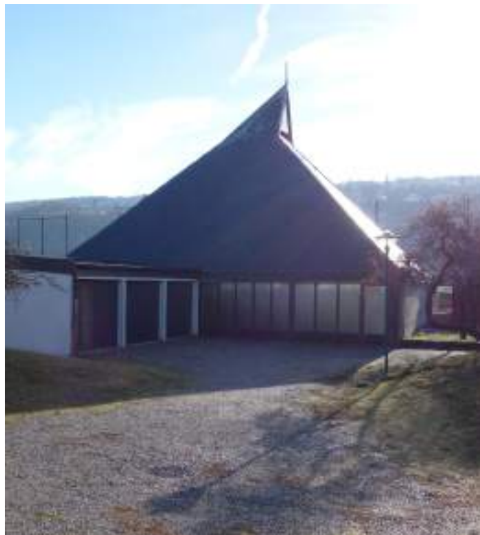
Fig. 7 - Chapelle Notre-Dame de la Rencontre.