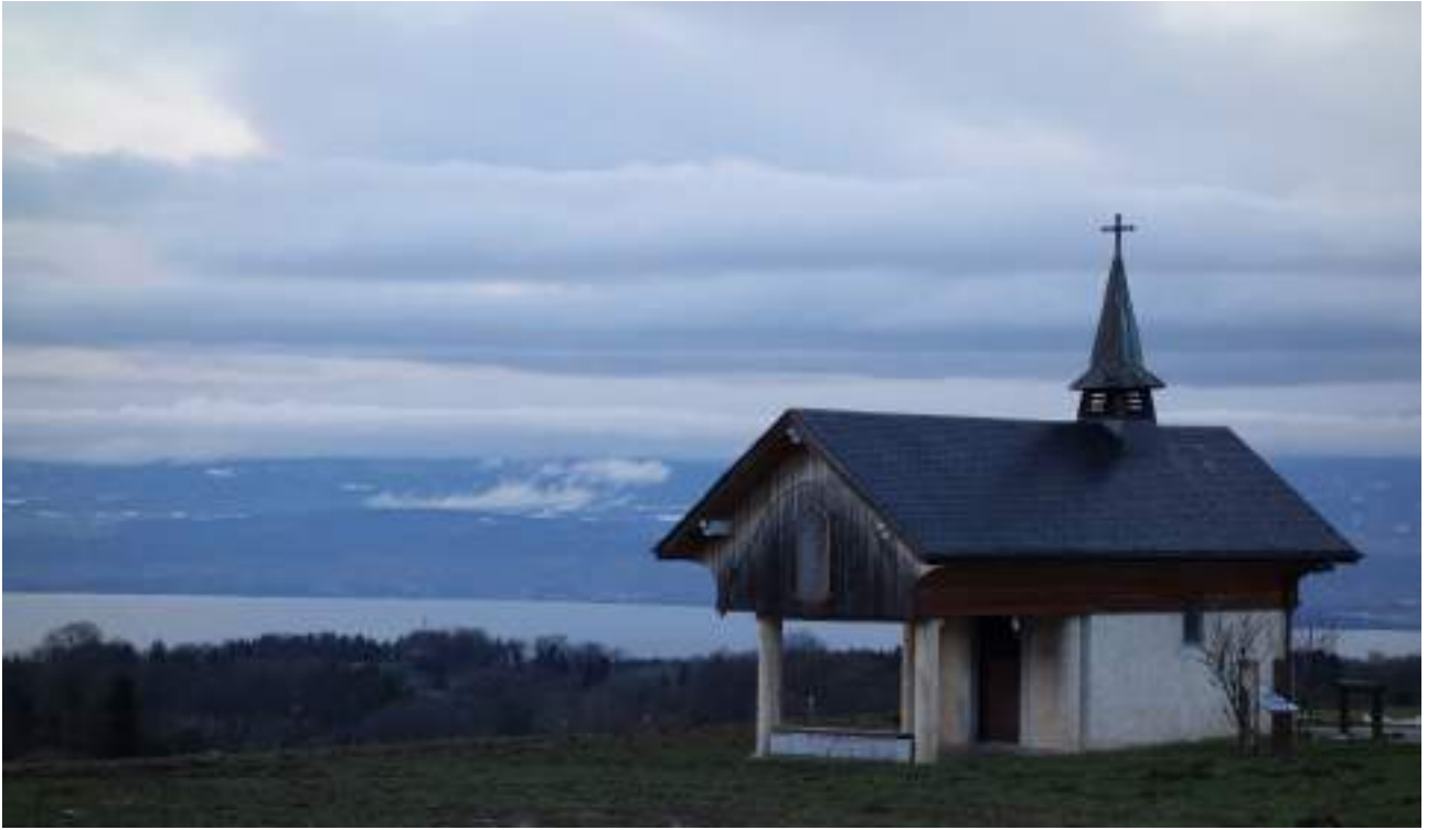
Fig. 4- Chapelle de Champeillant.