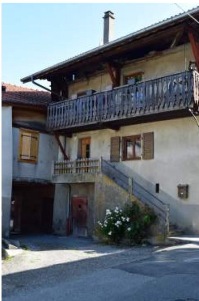
Fig. 8- Marinel. Gaffe entre deux maisons.

Sur la route de Publier, le village de Moruel jouit d'une belle vue sur le Léman. Là aussi, les maisons sont construites proches les unes des autres, sans toutefois être accolées. Comme à Marinel, la place est ornée d'un bassin double et d'une croix de carrefour. L'habitat traditionnel y est représenté par d'anciennes maisons et granges (fig. 11), dont certaines ont été restaurées dans le respect de leur caractère traditionnel (fig. 12).