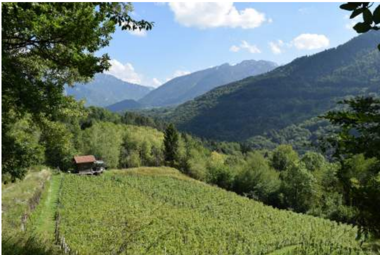
Fig. 1- Vignes et vue sur la vallée d'Abondance depuis Les Vaux.

Implanté à l'extrémité sud-ouest du plateau de Gavot, la commune de Féternes jouit de paysages variés. Depuis Thonon, on y accède en empruntant la route des vallées d'Abondance et d'Aulps et en longeant la rivière de la Dranse, dont la confluence se trouve à l'extrémité sud de la commune au lieu-dit Bioge. Entre le fond de la vallée de la Dranse et le sommet du talus du plateau, le paysage était anciennement caractérisé par les vignes du Plan Fayet au nord. Abandonnées dans l'entre-deux-guerres, ces vignes en terrasses sont visibles sur d'anciennes cartes postales, et faisaient partie de l'identité de la commune. Aujourd'hui, le promeneur peut partir sur les traces des anciens vigneron en arpentant ces terrasses au moyen d'escaliers maçonnés et en découvrant une ancienne cave creusée à flanc de talus (fig. 3). Le talus est dorénavant le territoire des bois : du Plan Fayet jusqu'à La Plantaz, la forêt a recouvert les traverses de Féternes. Seule une parcelle de vin subsiste Sous les Vaux. Depuis cet écrin de vigne préservée, le promeneur bénéficie d'une vue sur la vallée d'Abondance et sur les montagnes de La Forclaz. Il en est de même depuis le village de Les Vaux en contrehaut, ainsi que de Vougron, du Flon et de La Plantaz.