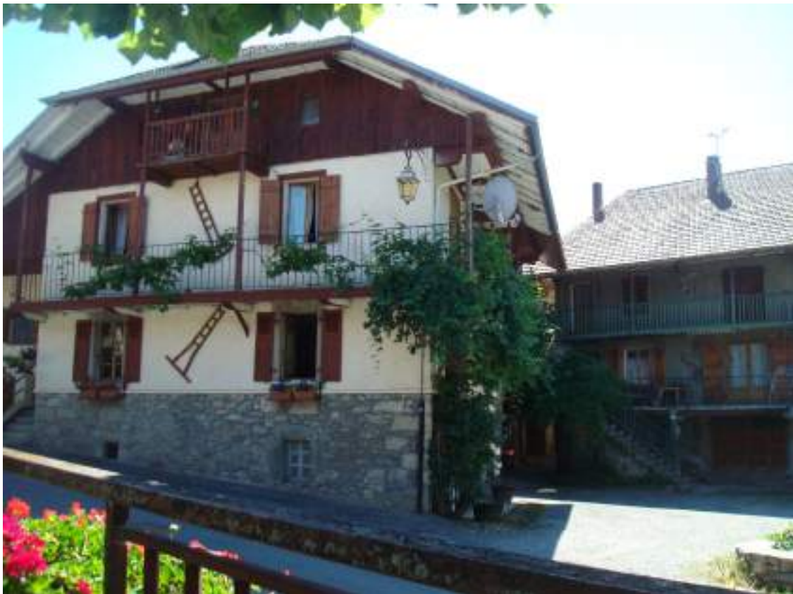
Fig. 8 - Galerie de bois.

Quelques autres exemples d'architecture traditionnelle peuvent être admirés aux Granges (fig. 11) et à Saint-Martin. À Darbon se trouve l'ancien moulin (fig. 12).