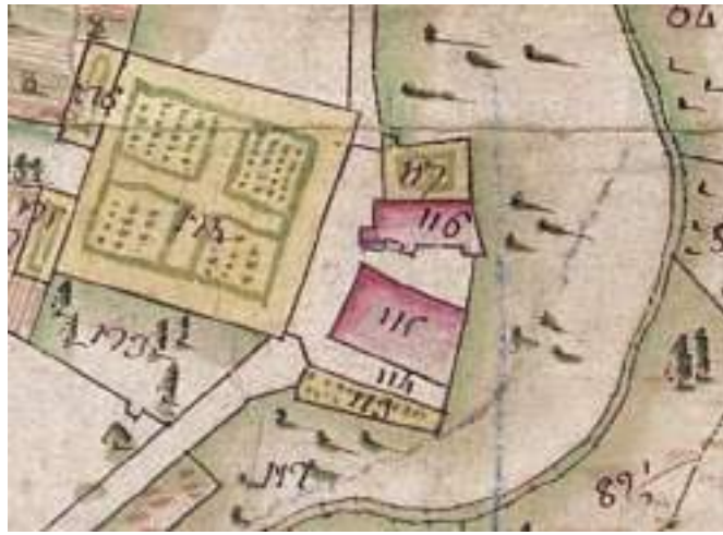
Fig. 5- Château de Maxilly sur la mappe sarde.