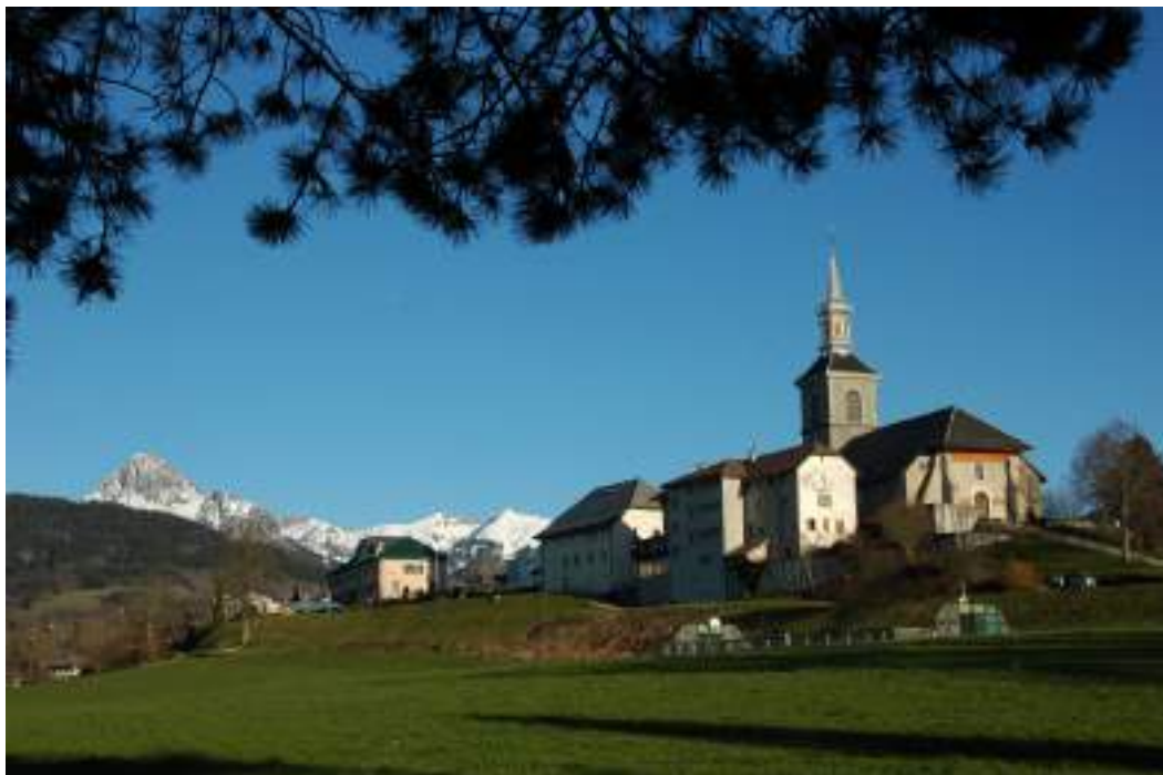
Fig. 1 - Chef-lieu de Saint-Paul (Mairie de Saint-Paul).