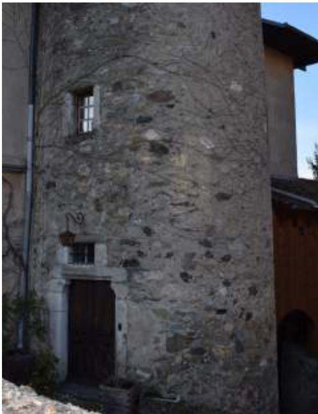
Fig. 5 - Tour de la maison forte de la Place.