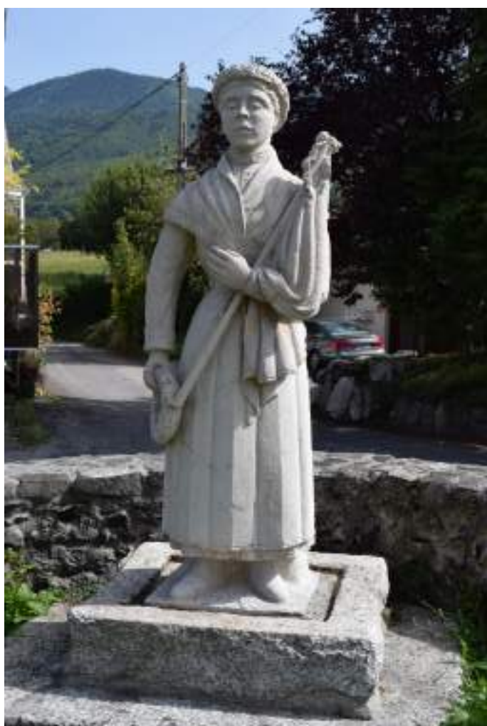
Fig. 5- La Lulu.