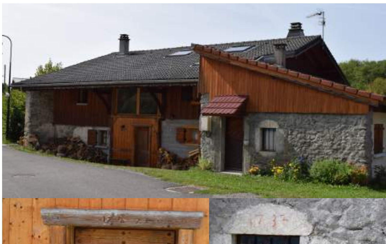
Fig. 20- Les Crêts. Maison ancienne restaurée et linteaux millésimés.