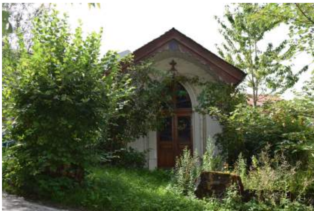
Fig. 24- Chapelle des Bétemps.