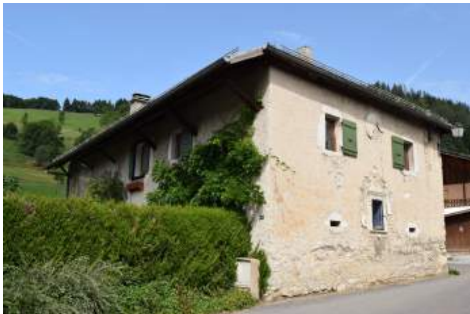
Fig. 16- Trossy. Maison ancienne.