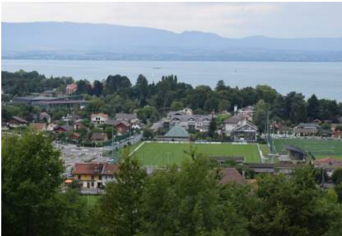
Fig. 8 - Amphion-les-Bains.