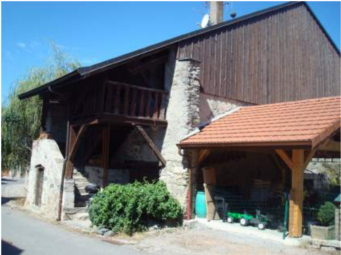
Fig. 9 - Maison entretenue dans le village.