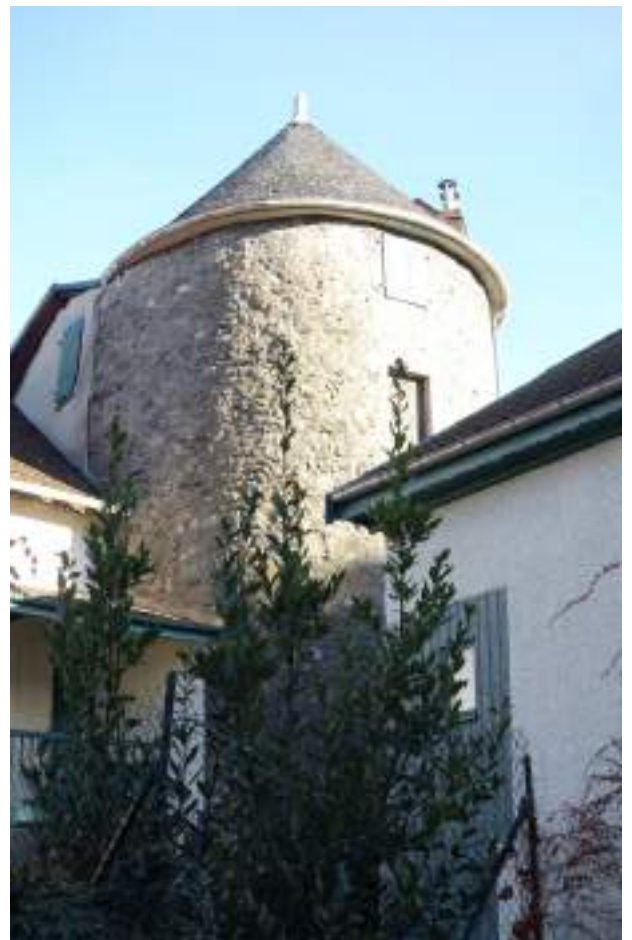
Fig. 12 - Tour de l'ancien rempart.