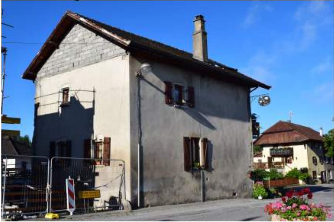
Fig. 11 - Ancienne maison noble de Saint-Paul.