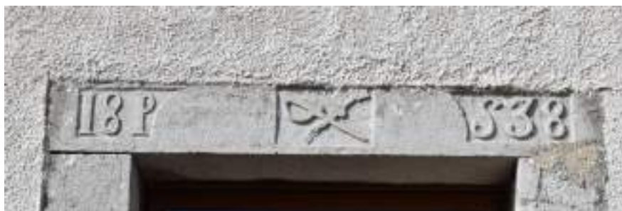
Fig. 8- Linteau gravé.

deux maisons attenantes ont été entièrement restaurées : si les fenêtres n'ont pas été agrandies, on regrettera l'installation de velux dans la première et la visibilité des paraboles (fig. 7). Le linteau d'une des portes de la seconde est millésimé : la date de 1838 encadre un fusil et un sabre qui se croisent (fig. 8). Plusieurs maisons sont recouvertes de tavillons.