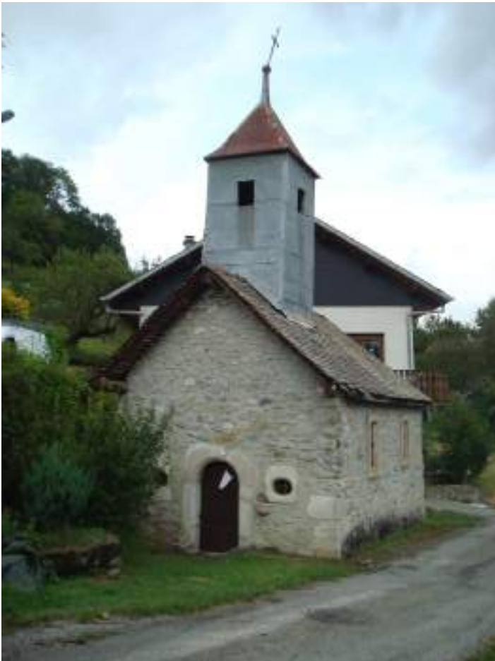
Fig. 5- Chapelle de La Plantaz.