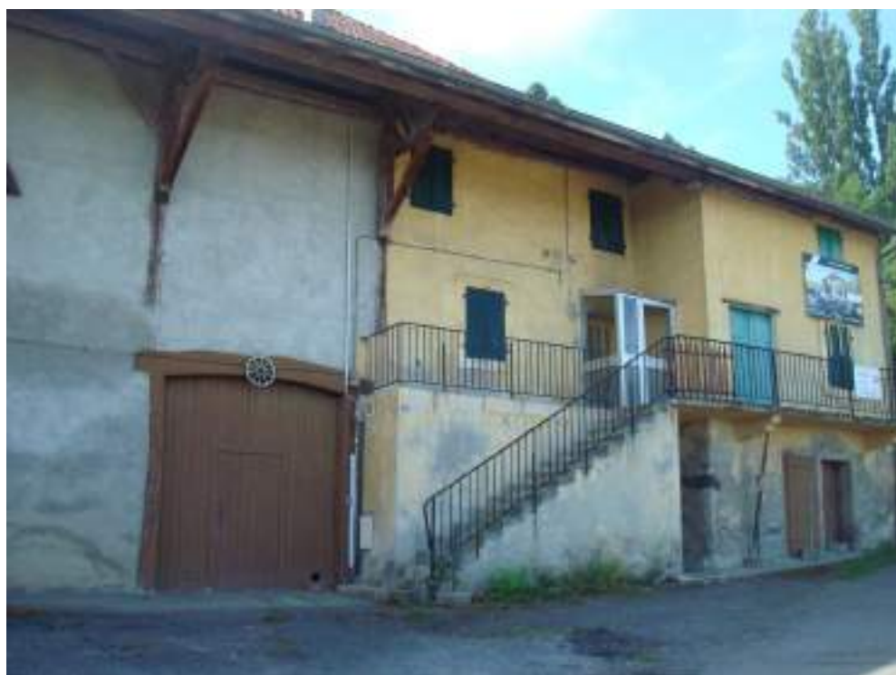
Fig. 9 - Avulligoz. Maison ancienne qui devait être transformée en immeuble résidentiel et qui a été rachetée par des particuliers souhaitant conserver son caractère traditionnel.