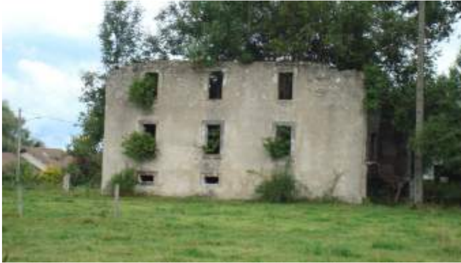
Fig. 12 - Maison incendiée après la Seconde Guerre mondiale.

Le village de Mérou est le premier à être traversé par la route départementale 121 en provenance du Chef-lieu et en direction de Féternes. Un bassin-lavoir (fig. 13) peut être aperçu non loin du carrefour où a été bâti un oratoire. Quelques granges anciennes subsistent, mais l'habitat est globalement moderne.