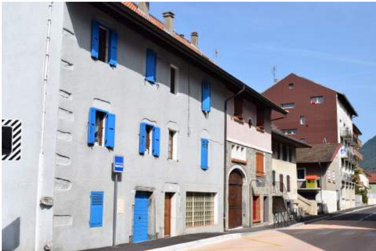
Fig. 7- Tourronde et ses maisons le long de la route nationale.