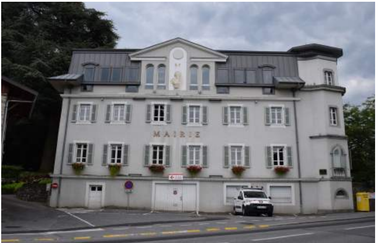
Fig. 11 - Maison Davet-Jenkins. Actuelle mairie.