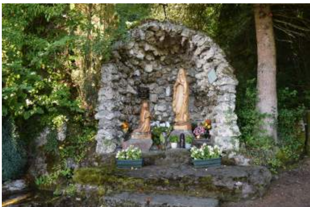
Fig. 14 - La grotte de Roseires.