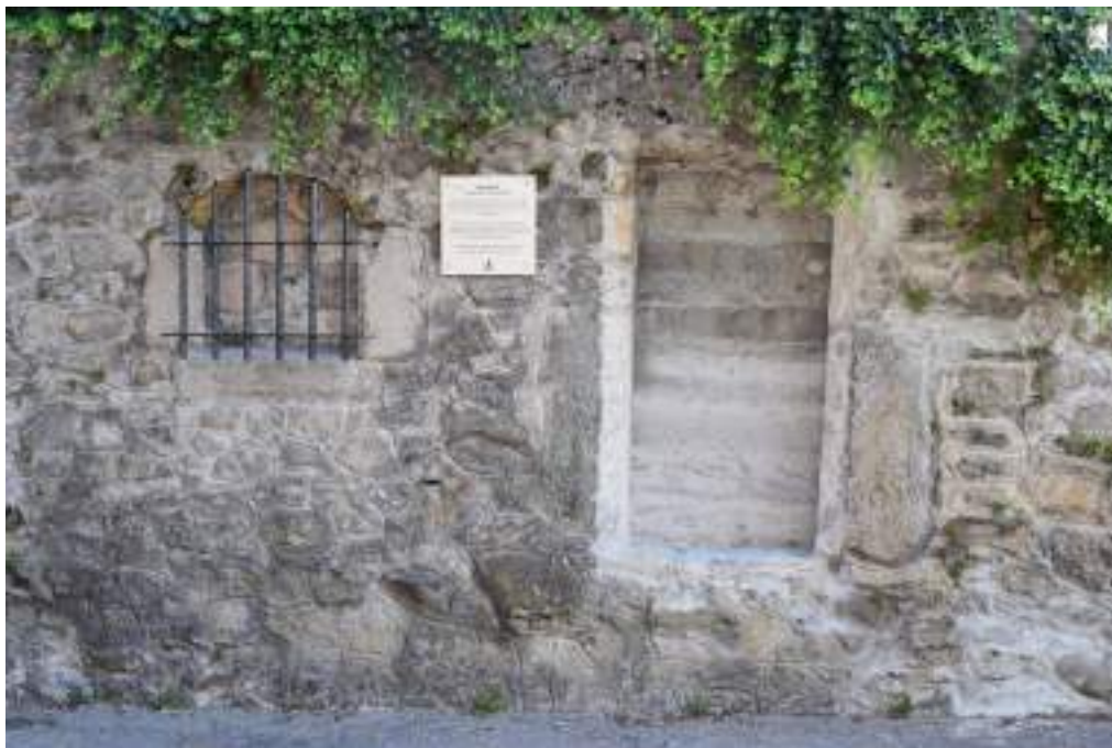
Fig. 9 - Ancienne prison du Chef-lieu en cours d'aménagement.