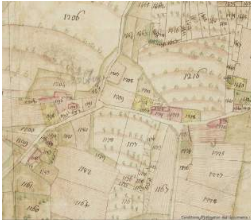
Fig. 7 - Maraîche. À gauche, la chapelle et la maison abbatiale. À droite, le domaine des religieux dont leur maison (n° 1217).