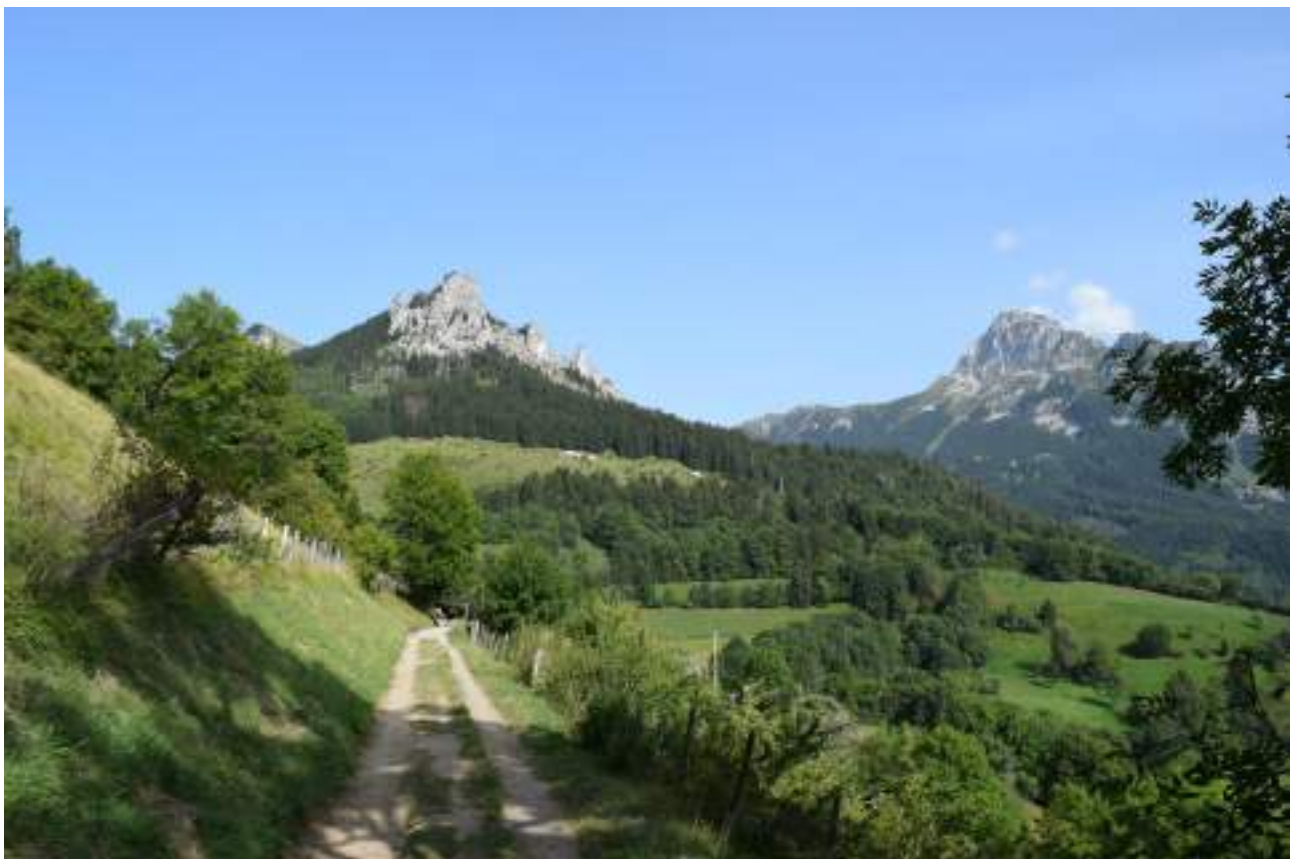
Fig. 2- Chemin entre Bénand et Creusaz. Le mont César et la Dent d'Oche.