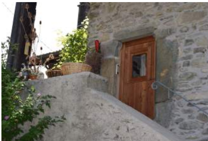
Fig. 7- Porte de la seconde tour à l'arrière.

Au sud se trouvent les vestiges d'une autre tour (fig. 7), prise aujourd'hui dans une maison plus grande (il semble que c'était déjà le cas lors de la mensuration pour le cadastre). Une autre porte moderne, au chambranle décoré, se trouve en hauteur et est aujourd'hui accessible par des escaliers maçonnés. Le long de la façade nord de cette tour, une extension a été construite. Celle-ci devait abriter une grange.