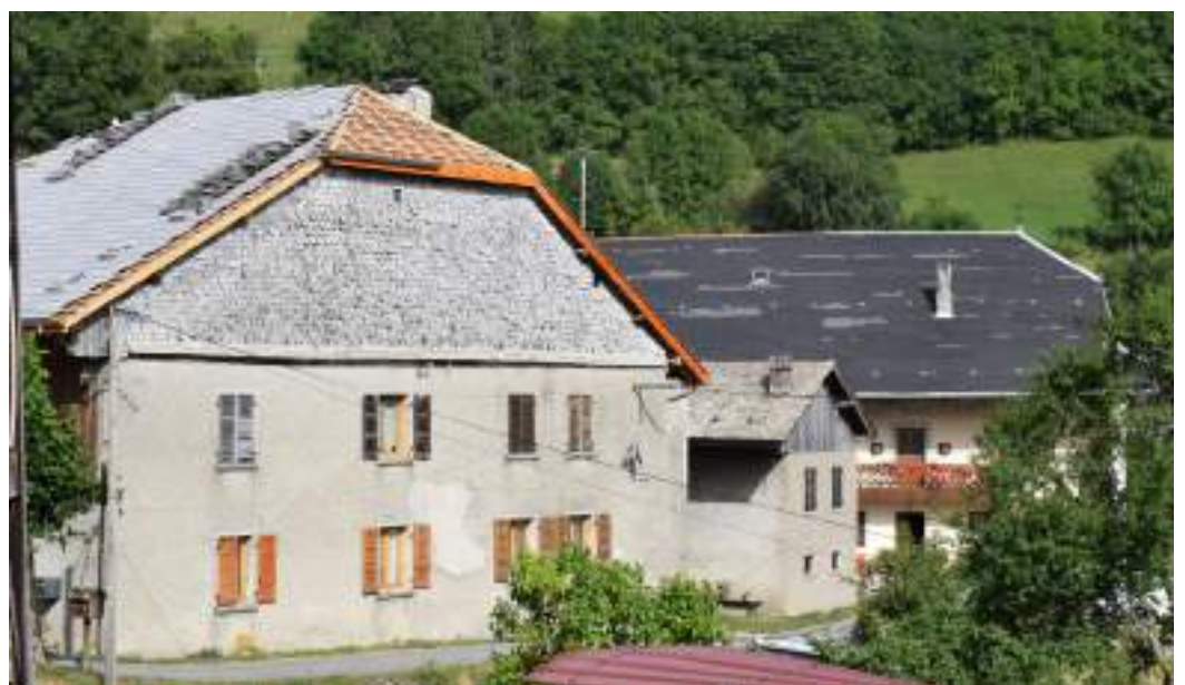
Fig. 5- Maisons bloc à Creusaz.