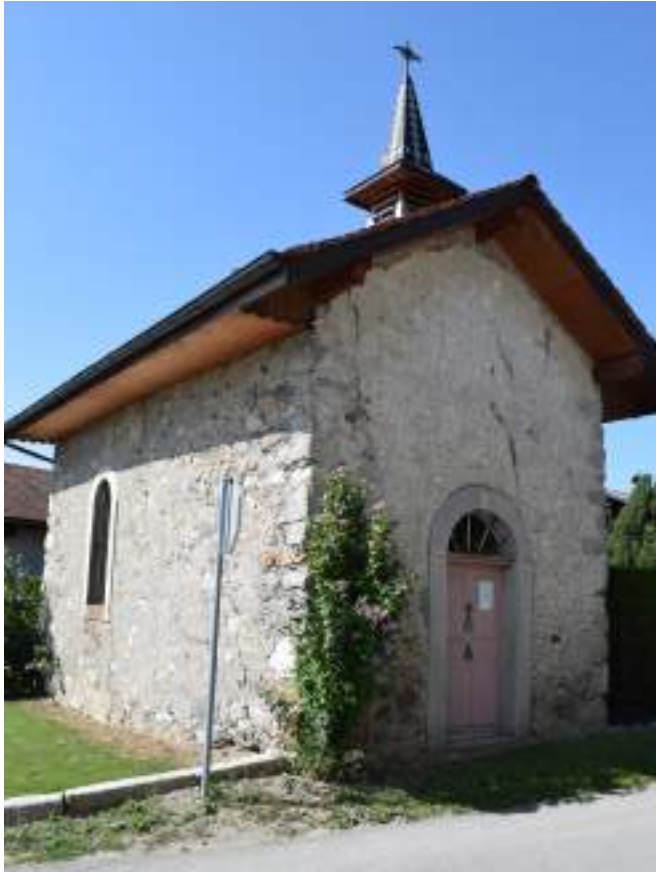
Fig. 6- Chapelle de Chez Portay.