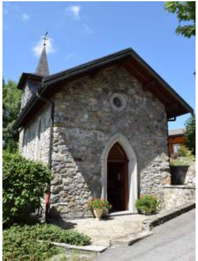
Fig. 15 et 16 - Les chapelles de La Beunaz et de Lyonnet.

Le village de Saint-Paul possède de beaux exemples d'habitat traditionnel, en particulier dans les villages de Chez Thiollay (fig. 17), de La Beunaz (fig. 18), des Faverges, de Roseires, de Chez Bochet (fig. 19).