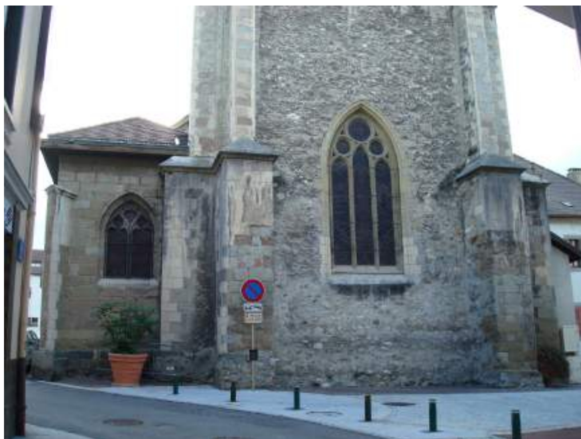
Fig. 6 - Clocher de l'église paroissiale et triplet gothique.