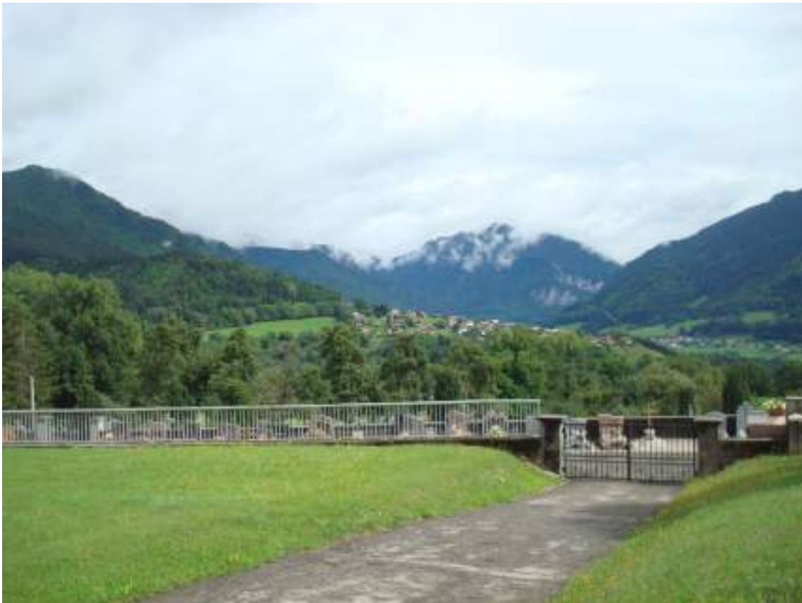
Fig. 1 - Vue sur la vallée d'Abondance depuis le Chef-lieu.