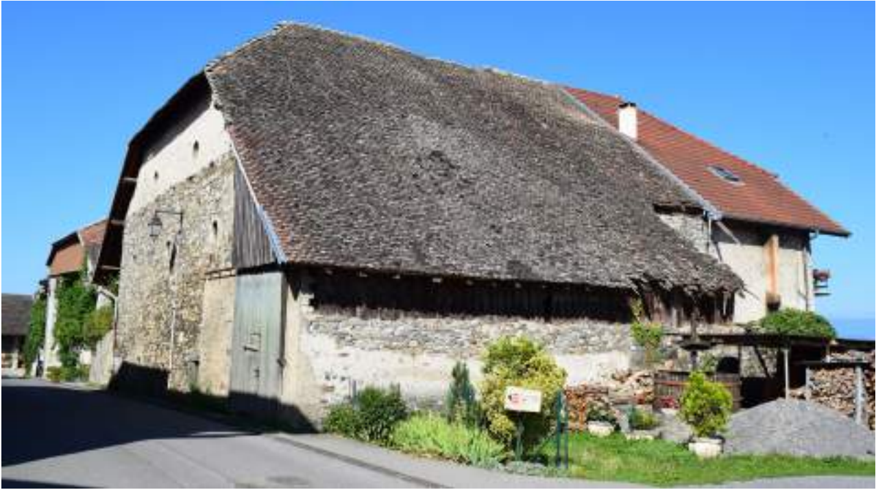
Fig. 11- Moruel. Maisons anciennes.