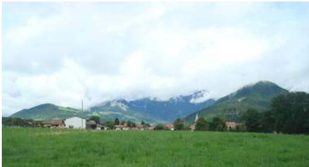
Fig. 3 - Vinzier (vue prise depuis l'ouest).