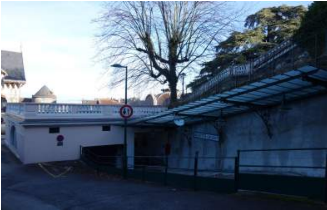
Fig. 16 - Arrêt du funiculaire à la buvette Cachat.