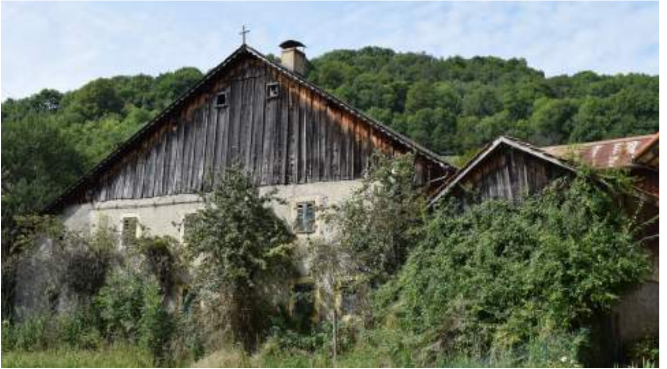
Fig. 13- Chef-lieu. Maison ancienne.