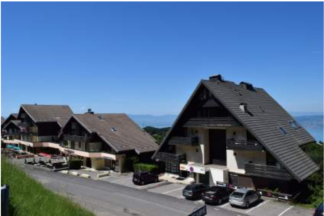
Fig. 11- Architecture du XX e siècle, village de La Station.