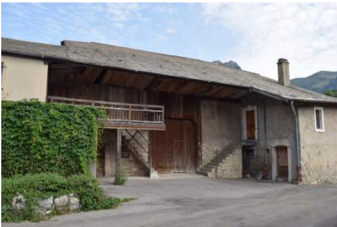
Fig. 15- Trossy. Maison ancienne.