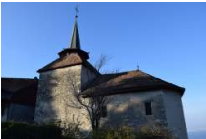
Fig. 8 - Maraîche. La chapelle.