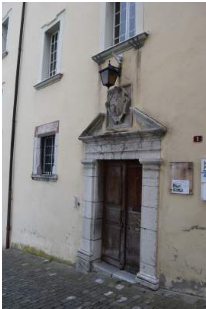
Fig. 13 - Porte de l'ancienne maison forte.