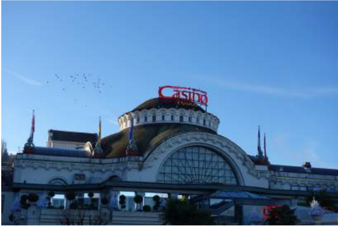
Fig. 24 - Casino.