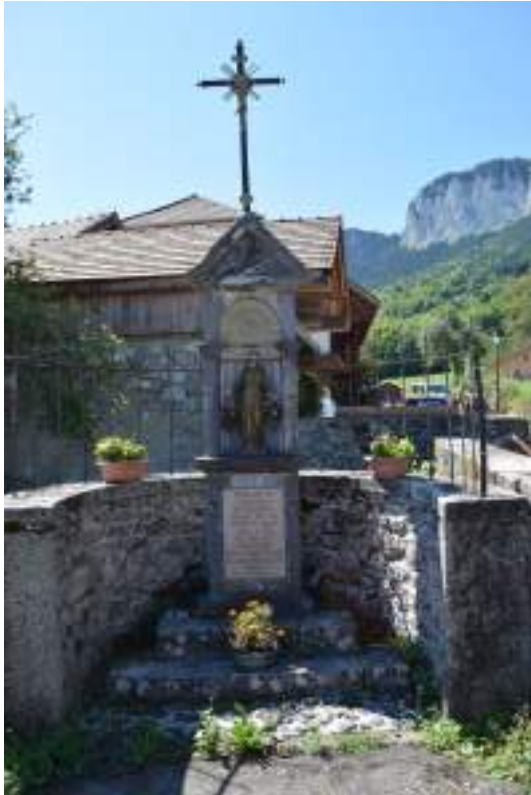
Fig. 5- Oratoire Chez les Vesin.