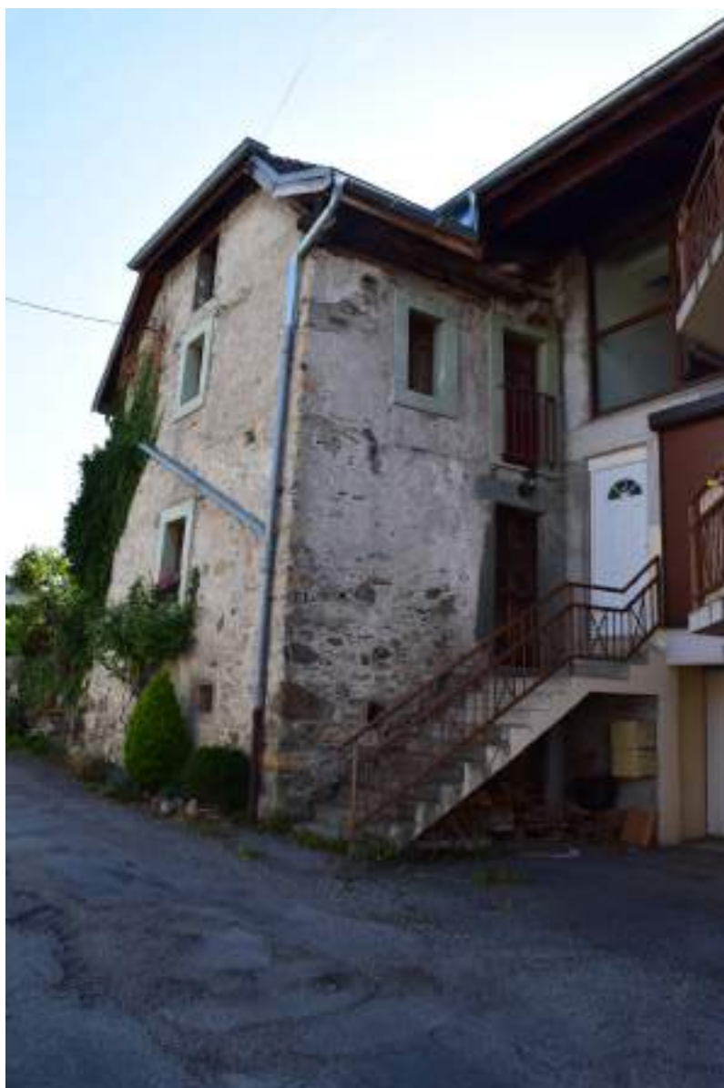
Fig. 19- Chef-lieu. Maison ancienne restaurée.