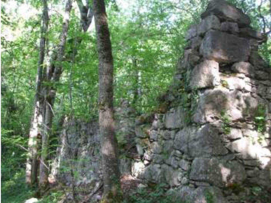
Fig. 3 - Ruines de la grange des Plagnes.