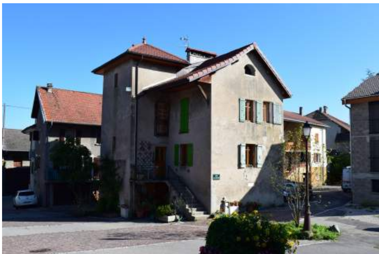
Fig. 17- Chef-lieu. Ancienne école enfantine.