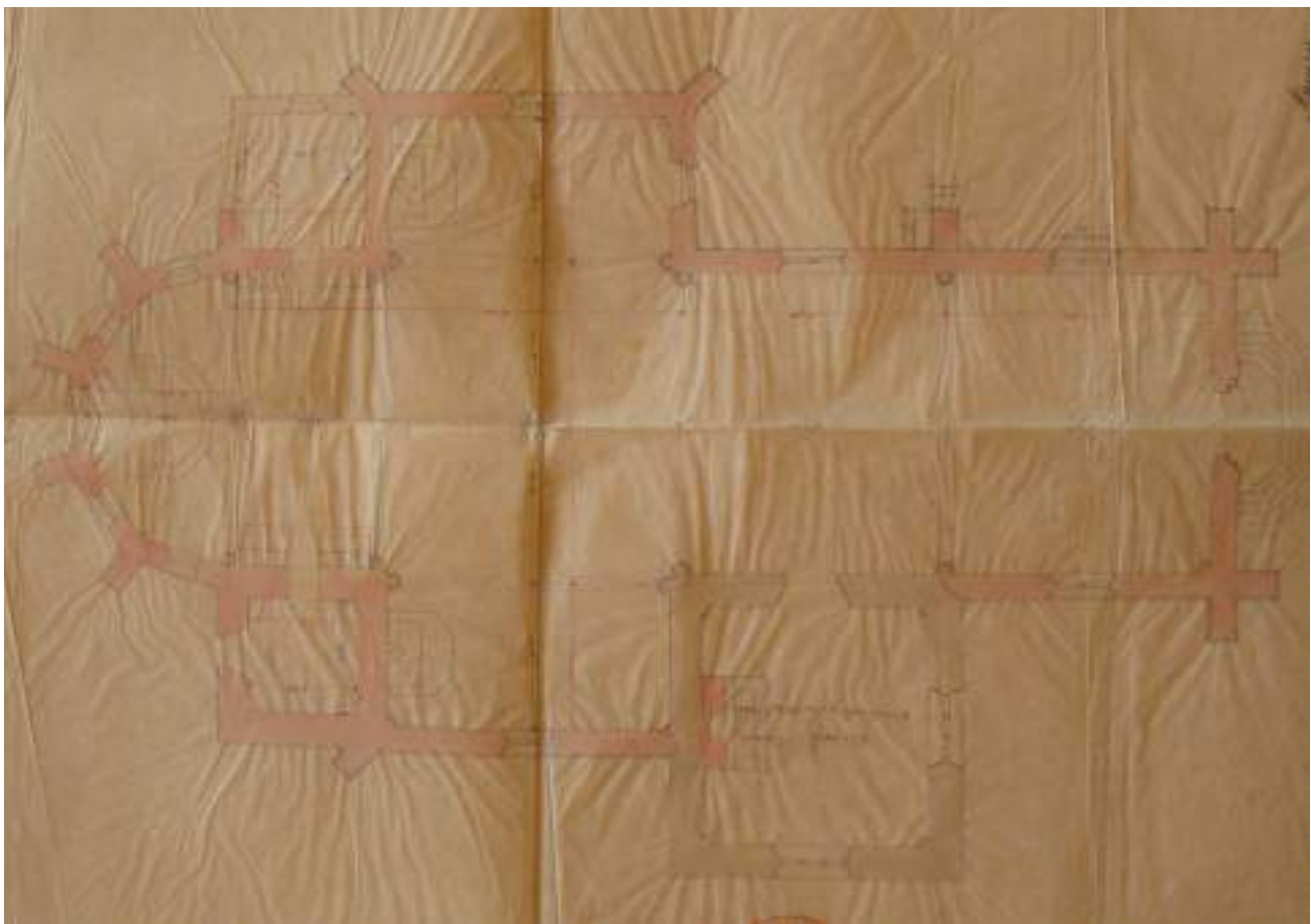
Fig. 15- Plan de la chapelle médiévale Sainte-Anne.