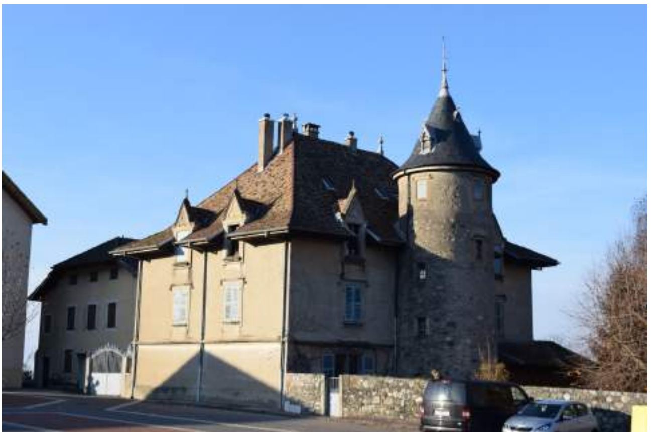
Fig. 3 - Maison forte de la Place.

Le village de Grande-Rive, qui à l'époque de la mappe sarde ne comprenait que quelques maisons établies le long d'une rue perpendiculaire au lac, prit de l'importance au XIX e siècle. Au milieu du XX e siècle, il comptait de nombreux commerces. Le XIX e siècle vit l'érection d'oratoires