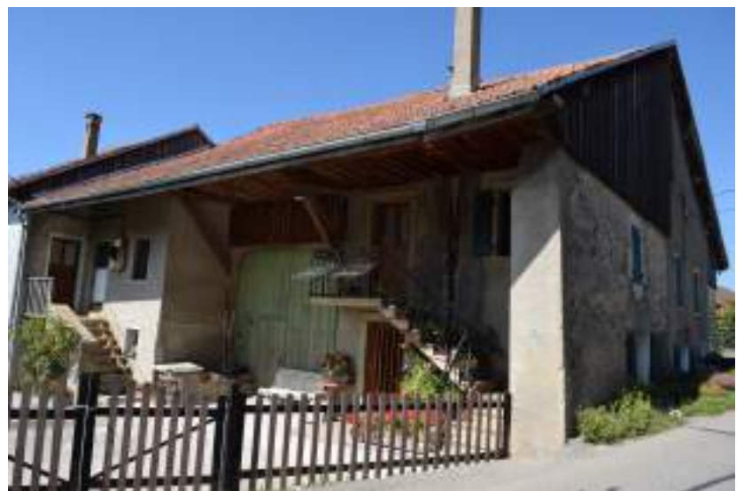
Fig. 16- Maison traditionnelle Chez Divoz.