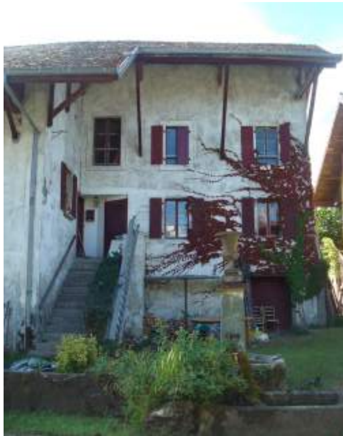
Fig. 10 - Bissinges.