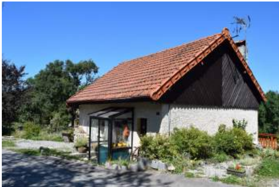
Fig. 4 - Ancienne fruitière de Chez les Vesin.