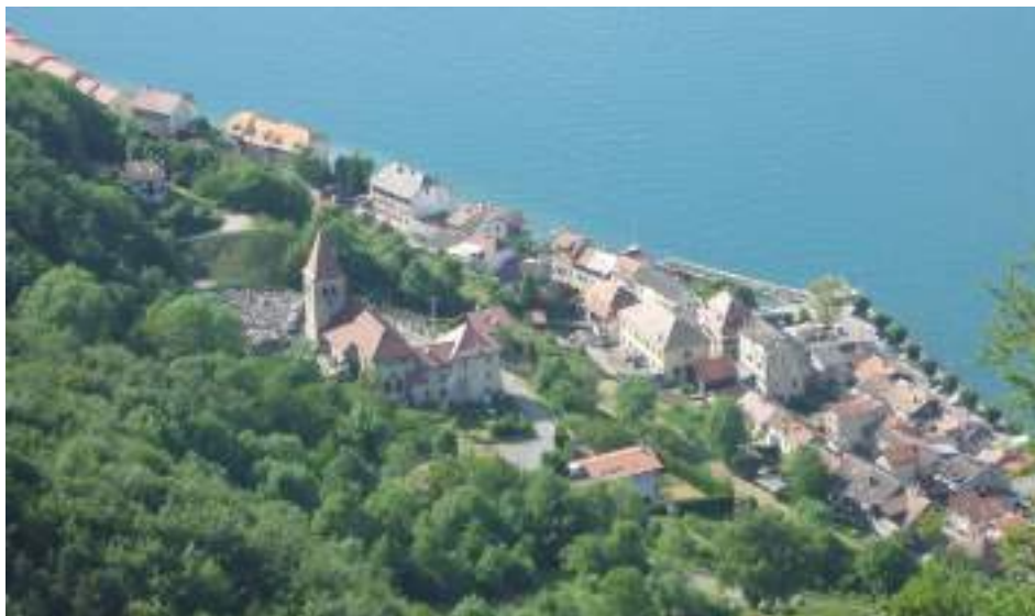
Fig. 1 - Meillerie vu depuis le sommet des carrières.