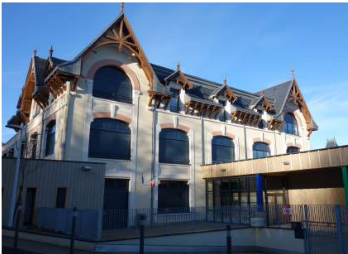
Fig. 5 - La manutention aujourd'hui.