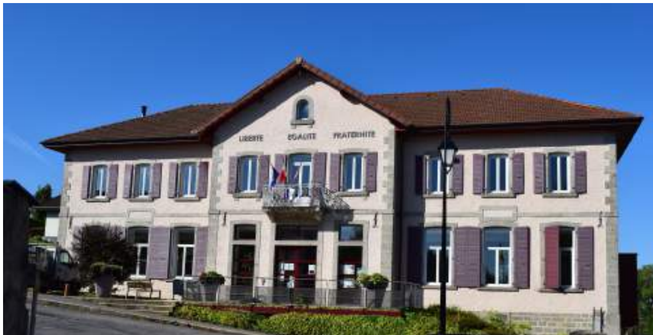
Fig. 18- Chef-lieu. Mairie.