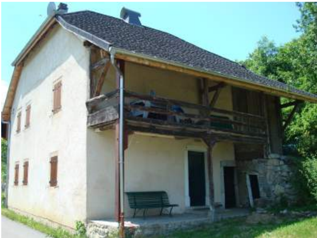
Fig. 15- Habitat traditionnel au Hucel.