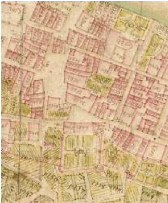
Fig. 9 - Extrait du cadastre sarde: place du marché et ancien château des comtes puis ducs de Savoie.