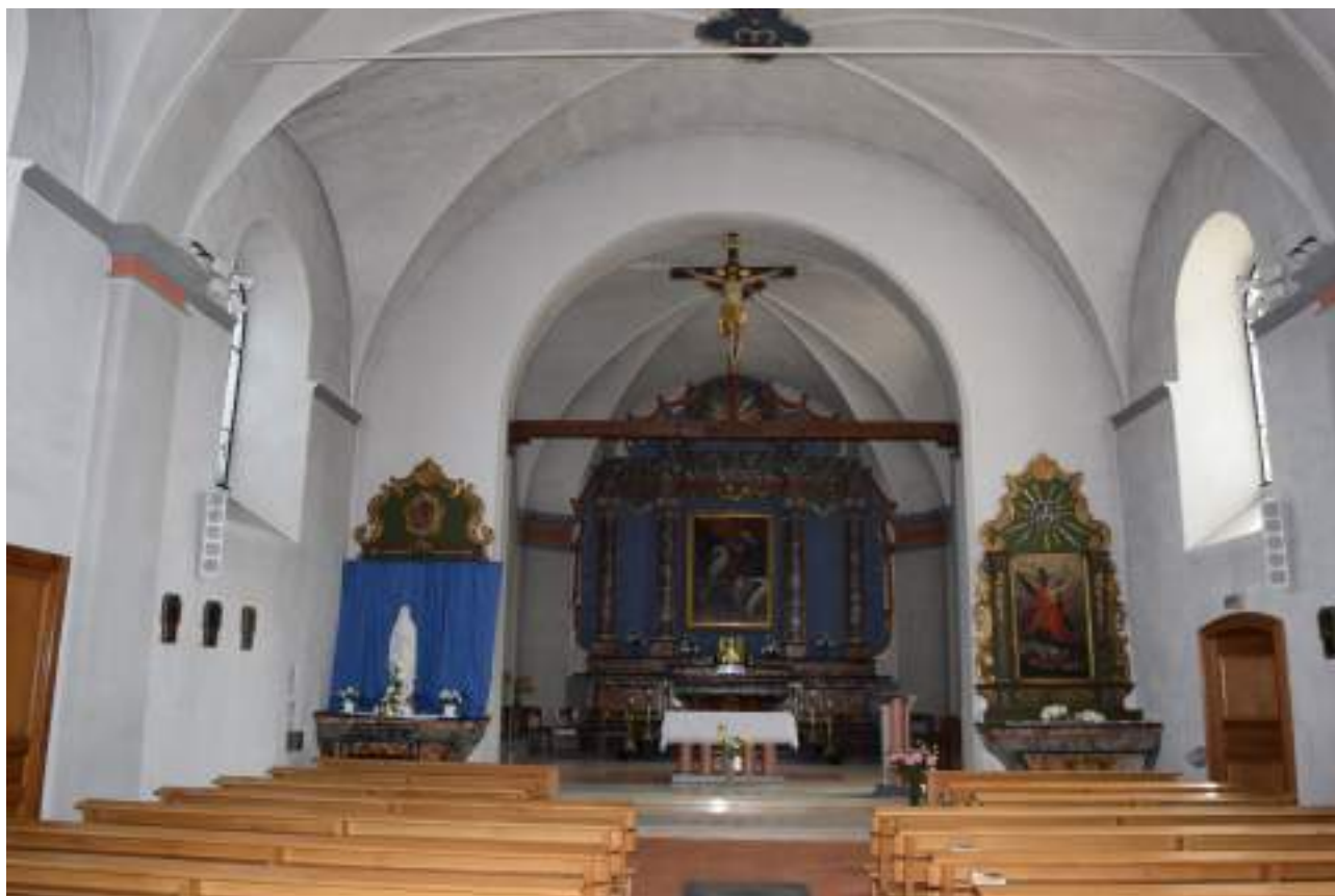
Fig. 9 - Intérieur de l'église paroissiale.