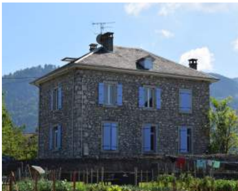
Fig. 13- Ancienne école de Château-Vieux.