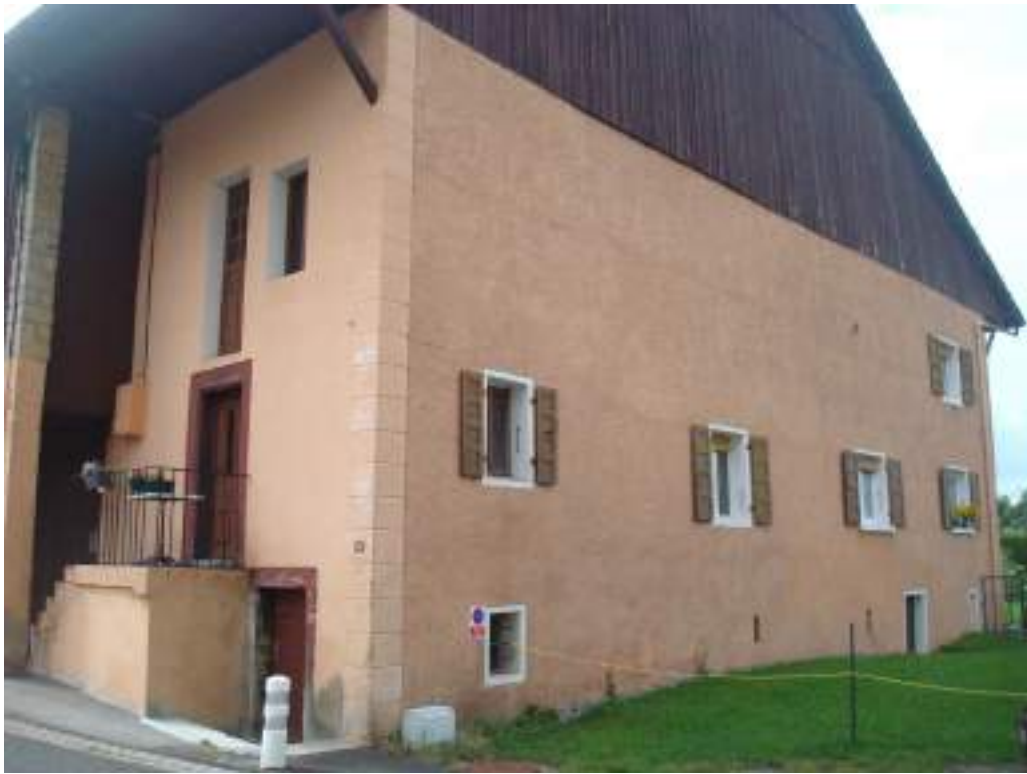
Fig. 6 - Maison Chappuis, place de l'église.