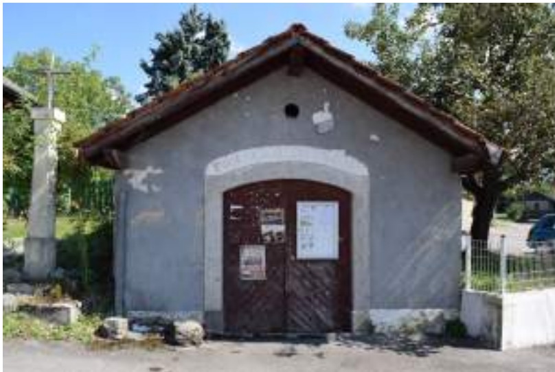
Fig. 15- Ancien hangar à pompes incendie Chez Divoz.