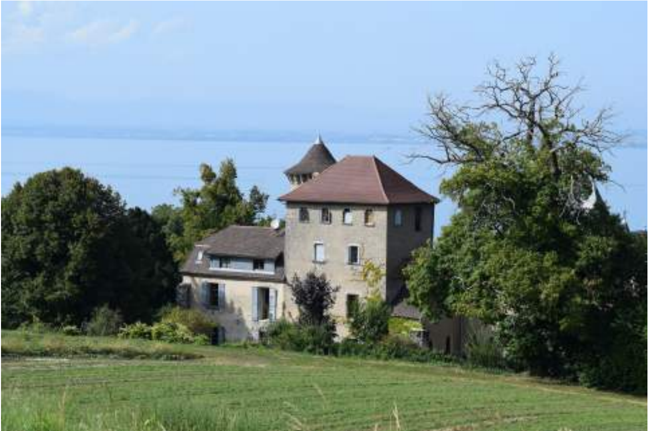
Fig. 2- La maison forte d'Allaman.