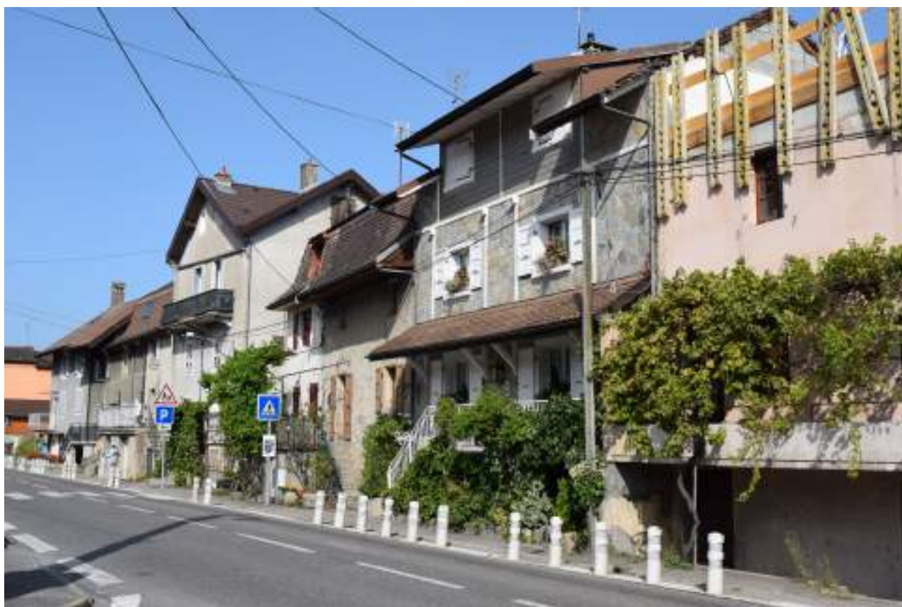
Fig. 12- Maisons mitoyennes de Petite-Rive.