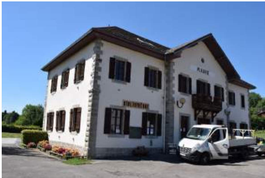
Fig. 7- Mairie.