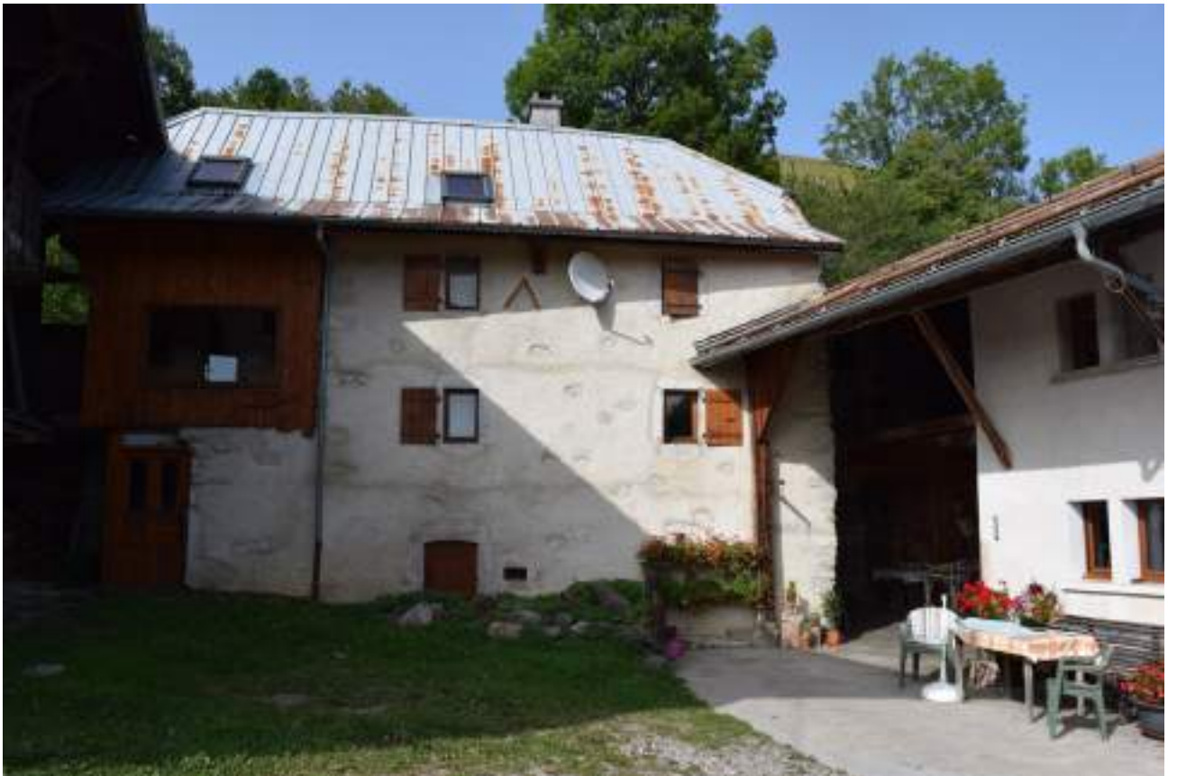
Fig. 7- Benand. Maison restaurée.