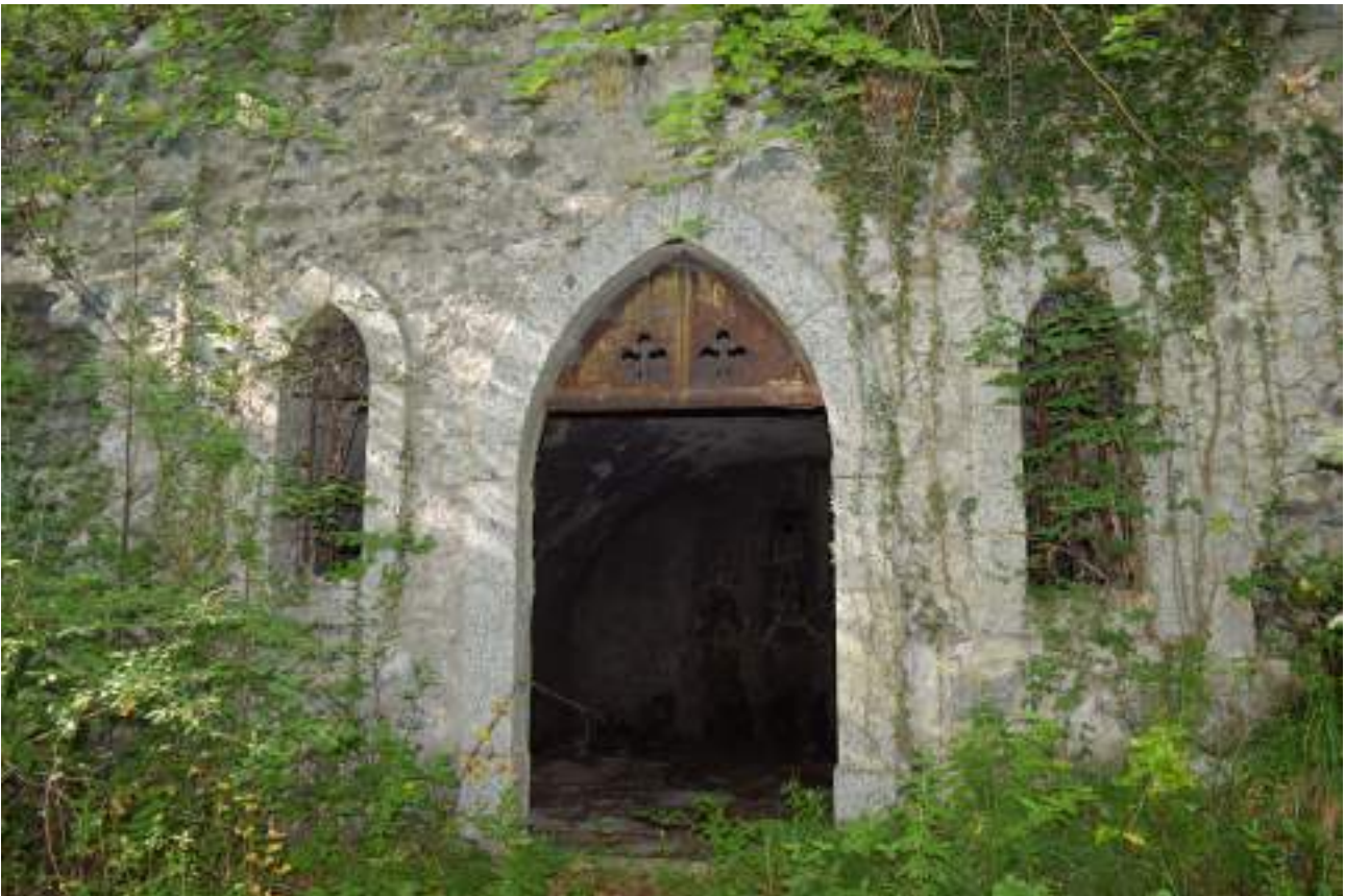
Fig. 3- Ancienne cave à vin du Plan Fayet.