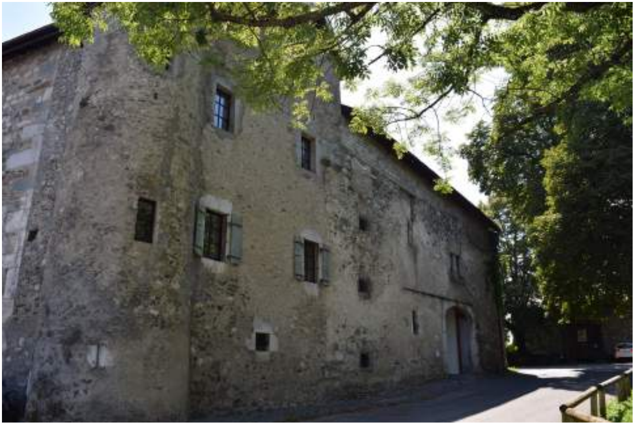
Fig. 8- Maison forte de Compey-Lucinge.