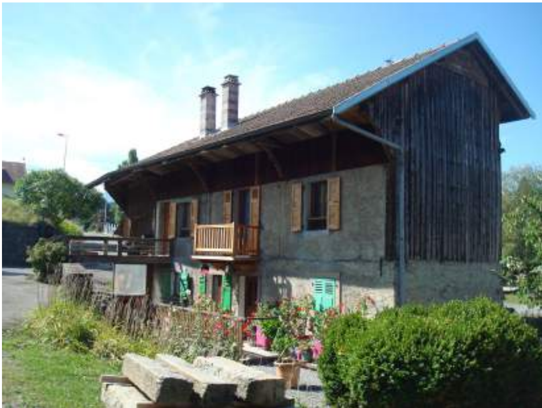
Fig. 12 - Darbon, moulin.