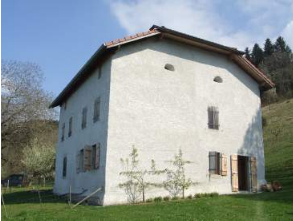
Fig. 2 - La grange des Reboux (propriété privée).