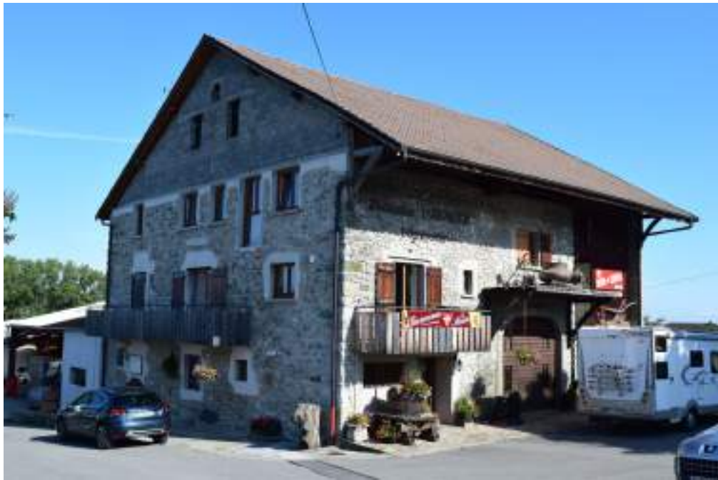
Fig. 9- Domaine Delalex.