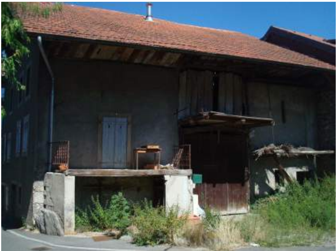
Fig. 10 - Maison non-entretenu.