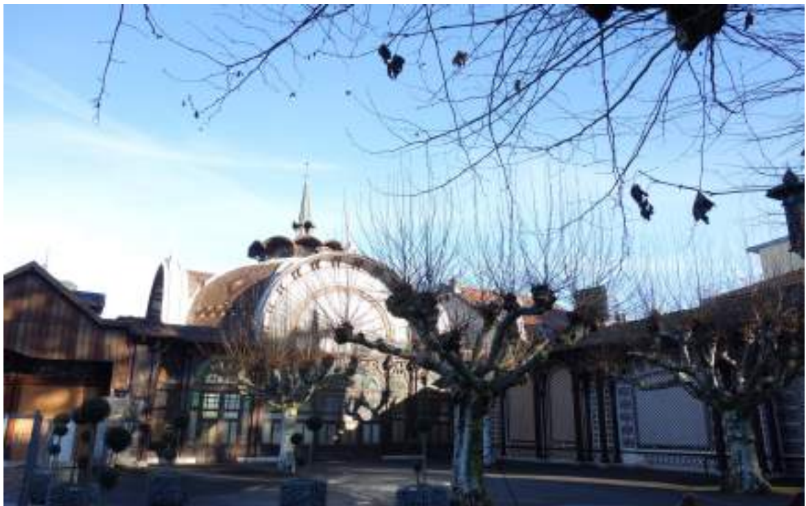
Fig. 19 - Partie supérieure de la buvette intérieure Cachat.