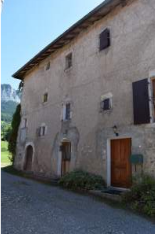
Fig. 2 - Le « château » Chez Cachat.