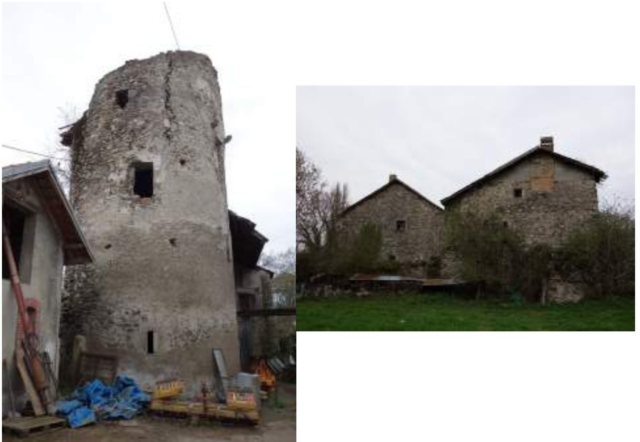
Fig. 4- La maison forte de La Chapelle aujourd'hui.