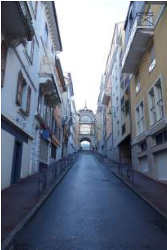
Fig. 2 - Rue d'Évian-les-Bains.