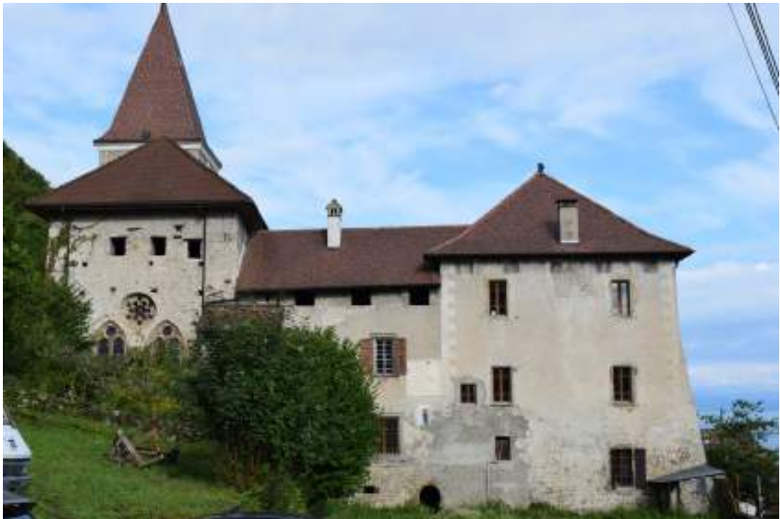
Fig. 7 - Le prieuré augustinien.