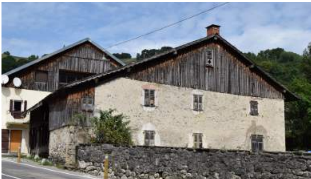
Fig. 10- Chef-lieu. Façade sud d'une maison ancienne.