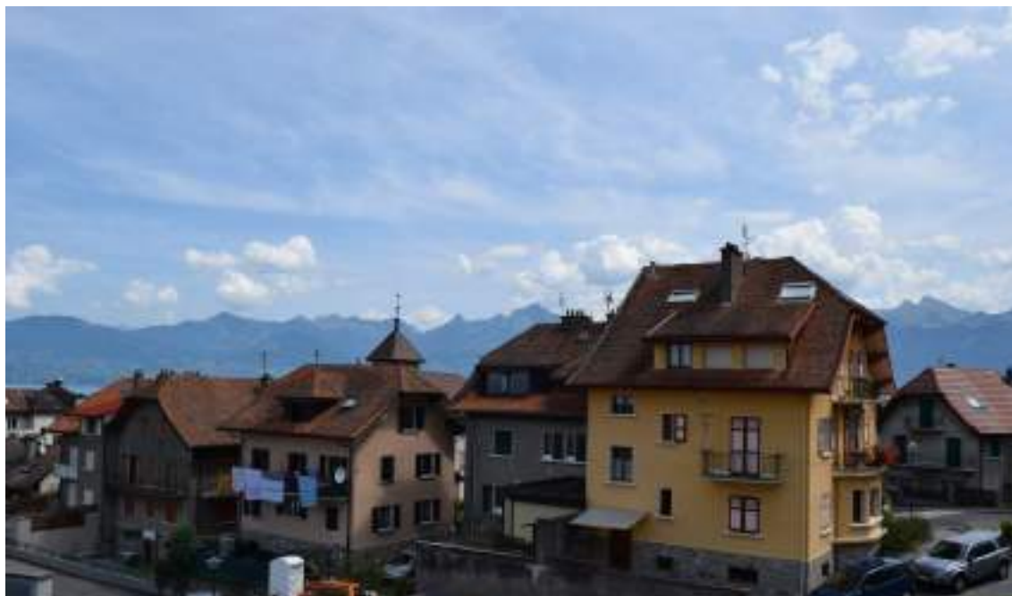
Fig. 6 - Le quartier des Gaules.

En traversant la frontière par le pont-haut, avant lequel se trouve une ancienne guérite de douanier (fig. 10), on accède à Saint-Gingolph en Suisse, où se trouve la chapelle dédiée à la Sainte-Famille (fig. 11) et l'ancienne maison forte des du Nant de Grilly (fig. 12).