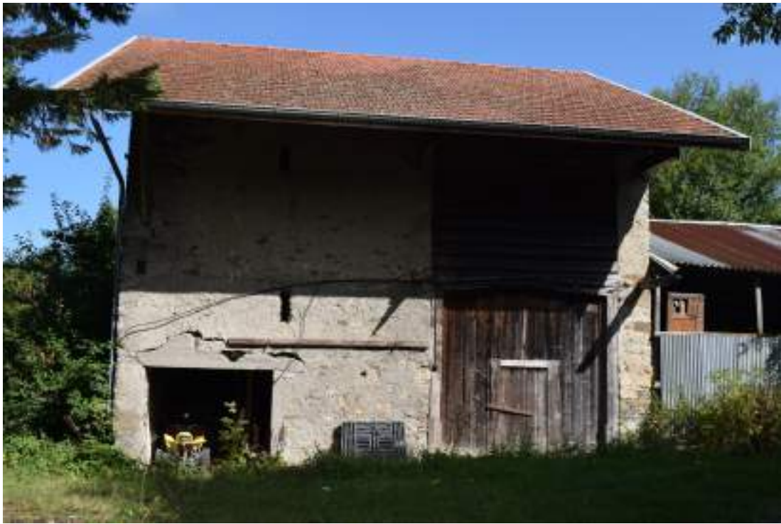
Fig. 11 - Les Granges.