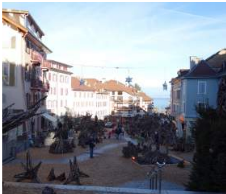
Fig. 8 - Ancienne place du marché et actuelle place Charles de Gaulle occupée par les Flottins.