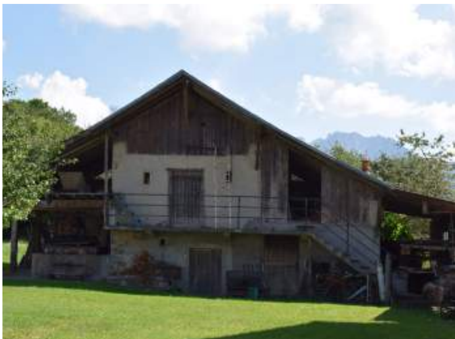
Fig. 17- Grenier Chez Divoz.