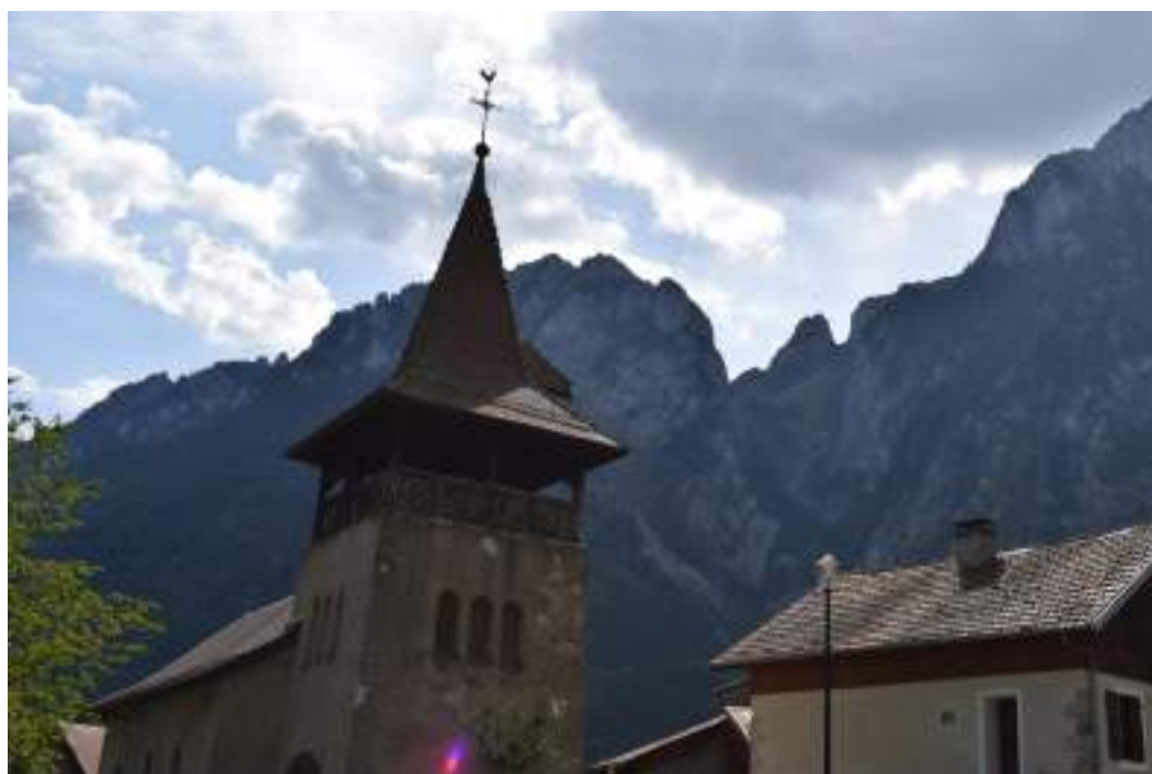
Fig. 2 - La place de l'église et, à l'arrière, la Suisse.

Le patrimoine bâti de Novel se résume au village reconstruit après l'incendie de 1924 autour de son église (fig. 2), dont les plans sont conservés aux archives départementales de la Haute-Savoie. Le clocher-porche est particulièrement intéressant (fig. 3) et abrite le monument au seul mort de la commune, Cyprien Brouze (fig. 4). En contrebas, la mairie-école édifiée en 1931 ressemble à un chalet moderne (fig. 5). À l'intérieur se trouve une plaque aux époux Francken, faits Juste parmi les nations en 1998. L'ancien presbytère n'a pas été touché par l'incendie de 1924 et se trouve au-dessous de l'église, de même que l'hôtel du Grammont (fig. 6). Plus haut dans la vallée, au lieu-dit le Revers, se trouve la chapelle des bergers édifiée en 1880. De nombreux chalets et granges sont situés dans les alpages.