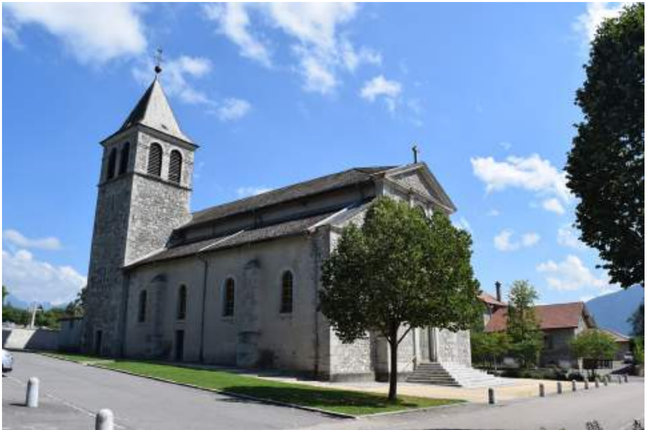
Fig. 10- Eglise paroissiale de Féternes.