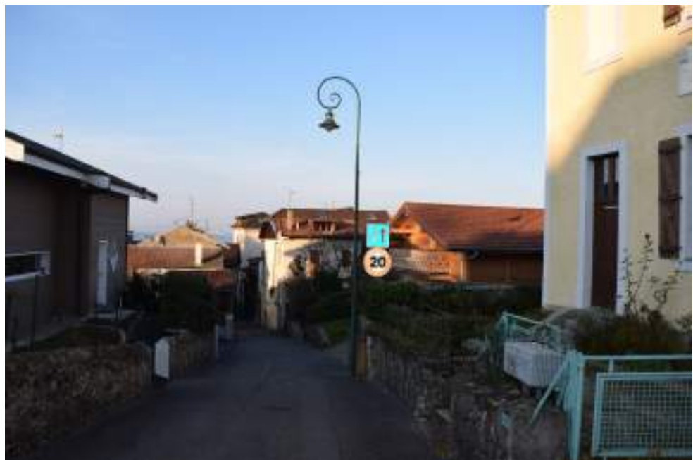
Fig. 11 - Grande-Rive.