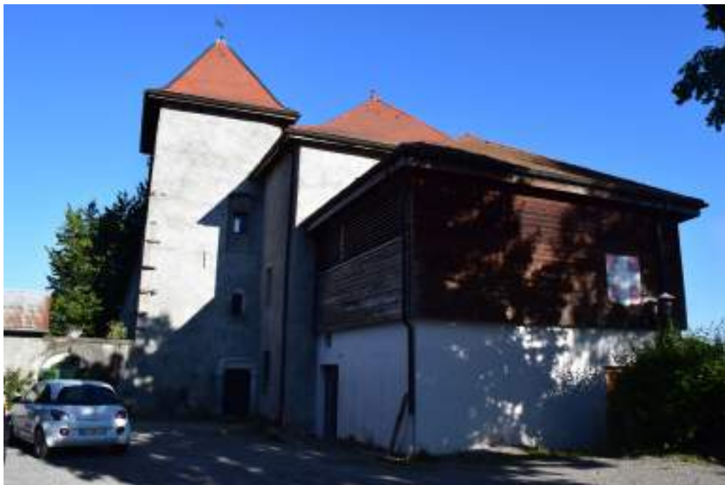
Fig. 4 - La maison forte de Blonay au Chef-lieu.