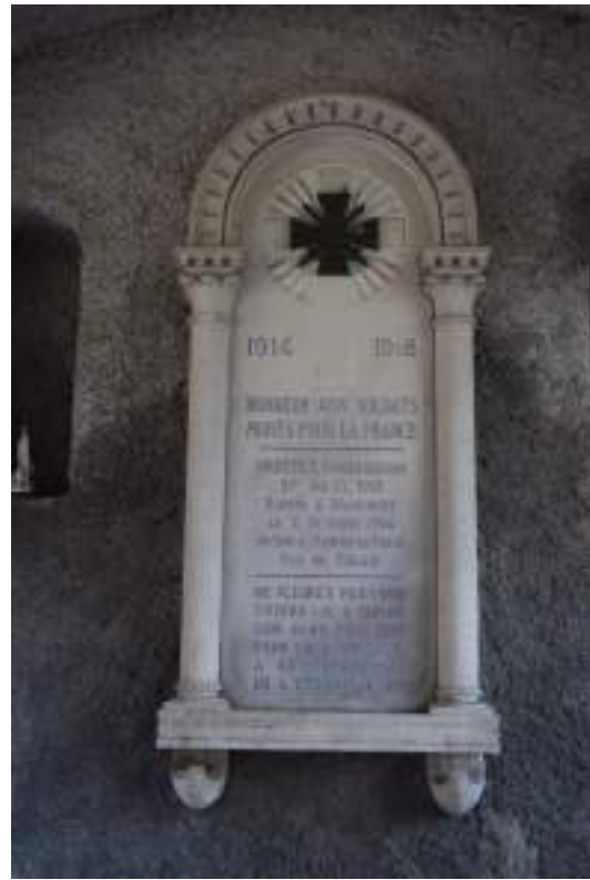
Fig. 4 - Monument au mort.