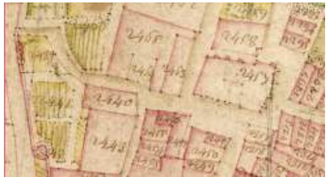
Fig. 3 - Extrait du cadastre sarde: le couvent Sainte-Claire et l'église paroissiale.