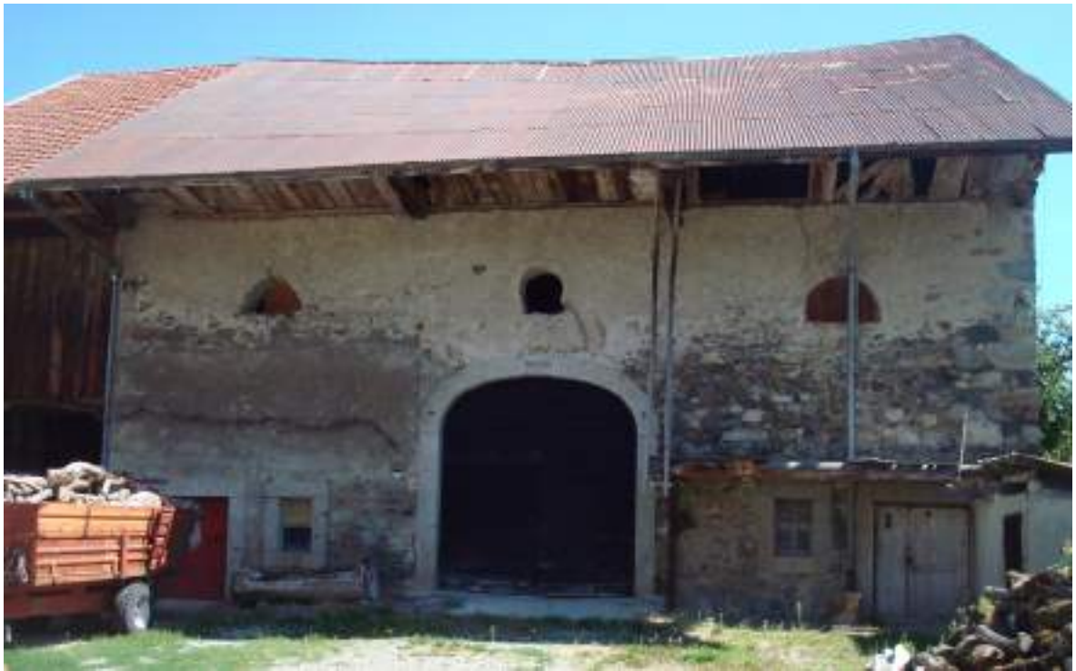
Fig. 6 - Maison Chevallay et monte-foin pour charrettes.