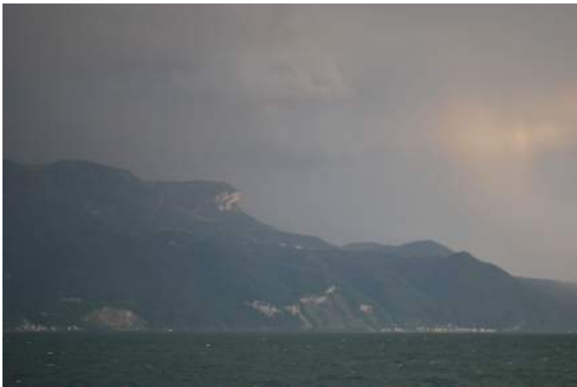
Fig. 5 - Environnement géologique de Meillerie (en bas à droite de la photo).