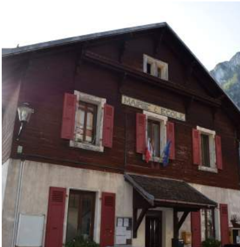
Fig. 5 - Mairie et ancienne école.