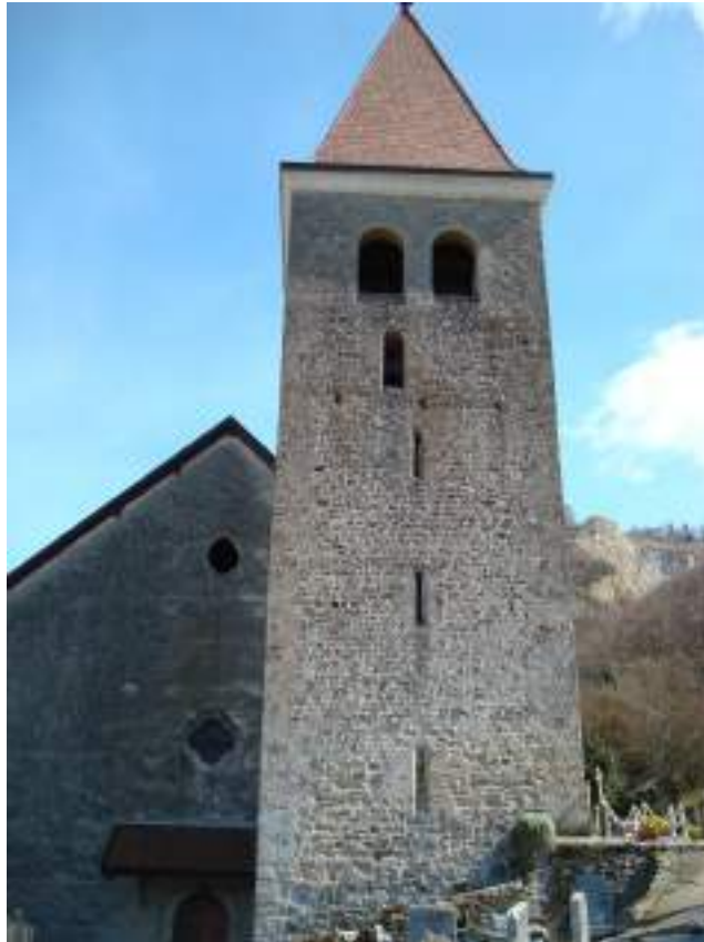
Fig. 8 - La tour du prieuré augustinien construite au XIII e siècle, et la nef paroissiale construite au XIX e siècle).