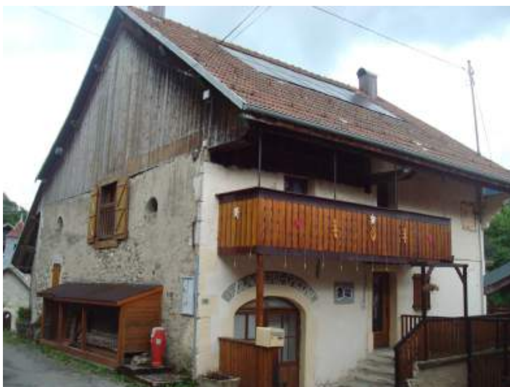
Fig. 19- La Plantaz. Ancienne boulangerie-épicerie.