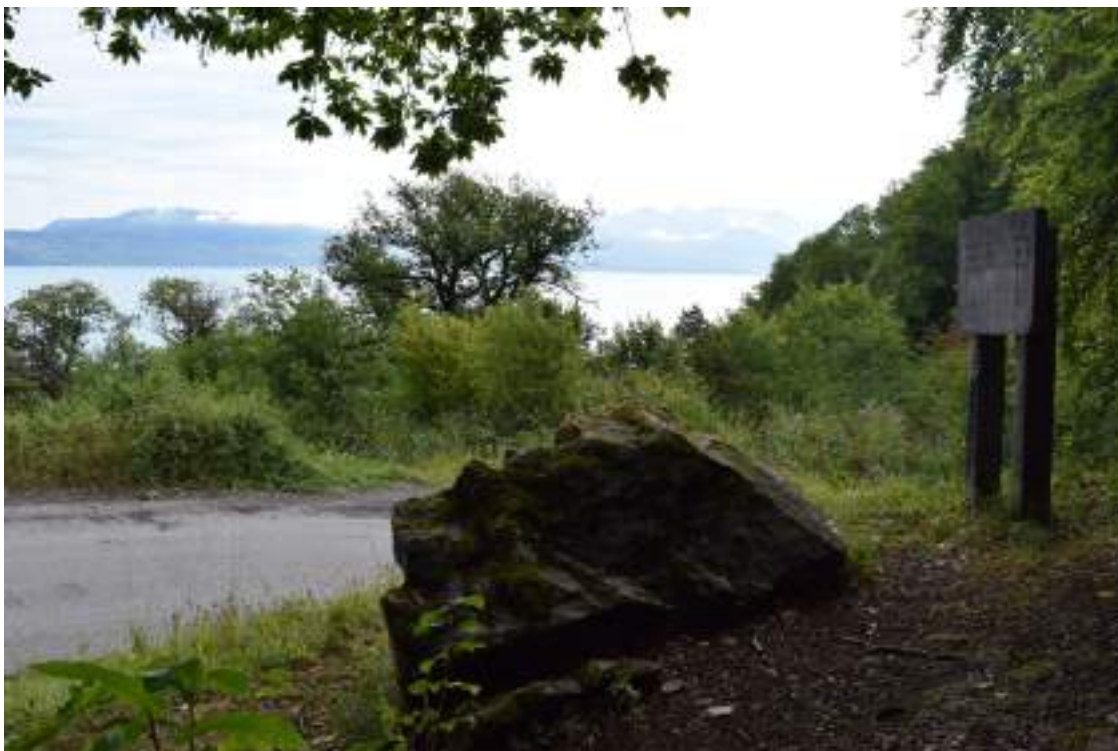
Fig. 10 - La « pierre à Jean-Jacques Rousseau ».