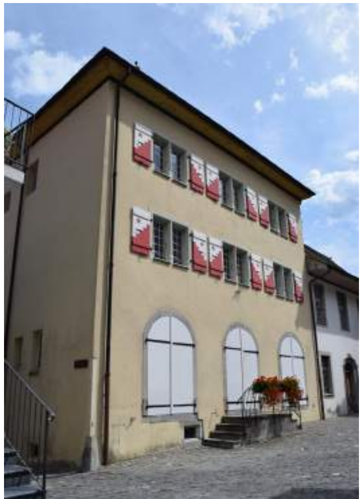
Fig. 12 - L'ancienne maison forte.