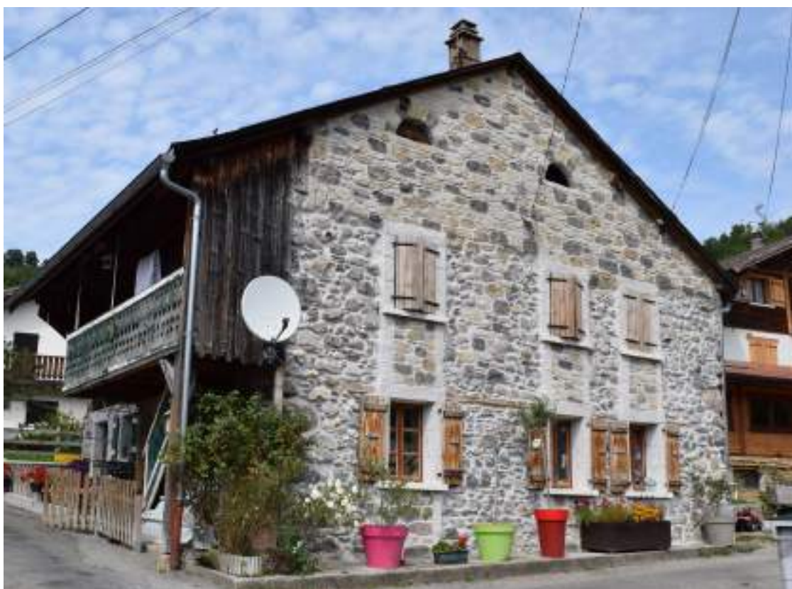
Fig. 9- Le Songeon. Maison restaurée.

Dans le fond de la vallée, le même type d'architecture traditionnelle peut être observé au Songeon : une maison aux murs de pierres apparentes présente une façade sud percée d'étroites fenêtres, et une façade occidentale munie d'une galerie de bois abritée par une palissade de bois (fig. 9). À l'arrière il y avait autrefois la grange. Au Chef-lieu et au-dessus de la mairie se trouve un très bel exemple de maison datée par son linteau de 1820. Sa façade sud s'élève sur trois niveaux (fig. 10) dont deux percés de petites fenêtres et un grenier recouvert de bardeaux de bois. Comme pour celle du Songeon, la façade occidentale est protégée par une avancée de la maçonnerie contre laquelle montent des escaliers, tandis que la grange est aménagée du côté nord (fig. 11). À l'arrière de l'église, d'autres maisons présentent des éléments architecturaux intéressants, dont un linteau de porte gravé de la date 1762 et d'un calvaire (fig. 12). L'une semble particulièrement bien conservée (fig. 13).