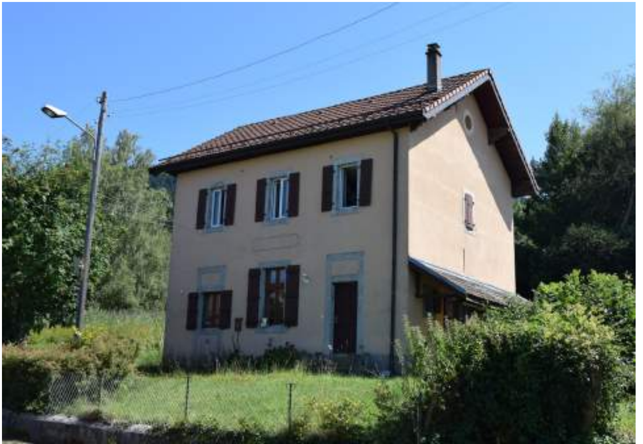
Fig. 11- Ancienne école de Laprau.