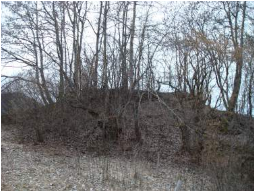
Fig. 8- Ancienne maison forte de Thollon.