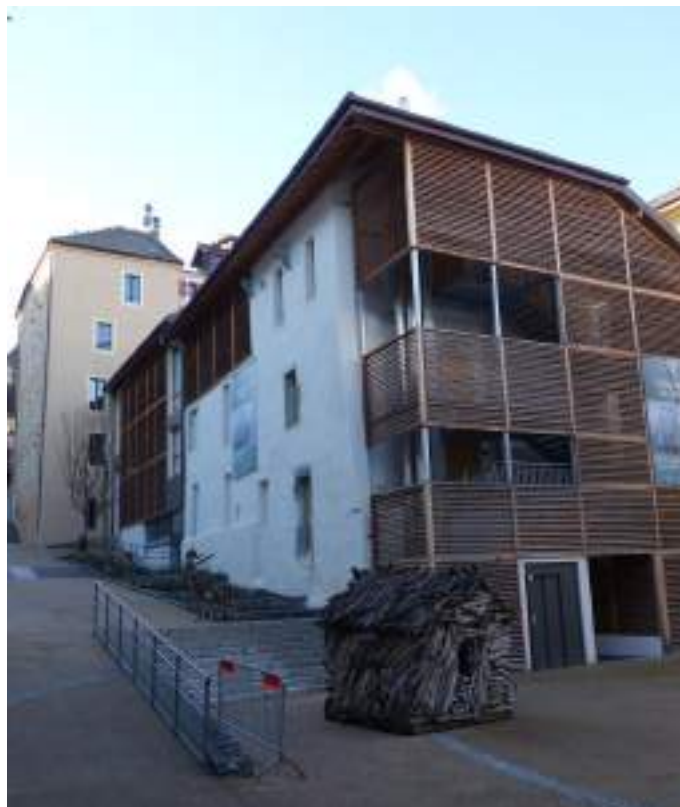
Fig. 14 - Maison Gribaldi.