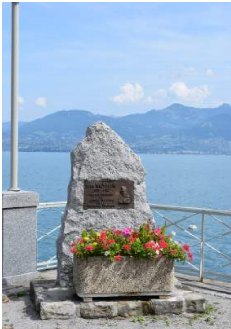
Fig. 4 - Monument à Jean Moulin.