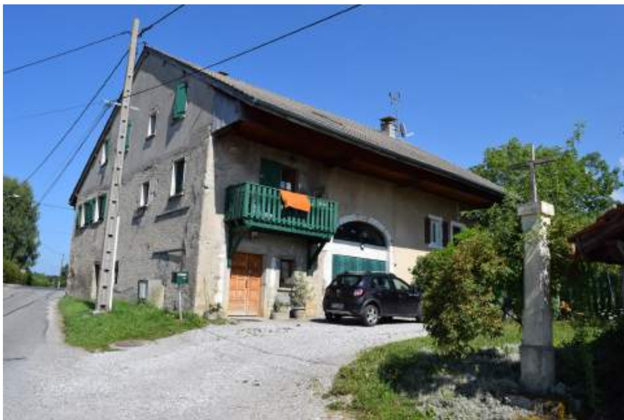
Fig. 14- Maison ancienne Chez Divoz.

Dans les traverses, quelques maisons anciennes subsistent à Les Vaux, dont la maison des frères Boujard, combattants et résistants de la commune de Féternes (fig. 18). Bassins, greniers et oratoires ponctuent le chemin. La route menant de Féternes à Vinzier en passant par les traverses (Vougtron, le Flon, La Plantaz) permet d'apprécier une architecture variée : maisons anciennes, modernes et chalets. À La Plantaz, près de la chapelle, quelques maisons anciennes subsistent, dont celle de l'ancienne boulangerie-épicerie (fig. 19). D'autres exemples, partiellement restaurés, existent à Thièze.