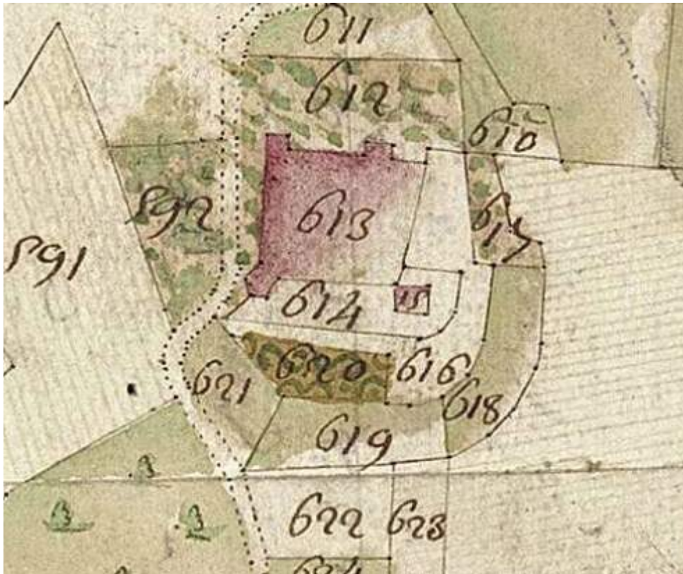
Fig. 2 - Le château de Saint-Paul d'après le cadastre sarde.