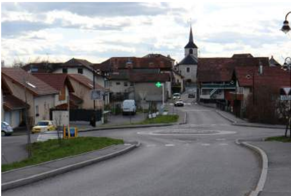
Fig. 1- Larringes.

- Pierre à cupules de Chez Crosson dite « Pierre aux Gaulois ».