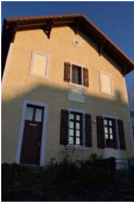
Fig. 10 - Grande-Rive, ancienne école.