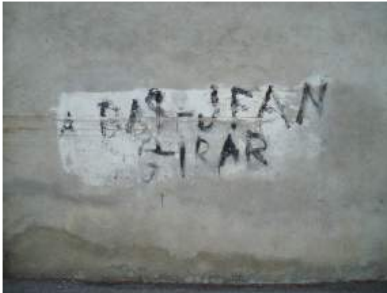
Fig. 10 - Vinzier, tag sur la place de la mairie.