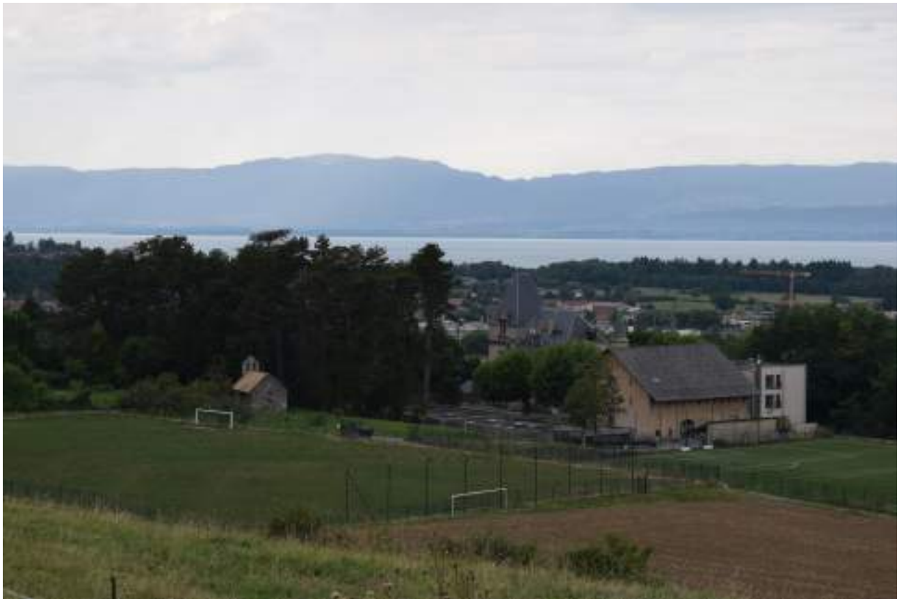
Fig. 2- Le domaine de Blonay et la chapelle Saint-Etienne vus depuis le sud-est.