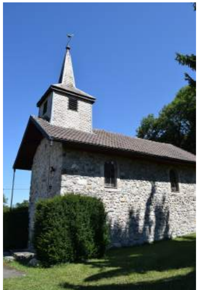
Fig. 10- Chapelle de Laprau.