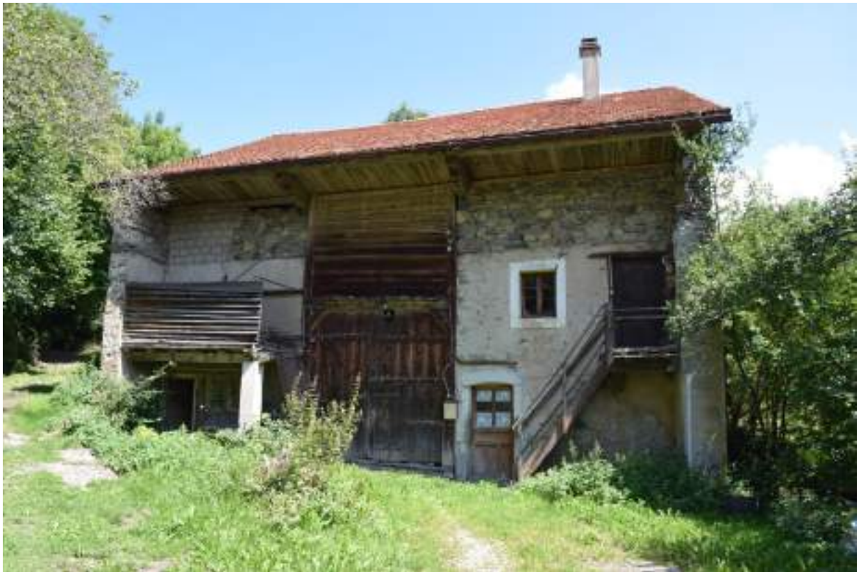
Fig. 19 - Habitat traditionnel Chez Bochet.