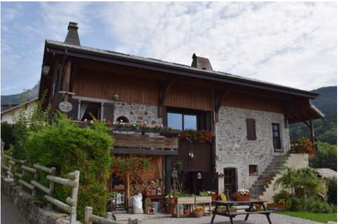
Fig. 14- Trossy. Maison ancienne restaurée.