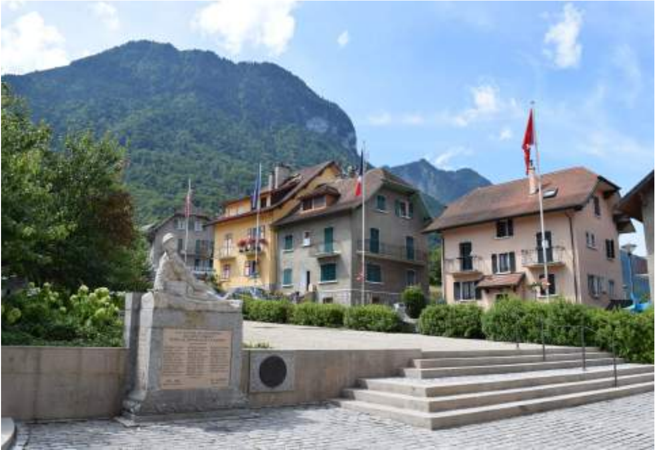
Fig. 7 - La place Charles de Gaulle et le monument aux morts.