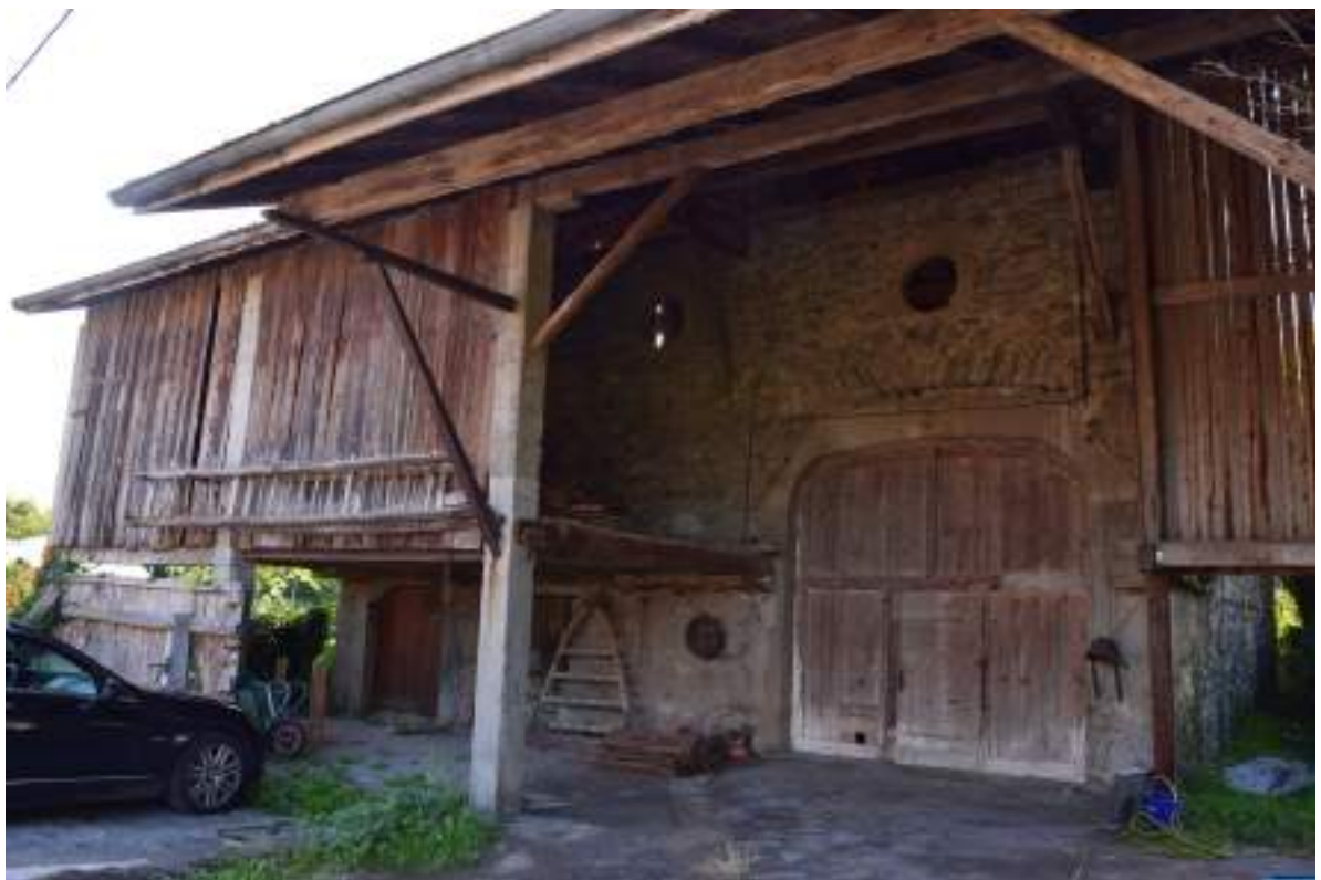
Fig. 5- Rouchaux. Grange dont la porte est datée de 1835.