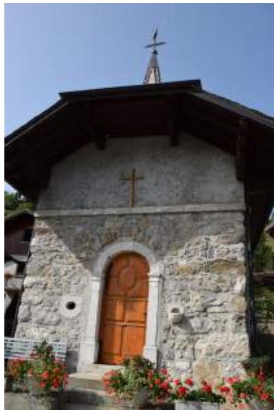
Fig. 23- Chapelle de Chez Buttay.