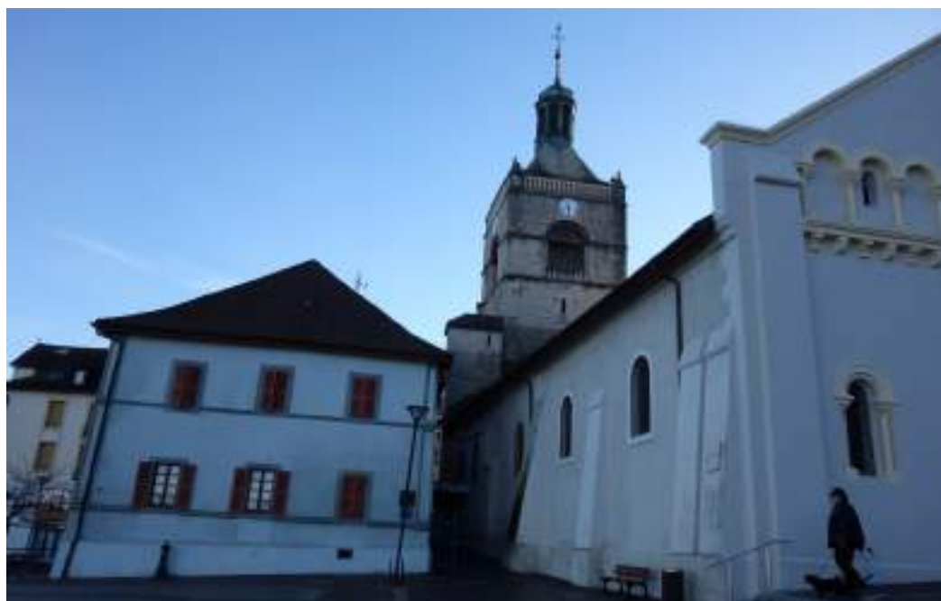
Fig. 15 - Presbytère et nef de l'église paroissiale.