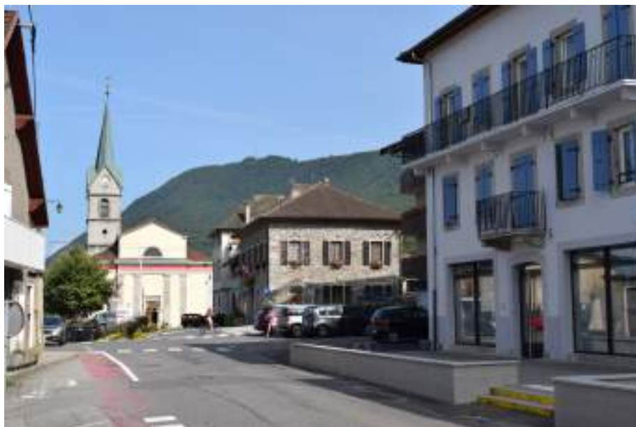
Fig. 6- Le Chef-lieu de Lugrin, son église paroissiale et la mairie au second plan.

Les villages de Troubois et des Combes conservent quelques exemples d'habitat traditionnel.