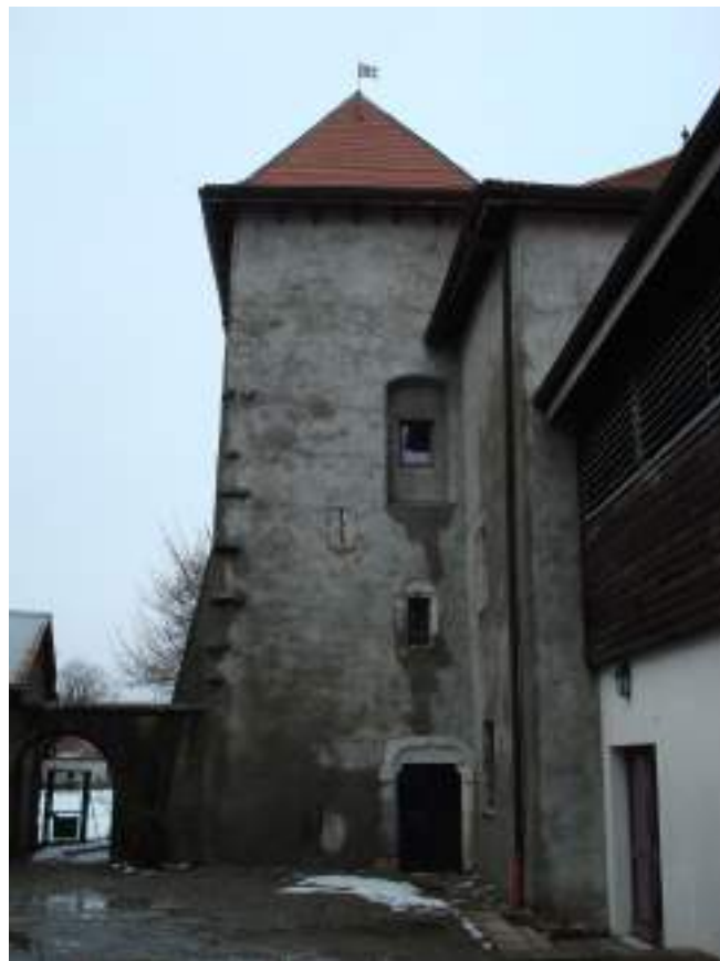
Fig. 12 - La tour d'escaliers de la maison forte de Blonay.