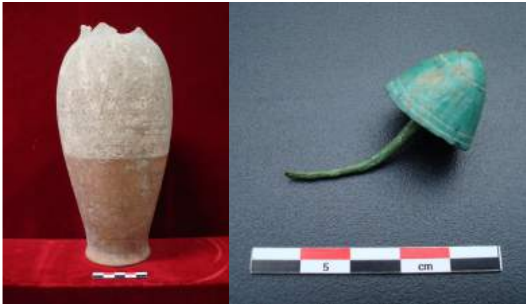
Fig. 6 - Matériel découvert dans la tombe protohistorique de Meillerie.