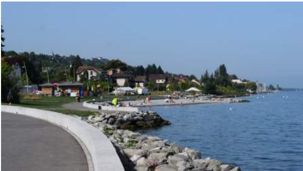
Fig. 1- La plage du parc de Petite-Rive.