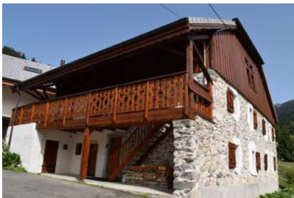
Fig. 18- Charmet. Maison ancienne.