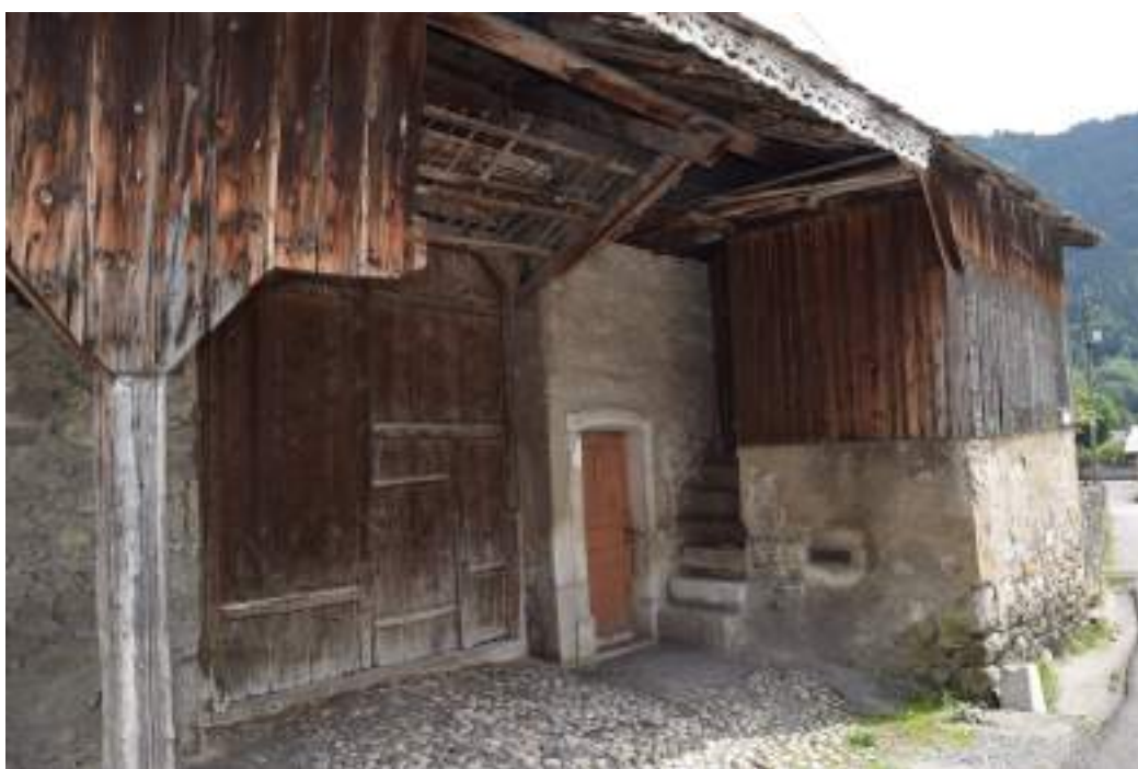
Fig. 11- Chef-lieu. Façade ouest de la même maison.