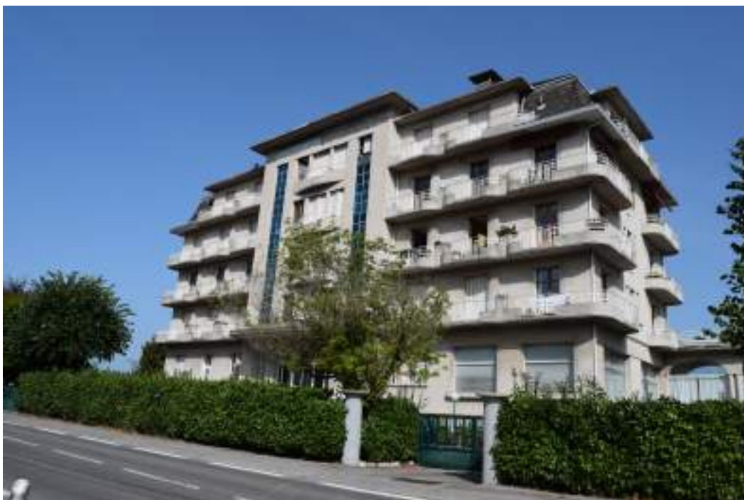
Fig. 4- Hôtel Lumina à Petite-Rive.