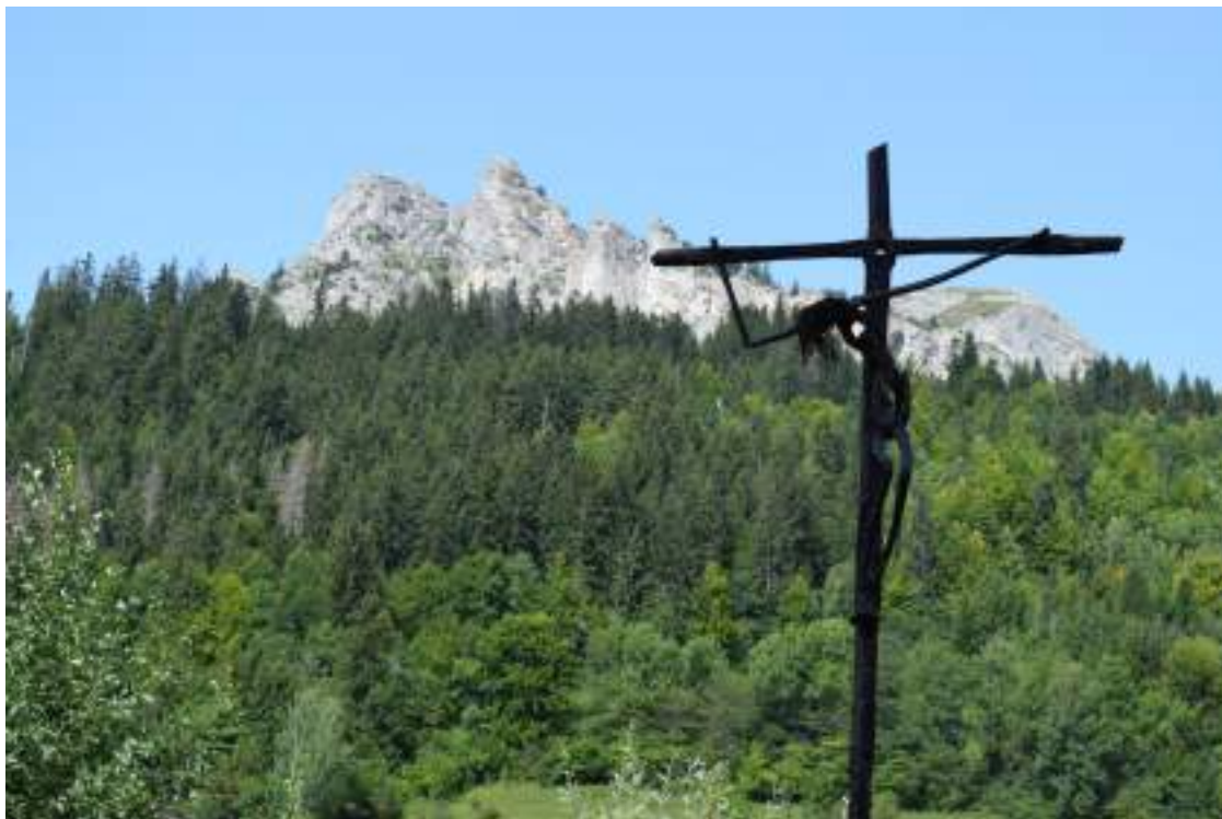
Fig. 19- Charmet.