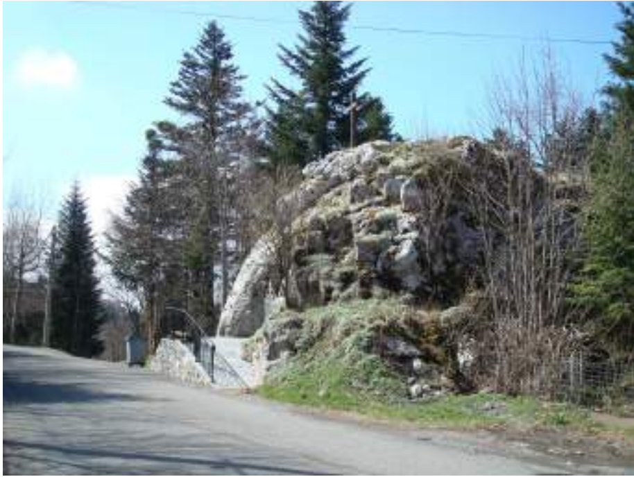
Fig. 12 - Grotte Notre-Dame-de-Lourdes.