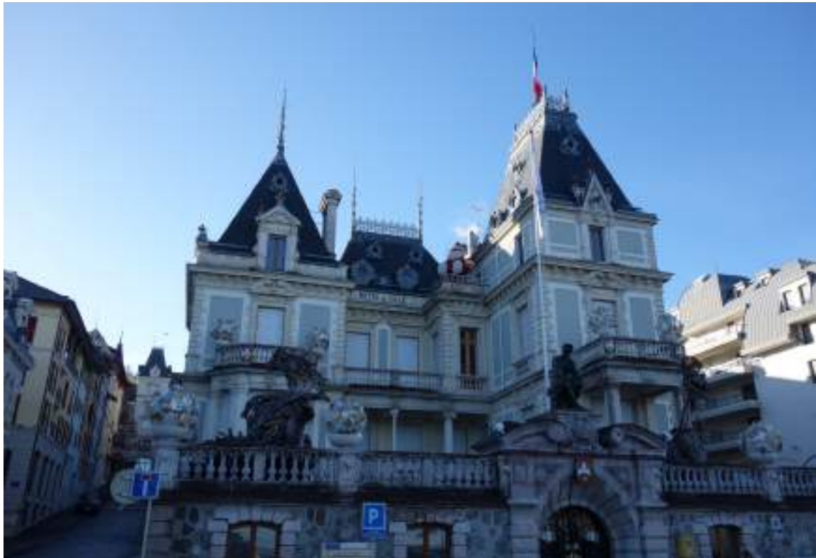
Fig. 22 - Villa Lumière.

l'architecte Ernest Brunnarius. Mesurant 68 m par 45 m, il est surmonté d'un dôme de plus de 30 m de hauteur. L'entrée est décorée de toiles du peintre Jean Benderly, de statues allégoriques de Charles Beylard et d'une toile peinte par Albert Besnard en 1904. L'ensemble a été restauré entre 2004 et 2006 et abrite aujourd'hui la médiathèque municipale, des salles d'exposition et un centre de congrès (fig. 21).