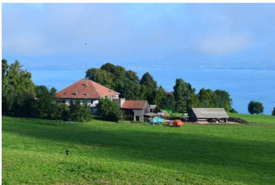
Fig. 10 - Site du château de Saint-Paul aujourd'hui : au premier plan se trouve l'ancienne ferme reconstruite, et au second plan, dans les arbres, une maison particulière.