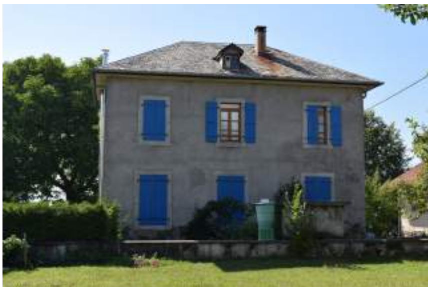
Fig. 12- Ancienne école de Chez Portay.

Au Chef-lieu, village situé au centre de Féternes, se trouve l'église paroissiale dédiée à Notre-Dame-de-l'Assomption (fig. 10). L'une de ses cloches de bronze, fondue en 1780, est classée aux monuments historiques au titre d'objet depuis 1943. Les parrains et marraines sont le baron et la baronne de Féternes Charles de Regard et Antoinette de Bourgeois. Au-devant de l'église se trouve une place appelée « Place du 20 février 1944 » en souvenir de la rafle qui eut lieu à Féternes ce jour-là. Les hommes du village avaient été rassemblés le long du mur de l'église. Trente-deux personnes furent arrêtées et emmenées à la prison de Thonon. Une plaque apposée contre un des contreforts de l'église commémore l'évènement. Sur cette même place se trouve le monument aux morts de la commune (Première et Seconde Guerres mondiales, Guerre d'Espagne). À l'arrière se trouve la mairie actuelle (fig. 11), tandis que l'ancienne mairie-école est de l'autre côté de la rue. D'autres écoles de villages avaient été construites en 1881 au Flon, Chez Portay (fig. 12) et à Féternes-Vieux (fig. 13).