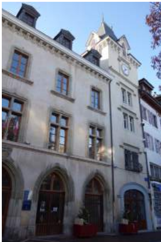
Fig. 13 - Façade de l'ancien hôpital.