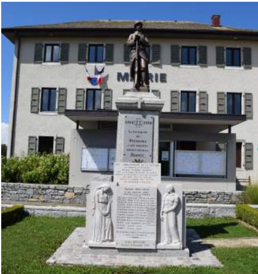
Fig. 11- Mairie (ancien presbytère restauré en 2008) et monument aux morts.