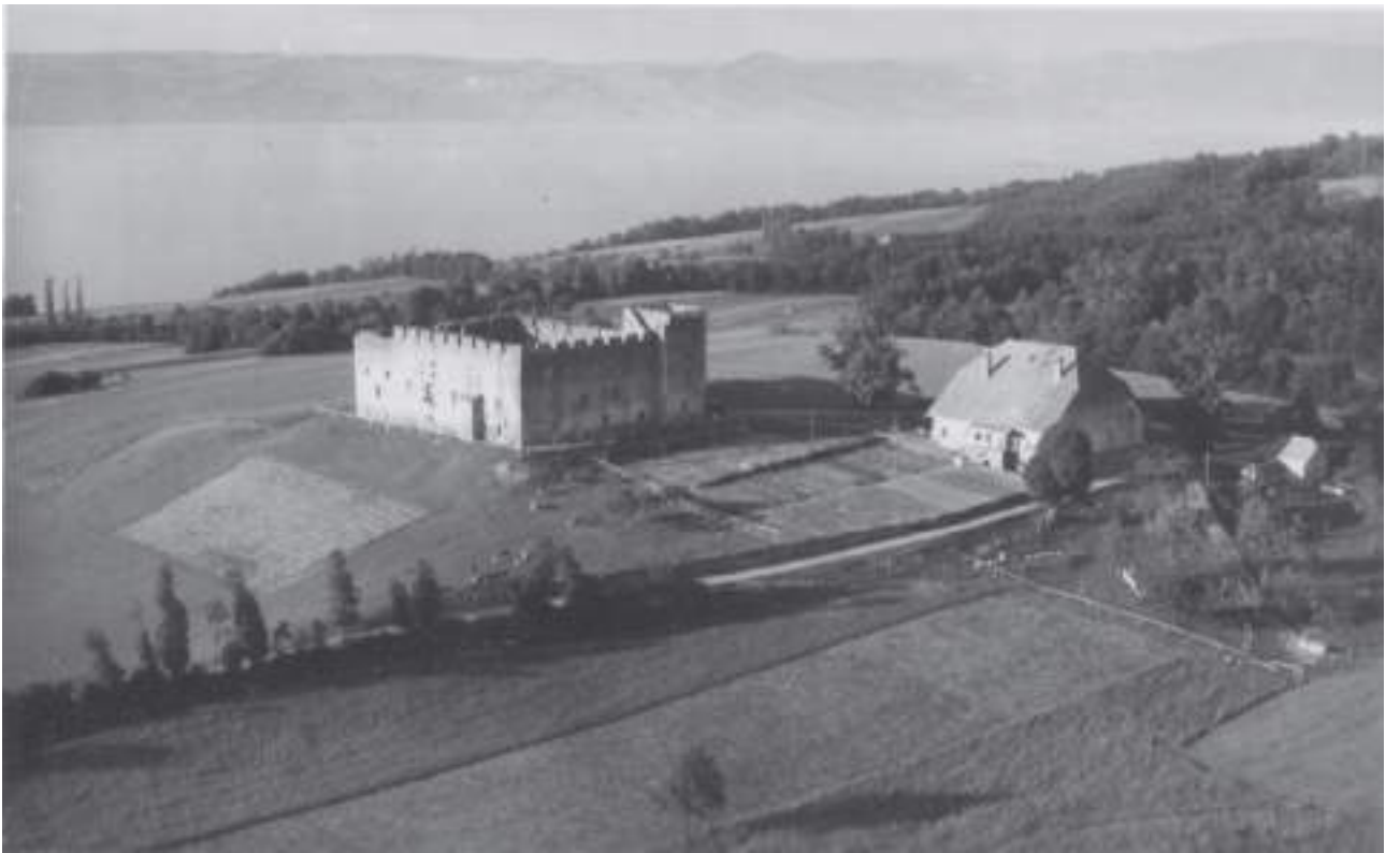
Fig. 2- Le château de Larringes.