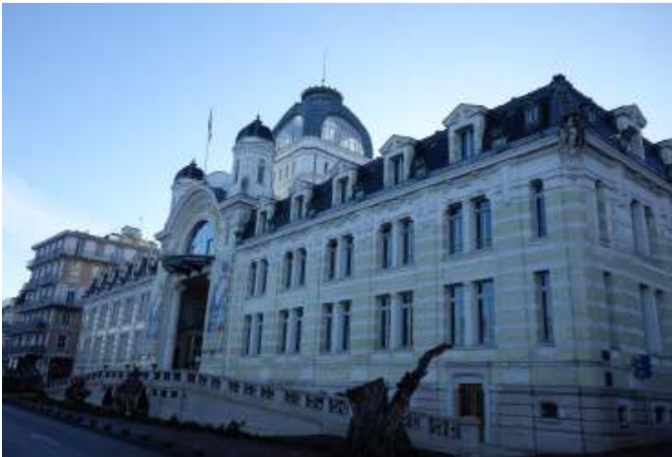
Fig. 21 - Palais Lumière.