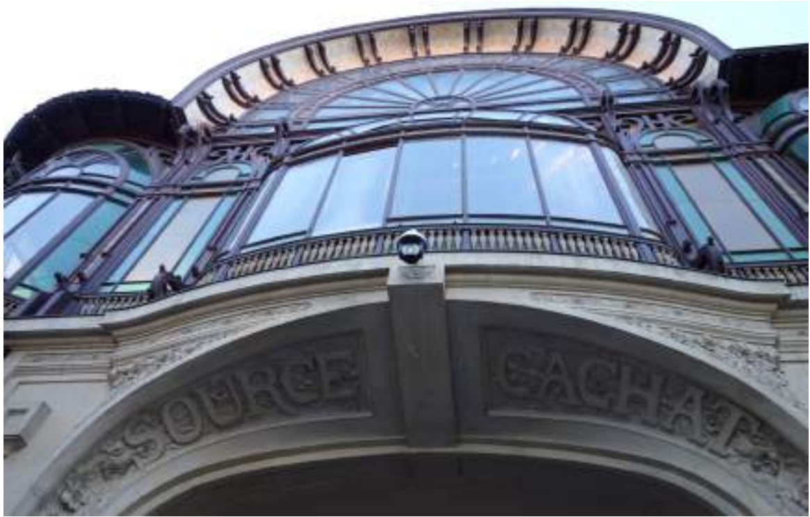
Fig. 18 - Entrée de la buvette intérieure.