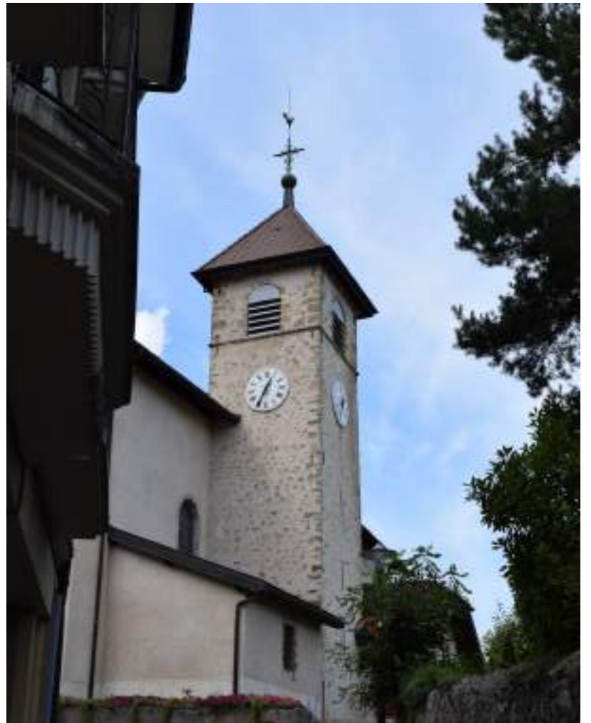
Fig. 8 - L'église paroissiale.