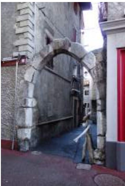
Fig. 7 - Arc de la rue de l'église.