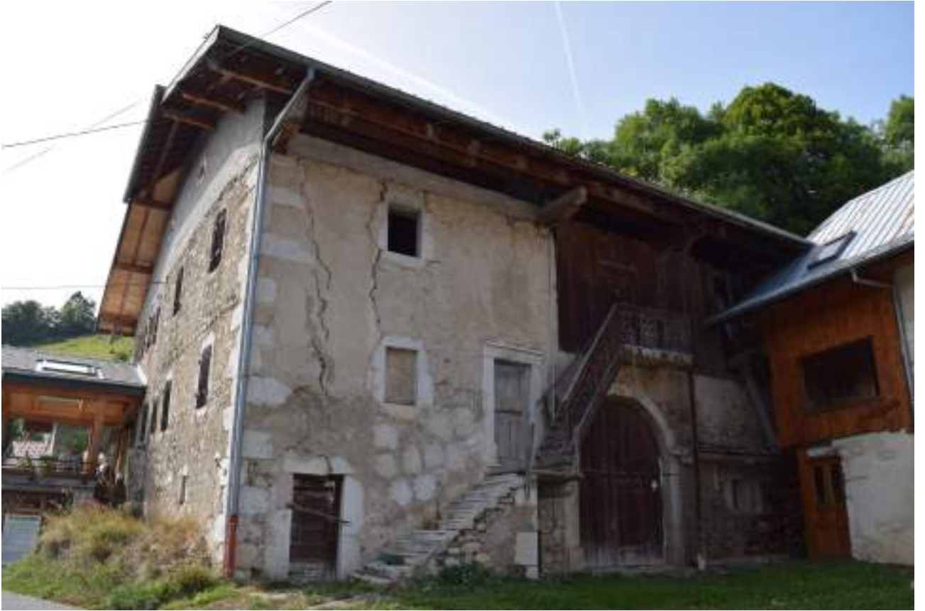
Fig. 6- Benand. Maison en cours de restauration.