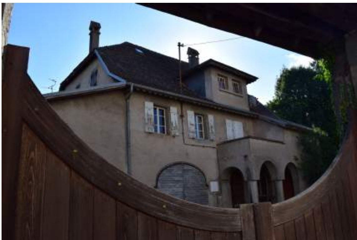
Fig. 13- Chef-lieu. Ancien presbytère face à l'église paroissiale.

Au sud-ouest et sur la place de la Paix se trouve le monument aux morts et le cimetière. Au nord, le village est formé de plusieurs habitations, dont un ancien café situé au bord de la route. Les maisons anciennes ne gardent que très peu d'éléments architecturaux anciens. On signalera toutefois une porte de grange au linteau de bois gravé de la date 1831 et d'une croix (fig. 16) rue de l'église. Sur la place de l'église, l'ancienne école enfantine et sa tour carrée existent toujours (fig. 17). En contrebas, les bâtiments de l'administration publique, tels que la mairie (fig. 18), la « petite » et la « grande » école, sont conservés. Autrefois, le hangar à pompes incendie se trouvait en contrebas de la mairie.