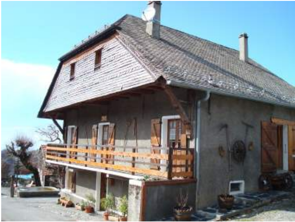
Fig. 10- Exemple d'habitat traditionnel, Chez les Aires.