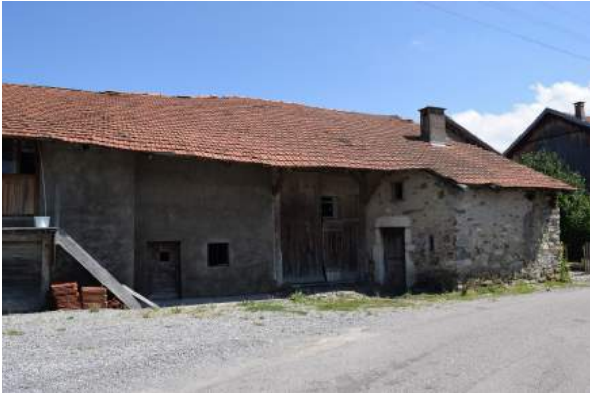
Fig. 17 - Habitat traditionnel Chez Thiollay.