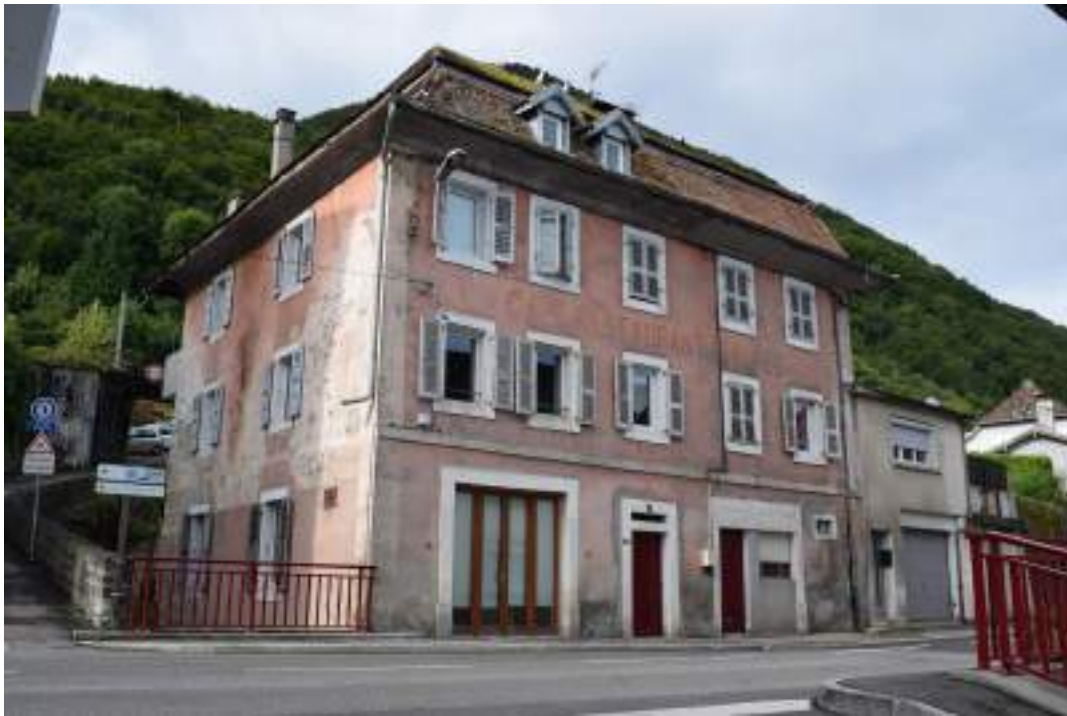
Fig. 4 - Ancien hôtel des Alpes et sa toiture typique.