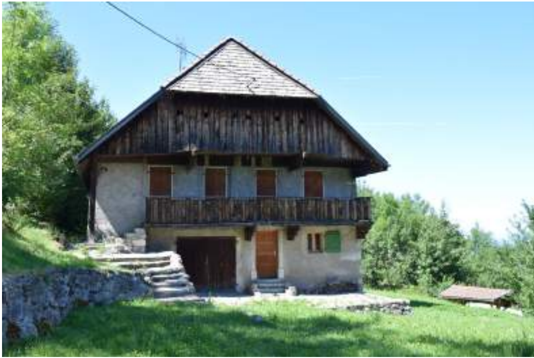
Fig. 14- Habitat traditionnel à Lajoux.