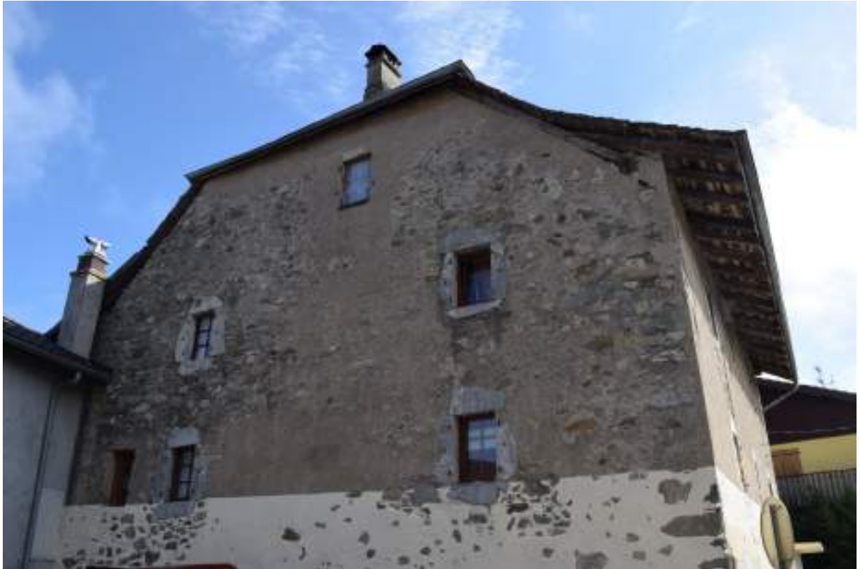
Fig. 9- Maison au Chef-lieu, façade occidentale.