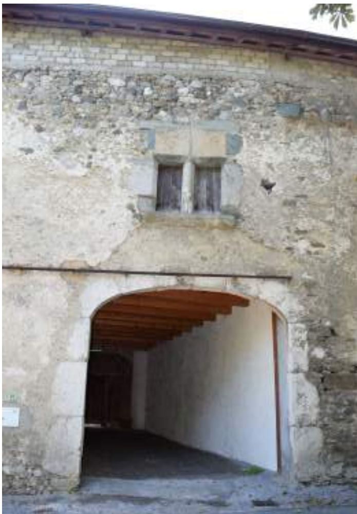
Fig. 9- Porte cochère et fenêtre à meneau.