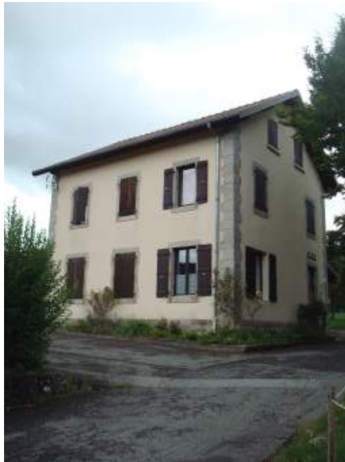
Fig. 14 - Chez les Girard, ancienne école.