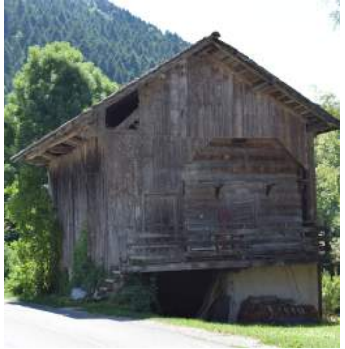
Fig. 3 - Grenier traditionnel.