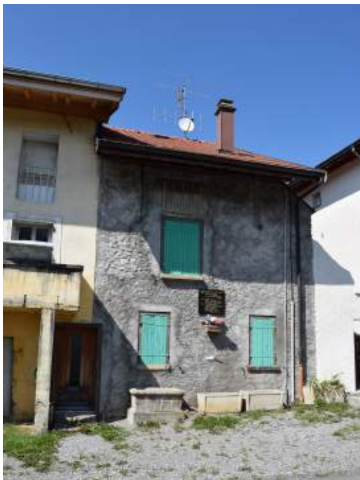
Fig. 18- Ancienne maison des frères Boujard.