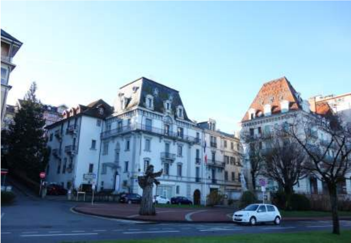
Fig. 20 - Château de Fonbonne et monument aux morts.