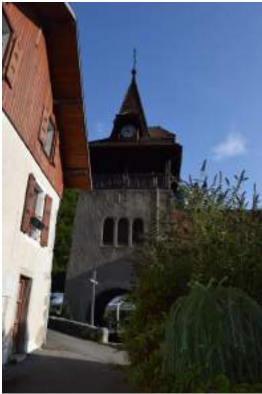
Fig. 3 - Clocher-porche.