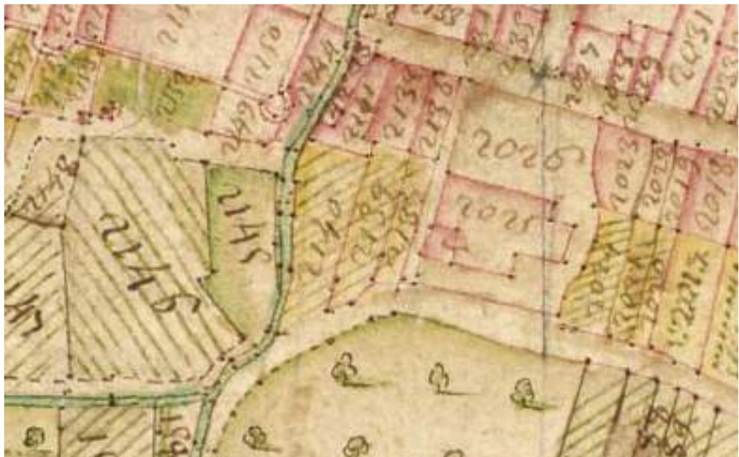
Fig. 4 - Extrait du cadastre sarde: le nant d'Enfer et l'église de la Touvière.