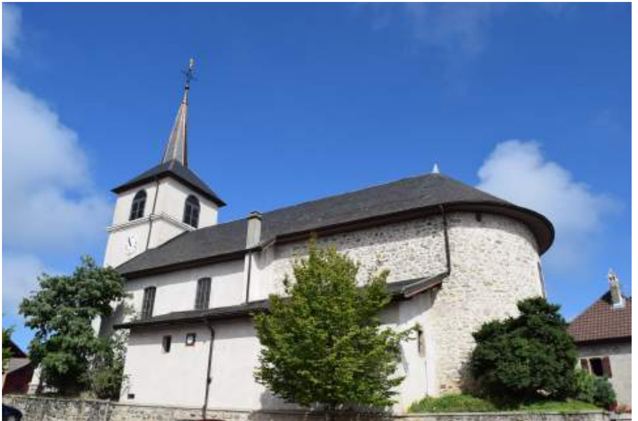
Fig. 4- Eglise paroissiale Saint-Maurice.