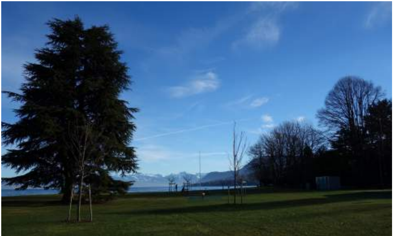
Fig. 1 - Le parc du miroir. Au fond les Préalpes françaises et suisses.