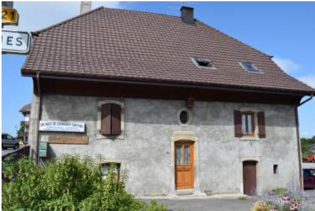
Fig. 6- Ancienne cure de Larringes.