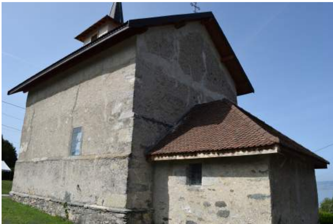
Fig. 4- Le choeur de la vieille église et sa sacristie.