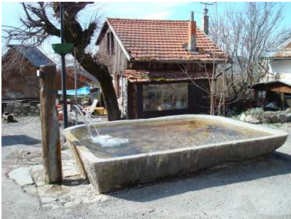
Fig. 9- Bassin Chez les Aires.