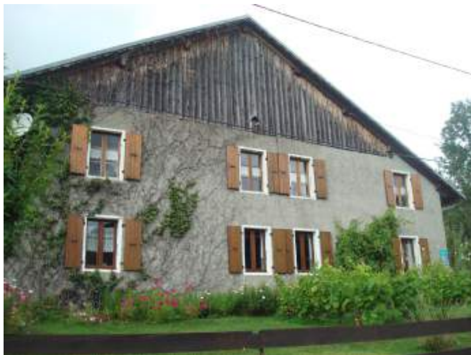
Fig. 15 - Chaux, maison ancienne.