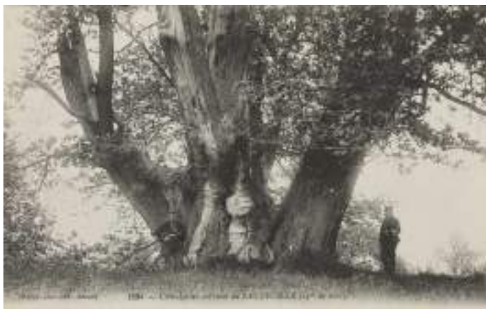
Châtaignier colossal de Neuvecelle (1899-1922).