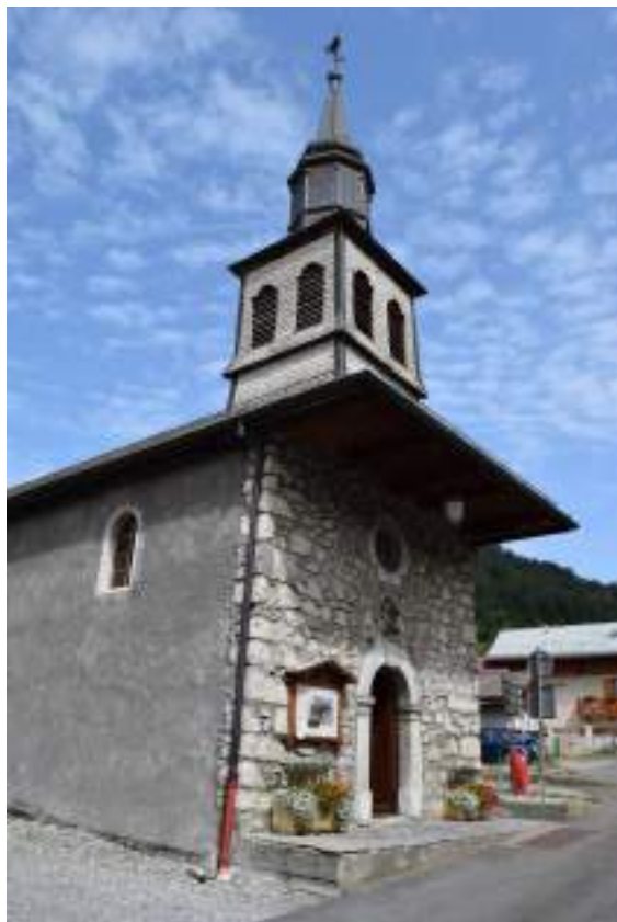
Fig. 22- Chapelle de Trossy.