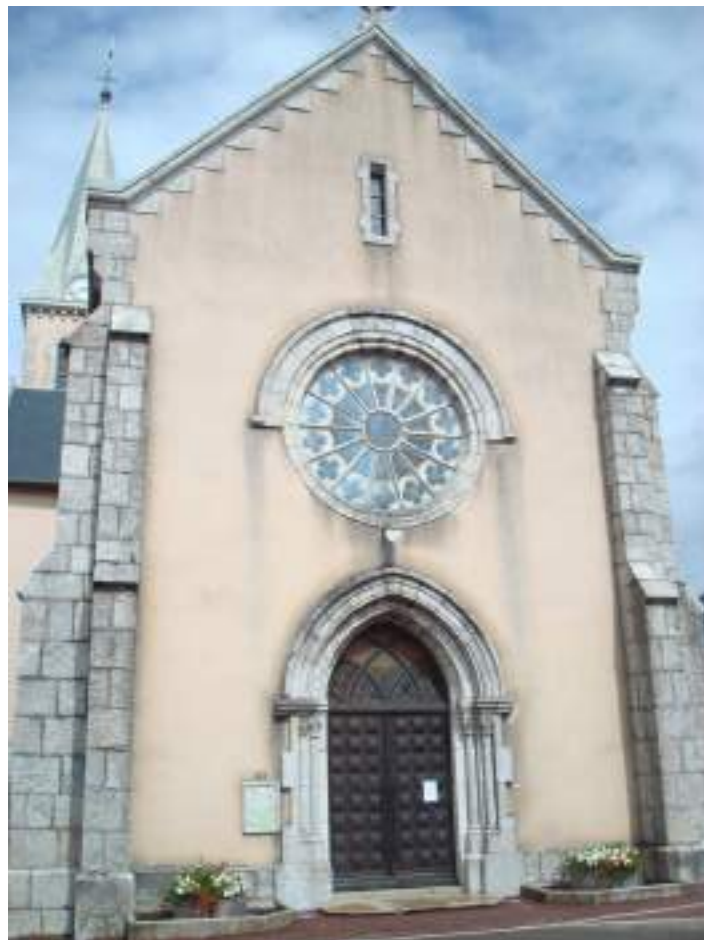
Fig. 9 - Vinzier, église paroissiale.