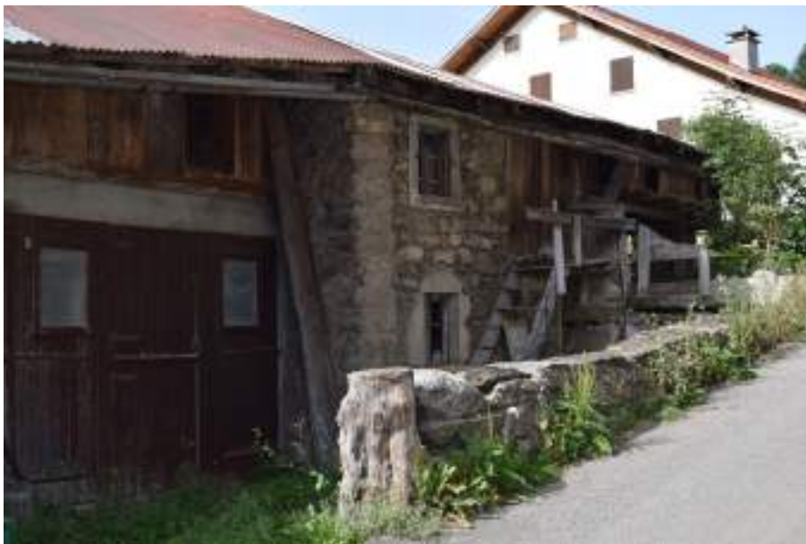
Fig. 4- Maison à Creusaz.