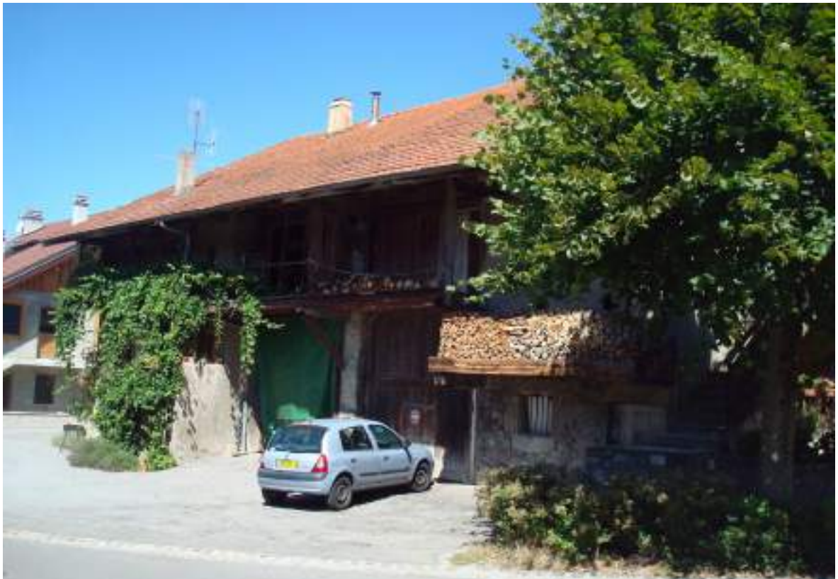
Fig. 7 - Loges à fascines en façade.