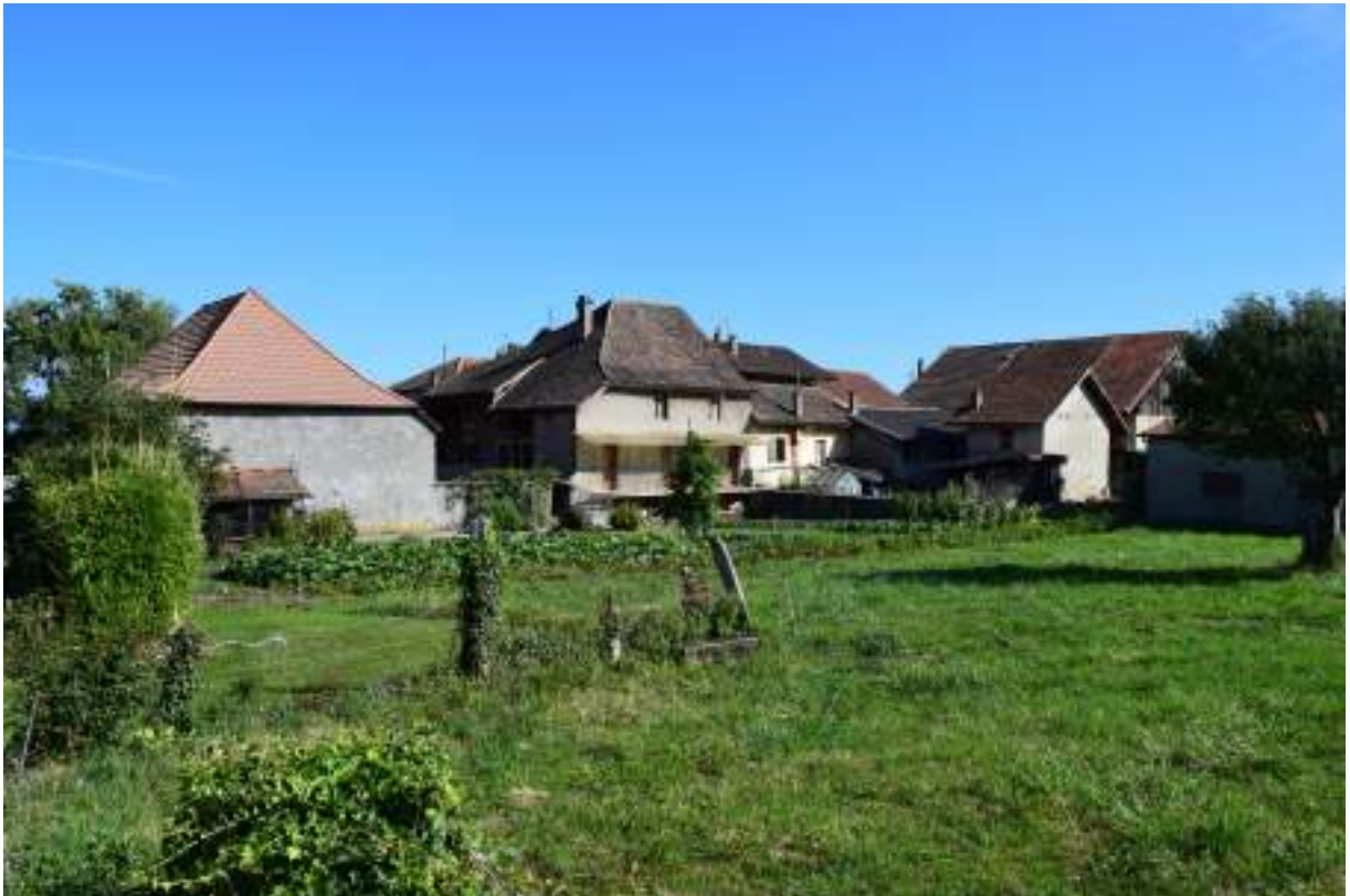
Fig. 1- Le village de Moruel.

les pentes le long de la Dranse, les vignes cultivées depuis des centaines d'années ont fait la renommée du village. La viticulture traditionnelle en « crosses » n'est plus pratiquée qu'anecdotiquement et a laissé place à des rangées de vignes modernes, que l'on aperçoit dès que l'on quitte Thonon-les-Bains en direction de la Dranse. En direction du Plan Fayet, des « cheminées de fée » sont visibles dans une zone protégée (ZNIEFF). Les prairies, cultures céréalières et maraichères, s'étagent jusqu'au sommet de la commune entre espaces naturels préservés et forêts. Il en est de même pour les nombreux villages composant le territoire : Sussinges, Avonnex, Moruel (fig. 1), Marinel, le Chef-lieu puis Chullien et Cornellaz. La forêt de Marin, qui s'étend le long de la Dranse jusqu'à la limite avec Féternes, est composée d'essences variées et abrite une faune et une flore protégée. Depuis les coteaux, le Léman, le Pays de Vaud et le Jura suisse sont parfaitement visibles.