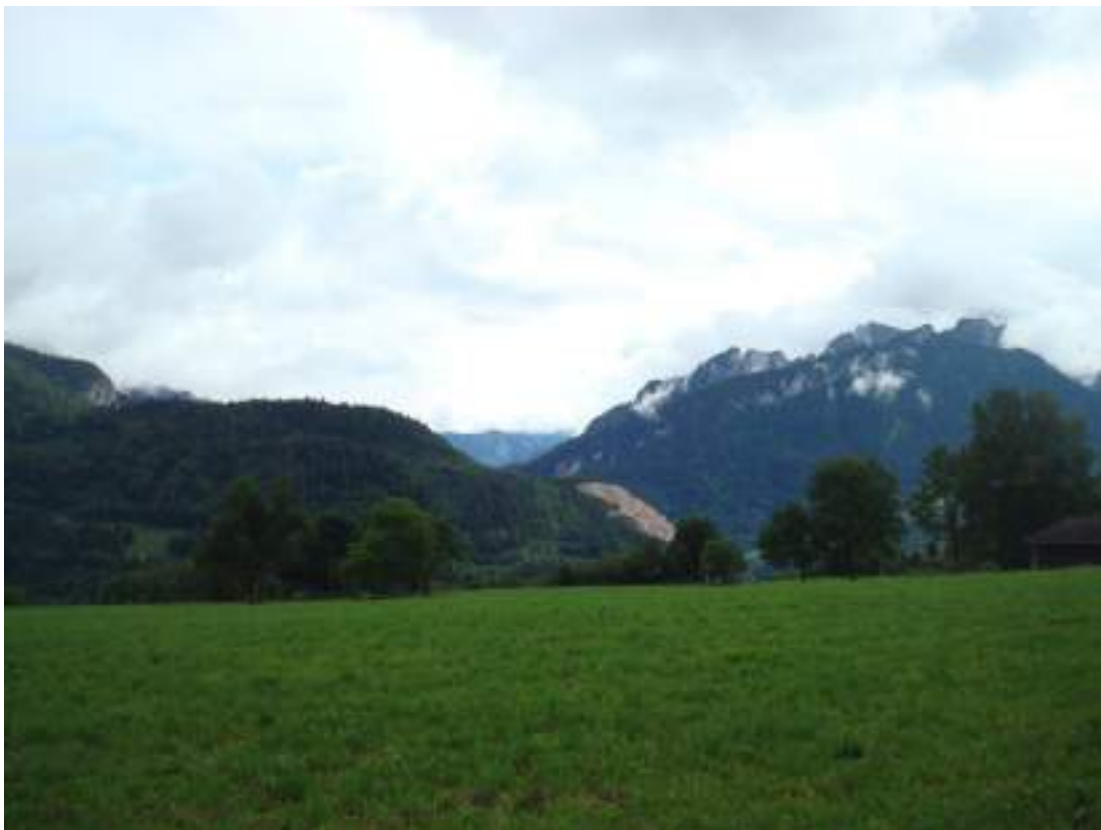
Fig. 2 - Vue sur La Forclaz et la vallée d'Aulps.