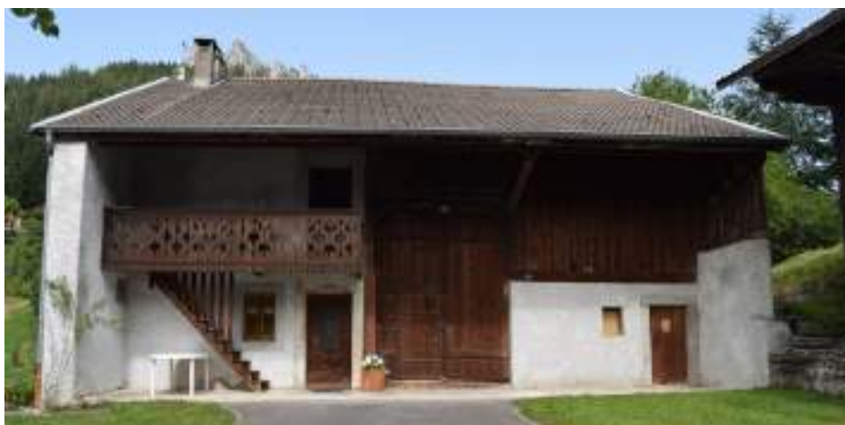
Fig. 17- Charmet. Maison ancienne.