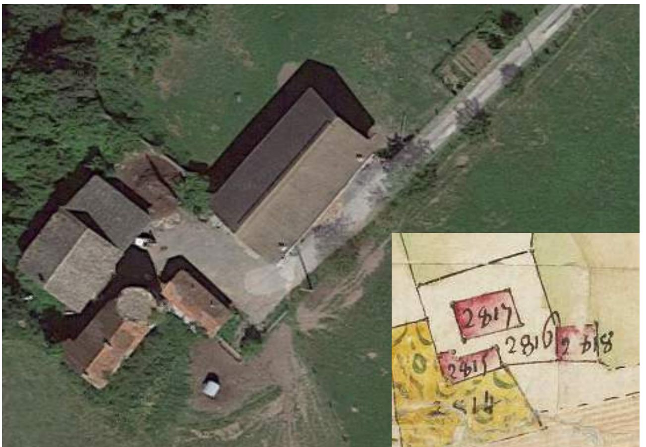
Fig. 3- La maison forte de La Chapelle d'après la mappe sarde et Google Maps.