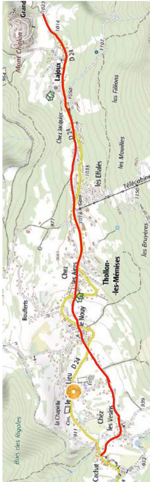
Fig. 24 - L'ancien chemin de Thollon.