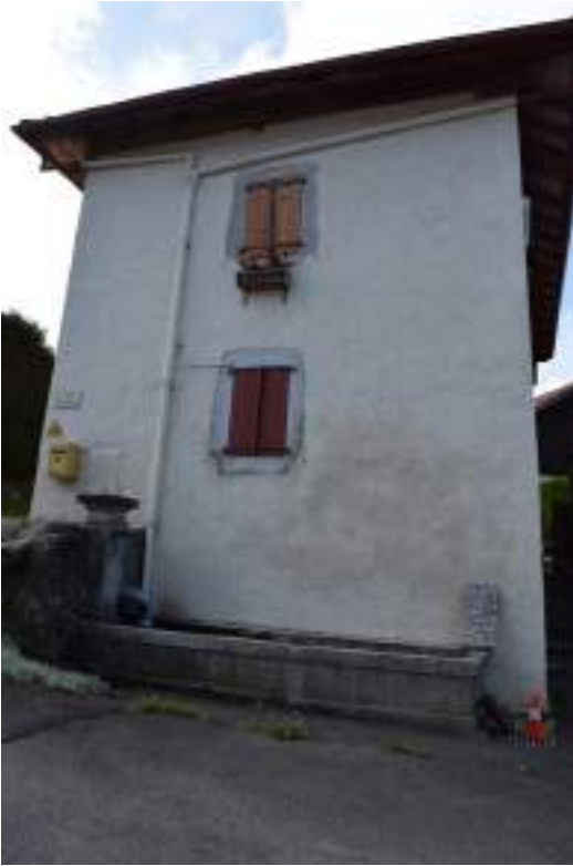
Fig. 11- Chez Desbois. Bassin et maison.