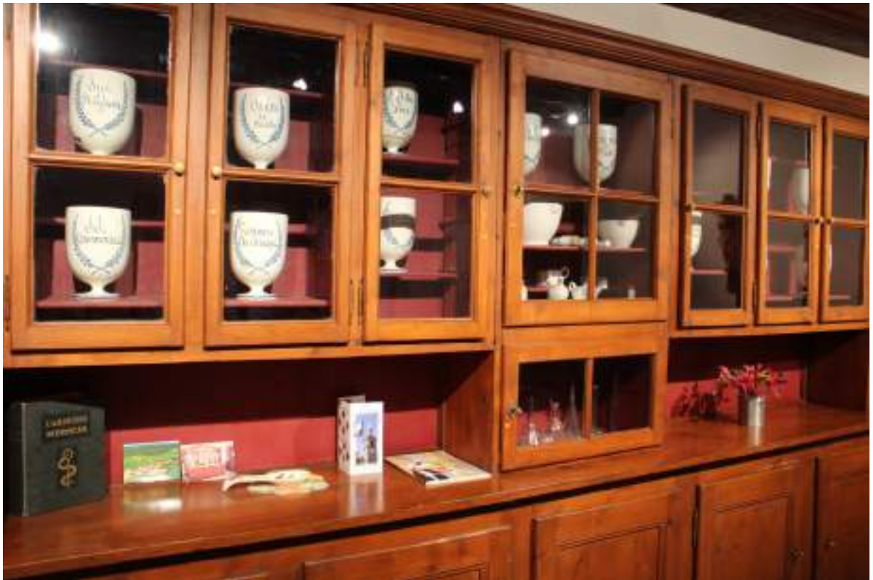
Fig. 6- La pharmacie des soeurs de la Charité.