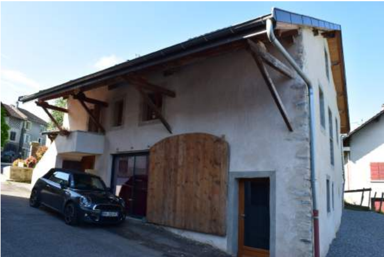
Fig. 12- Moruel. Maison restaurée.