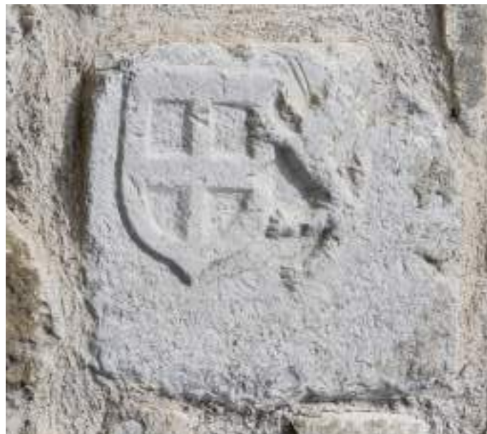
Fig. 5- Remploi (photo retournée).