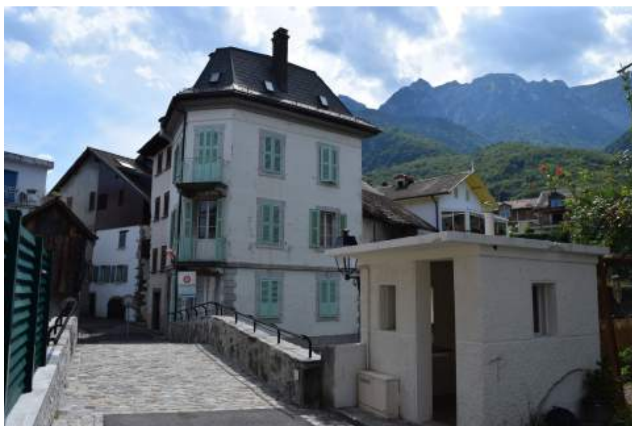
Fig. 10 - Le pont-haut sur la Morge et sa guérite de douanier.