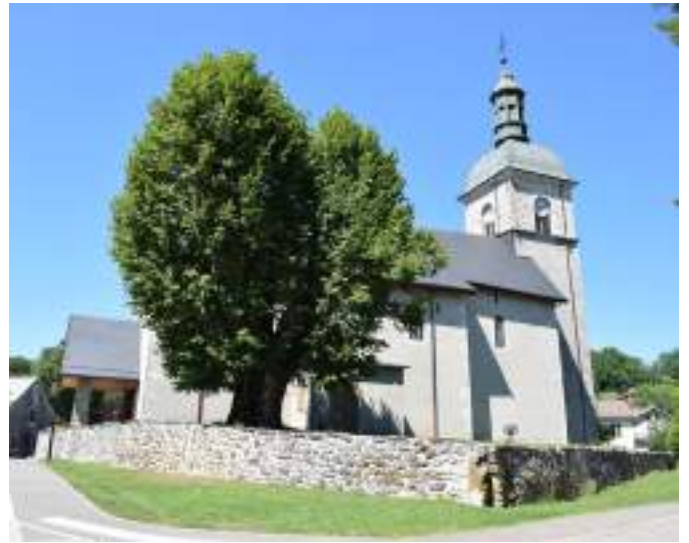
Fig. 6- Église Saint-Michel et tilleul.