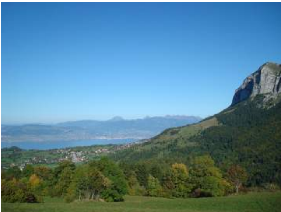
Fig. 1 - Le plateau de Thollon et les Mémises. Au fond le Léman et les Préalpes suisses.

- Village de la Station , architecture de station de ski.