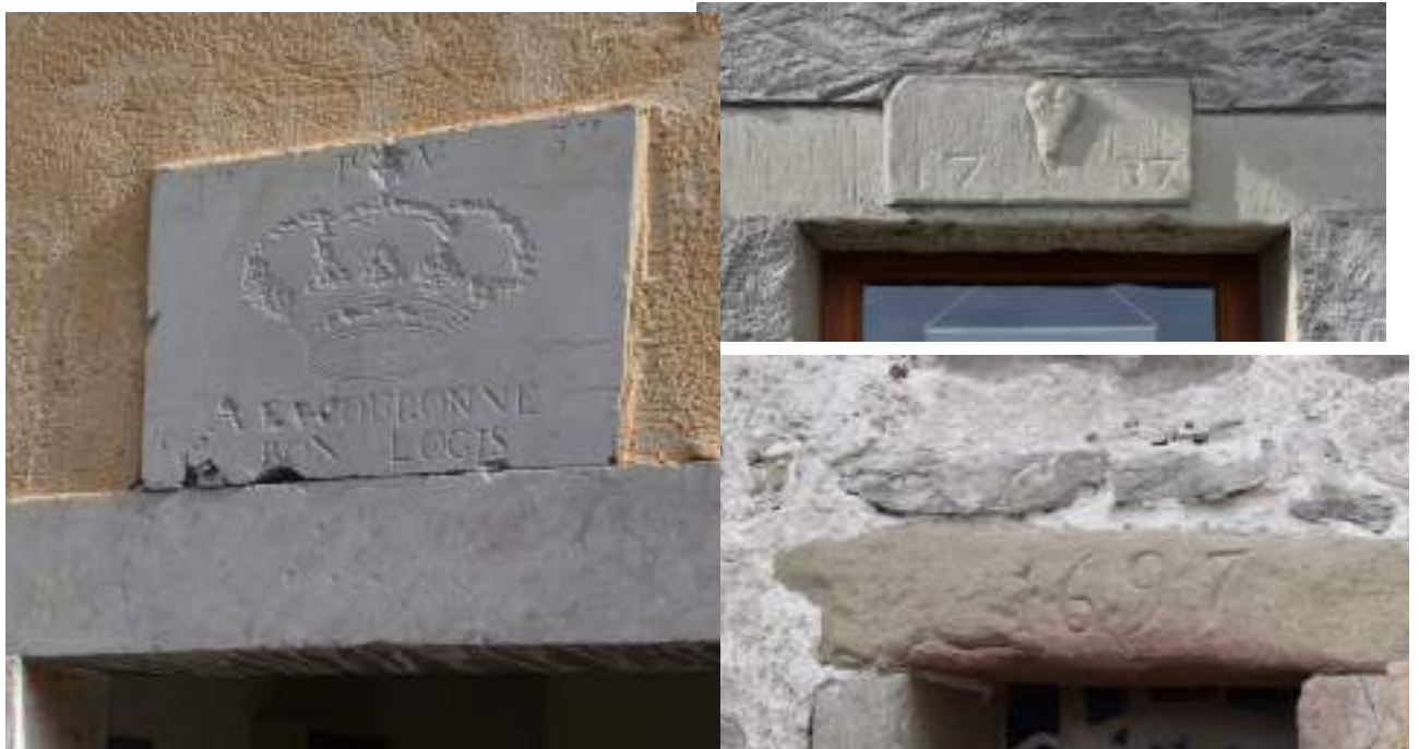
Fig. 9 - Rue des pêcheurs, quelques exemples de linteaux gravés.