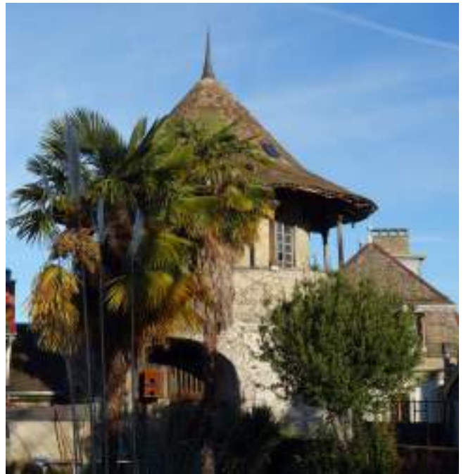
Fig. 10 - Dernier vestige du château.