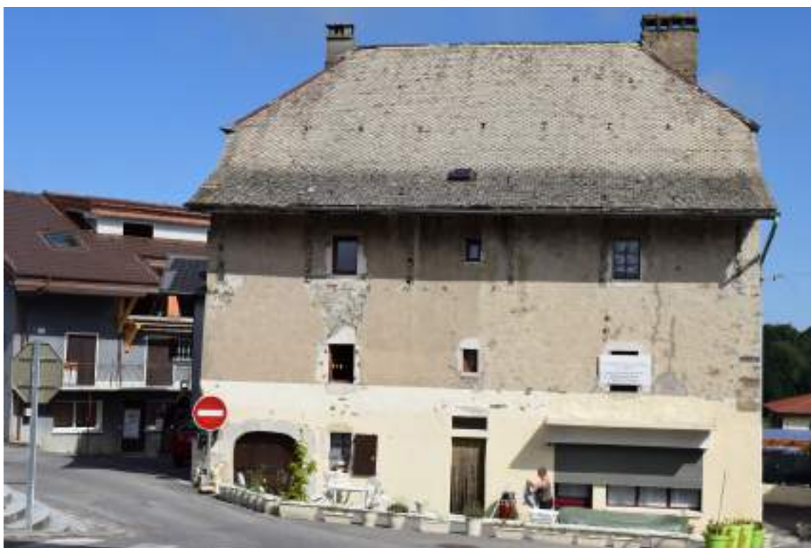
Fig. 8- Maison au Chef-lieu.