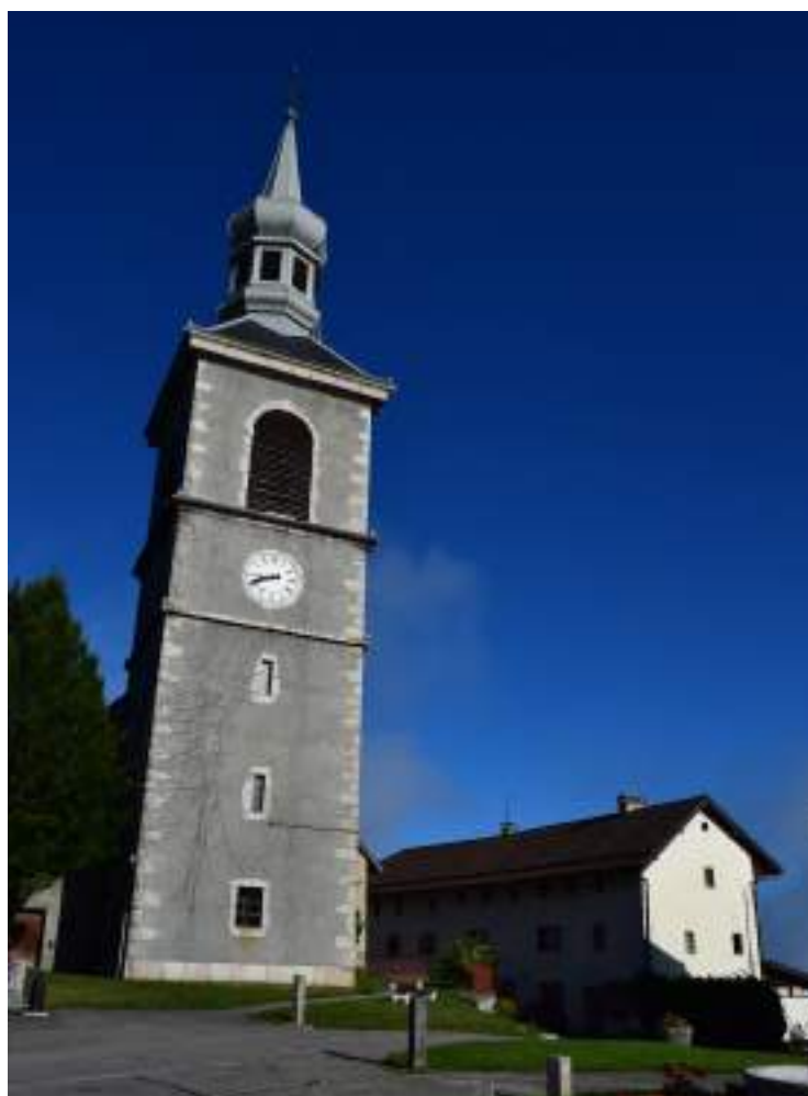
Fig. 5 - Le site de l'ancien prieuré aujourd'hui.