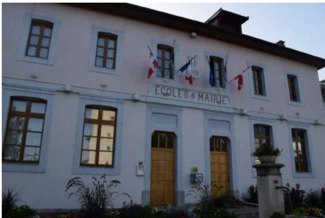
Fig. 10- Ancienne mairie-école du Chef-lieu.