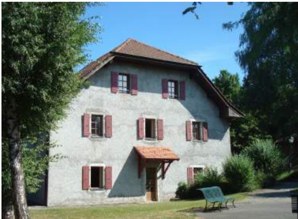
Fig. 3 - Ancien presbytère, mairie actuelle.