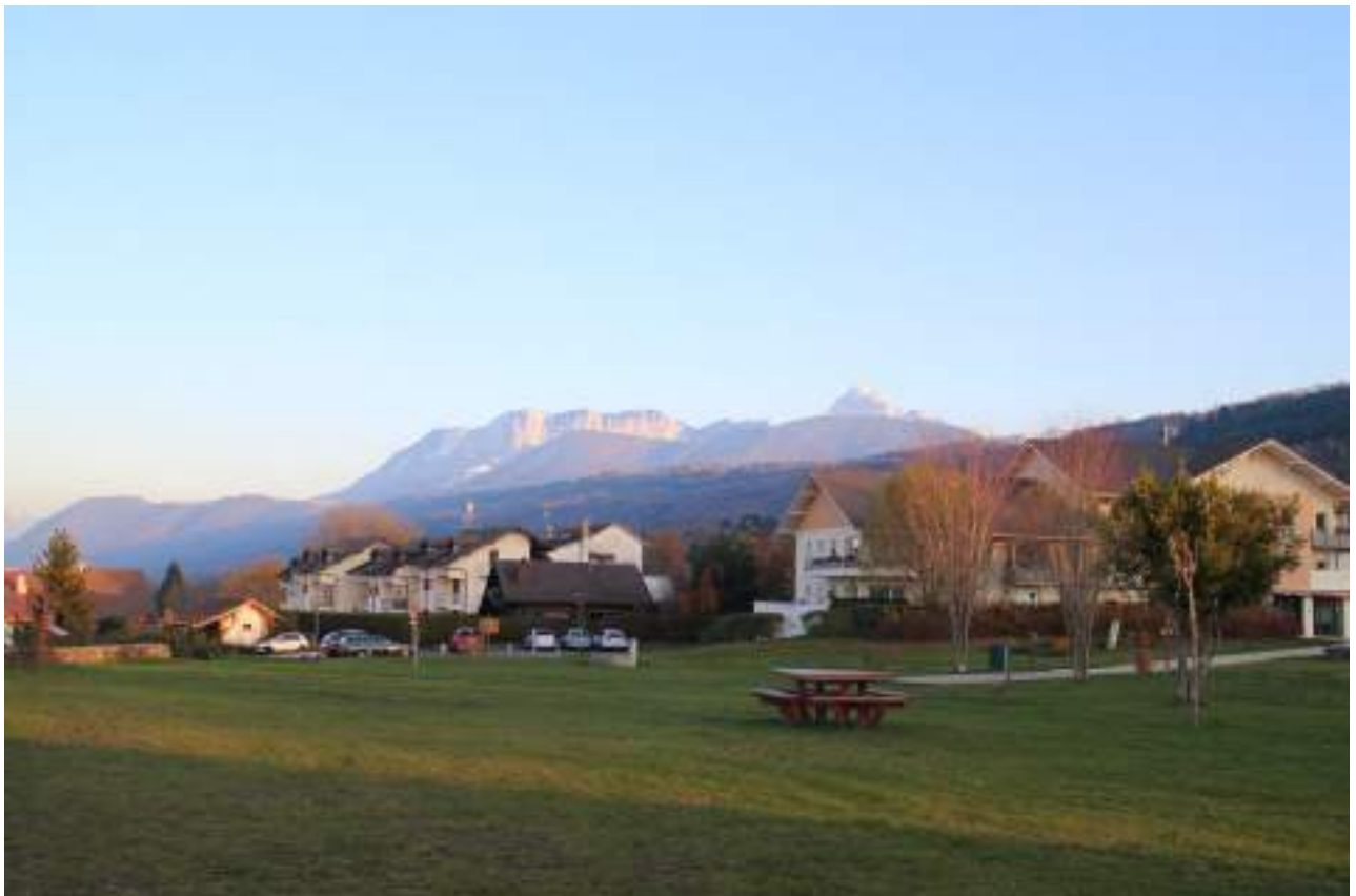
Fig. 2 - Neuvecelle, parc du Clair-Matin. Vue sur les Préalpes.