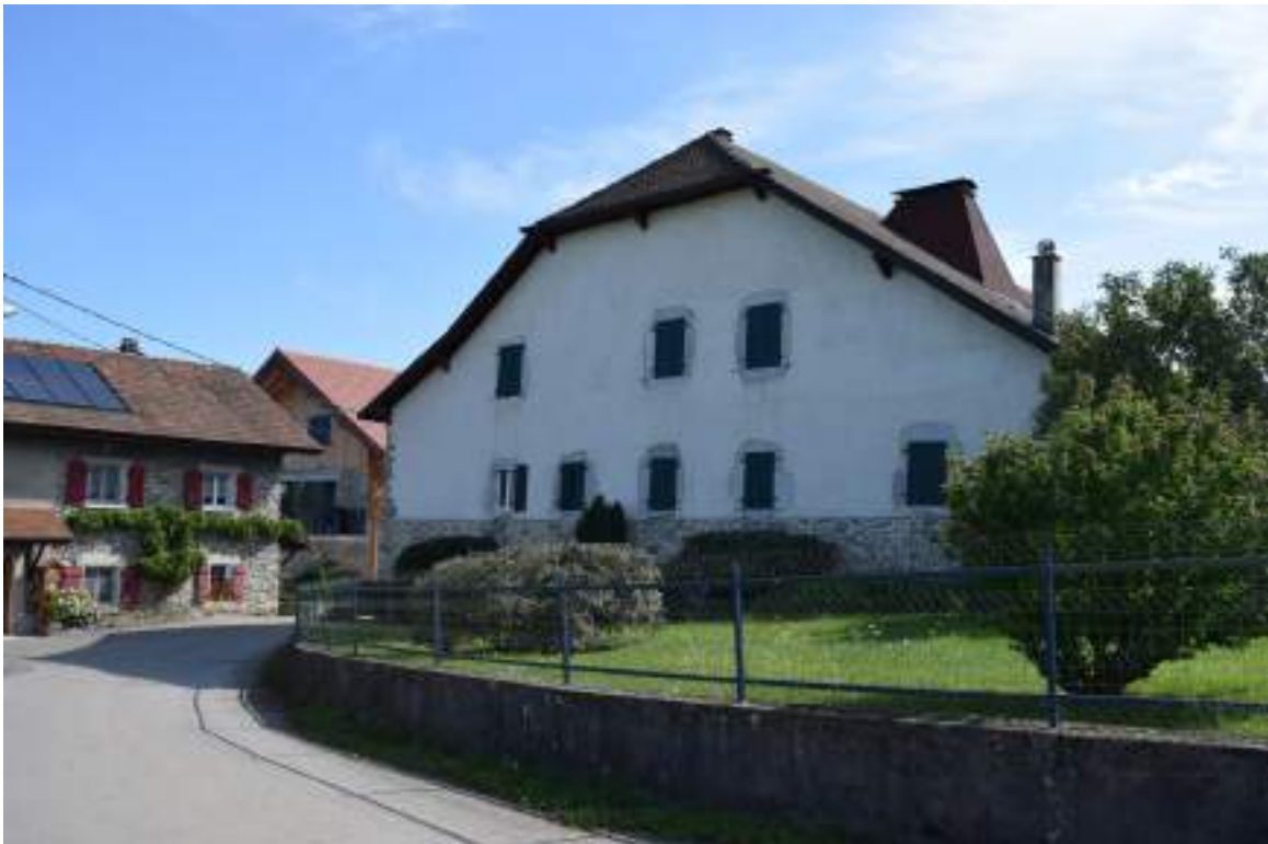
Fig. 13- Maison traditionnelle Chez Crosson.