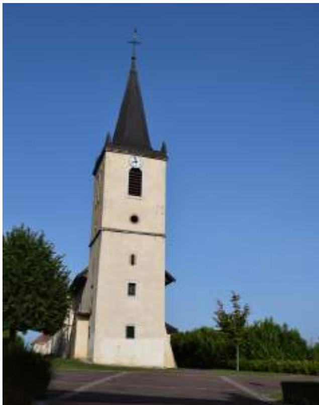
Fig. 9- Église paroissiale du XIX e siècle.