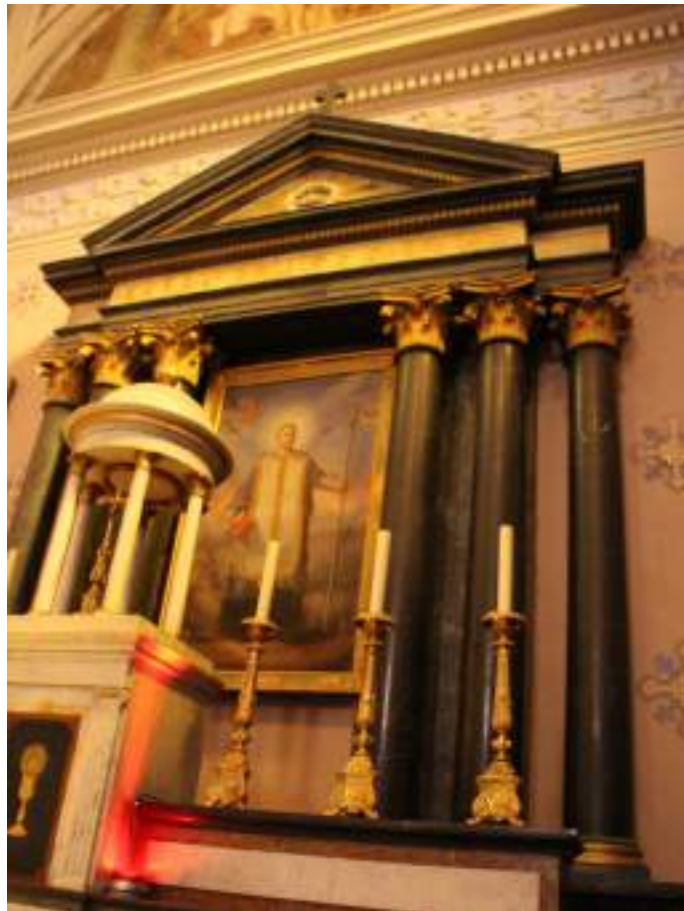
Fig. 27- Retable et peinture.