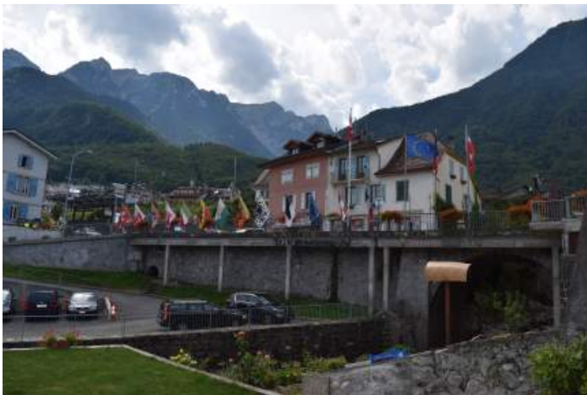
Fig. 1 - La Morge, frontière entre la Suisse et la France.