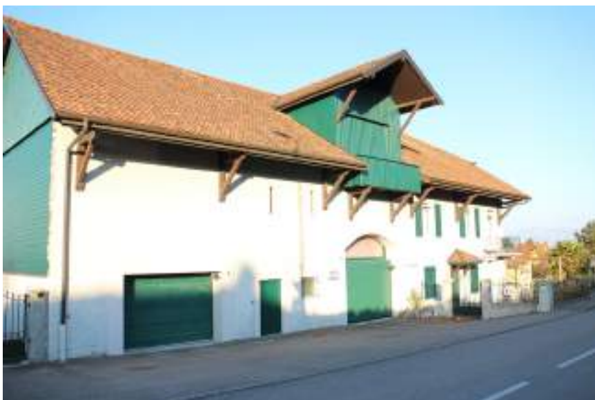
Fig. 12 - Chez Granjux.