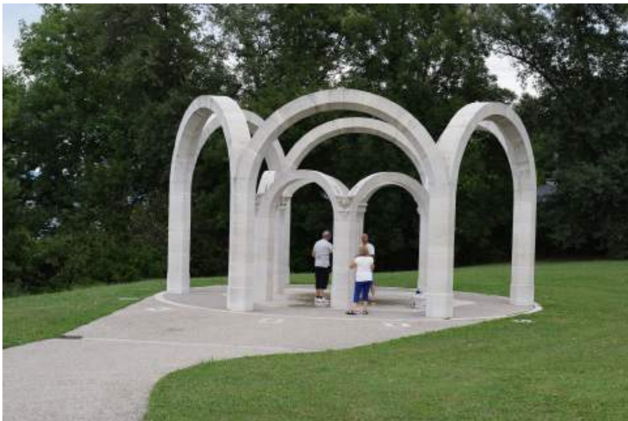
Fig. 5 - Le griffon de la buvette de Farquenoud.