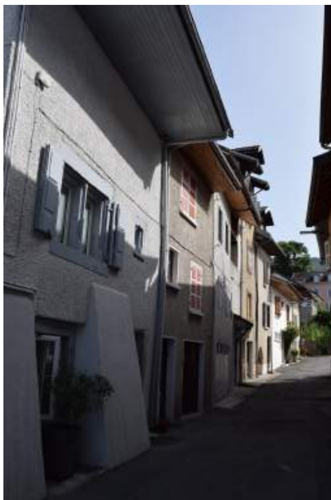
Fig. 8- Maisons de Tourronde.