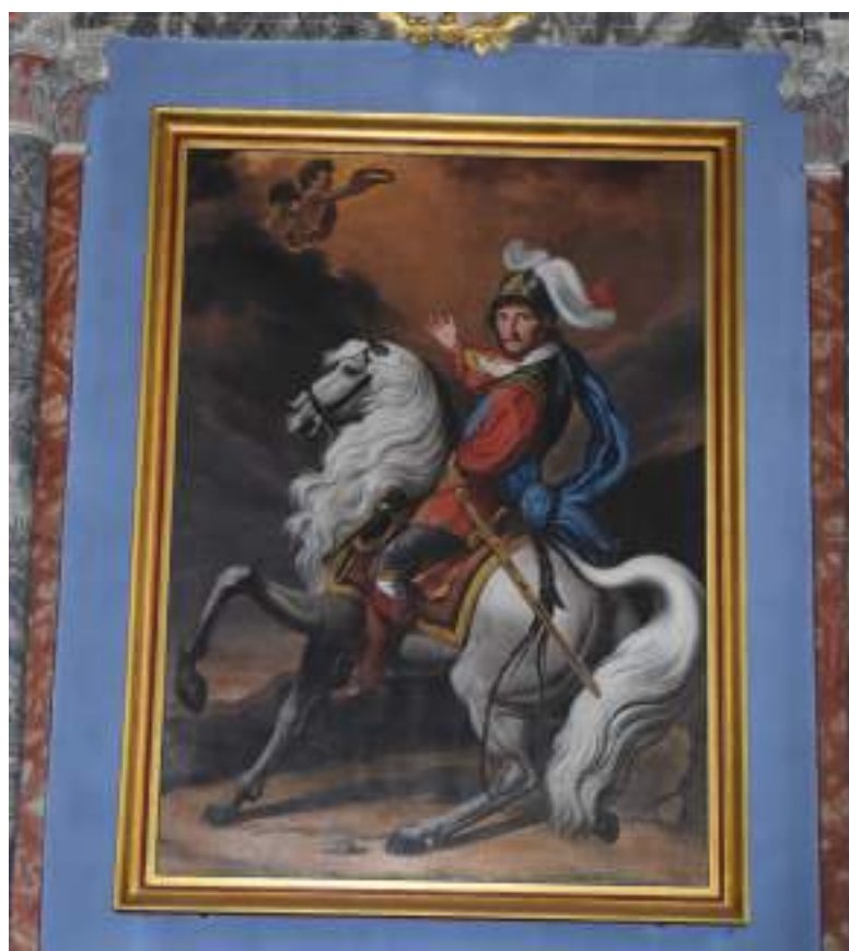
Fig. 2 - Tableau de saint Gengolph.