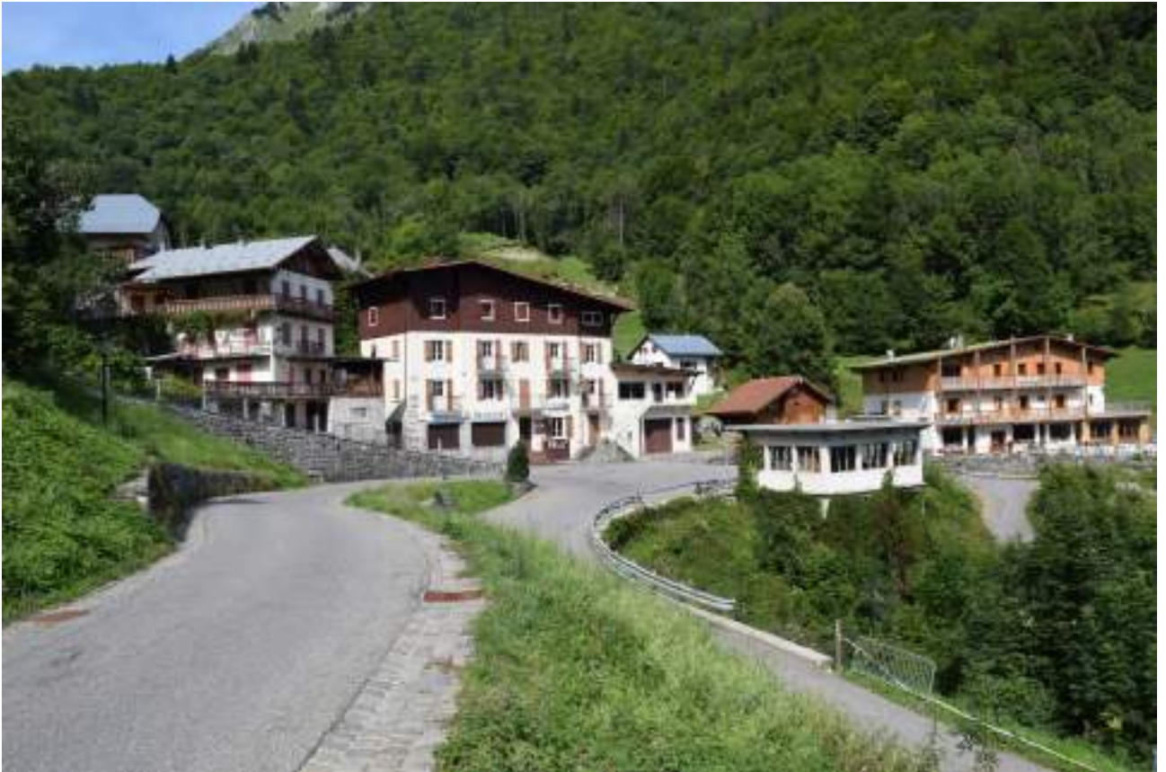
Fig. 6 - Hôtel du Grammont et gîte Le Clozet,