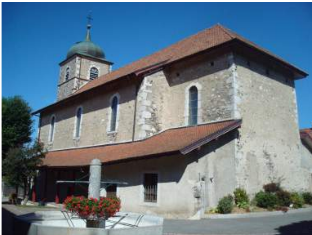
Fig. 1 - Champanges, église paroissiale.

- Bornes à la frontière de Publier (deux, elles sont sculptées de la croix de Saint-Maurice).