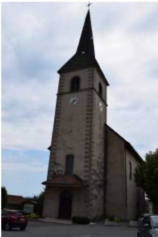
Fig. 6 - Église paroissiale.