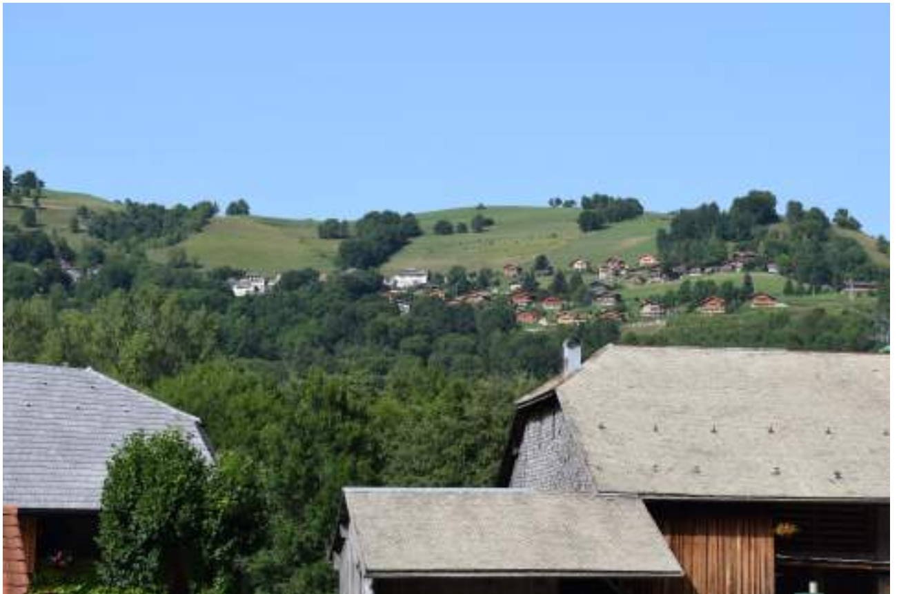
Fig. 1- Mont Bénand depuis le fond de la vallée.