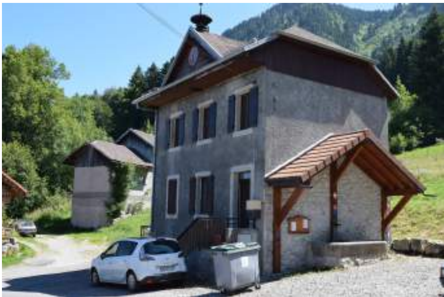
Fig. 13 - Ancienne école de Lajoux.