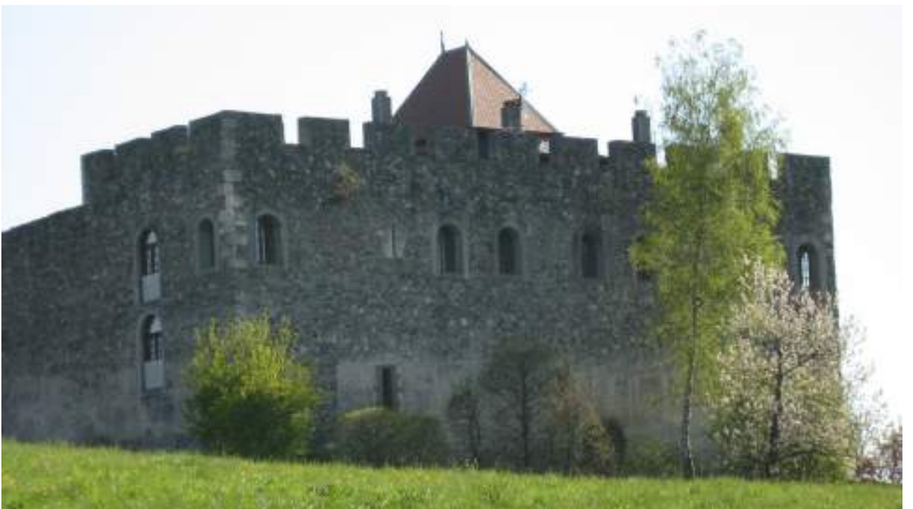
Fig. 3- Le château de Larringes en 2008.