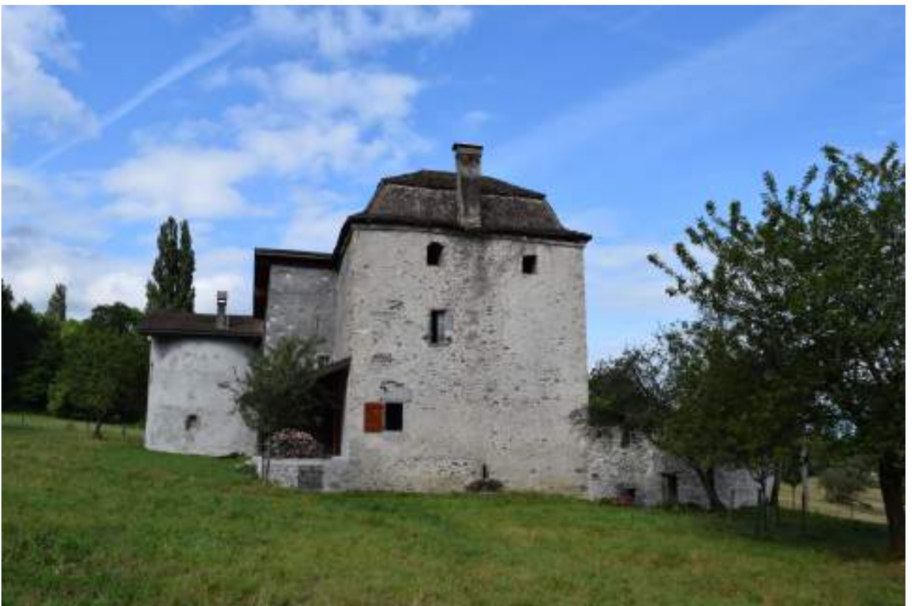
Fig. 3- La maison forte de Chatillon.