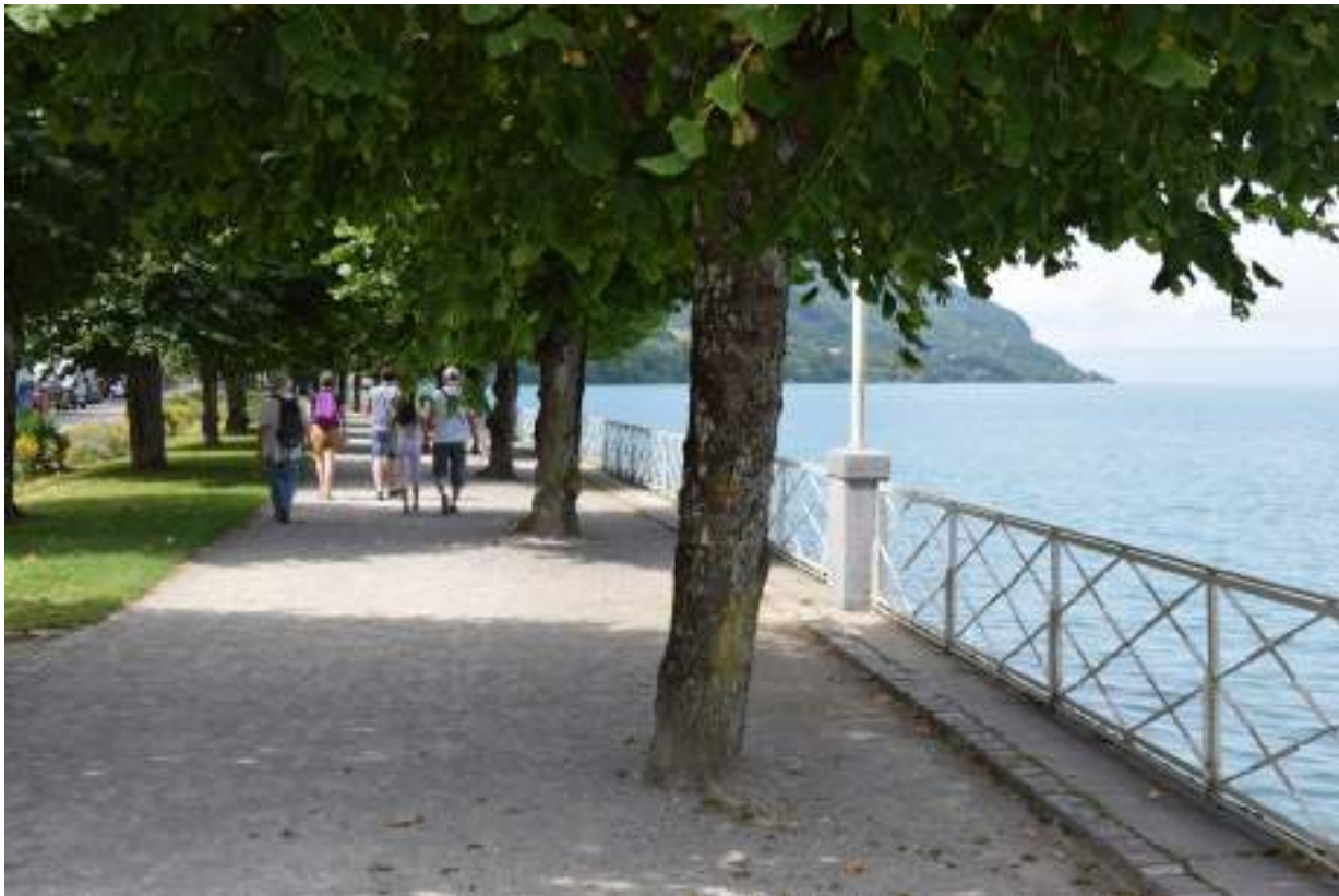
Fig. 3 - Les quais de Saint-Gingolph.