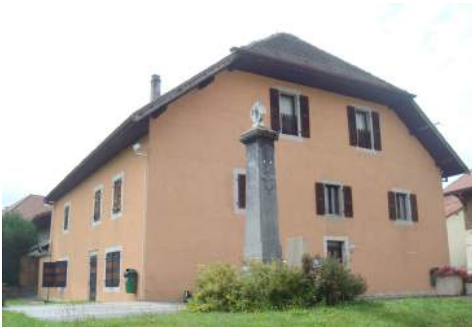
Fig. 5 - Ancien presbytère, place de l'église.

Quelques vestiges de la période de la Seconde Guerre mondiale existent toujours au Chef-lieu.