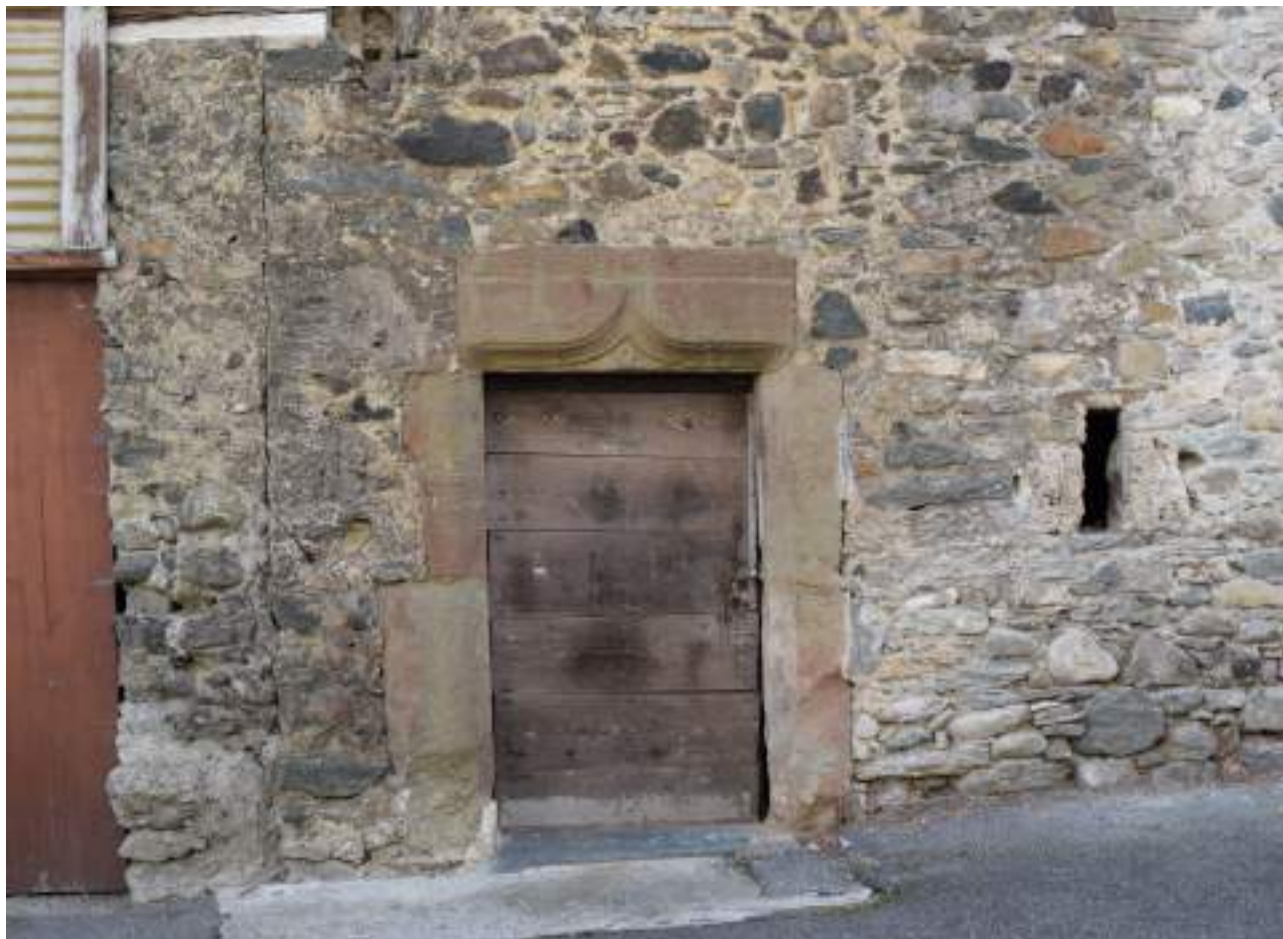
Fig. 11- Porte de molasse, vieille maison de Petite-Rive.