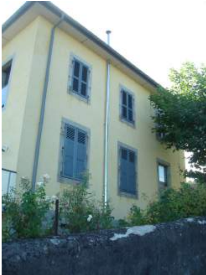
Fig. 3 - L'ancienne école de Méserier.