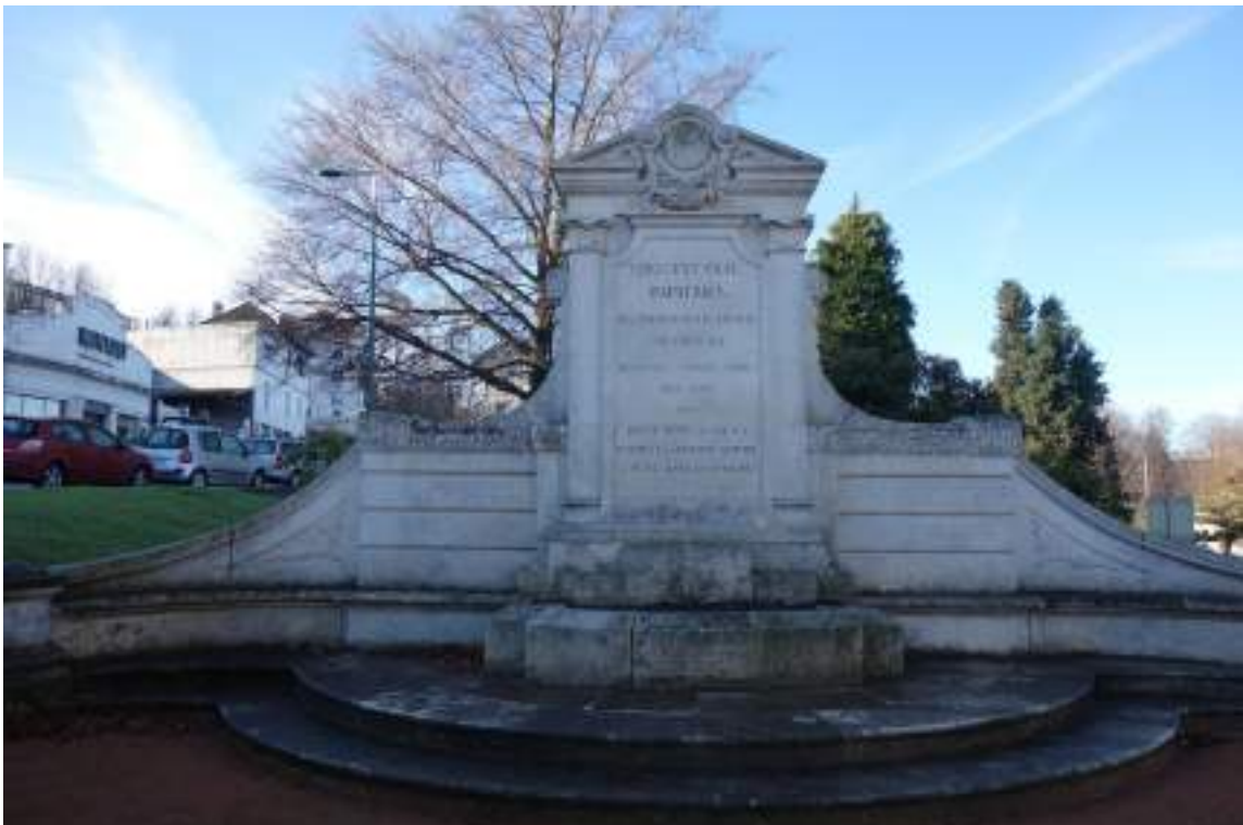
Fig. 26 - Monument aux rapatriés.