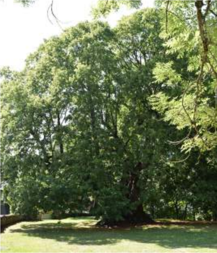
Fig. 2- Tilleul remarquable de Château-Vieux.