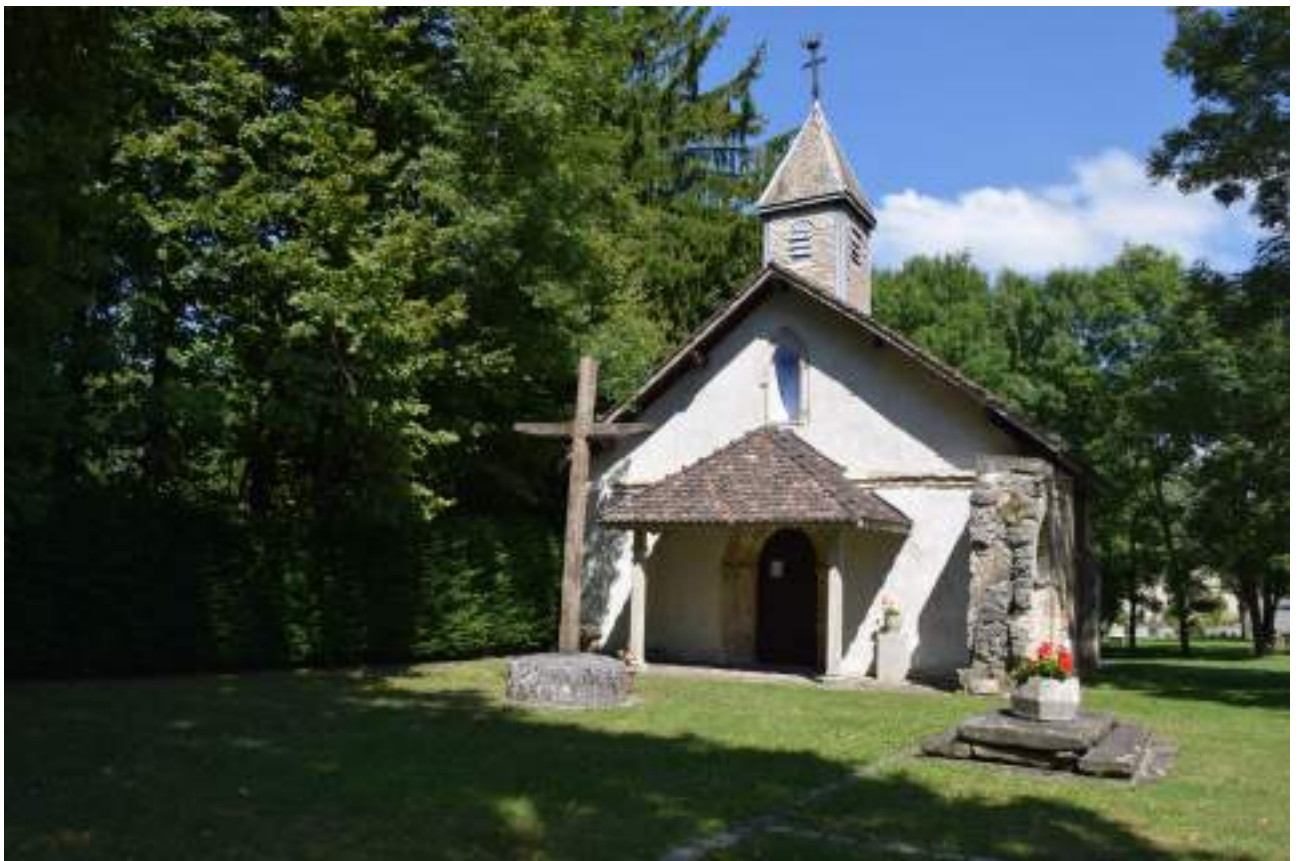
Fig. 7- Chapelle de Château-Vieux.