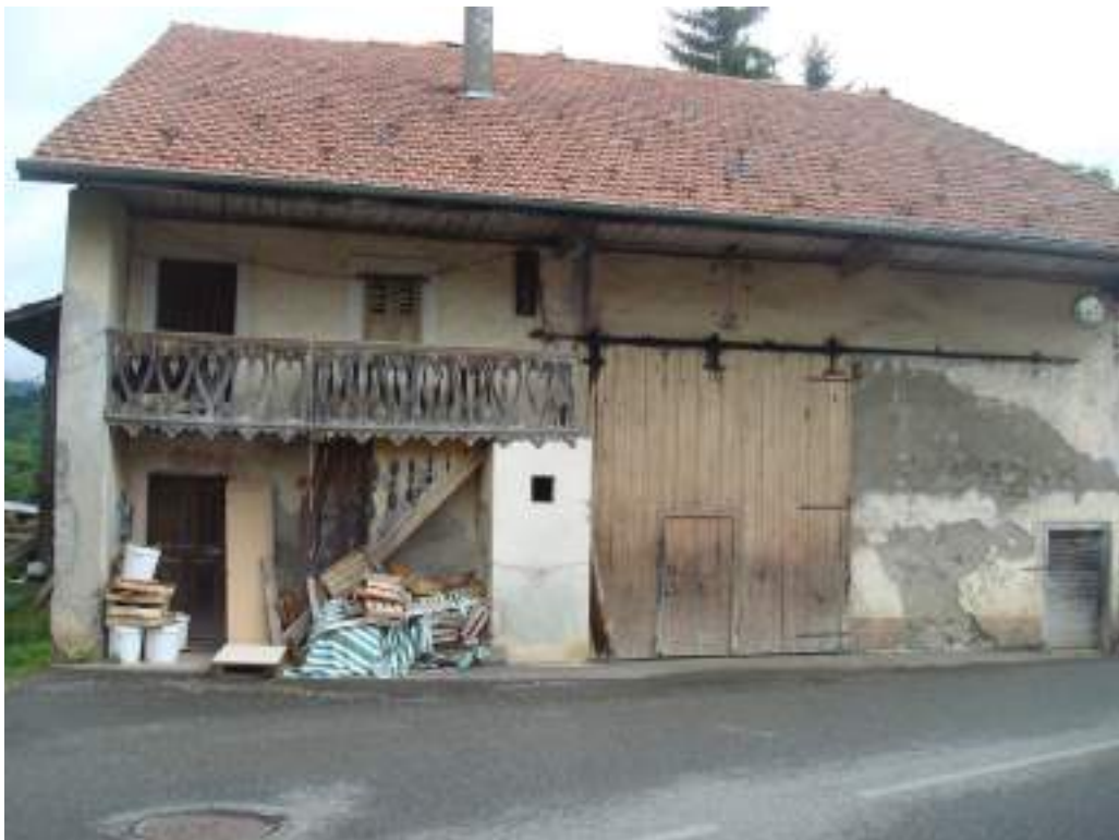
Fig. 7 - Vinzier, maison traditionnelle.