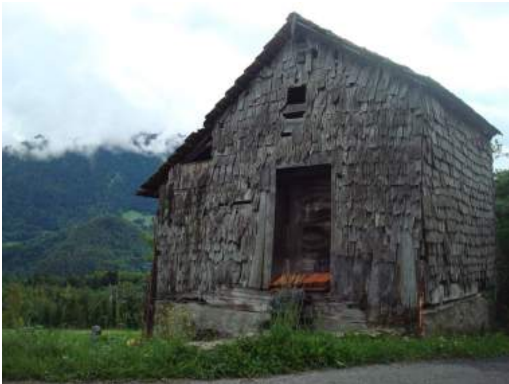
Fig. 16 - Chau, grenier traditionnel.