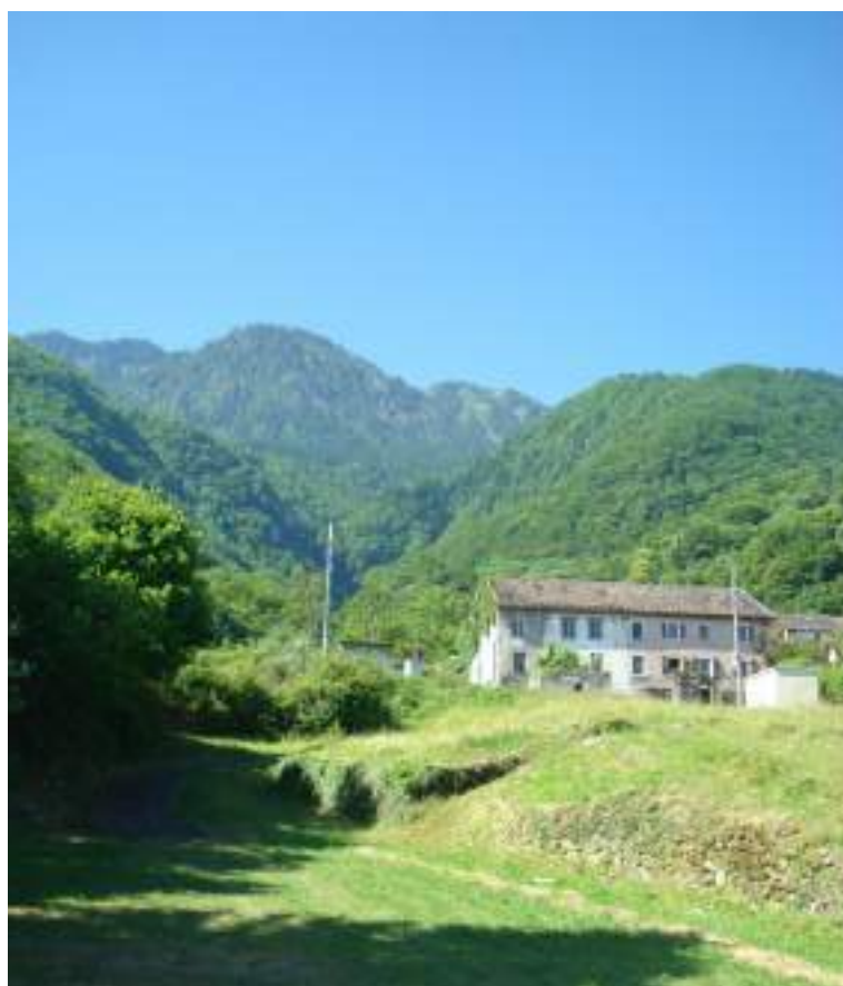
Fig. 11 - Le Locum et le site de l'ancien moulin du prieuré de Meillerie.