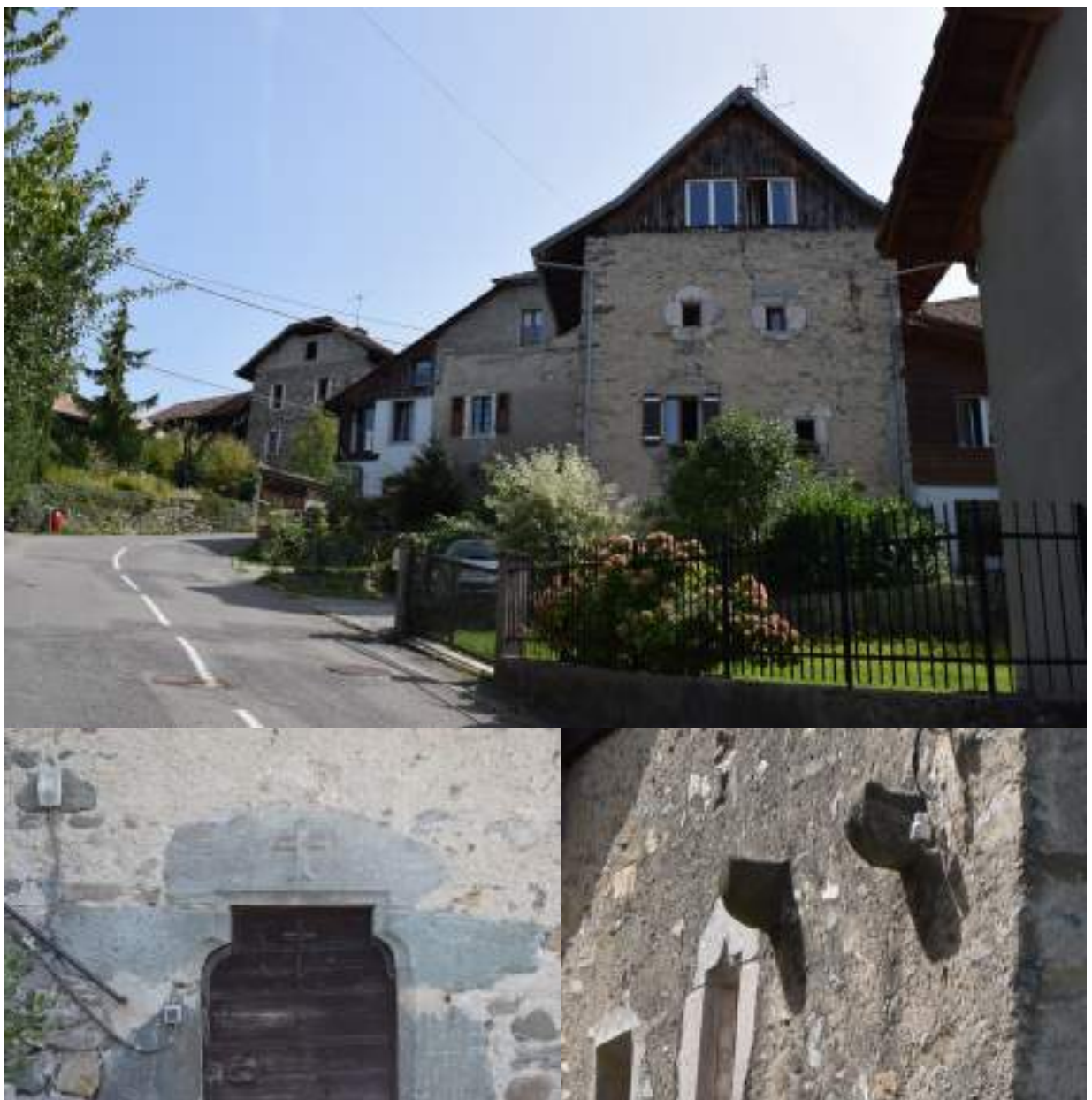
Fig. 6- Maison de Cortunay et détails.