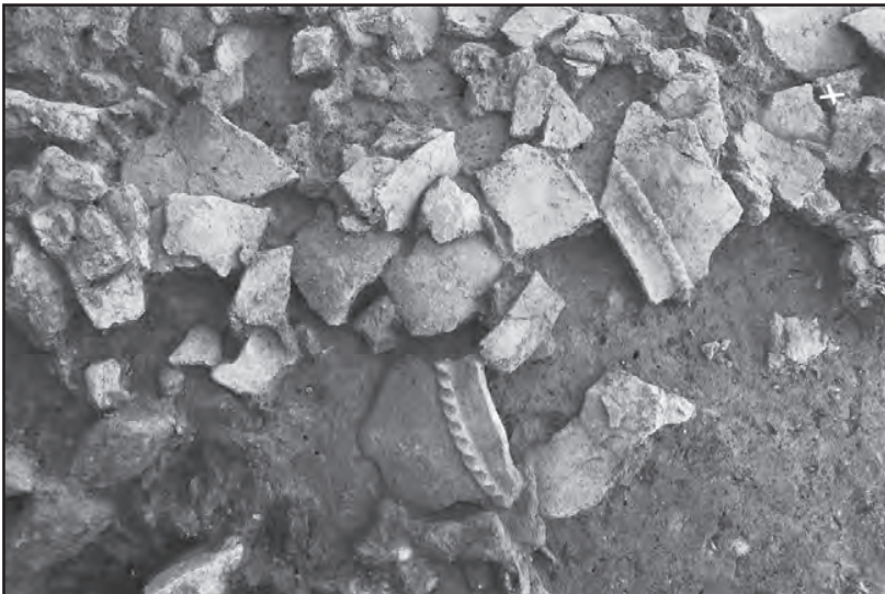
Fig. 3 : Détail des céramiques dans le niveau de démolition hallstattien.

sur le fond, déposé dans une anfractuosit  du rocher un bracelet en bronze, un fond de c ramique et une cr maill re en fer.