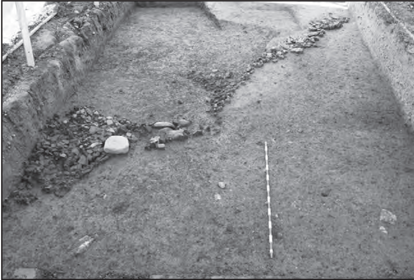
Fig. 2 : Les restes de la paroi effondrée. On remarque dans la partie gauche le pourtour circulaire d'une fosse laténienne qui a perturbé le niveau hallstattien.