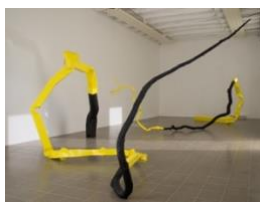
Torse I , 2005, tube carré peint, bois d'amandier calciné, 2,1 x 6,2 x 4,1 m Torses II , 2006, tube carré peint, bois de pin calciné 2,7 x 5,7 x 3,5 m

Les étudiants sont mis en situation active de questionner la perception des œuvres et de l'espace d'exposition par le moyen du dessin et par une expérimentation corporelle nommée corps-et-graphique : elle relève de l'écriture du corps dans l'espace (chorégraphie) et a recourt au mouvement dansé, tout en restant dans le champ des arts plastiques que le terme de « graphie » convoque.