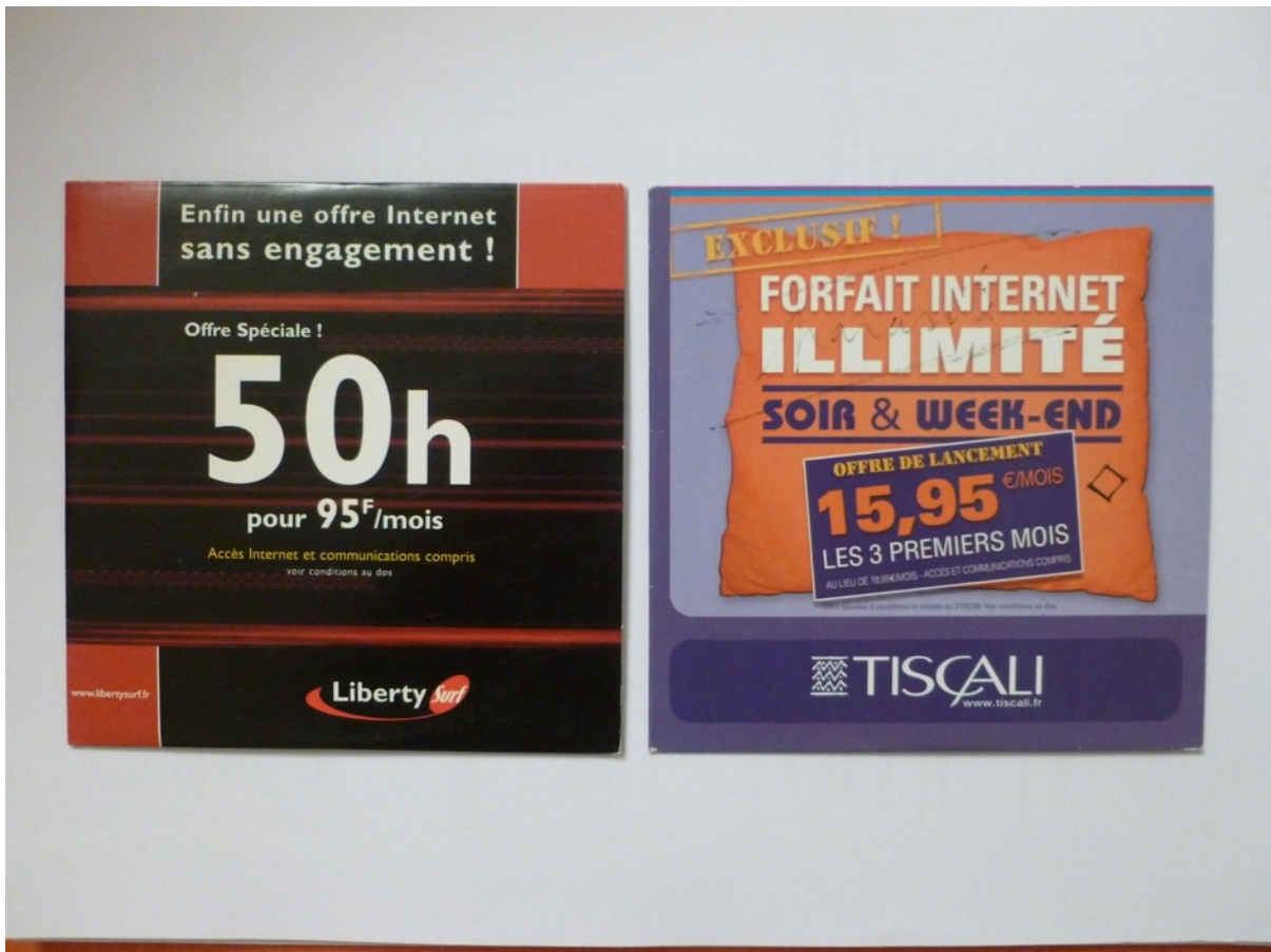
Figure 3 : kits de connexion distribués par des fournisseurs d'accès internet et laissés sur des présentoirs à la disposition des consommateurs dans les grandes surfaces et magasins divers

Comment sont traitées les données et quels sont les choix des éditions en matière de design ? À la fin des années 1990, le support CD-ROM est devenu bon marché, il complète des magazines de grand tirage, il est même distribué gratuitement à l'image des kits de connexion internet.