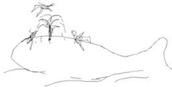
Figure 6 : à gauche : détail d'une maquette de projet (Proposal For Revelle Plaza), à droite : détail du gribouillis graphique d'une interpolation (interface de présentation des projets architecturaux. Baleine inspirée du projet Land Ho), Vito Acconci /Acconci Studio. Une architecture en projet , DVD-ROM, Présent