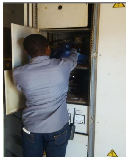
Figure 1 – Maintenancier SNEL

Pour illustrer cette fréquence nous montrons un cas typique du programme délestage de la cabine LAMORAL au quartier Bel-air dans la commune Kampemba à Lubumbashi (tableau 1).