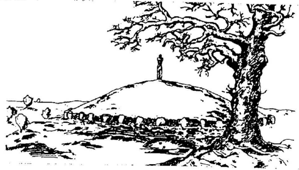
Fig. 1 : plan de fouille du tumulus de Hirschlanden, d'après Zürn 1964 ( Germania t. 42, 1964, p. 27-36) et reconstitution du tumulus d'après Zürn 1970 ( Hallstattforschungen in Nord Württemberg 1970)