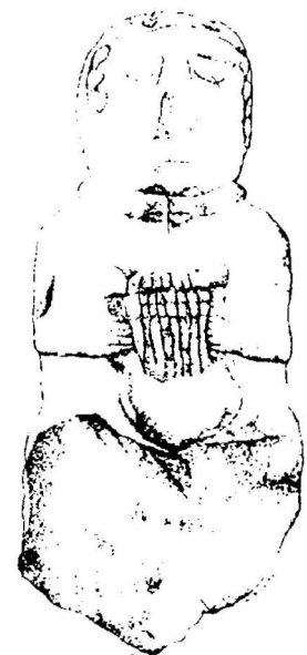
Fig. 2 : plan du site de Saint-Symphorien avec emplacement des découvertes des statuettes, d'après Menez 1996 ( L'Archéologue n°25 octobre 1996) et dessin de la statuette à la lyre, d'après Arramond, Menez, Le Potier 1992 ( Archéologie et travaux routiers départementaux. Le camp de Saint-Symphorien à Paule dans les Côtes-d'Armor , 1992)