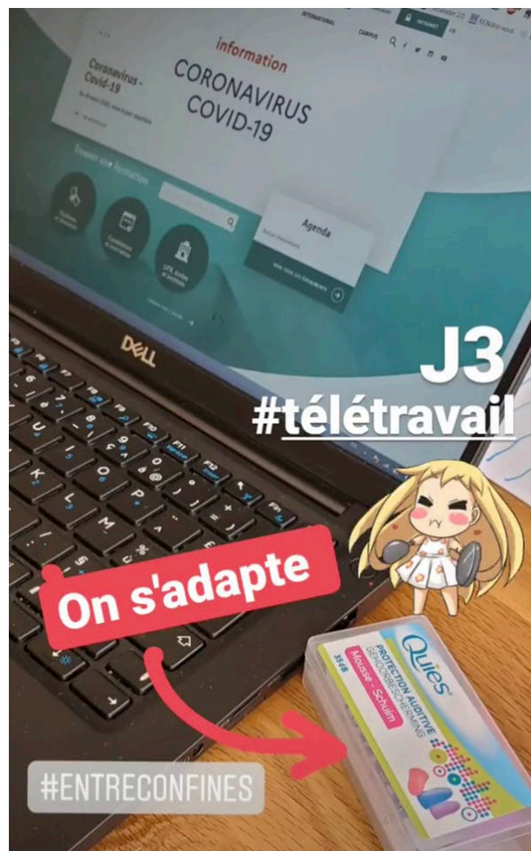
Les images échangées avec ses proches restent un bon moyen de maintenir le lien social. Franck Lacroix

🏠 famille maison télétravail organisation du travail coronavirus Covid-19 confinement