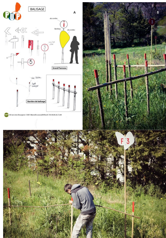
Figure 2: De l'ébauche à la réalisation, le projet de balisage issu d'une co-construction entre chercheurs, artistes et lycéens. (Crédit photo Estel Pierson, dessin collectif SAFI)

agricole autour du paysage, de la nature, de l'environnement et de la maréchalerie. Par la signature d'une convention de Chantier-École pour la formation à la gestion et à l'entretien du parc, le lycée des Calanques, les Lycéens participent à l'entretien et à l'aménagement du site. Un collectif d'artistes plasticiens intitulé du Sens, de l'Audace, de la Fantaisie et de l'Imagination (SAFI) accompagne également le programme dans la mise en œuvre des techniques respectueuses de l'environnement pour l'aménagement du site comme l'utilisation de matériaux naturels (osiers, bambou...) et de techniques de tressage pour la délimitation des parcelles. Ce collectif a également apporté son soutien dans la conception et la réalisation des éléments d'aménagement et l'encadrement des élèves du Lycée dans le cadre d'une Convention de Vie Lycéenne et Apprentie (outil éducatif de la région Provence-Alpes-Côte d'Azur) (Figure 2).