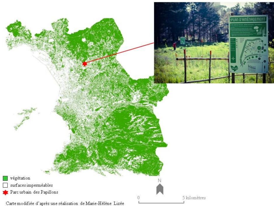
Figure 1 : Localisation du Parc Urbain des Papillons sur la commune de Marseille et photographie du site présentant le plan d'aménagement.