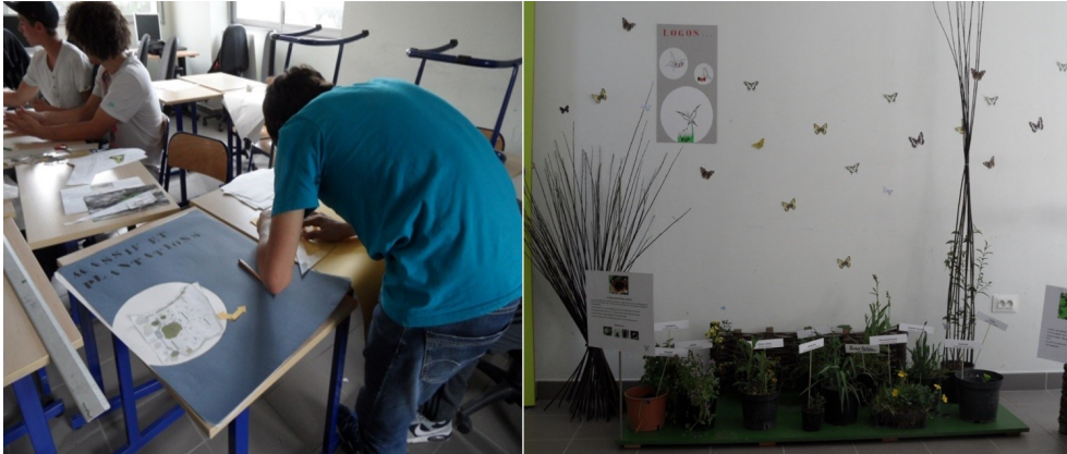
Figure 7 : Préparation d'une exposition par les lycéens présentée lors des journées porte ouverte en 2012 au Lycée agricole. Elle retrace la démarche du projet, ses objectifs ainsi que les échanges des lycéens avec les chercheurs et les artistes dans le cadre de leurs pratiques professionnelles.