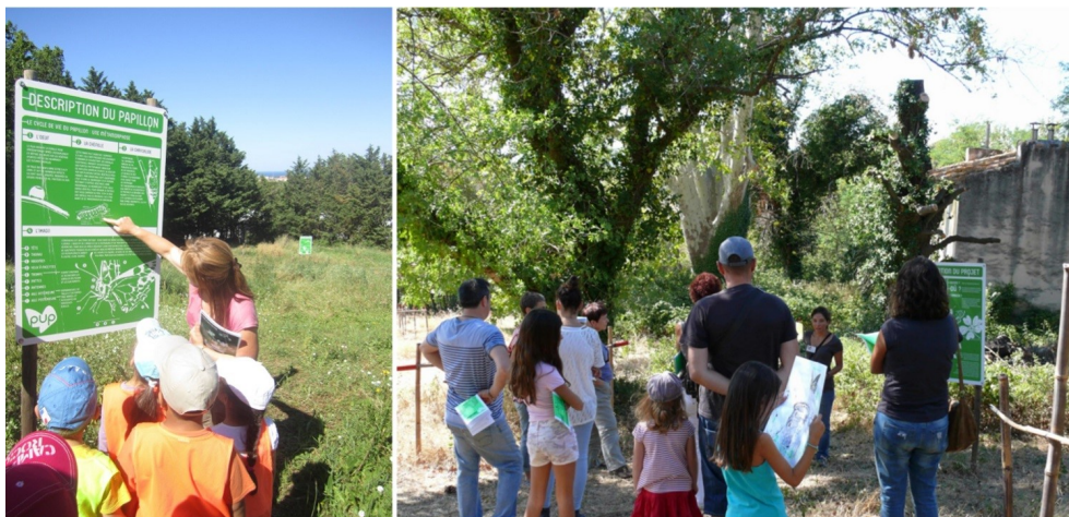
Figure 3 : Animations sur le parcours pédagogique par un enseignant-chercheur et un étudiant-moniteur auprès de scolaires (classe de CP) dans le cadre de la fête de la science 2013 et du grand public lors des journées du Patrimoine de 2013.