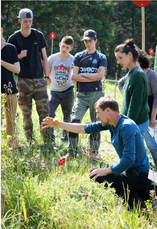
Figure 6 : Professeur du lycée agricole, artiste de l'association SAFI et lycéens échangent autour d'un massif : plantes utilisées, mise en valeur et techniques d'entretien.