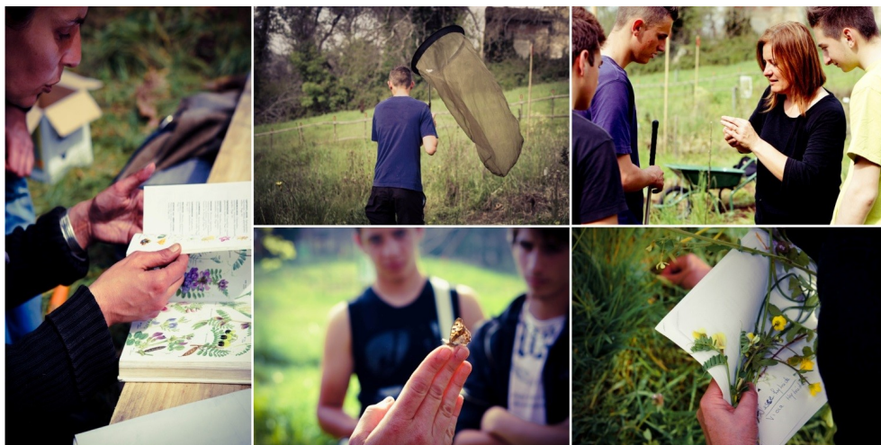
Figure 5 : Illustrations des échanges entre les chercheurs et les différents publics : explications de la démarche scientifique, de l'approche expérimentale ; apprentissage des techniques de suivis (flore, faune) ; mises en pratique et réalisation d'inventaires.