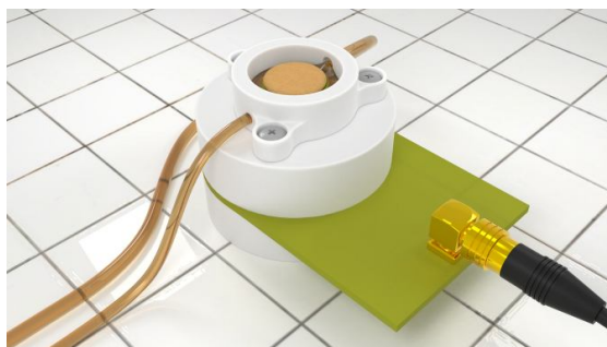
Figure 2. Cellule de mesure dédiée à l'étude microrhéologique d'explants de peau maintenus en survie