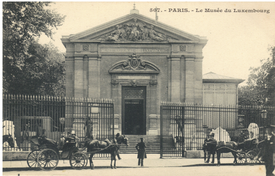
fig.1 : façade du musée du Luxembourg dans les années 1900

monumental, digne du rayonnement international du musée et de la capitale. En effet, le Musée du Luxembourg avait été d'abord abrité en 1818 dans les salles du palais du Luxembourg, sur les hauteurs de la rive sud de la Seine, avant d'être relogé provisoirement en 1886 dans l'ancienne orangerie du palais, transformée et agrandie aux frais du Sénat 4 . Le musée n'y disposait alors ni de réserves, ni d'ateliers, ni de services destinés au public, et encore moins d'un espace suffisant pour mettre en valeur la richesse de ses collections.