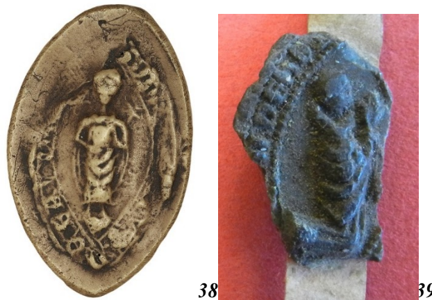
38. Sigillant en pied - sceau du doyen de chrétienté de Baudemont (32 mm/19 mm). Moulage, AnF, sc/N 2487.