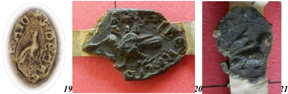
19. Oiseau - sceau du doyen de chrétienté de Bray (25 mm/15 mm). Moulage, AnF, sc/N 2489.

Les oiseaux à longue queue gravés sur quatre sceaux ne sont pas des volatiles quelconques ( fig. 19 à 21 ) : ils renvoient probablement à l'oiseau de Paradis, parfois identifié au Christ triomphant 36 . Sans doute peuvent-ils aussi être assimilés au paon, vu de profil, queue repliée.