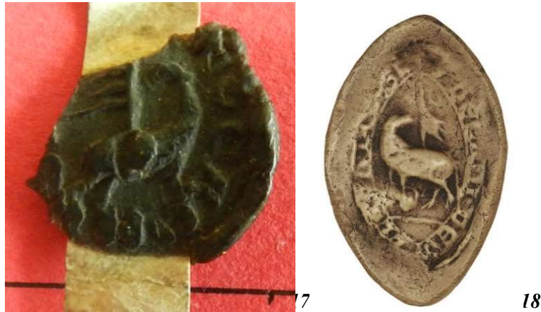
17. Agnus dei - sceau du chanoine-vicaire de la collégiale des Andelys (17 mm). AD Seine-Maritime, G 3658 acte n°12 (14 e position).