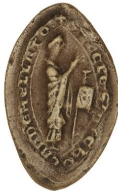
12. Prêtre consacrant - sceau de la paroisse St-Nicolas de Meulan (34 mm/22 mm). Moulage, AnF, sc/N 2472.

L'Eucharistie apparaît également sur deux sceaux montrant un prêtre consacrant. Ils appartiennent au doyen de chrétienté de Boscherville et à la paroisse Saint-Nicolas de Meulan ( fig. 12 ) 33 . Les poissons gravés sur les sceaux des paroisses de Barneville ( fig. 6 ) et Saint-Pierre de Juziers en Vexin ( fig. 13 ), et d'un troisième sigillant non identifié ( fig. 14 ) 34 , renvoient à cet aspect eucharistique. Bien sûr, la proximité de la mer en ces terres normandes rend la figuration de poissons plus fréquente que dans les provinces très terriennes du Laonnois et du Soissonnais où j'ai recensé un unique sceau halieutique au cours de mes recherches doctorales, sur un corpus de plus de 500 sceaux 35 .