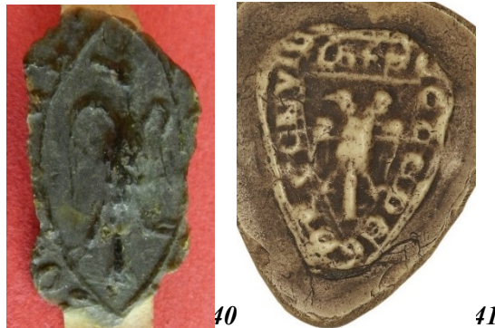
40. Aigle aux ailes éployée - sceau du prêtre de la paroisse Saints-Pierre-et-Paul de Poville ? (28 mm/17 mm ?). AD Seine-Maritime, G 3658 acte n°13 (11 e position).

Le quatrième groupe d'images rassemble 37 sceaux montrant des animaux. On passera sur le bestiaire chrétien évoqué plus haut. On compte également neuf oiseaux, dont quatre aigles qui peuvent évoquer saint Jean l'Évangéliste et une aigle à deux têtes, inscrite dans le sceau scutiforme de la paroisse de Gargenville ( fig. 40 et 41 ) 47 . Il arrive que les oiseaux figurent en ornements, notamment au milieu de rinceaux (6 occurrences). Nous avons vu qu'ils revêtent alors une dimension symbolique forte, tout comme les oiseaux de Paradis.