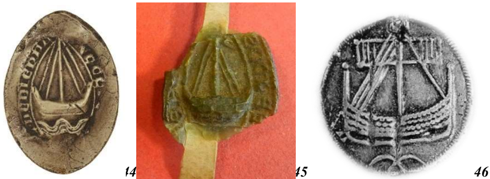
44. Nef - sceau d'une paroisse de Dieppe (30 mm/22 mm). Moulage, AnF, sc/N 2467.

Trois nefsrappellent la proximité du monde marin ( fig. 44 et 45 ) 54 . Comme pour les trois sceaux figurant des poissons, un seul sceau concerne une paroisse du littoral (Dieppe) 55 . Mais la Seine accueille nombre de navires, comme le rappellent les sceaux de Paris. L'aspect de ces bateaux est très proche de nefs figurant sur d'autres supports comme des monnaies scandinaves ( fig. 46 ). La nef du doyen de chrétienté de Brachy (?) semble s'inscrire dans un sceau piriforme, ce qui tranche dans le corpus.