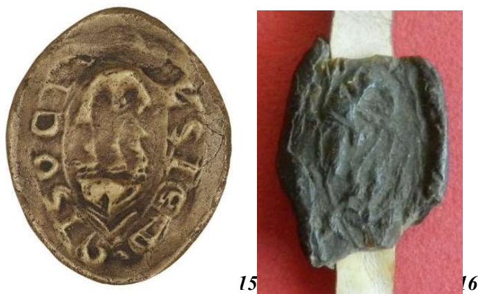
15. Piété - sceau de la paroisse Saint-Nicolas de Meulan (34 mm/22 mm).

Les Piétés qui figurent sur 7 sceaux sont une allusion eucharistique assurée : le pélican, qui s'ouvre le ventre afin de nourrir ses petits de son sang, est une allégorie très courante du sacrifice du Christ et surtout de l'Eucharistie ( fig. 15 et 16 ). De même, l' Agnus Dei qui apparaît à 10 reprises, notamment au contre-sceau du chapitre cathédral de Rouen, annonce le triomphe du Christ mais symbolise aussi l'Eucharistie ( fig. 17 et 18 ).