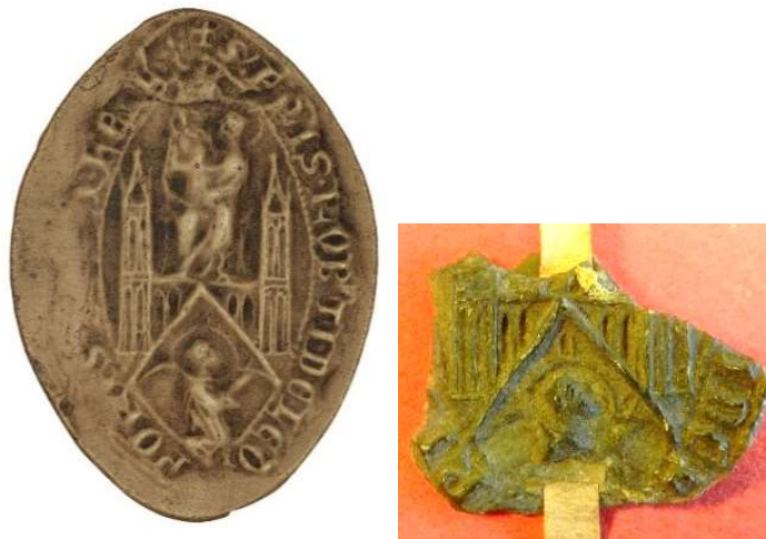
3. Sceau de Robert, prieur du Bec-Hellouin (36 mm/30 mm). Moulage de Demay (à gauche), état de l'empreinte en 2011 (à droite). Moulage, AnF, sc/N 2935. AD Seine-Maritime, G 3658 n°10 (32 e position).

On citera par exemple le grand sceau de Robert, prieur du Bec-Hellouin 16 , dont seul le tiers inférieur demeure aujourd'hui, nous privant d'une grande partie de la légende, devenue très lacunaire ( fig. 3 ) ; ou encore le sceau du doyen de chrétienté de Fauville, aujourd'hui détruit alors qu'image et légende sont encore largement lisibles sur le moulage réalisé par Demay ( fig. 4 ) 17 . Toutefois, l'aide de l'inventaire est à relativiser : Demay n'a recensé que 27 des 115 sceaux du dossier !