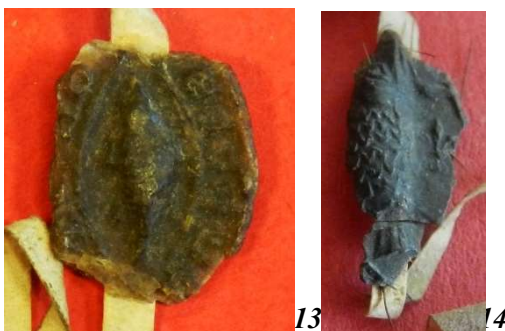
13. Poisson - sceau de la paroisse Saint-Pierre de Juziers (22 mm/16 mm).

AD Seine-Maritime, G 3658 acte n°9 (25 e position).