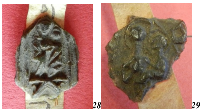
28. Vierge à l'Enfant et orant au sceau du recteur de Saint-Aubin-sur-Scie (25 mm ?/17 mm ?). AD Seine-Maritime, G 3658 acte n°13 (5 e position).