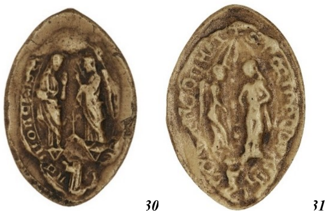
30. Annonciation - sceau du prieur de Saint-Nicaise de Gasny (41 mm ?/25 mm ?). Moulage, AnF, sc/N 3035.

Enfin la Vierge est évoquée par le biais de la fleur de lys à 9 reprises ( fig. 32 et 33 ). Le lys est plus particulièrement apprécié du clergé séculier.