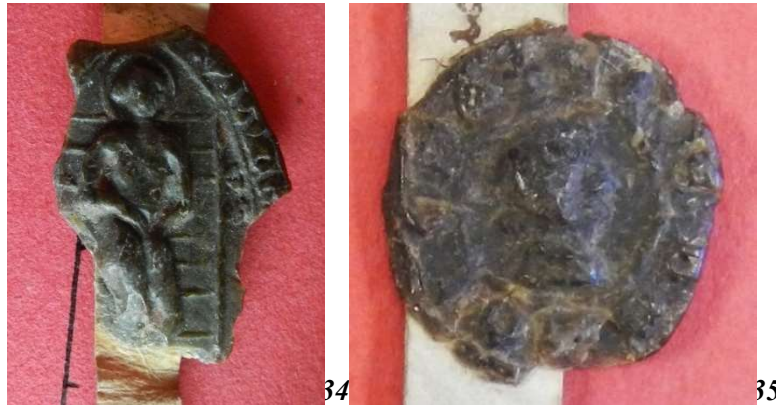
34. Saint Laurent martyrisé sur son grill - sceau du prieuré St-Laurent d'Envermeu ? (34 mm ?/22 mm ?). AD Seine-Maritime, G 3658 acte n°13 (9 e position).

La rareté des figures de saints semble, au premier abord, étonnante pour un corpus concernant le clergé. Or les images de saints étaient privilégiées sur les sceaux d'abbayes, de prieurés ou de chapitres, quasi-absents de notre corpus.