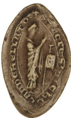
12. Prêtre consacrant - sceau de la paroisse St-Nicolas de Meulan (34 mm/22 mm). Moulage, AnF, sc/N 2472.

L'Eucharistie apparaît également sur deux sceaux montrant un prêtre consacrant. Ils appartiennent au doyen de chrétienté de Boscherville et à la paroisse Saint-Nicolas de Meulan ( fig. 12 ) 33 . Les poissons gravés sur les sceaux des paroisses de Barneville ( fig. 6 ) et Saint-Pierre de Juziers en Vexin ( fig. 13 ), et d'un troisième sigillant non identifié ( fig. 14 ) 34 , renvoient à cet aspect eucharistique. Bien sûr, la proximité de la mer en ces terres normandes rend la figuration de poissons plus fréquente que dans les provinces très terriennes du Laonnois et du Soissonnais où j'ai recensé un unique sceau halieutique au cours de mes recherches doctorales, sur un corpus de plus de 500 sceaux 35 .