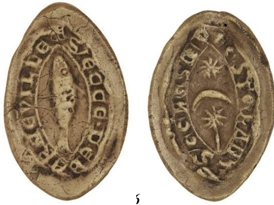
6. Sceau de la paroisse de Barneville, utilisé par le doyen de chrétienté de Pont-Audemer (26 mm / 15 mm). Moulage, AnF, sc/N 2466.

Les annonces de sceaux des eschatocoles ne nous sont d'aucune utilité : elles ne mentionnent que l'archevêque, son officialité et le chapitre cathédral. Quant aux protocoles des actes, ils en appellent à l'ensemble des abbés, prieurs, doyens, prêtres, chapelains, recteurs, sans les désigner nommément.