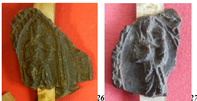
26. Vierge à l'Enfant en majesté - sceau aux causes du chapitre cathédral de Rouen (45 mm ?/28 mm ?). AD Seine-Maritime, G 3658 acte n°12 (2 e position).