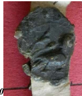
19. Oiseau - sceau du doyen de chrétienté de Bray (25 mm/15 mm). Moulage, AnF, sc/N 2489.