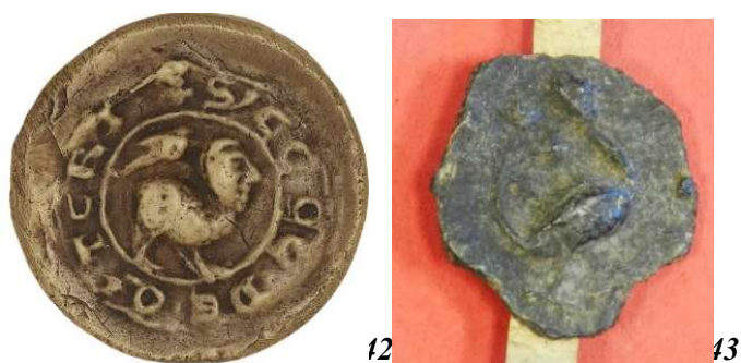
42. Grylle - sceau de la paroisse Saints-Pierre-et-Paul de Guitry (17 mm).

Parfois l’animal se fait fantastique : les grylles, monstres combinant une tête humaine sur un corps animal, apparaissent à trois reprises sur des sceaux de paroisses ou de prêtre (fig. 42 et 43) 49 . Dans l’Antiquité romaine, Pline l’Ancien décrivait déjà ces êtres auxquels on attribue le nom de grylle depuis l’époque moderne au moins. Chez les Anciens, les gemmes gravées d’un grylle avaient la réputation de protéger leur possesseur, de leur porter bonheur 50 . Faut-il voir dans nos trois grylles sigillaires un souvenir de cet usage ? Demay, dans son introduction à l’inventaire des sceaux de l’Artois consacré aux gemmes utilisées comme sceau, signale plusieurs intailles antiques portant ce motif 51 .