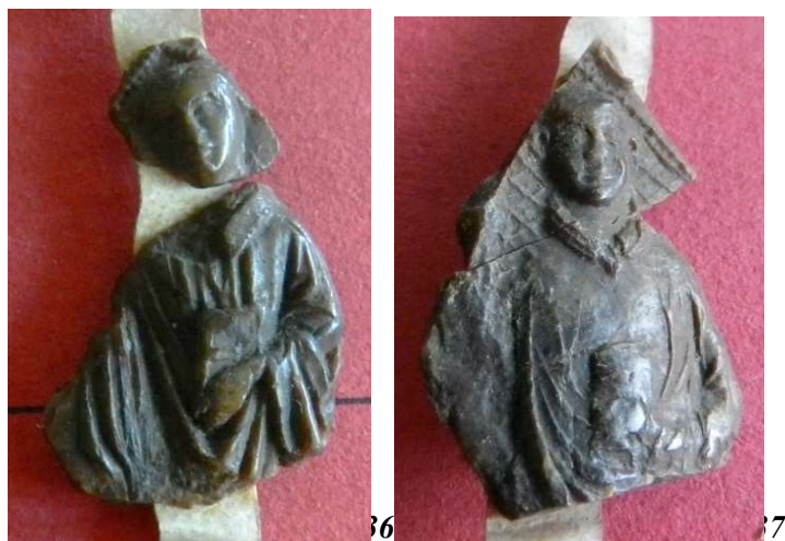
36. Abbé en pied inconnu (46 mm ?/24 mm ?).

On remarquera que le caractère fragmentaire de nombreux sceaux abbatiaux s'accompagne parfois d'une très bonne conservation du relief de l'image : se révèle alors la grande qualité de gravure des matrices de ces prélats, notamment dans le travail des drapés ( fig. 36 et 37 ).