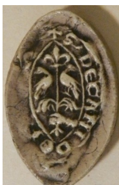
4. Sceau du doyen de chrétienté de Fauville (29 mm / 20 mm). Moulage réalisé par Demay sur une empreinte aujourd'hui perdue (AnF, sc/N 2492).

Quatre actes portent sur les queues de parchemin le titre et/ou les noms des sigillants, inscrits par différentes mains, probablement les sigillants eux-mêmes ( fig. 5 ). Certes, la plupart des mentions sont abrégées ou d'une calligraphie négligée, donc délicates à lire, et quelques titulatures ont été oubliées. Mais ces mentions sont essentielles aujourd'hui pour identifier les sigillants. Malheureusement, deux actes offrent des languettes de parchemin vierges de toute inscription.