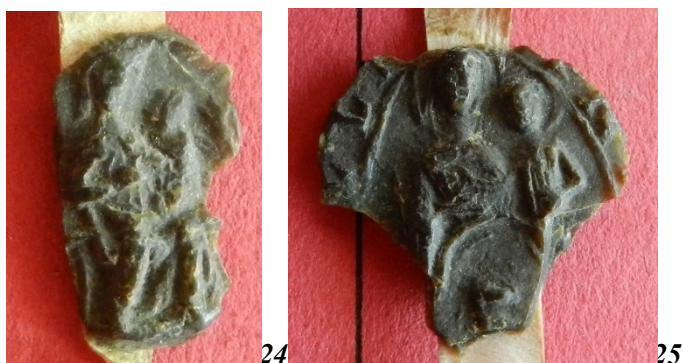
24. Vierge à l'Enfant en majesté - sceau d'une paroisse de Canville ? (20 mm ?). AD Seine-Maritime, G 3658 acte n°13 (10 e position).