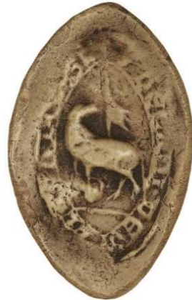
17. Agnus dei - sceau du chanoine-vicaire de la collégiale des Andelys (17 mm). AD Seine-Maritime, G 3658 acte n°12 (14 e position).