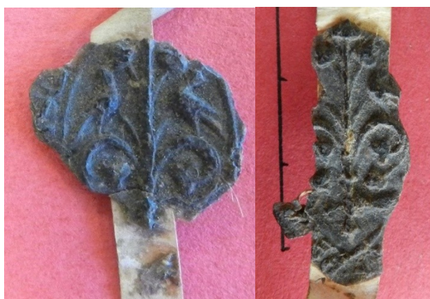
11. Empreintes issues de la matrice du sceau du recteur de la paroisse de Bacqueville, montrant un couple d'oiseau becquetant un rinceau tenu en bas par une main (30 mm ?/20 mm ?). AD Seine-Maritime, G 3658 acte n°10 (7 e position) à gauche, acte n°13 (7 e position) à droite.

Une paroisse de Pontoise – peut-être Notre-Dame – choisit une étonnante chèvre dressée sur ses pattes arrière pour attraper les feuilles d'un arbre 28 . Or la chèvre qui vaque sur les montagnes et broute les branches toujours plus hautes des arbres était une allégorie du Christ omniscient. Là encore, cette scène a priori pastorale offre un sens plus profond que saisissaient sans peine les ecclésiastiques qui firent graver la matrice.