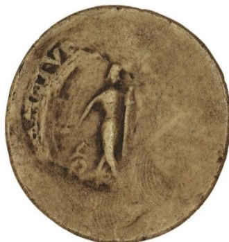
46. Empreinte d'une intaille médiévale gravée d'un guerrier armé d'un bouclier en amande et d'une épée, combattant un serpent (à gauche). Sceau du prieur des Deux-Amants (26 mm ?/23 mm ?). Moulage, AnF, sc/N 3003.

Enfin, deux intailles offrent des scènes particulières. L'une, médiévale, figure un combattant tourné de profil pour le prier des Deux-amants ( fig. 46 ) 56 . Ce sceau est remarquable dans la masse des empreintes en raison de son iconographie inhabituelle mais aussi de la couleur rouge utilisée pour l'une des deux empreintes conservées. Cette image, qui tranche dans le corpus, n'en est pas moins porteuse d'un message religieux : l'homme combat un serpent, comme le Christ qui affronte le Démon ou quelque saint saurochtone. L'autre intaille, difficile à lire du fait d'une cire brune, est très petite (10 mm probablement) 57 . Utilisée par un vicaire des Andelys 58 , elle pourrait être une gemme antique. Elle est gravée de trois personnages, bras levés, dans une scène au sens obscur 59 .