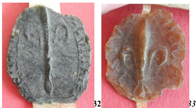
32. Fleur de lys - sceau d'un certain Jean (33 mm ?/25 mm). AD Seine-Maritime, G 3658 acte n°8 (1 re position).