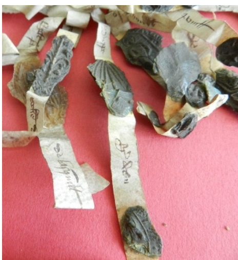
5. Exemple de languettes portant mention du sigillant et montrant de la pratique du sous-sceau (AD Seine-Maritime, G 3658 acte n°13).

Quatre actes portent sur les queues de parchemin le titre et/ou les noms des sigillants, inscrits par différentes mains, probablement les sigillants eux-mêmes ( fig. 5 ). Certes, la plupart des mentions sont abrégées ou d'une calligraphie négligée, donc délicates à lire, et quelques titulatures ont été oubliées. Mais ces mentions sont essentielles aujourd'hui pour identifier les sigillants. Malheureusement, deux actes offrent des languettes de parchemin vierges de toute inscription.