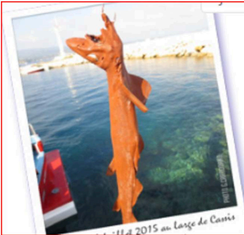
Figure 7. Squala pêché dans la fosse, remis aux autorités par les pêcheurs.