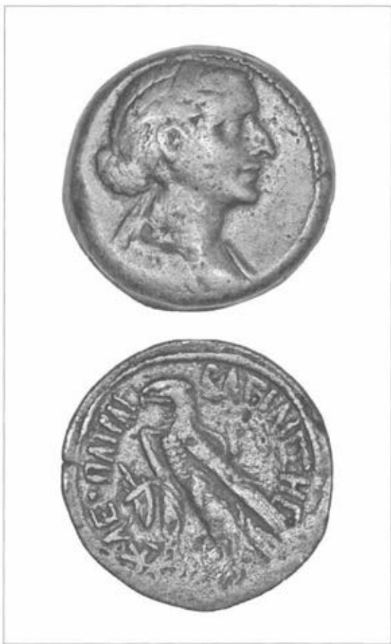
Fig. 2 : Monnaie au portrait de Cléopâtre valant 80 drachmes.

Autre preuve de l'usage monétaire autour de Thèbes, la découverte surprenante, il y a trois ans, d'un atelier monétaire dans l'enceinte même du temple de Karnak, plus précisément aux abords de la chapelle d'Osiris Ounnefer Neb-djefau