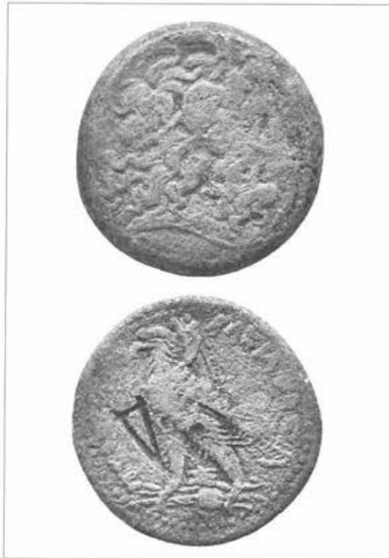
Fig. 4 : Monnaie du trésor de la porte bubastide à Karnak, avec contremarque « artisanale » à la corne d'abondance.