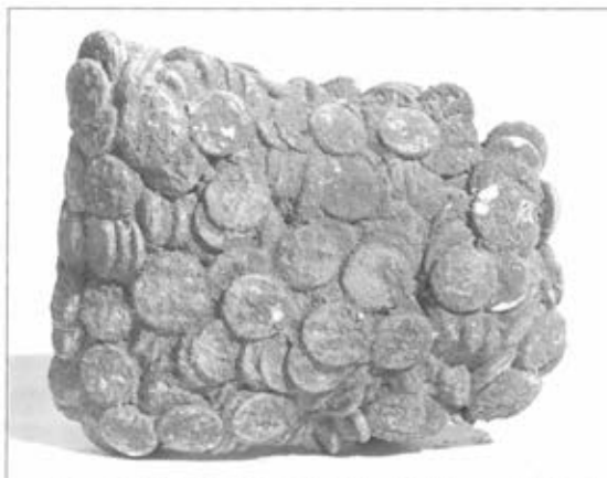
Fig. 1 : Trésor de monnaies de bronze trouvé près de l'enceinte de Nectanébo à Karnak [cf. A. Bellod, CFFETK].

Les trouvailles de monnaies d'argent ne sont pas plus fréquentes à la période suivante. Mais les monnaies de bronze continuent à circuler, ce qu'indiquent à la fois les trouvailles isolées, mais aussi les trésors, dont deux exemples ont été mis au jour lors de fouilles à Karnak datant respectivement du début du II e s. et de la seconde moitié du II e s.