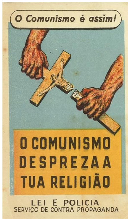
Ill.1 : « Le communisme est comme ça ! Le communisme méprise ta religion. Loi et Police. Service de contre propagande »